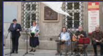
A szélleplezte tábla 8. és 11. oldal