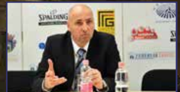
A vereség és a lemondás sokkja 13. oldal