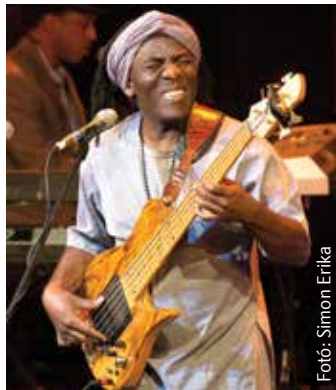
Richard Bona a basszusgitarát virtuóza, humorista és showman – ezért hagyott maradandó nyomot Fehérváron

Az afrikai származású világzenész a koncerten zenei tehetségét és humorát egyaránt megcsillogtatta, és kiváló zenészi együttjátéknak lehettek részesei a nézők. Bona gyakorlott showmanként kommunikált a közönséggel: a koncert végén az egész színház – a huszonéves diák, a középkorú üzletember magáról megfélekedve – egy emberként táncolt. Richard Bona négy évvel ezelőtt járt utoljára Magyarországon, szerencsére a magyar alapkezelésekről nem feledkezett el. Székesfehérvárról panaszkodva jegyezte meg, hogy lehetetlen kimondani a nevét. Nem Afrika ez vagy Kína, hogy ilyen bonyolult városnevek legyenek! –