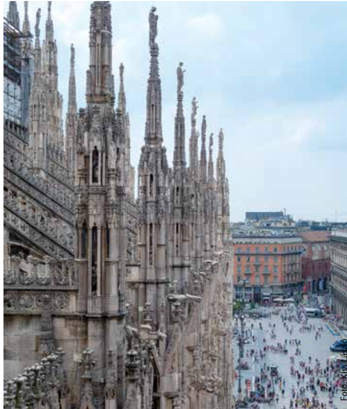
Őszel és télen az egzotikus helyek mellett az európai nagyvárosokba is szívesen látogatnak a turisták

Egyre inkább a repülő felé billen a mérleg, hiszen rengeteg időt meg lehet spórolni, akár egy napot is. Kényelmesebb Párizsba vagy Rómába repülővel menni, még akkor is, ha a