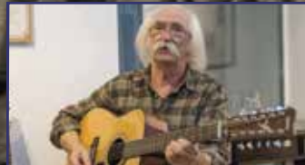
A 68-as úton 4. oldal