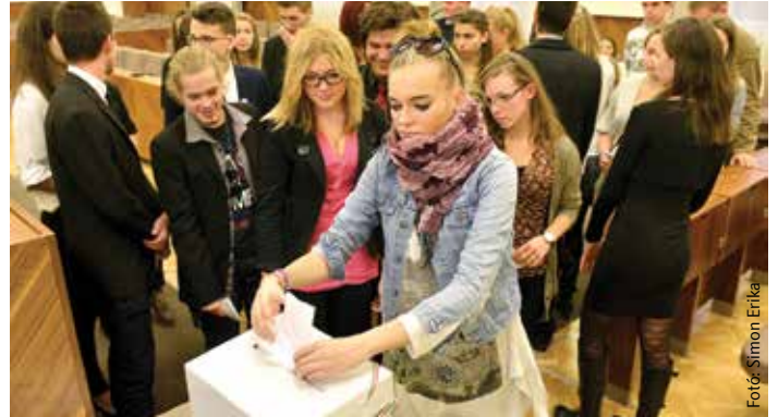
A Diáktanács tagsága titkos szavazással döntött az új elnökség tagjairól