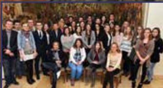
Új elnök a Diák Tanácsban 2. oldal