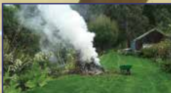
Avarégetési időszak 2. oldal