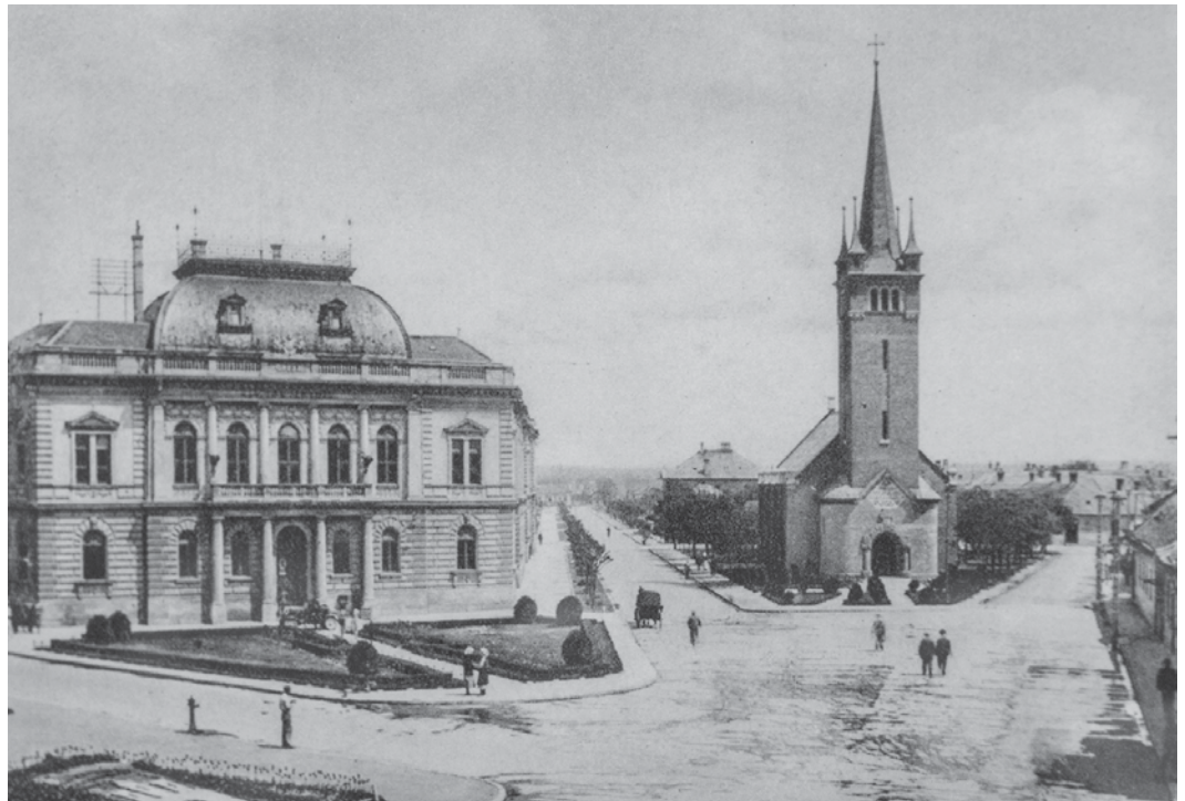
A Várkörút egykor...

Az „Új Belváros – Várkörút rehabilitációja” című pályázat keretein belül ötrészes tudományos sorozat indult el csütörtök délután a levéltárban. Az előadások különböző témában mutatják be a városvédő és városszépítő tevékenységet a dualizmus korában és a XX. század elején. Az egyes villaépületek és tulajdonosaik bemutatására is sor kerül majd. Érintik