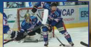
Tökéletes ötös 13. oldal