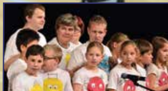
III. Integrált Regionális Kulturális Fesztivál 5. oldal