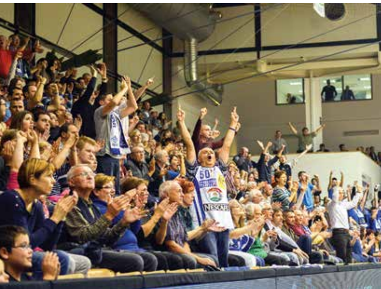
Győztes rangadón mindig kiváló a hangulat

Álmodtam. Álmomban vízparton heverésztem, 30 fokos hőségben, lángost májzolgatva. A hűs vízben bikinis lányok röplabdáztak, anyukák és apukák adtak úszóleckeiket csemetéiknek, a háttérben vitorlások küzdöttek a centiméterekkel a szélcsendes kánikulában. Jó volt, élveztem. Aztán felébredtem. Bár ne tettem volna, bárcsak még aludtam volna, álmomban a lángost egy hűsítő sörrel leöblítve! De nincs mese, felébredtem, és rájöttem: a nyár bizony messze szállt. Nincs hőség, nincsenek bikinis lányok, csak köd, hideg, szürkeség. Kávét kavargatva számba vettem a hévvége feladatait, és rögtön tudtam, lesz türelmem kivárni a következő nyarat. Lesz itt még hőség, lesz vízpart, lángos és bikinis lányok is. Én pedig addig sem unatkozom, mert ez a város nem hagyja, hogy a sportot szerető közönsége unatkozzon, tétlenkedjen. Péntek este az FKCs és az Alba meccse (de miért újra egy időben?), vasárnap Vidi-Honvéd. Van mit nézni akkor is, amikor bikinis lányokból épp hiánycikk van a ködös őszi-téli napokon. Kedves fehérváriak, kedves nyárimádó sorstársaim! Ne hagyjuk, hogy elnyomjon minket a szürkeség! Menjünk, szurkoljunk, élvezzük a városi sportélet adta lehetőségeket! Kezdjünk barátkozni a tél kínálatával, éltezzük meg a korcsolyákat, készítsük elő a túrabakancsokat, vessük bele magunkat ebben a nyálkás, nyúlós időben is a sport örömeibe aktív és szemlélődő résztvevőként egyaránt! Nyár lesz jövőre is. Én kívárom. Így már ki tudom várni!