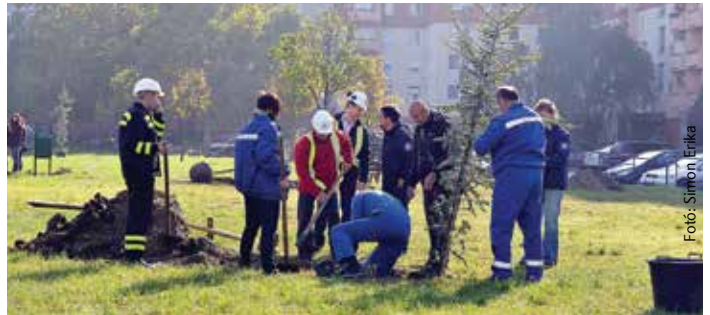
A faültetésben a Polgármesteri Hivatal dolgozói, az Alcoa és a Városgondnokság munkatársai valamint civil szervezetek is részt vettek

Fontos üzenetük van az ehhez hasonló programoknak – tette hozzá a város polgármestere. Egyrészt azért, mert az ipar fehérvári szereplői példát mutatnak a környezetvédelem és a társadalmi felelősségvállalás tekintetében, másrészt újabb közösségi tereket használhatnak a fehérváriak – hangsúlyozta Cser-Palkovics András.