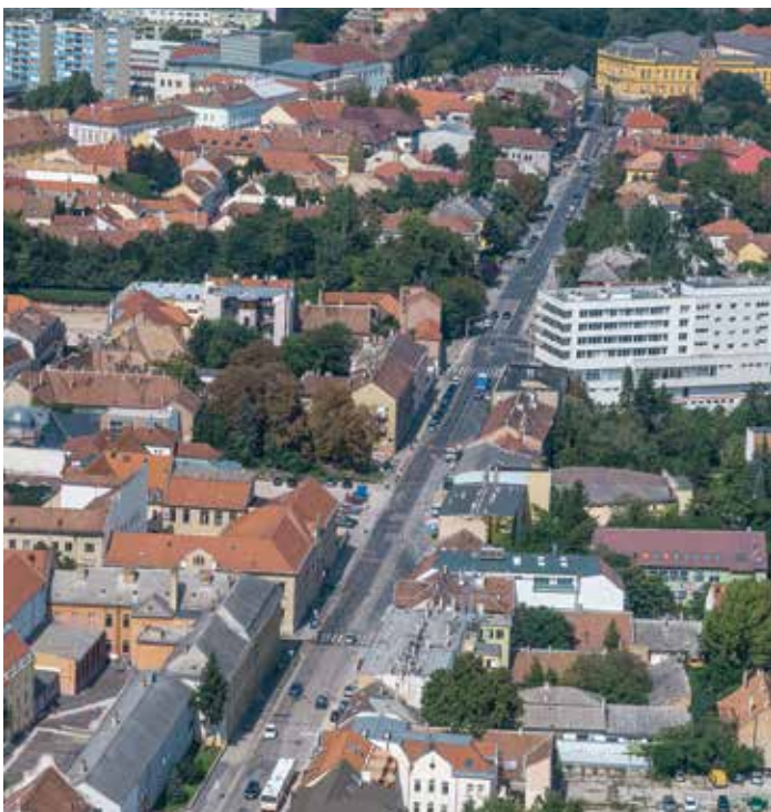
... és most

kinőtte magát, és megindult a városfejlődés. Szó esett a Várkörút alatt folyó csatorna vízrajzi hatásairól, hiszen az addigi vízesárkot kénytelenek voltak lefedni, megszüntetni, így vált a Várkörút a város egyik legfőbb utcájává. Az építész szemével követhettük végig, ahogy másfél évszázad alatt mindkét oldalon beépült az utca. Az előadások novemberben és a következő évben is folytatódnak.