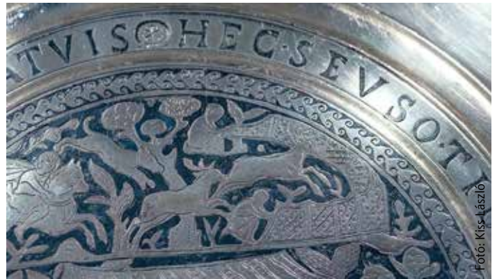
Seuso kedd: november 4-én a rejtélyek nyomába erednek a Csók István Képtárban

vendégei olyan szakemberek, akik eredetileg részt vettek a kutatásban: újságírók, a Seuso-kincsek volt miniszteri biztosa és a szabadbattyáni ásatás vezetője is meghívottja a programnak. A moderátor Tihanyi Tamás lesz. A kerekasztal-beszélgetést a Fehérvár Televízió felvételről közvetíti: november 6-án, csütörtökön 16 óra 30 perctől valamint november 8-án, szombaton 20 óra 35 perctől tekinthetik meg az érdeklődők.