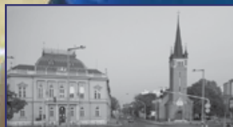
A Várkörút egykor és most 9. oldal