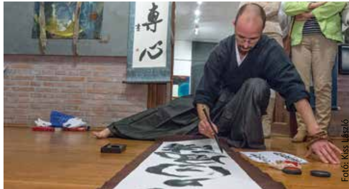
Japán kalligráfia – azaz az ecset útja

héten. Az előadás „A teázás szokásától a félelmetes sárkányokig - Amit tudni illik a keleti porcelánokról” című kiállításához kapcsolódott. Az előadást performansz követte, majd a közös gyakorlás során mindenki maga is kipróbálhatta a japán kalligráfia művészetét. Így gyakorlatilag testközelből érthette meg mindenki azt az üzenetet, amit a kalligráfia sugall: azaz, hogy tapasztalat útján kevésbé lehet elsajátítani ezt a művészetet, inkább az érzelmekre kell hagyatkozni. A kalligráfia nem tudatos erőfeszítés által születik.