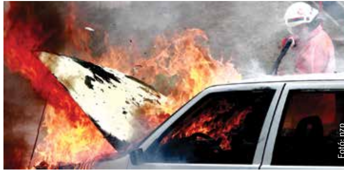
A közvetlen riasztással forintmilliók és emberi életek menthetők meg nem várt helyzetekben