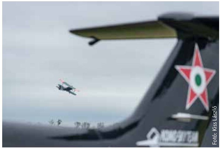
Repülő gépcsodák földön és égen