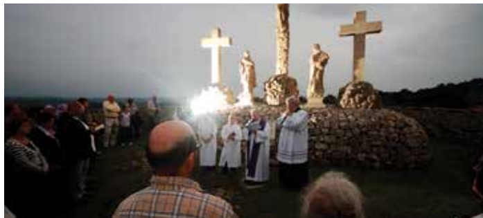
A zarándoklati megtisztulás végső állomása a Krisztus-kereszt

A Vértes és a Bakony ölelésében található települést már a IX. században szakrális tisztelet övezte szent kútja miatt. Szent István a Szűzanya tiszteletére kápolnát építtetett a Kálváriahegy tövébe, ahová fiával, Szent Imrével rendszeresen jártak.