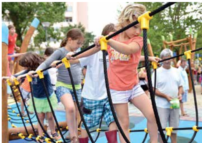
A mászással javulhat a szem-kéz és a szem-láb koordináció

azáltal, hogy a megszokott magassági szint fölé emeli a gyereket. A jó térészlelés a jobb-balkezesség és az oldaliság kialakulásához szükséges, ami majd fontos lesz az íráshoz az