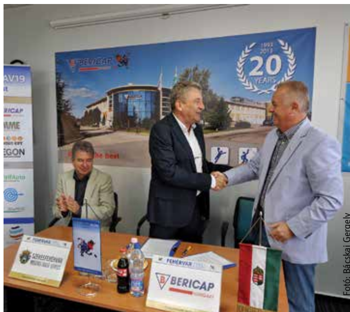
Az együttműködés folytatódik

A csapat pedig újabb két edzőmeccsel hangolt, a Volán csütörtökön és pénteken is öt gólt ütve verte a szlovák Gyetva együttesét, előbb egyet, majd hármat kapva.