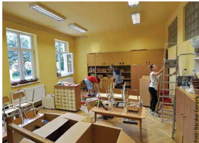
Az óvodai dolgozók a felújítás utáni takarításban, pakolásban segítettek, de az ovis gyerekek szülei is kivették a részüket a munkából