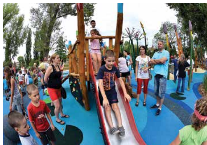
A csúszdán jól fejleszthető a térészlelés

A legtöbb játszóeszköz a parkban a térészlelést fejleszti