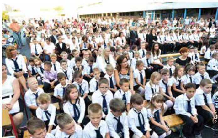
A tanévnyitót az iskola előtti téren, a felújított aszfaltburkolaton tartották meg

Ebben a tanévben ezerhetvenhat elsős kisdíák kezdi meg tanulmányait városunkban az állami fenntartású intézményekben. Székesfehérvár polgármestere elmondta, hogy az Ybl-programnak köszönhetően egyre több forrás jut az oktatási