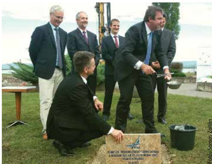
Államtitkári kézben a kőműves szerszámok: alapkövetétel Agárdon

Az elmúlt negyven esztendő fotóit és a jelenlegi telep helyszínrajzát zárták be abba az időkapuszulába, amely az új épület alapköve mellett kapott helyet. Az ünnepélyes mozzanatot a bontás végét és az építés kezdetét jelenti a Velencei-tavi Vízi Sportiskolában. A felújításnak köszönhetően a létesítmény sportközponti funkciója rehabilitációs tevékenységgel bővül. Soltész Miklós, az Emberi Erőforrások Minisztériumának államtitkára ennek kapcsán azt mondta, egyedülálló lehetőséghez, európai színvonalú szolgál-