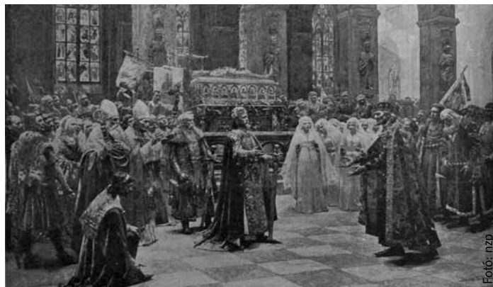
Bihari Sándor festményén Zsigmond király Váradon, Szent László sírjánál fogadja Ulászló lengyel királyt az egyházfők és főurak kíséretében

nyájas bőkezűsége vagy inkább esztelen pazarlása, a lovagkori eszmék életben tartása – keresztes hadjárat, hitvédelem, az egyház egységének szolgálata – a pompás udvartartás, a lovagi tornák kedvtelése, Szent László király tisztelete, lovagi gondolkodásra vallanak. Politikájában és erkölcsében viszont már a reneszánsz morál mutatkozott meg. A csillogó tehetség csapongó fantáziával, szeszélyességgel, szertelen indulattal, határtalan könnyelműséggel és kegyetlenséggel párosult. Hiába volt Zsigmond királyunk fején öt korona, megnyugvásra sehol nem talált. Törékeny hatalmának megvédése állandó lélekölő elfoglaltságot jelentett. Tetejében még a