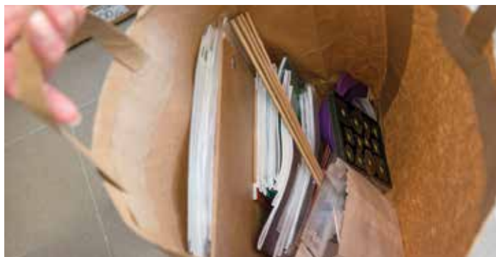
Az iskolakezdők csomagjának kiválasztásakor is érdemes a minőséget szem előtt tartani