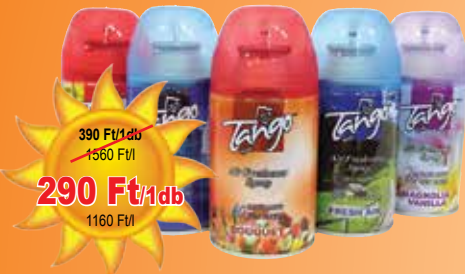
Tango légfrissítő utántöltő 250 ml (automata készülékekbe kompatibilis)

390 Ft/1db 1560 Ft/l 290 Ft/1db 1160 Ft/l