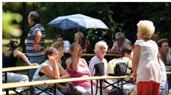
Medárd után végre megpihent az eső, csak a Nap miatt kellett az ernyő