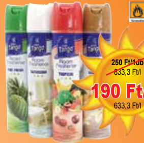
Tango légrfrissítő 300 ml

250 Ft/1db 633,3 Ft/l 190 Ft/1db 633,3 Ft/l