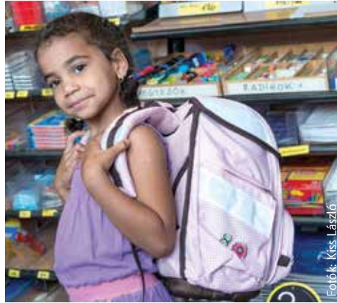
Fényvisszaverő csíkok, párnázott vállrész, sok zseb, aranyos minta, vidám színek – a megfelelő iskolatáska

védi a porontyok hátát, pántja párnázott, hogy a tankönyve k súlya ne bántsa a diákok vállát. A sok praktikus zseb, a keményített alj nemcsak a kicsik dolgát könnyíti meg. Egy jó minőségű iskolatáska akár négy éven keresztül kiszolgálja tulajdonosát.