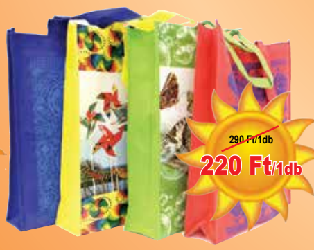
Bevásárló táska többféle

330 Ft/1db 330 Ft/1kg 290 Ft/1db 290 Ft/1kg