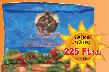
Pásztor ételízestítő 200 g

250 Ft/1db 1200 Ft/kg 225 Ft/1db 1125 Ft/kg