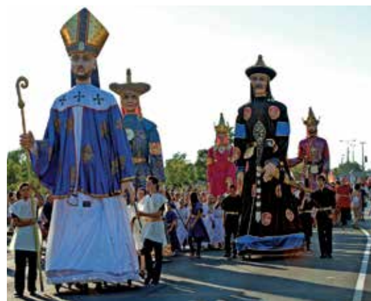
Az óriásbábokat diákok készítették

23.00 óra | Szent István-napi tűzijáték a Palotavárosi tavaknál.