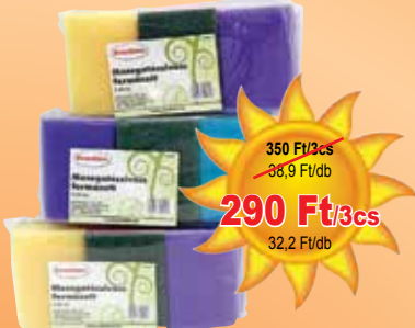
Formázott mosogatószivacs 3 db-os

350 Ft/3cs 38,9 Ft/db 290 Ft/3cs 32,2 Ft/db