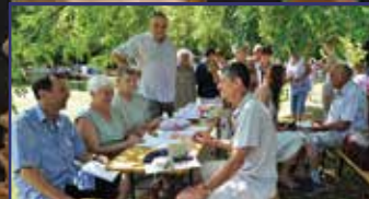
Szomszédoltak a város déli fertályán 12. oldal