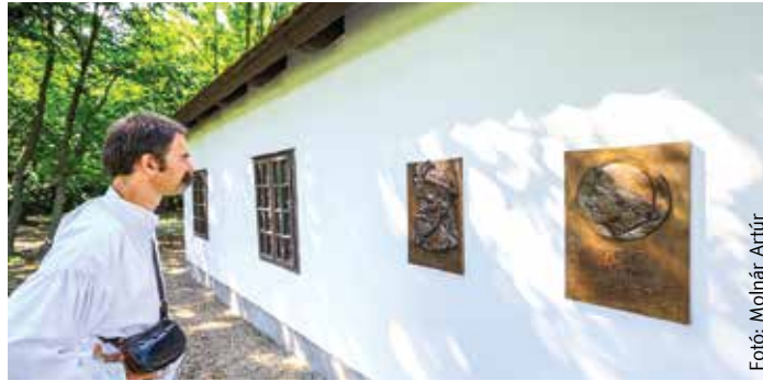
A Gárdonyi Emlékház fala a megyei poéták emlékét őrzi

A különleges emlékfal láttán az irodalomkedvelők és a lokálpatrióták is megnyugodhattak. Gárdonyi Géza – a Láthatatlan ember születésének 151. évfordulóján – bizonyára a maga jovialis módján, jóleső érzésekkel tekint le az ötletadókra. Rétvári Bence, az Emberi Erőforrások Minisztériumának Parlamenti államtitkára avatósbeszédében példaértékűnek nevezte, hogy egy ilyen jelentős emlékművet gondos munkával és össze-