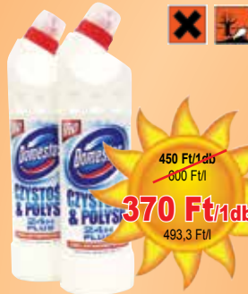
Domestos fehérítő 750 ml

450 Ft/1db 600 Ft/l 370 Ft/1db 493,3 Ft/l