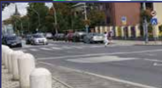
Ősszel kezdődik a Várkörút felújítása 2. oldal