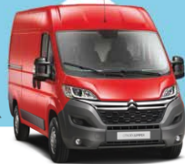
A Citroën Jumper, a világhírű.