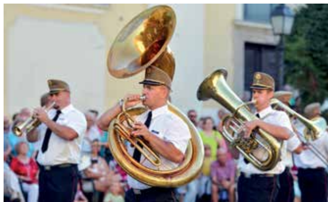
Kicsit koncert, kicsit színház: a katonák emberibb arcát ismerhetjük meg

A házigazda székesfehérvári katonazenekar mellett a vendég veszprémi, debreceni és kaposvári zenekar 15.30 órától a Zichy Ligetben, az Alba Plaza előtti téren, illetve a Szent István téren már ízelítőt ad zenei sokszínűségéből. Ezekről a helyszínekről vonulnak át a Városház térre, ahol 16.00 órakor hangzik fel a nyitány. Ezt követi a katonazenekarok egyéni koncertje, majd 16.50 órától a száz egyenruhás közösen muzsikál, show elemekkel tarkított pazar előadással szórakoztatva a közönséget.