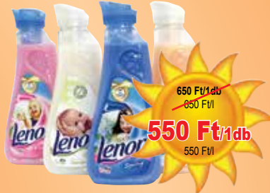
Lenor öblítő koncentrátum 1 l