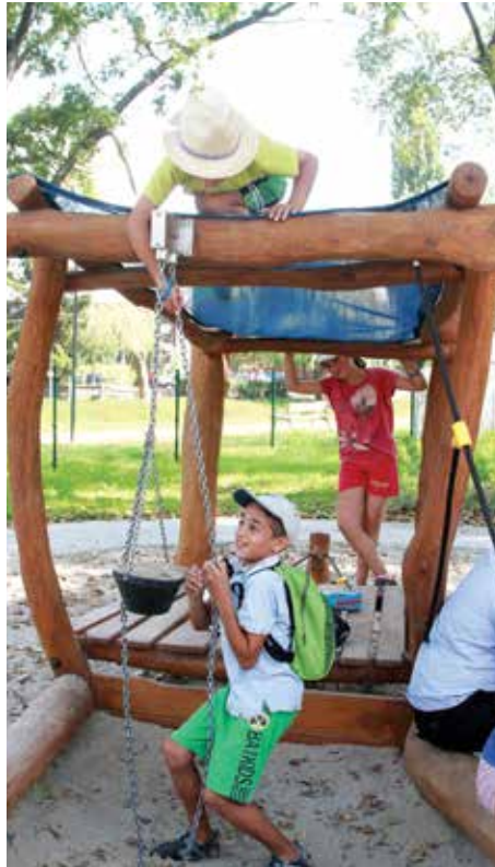
A Koronás Park mégiscsak koronás, még a székely legényeknek is