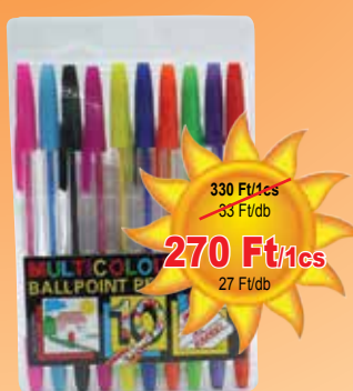
Toll 10 db-os

190 Ft/3cs 0,8 Ft/db 200 Ft/4cs 0,6 Ft/db