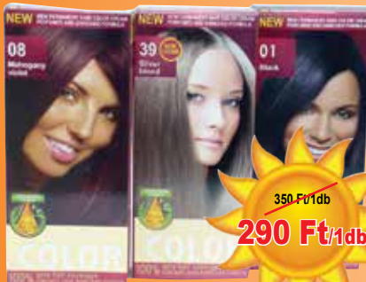
Aroma Color hajfesték

290 Ft/1db 580 Ft/kg 220 Ft/1db 440 Ft/kg