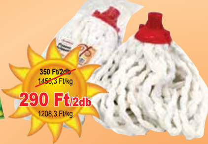
Pamut felmosófej 120 g

350 Ft/2db 1456,3 Ft/kg 290 Ft/2db 1208,3 Ft/kg