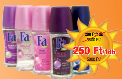
Fa roll desodor 50 ml

290 Ft/1db 5800 Ft/l 250 Ft/1db 5000 Ft/l