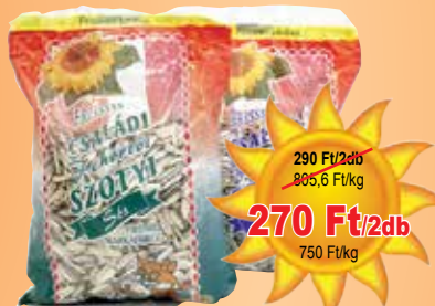
Napraforgó 180 g sós, sótlan

290 Ft/2db 805,6 Ft/kg 270 Ft/2db 750 Ft/kg