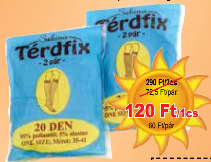
Térdfix 2 pár/csomag

290 Ft/2cs 72,5 Ft/pár 120 Ft/1cs 60 Ft/pár