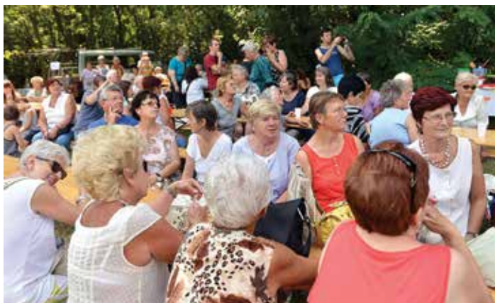
A mulatozás, kikapcsolódás mellett elfért az egészségügyi szűrés, a gyors vizsgálat is