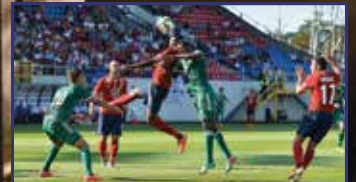
Az ETO is kipipálva – hibátlan a Vidi 31. oldal