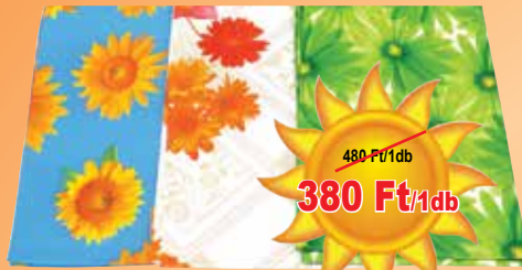
Viaszos asztalterítő 100x140 cm

290 Ft/4db 72,5 Ft/db 250 Ft/4db 62,5 Ft/db