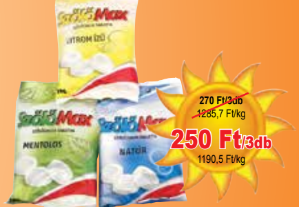
Szőlőcukor 70 g

270 Ft/3db 1285,7 Ft/kg 250 Ft/3db 1190,5 Ft/kg