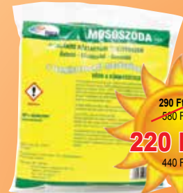
Mosószóda 500 g

290 Ft/1db 580 Ft/kg 220 Ft/1db 440 Ft/kg