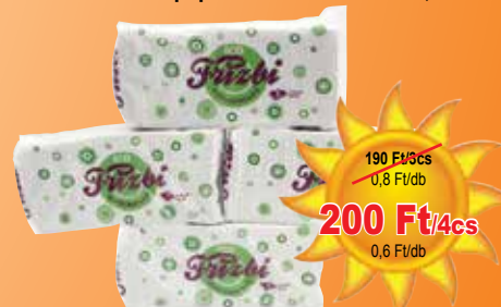
Frizbi Eco papírzsebkendő 80 db-os, 2 réteg.

190 Ft/3cs 0,8 Ft/db 200 Ft/4cs 0,6 Ft/db