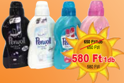
Perwoil folyékony mosószer 1 l

250 Ft/1db 633,3 Ft/l 190 Ft/1db 633,3 Ft/l