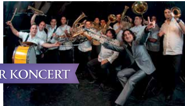
Az igazi örömenélők: Boban & Marko Marković Orkestar

A Kusturica filmekből világszerte ismertté vált rézfúvós zenekar virtuóz előadómódjával megkerülhetetlen együttese a balkáni gypsy rézfúvós vonulatnak.