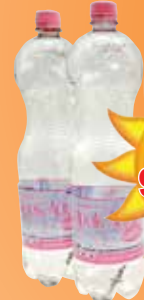
Alpok Aqua lúgos forrásvíz 1,5 l mentes

350 Ft/1db 200 Ft/l 290 Ft/1db 165,7 Ft/l