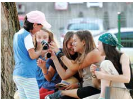
Gyűlnek az anyaországi élmények, amikről a képek árulkodnak majd

A csángószékelyek között többen is akadnak, akik még két héttel ezelőtt házigazdái voltak a fehérvári verstáboros fiataloknak. A negyven fős társaság meglátogatta a ciszterci gimnáziumot, majd a városházán csodálták rá őszinte szeretettel Szent István király hagyatékára. A csángó fiatalok a Koronás Parkban játszották ki magukat, majd délután szemtanúi lehettek a Fehérvár Televízió stúdiómun-