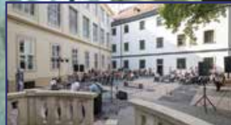
Megújult a múzeum díszudvara 6. oldal