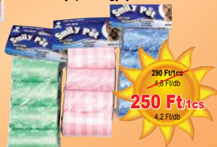
Kutyapizsok-gyűjtő zsák 3x20 db-os

290 Ft/1cs 4,8 Ft/db 250 Ft/1cs 4,2 Ft/db