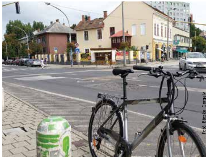
A Várkörút mindkét oldalán lesz kerékpárút, ezzel sokkal biztonságosabbá válik a biciklisek közlekedése

A pályázat száz százalékos támogatási intenzitású, de az önkormányzat húszmillió forintos saját forrást is biztosít a többlet műszaki tartalom megvalósítására. Emellett már ezekben a hetekben is zajlik egy több mint nyolcvanmillió forintos fejlesztés, a Rákóczi úti ivóvízvezeték cseréje, ami önkormányzati forrásból valósul meg, és szintén a Várkörút felújításához kapcsolódik. A korábbi Belváros-rehabilitáció folytatása a nemrégiben átadott Koronás Park projekttel és a kormányhatározattal elindí-