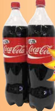
Coca-cola 1,75 l

350 Ft/1db 200 Ft/l 290 Ft/1db 165,7 Ft/l