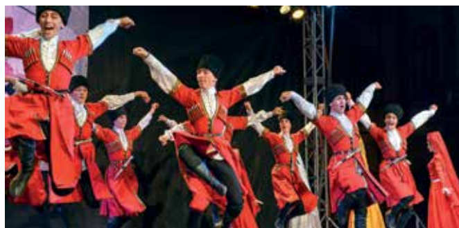
Idén Oroszországból, és Ciprusról is érkeznek csoportok

Augusztus 20-án a résztvevő táncgyűttesek 19.00 órakor indulnak a Malom utcai Táncházról a Fő utcán át a Városház térre. A Nyitó gála 20.00 órakor kezdődik a téren felállított színpadon. A Táncházban augusztus 21. és 24. között minden nap 15.00 órától gyermekprogramok lesznek; 18.00 és 21.00 óra között táncbemutatók zajlanak a Városház tér színpadán, majd a Táncházban közelebről lehet megismerkedni a táncgyűttesekkel. A fesztivál augusztus 24-én vasárnap zárul: 19.00 órakor az együttesek felvonulnak a Táncházról a Városház térére, majd a 20.00 órakor kezdődik a Záró gála.