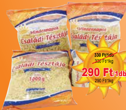
Minden napok tésztaja száraztészta 1kg

330 Ft/1db 330 Ft/1kg 290 Ft/1db 290 Ft/1kg