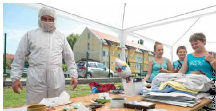
Winchesterek, szakfanderek és egyéb, a hajdani gyárban használt eszközök rögtönzött tárlata a Bregyóban