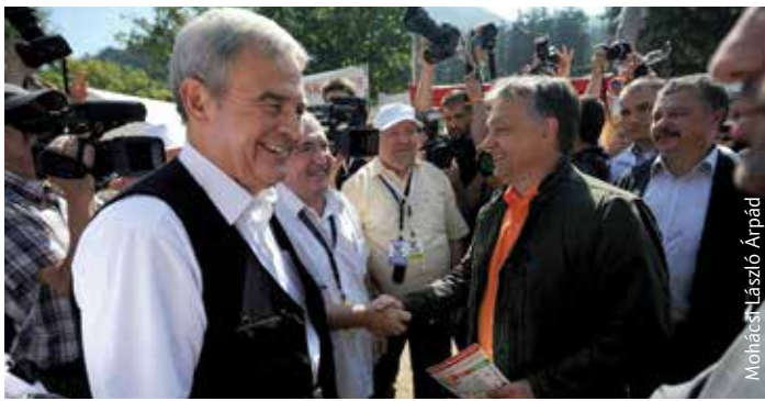
Tökés László és Orbán Viktor látogatására az idén is számíthatnak a táborozók

Átmenet a diktatúrából a demokráciába – ezzel a címmel