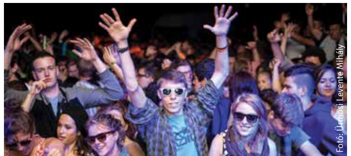
A komoly és tartalmas nappalokat a legnevesebb zenekarok fellépései követik a történelmi Magyarország területéről. A koncertek után indul a buli a Csűrben, ami általában csak reggel hat körül kezd kifulladásig.

nyújt tartalmas és igényes nyári szórakozást immár negyedszázada, komoly politikai események helyszíne is: évről-évre megfordulnak itt a vezető román és magyar politikusok, utóbbiak a határ mindkét oldaláról.