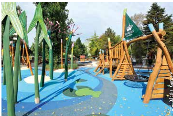
A Koronás Park használata ingyenes, fizetős szolgáltatás csak az épületen belül lesz

A cél az volt, hogy a terület rehabilitációja szolgálja a gyerekek