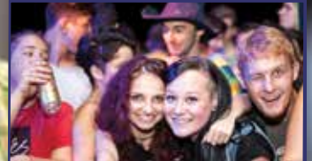
A medve nem játékl! 9. oldal