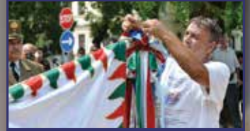
Emlékezés a 17-es gyalog- ezredre 2. oldal