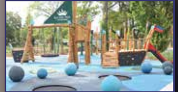
Királyi gyerekparadicsom 3. oldal