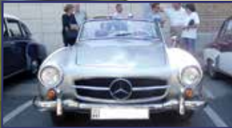
Időutazás veteránok volánjánál 8. oldal