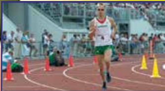
Egy eb az EB negatív hőse, de a férfiak bearanyozták a hétvégét 15. oldal