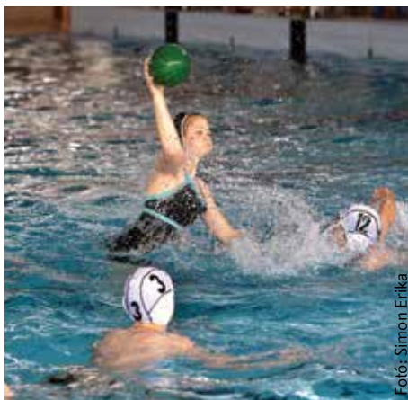
Lányok, fiúk, póló: nő a bázis

Ilyen vonzeró a magyar válogatott egy-egy meccse: a férfiak már többször játszottak a