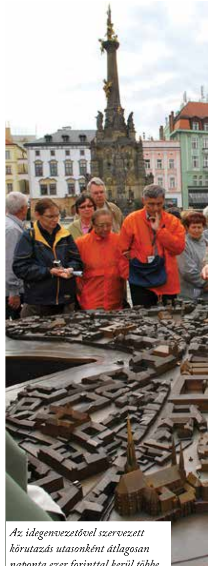
Az idegenvezetővel szervezett körutazás utasonként átlagosan naponta ezer forinttal kerül többé

Ezeknél a körutaknál a turistáknak nem kell utánanézni a nevezetességeknek vagy a szervezéssel bíbelődni. Csupán figyelniük, követniük kell az idegenvezetőt, és a legnagyobb kényelemben élvezni a látnivalókat.