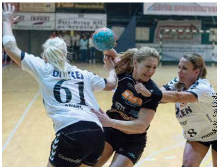
Hatalmas csatában bukta el az FKC az elődöntőt

Nem sokon múlt, hogy most arról írjunk: 2005 után ismét EHF-Kupa döntőt játszik a Fehérvár KC. Csak néhány másodpercen és néhány végzetes döntésen. Pedig annyi mindent kibírt az FKC a dán Esbjerg elleni visszavágón. Mindenki tudta, hogy kemény lesz, pokolian kemény, hiszen kézilabdában az egygólos előny nem előny. Mindkét csapat így is állt neki a meccsnek, az elmondottak alapján az első meccshez képest talán kicsit gyorsabban és keményebben játszott a dán bajnokság legjobb négy együttese közé a héten bejutó Esbjerg. De ez sem zavarta a fehérvári lányokat, mentek, hajtottak keményen. A csapat elbírt, hogy a vendégek szinte rendre másodperceken belül gólt szereztek a középköz-