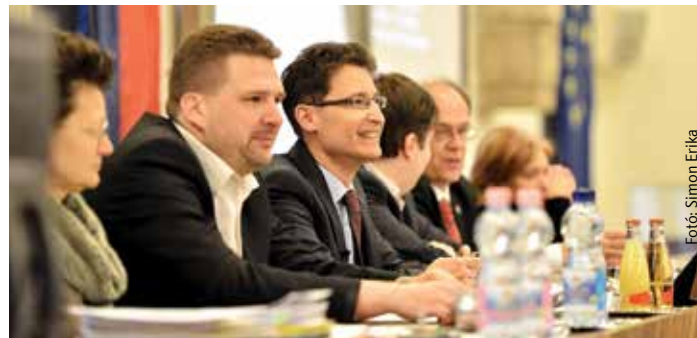
Harminc óvodai vizesblokkot újítanak fel az idén

Székesfehérvár önkormányzata ezt az összeget közel 28 millió forintra egészítette ki, így ebben az évben összesen mintegy harminc óvodai vizesblokk újulhat meg a KÉPES programnak köszönhetően. Tovább folytatódhat a Bregyóközi Sportcentrum megújulása is. Csütörtöki közgyűlésén arról döntött a testület, hogy részt vesz az MLSZ által meghirdetett pályázat pályázaton, melynek keretében a Bregyóban lévő régi, aszfaltos kézilabda pályát válthatja ki egy új műfüves pályára.