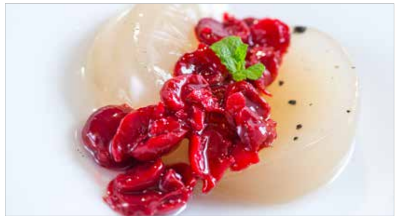
A meggy fanyarsága jól kiemeli a mák és a vanília édességét

edényben lassú tűzön az expressz zselatinnal öt perc alatt csomómentesre keverjük. Fontos: csak melegítjük, nem forraljuk! A végeredményt poharakba töltjük. Hagyjuk kihűlni, majd legalább négy órára, de inkább egész éjszakára hűtőbe tesszük. Végül nekiállhatunk a meggyöntetnek! Ez sem nehéz művelet: a kimagozott meggyet egy lábasban elkezdjük főzni. Eppen csak annyi vizet csurgassunk hozzá, amennyi a gyümölcsöket ellepi. Amikor már rottyog, keverjük el benne az étkezési keményítőt. Pár perc alatt az öntet szépen besűrűsödik. Ízlés szerint lehet ebbe is cukrot tenni, attól függően, milyen a meggy. A panna cottát lehet tányéron vagy pohárban is tálalni. Ha a tányér mellett döntünk, akkor egy kis tálba forró vizet öntünk. Ebbe helyezzük bele óvatosan a poharat. Pár percig állni hagyjuk. Majd egy gyors és laza mozdulattal a poharat a tányérra fordítjuk. A pohár tetejét addig ütögetjük, hogy a panna cotta kicsúszson belőle. A halom tetejére bőven rakunk a meggyöntetből, majd egy szál mentalevéllel díszítjük.