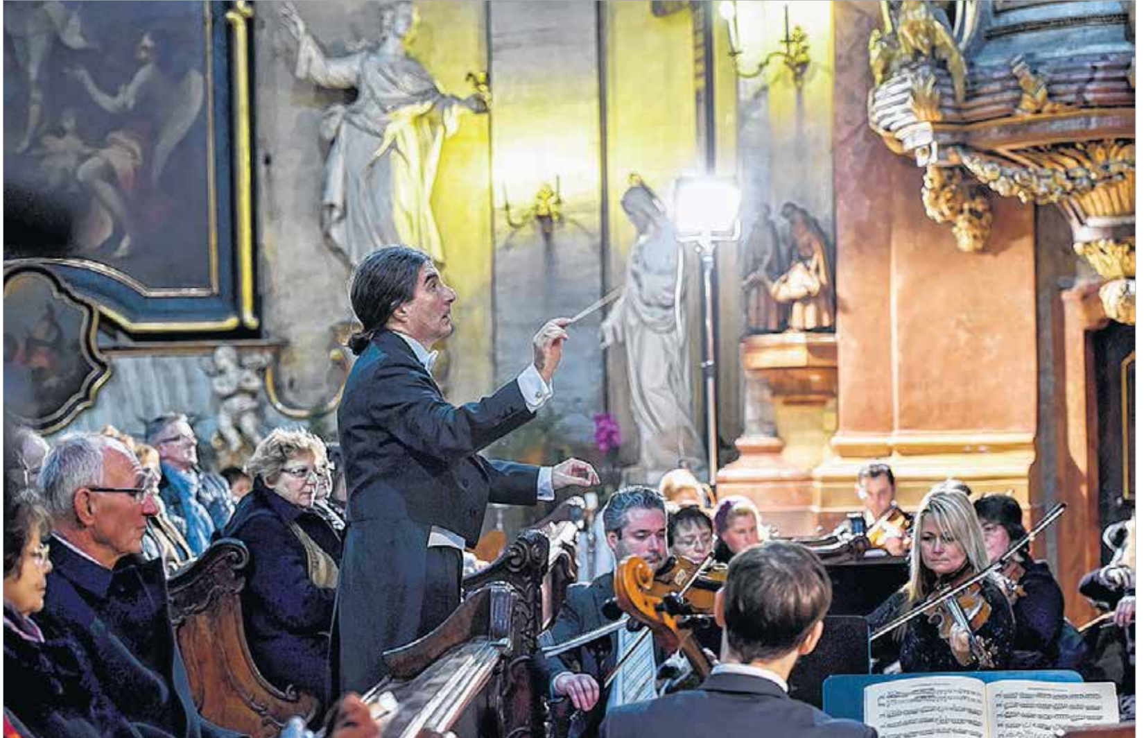
A zenekar és a karmester is jelesre vizsgázott

Milyen gondolatokkal fogadta a székesfehérvári meghívást?