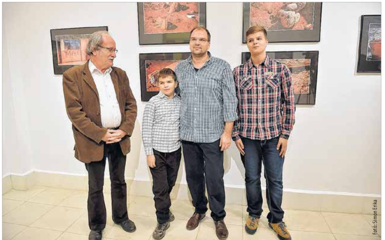
Az öt esztendővel ezelőtti eseményekkel kapcsolatban még ma is vannak megválaszolatlan kérdések

dokumentációs képsorozat, amely más látószögéből és nézőpontból mutatja meg a katasztrófa utóéletét.” Molnár Artúr Vörös október című kiállítása november 29-ig tekinthető meg a Szabadművelődés Házában.