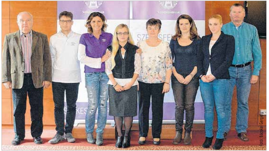
A szervezők és a jótekonysági futás „címzettjei” a sajtótájékoztatón