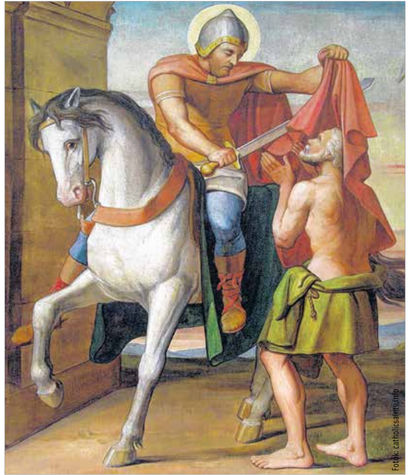
A koldusnak ajándékozta fél köpenyét

Márton később Itáliába ment. Milánóban nem látták szívesen, ezért a remetéseget választotta. A kopár Tyúk-szigeten egy másik paptársával együtt teljesen magába fordult. Sokat imádkozott, folyamatosan bűnbánatot gyakorolt. Ebben a magányban jutott el hozzá a hír, hogy a közben szintúgy elüldözött Hilárius is visszatért Poitiers-be. Egy perccel sem tévovázott, útra kelt. A Poitiers-től két kilométerre lévő Ligugében remeteközösséget hozott létre, ahol a papjelölteket és a keresztény hitre készülöket tanította. Ekkor vette fel a papi címet is. Közben sokat utazott, új egyházközségeket létesített, amelyek később egyházi központokká váltak.