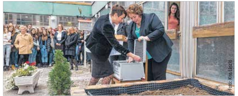
Az évforduló alkalmából az udvaron időkapzsulát helyeztek el

A köszöntők után az udvaron időkapzsulát helyeztek el. A jubileumi hét tudományos diákkonferenciával, irodalmi teaházzal, környezetvédelmi és egészségügyi vetélkedővel folytatódott. November 15-én gálaműsorral ünnepel az iskola a Vörösmarty Sínházban, amelyen a jelenlegi és egykori diákok produkciói mellett többek között az Alba Regia Táncegyüttes és a Szent György Kórház kórusa is fellép.