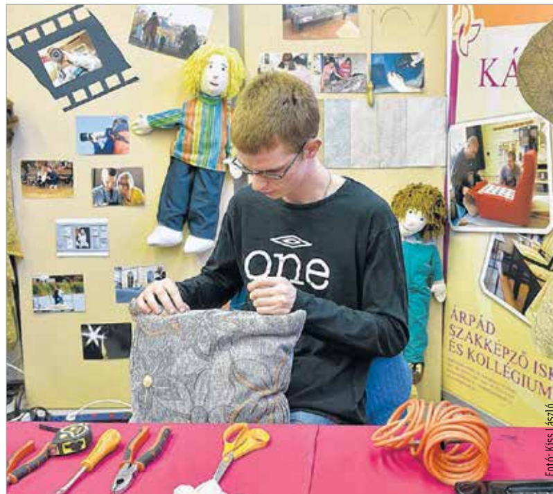
A pályaválasztók az aktuális hiányszakkakkal is megismerkedhettek

A pályaválasztás minden nyolcadikosnak és minden szülőnek nehéz. Számátalan kérdés és kétely fogalmazódik meg ebben az időszakban – kezdte gondolatait Tanárki Gábor, a Fejér Megyei Kormányhivatal igazgatója. Valóban, ilyenkor nagy súlyt cipelnek vállukon a diákok, meg kell felelni a szülőknek, a barátoknak, a tanároknak, és legfőképpen a jó utat kell megtalálni saját maguknak. Mészáros Attila, Székesfehérvár alpolgármestere köszöntőjében a kiállítás fontosságát méltatta: „Az ember életében az egyik fontos döntés a pályaválasztás. Ebben nyújt segítséget ez a két nap, amikor a fiatalok személyesen találkozhatnak az oktatási intézmények tanáraival, a vállalatok képviselőivel, a szakigazgatási szervekkel.”