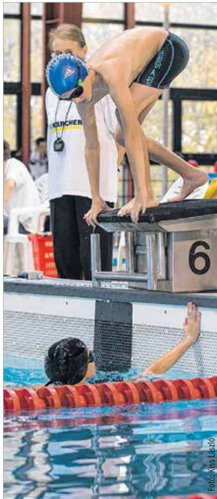
A rajt előtti feszültség ugyanolyan, mint a nagykánál

A városi versenyen a legjobbak közé kerülő gyermekek a megyei fináléba jutottak, az ott kiválóan szereplők pedig az országos döntőben úszhatnak majd a dobogós helyezésekért.