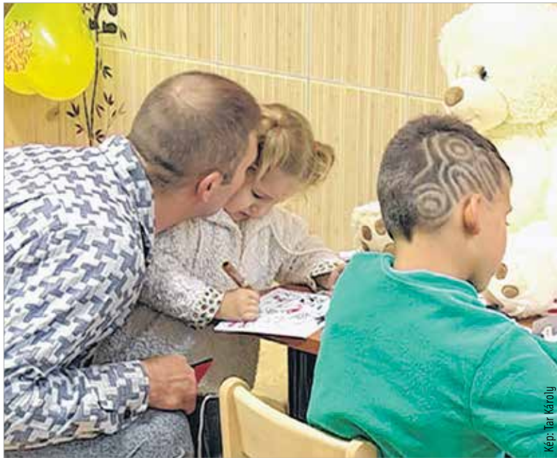
Megújult a beszélőhelyiség. Csak a gyerekek ne hagyják túlzottan megkedveljék...

Amint átlépi valaki a börtön kapuját, azonnal egy másik, saját szabályrendszerrel működő világba kerül, függetlenül attól, hogy látogatóról, dolgozóról vagy fogvatartottról van szó. A rendszer mindenkit megfoszt valamitől, és ez a megfosztottság a rabokra