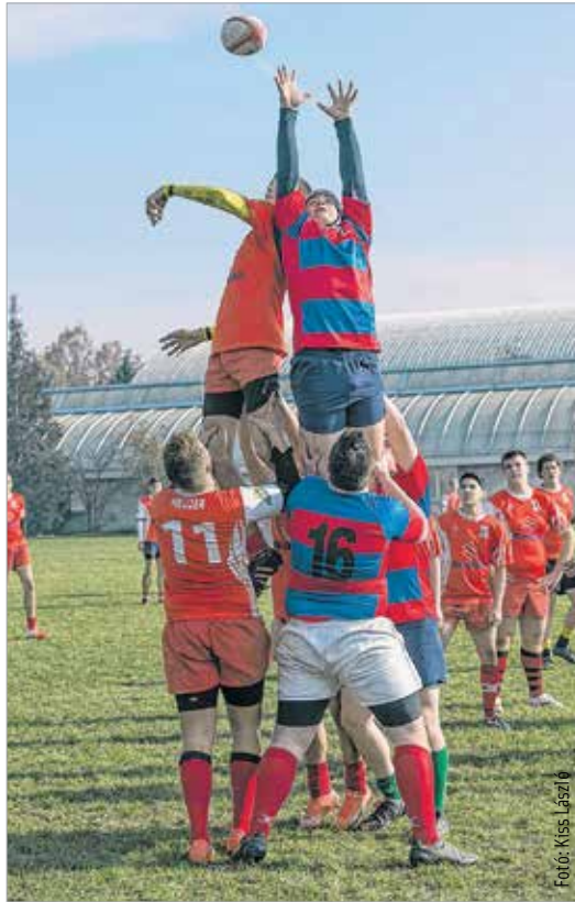
A Fehérvár Rugby Club a lehetőségeihez mérten mindig a csúcsra tör