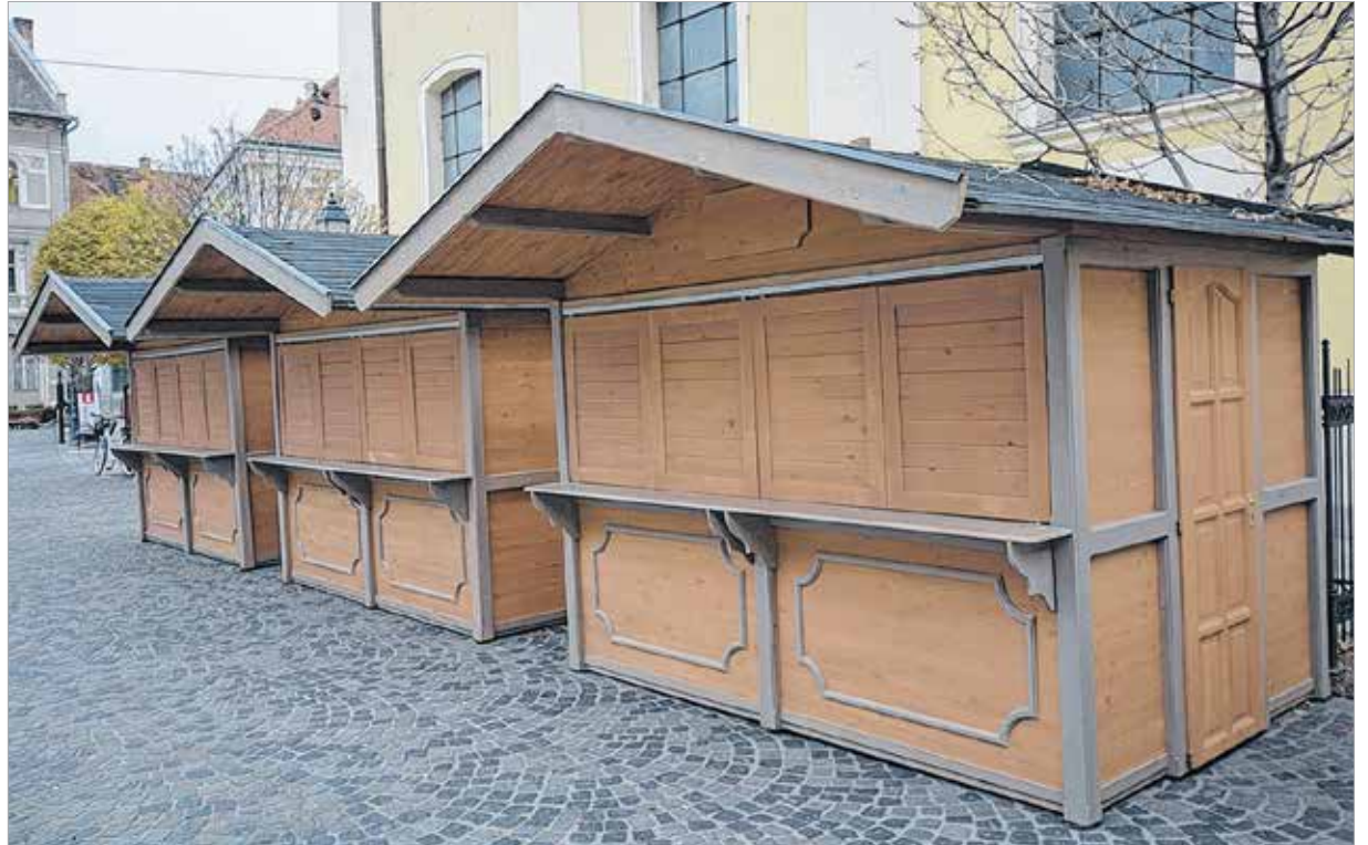
Összesen harminchat új faház készült, háromféle méretben. Az idei adventi vásáron láthatjuk ezeket először a belvárosban.

Az adventi díszkivilágítás is bővül az idén: újdonság, hogy a faházakra egységes világítás kerül, továbbá a Várkörútra karácsonyi dekoráció készül. A Fő utca Magyar Király felőli végére pedig egy igazán különleges díszkivilágítás kerül majd, ami minden bizonnyal nagyon fog tetszeni a kisgyerekes családoknak. „Igyekszünk minden városi rendezvényt a lehető legjobb színvonalon megrendezni, amúhoz hozzá tartozik, hogy esztétikus technikai eszközeink legyenek. Éppen ezért döntöttünk úgy, hogy egységes megjelenésű, szép faházak kerüljenek a városi rendezvényekre. Nemcsak szépek és újak a faházak, hanem használhatók is, hiszen az ezeket bérlő kereskedőkkel közösen alakították ki és szerelik fel őket a szükséges infrastruktúrával. A faházak után a városi sörpadokat és sörasztalokat is szeretnénk lecserélni.” – mondta a város alpolgármestere, Brájer Éva.