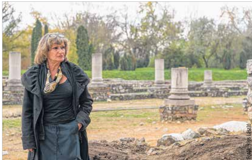
Célegyenesben a Gorsium Régészeti Park felújítása