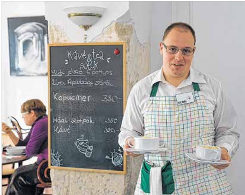
Déli sásszé leveses bögrével