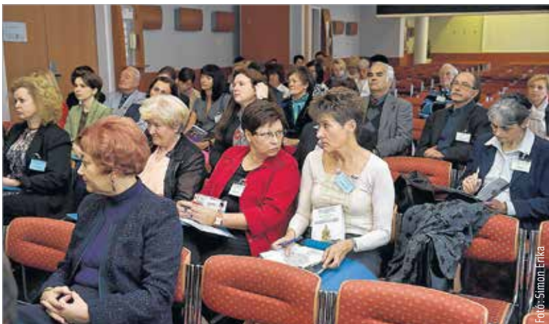
A magyar gyermekpulmonológia mérföldköveiről és a tuberkulózisról is hallhattak beszámolót a résztvevő szakemberek