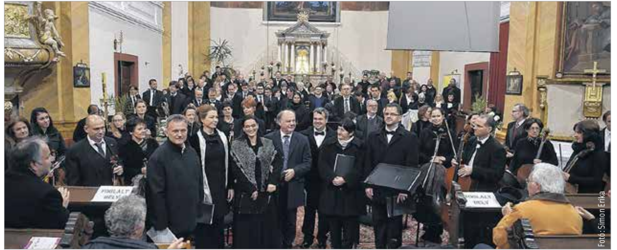
Méltó helyszínen, nagyszerű előadókkal mutatták be – hazánkban először – Suppé gyászmiséjét