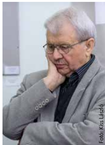
Fél évszázad tűnődés

Örök életre szóló csodát hallhattunk Bertók Lászlótól. A „Lengő fényhidak” volt az első kötete, amely leginkább tartalmában volt fontos, hiszen a szerény kiadású versgyűjtemény mára igazi unikális kiadvány. A költő akkor sem túlhaladott gondolatokkal jelentkezett. Kemény, veretes soraiban a mindennapokat idézte meg. Fél évszázad telt el, s ma újra felfedezhetjük bennük Bertók László igazságait. Az ötven év nem jelenti azt, hogy egykor igazságot szolgáltatott. Ez a könyv az átörökíthetőségről szól,