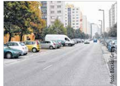
Megújulnak a Sarló utca parkolói

A munkát október 19-én a páros oldalon kezdik. Minden lépcsőházban illetve a parkoló autókön is figyelmeztetik az ideiglenes korlátozásra az autósokat. Csak addig lesz lezárva a parkoló, amíg munkavégzés folyik. A meglévő szegélyek javítását is elvégzik, illetve a süllyesztett szegélyhez történő csatlakozásnál az aszfalt kifuttatását a betonburkolat elbontásával oldják meg. A közműfedlapokat is szintbe helyezik, valamint a parkolóhelyek felfestését is elvégzik.