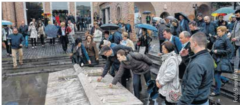
A külföldi tudósítók elsőként a Nemzeti Emlékhelyen egy-egy szál virággal tisztelegtek államalapító Szent István királyunk előtt, majd a Városháza Dísztermében hallgattak meg szakmai előadásokat