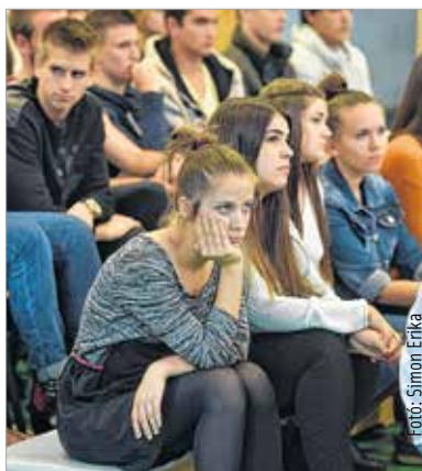
Komoly lehetőségek nyíltak meg a fiatalok előtt Székesfehérváron

„Székesfehérvár lehetőséget kapott mind a műszaki, mind a gazdasági és bizonyos társadalomtudományi képzések terén – csak a városon múlik, hogy ezt meg tudjuk-e tölteni tartalommal. A két egyetem elkötelezett, a vállalatok