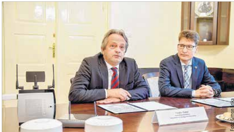
Negyvenfős NATO-parancsnokság lesz Székesfehérváron

Vita nélkül fogadta el a közgyűlés a költségvetés módosítását. A város pénzügyileg stabil, a helyi gazdaság tíz százalékos körüli növekedést fog elérni az idén – mondta el Székesfehérvár polgármestere. Hozzátette: ezért döntöttek úgy, hogy valamennyi választókerületben további tízmillió forint fejlesztést indítanak el. Ezenkívül más fontos célokat is támogatott a testület: többek között a Vöröskeresztet, a levéltárat, az Aranybulla Könyvtárat és olyan szervezeteket, melyek szolgáltatásait sok fehérvári veszi igénybe. A városatyák döntöttek arról is, hogy elkezdődik a Gyöngyvirág Óvoda tetőfelújítása, valamint az ivóvízvezeték- és szennyvízvezeték-rekonstrukció a Martinovics utcában. Székesfehérvár tízmillió forinttal támogatja a déli határvidéken szol-