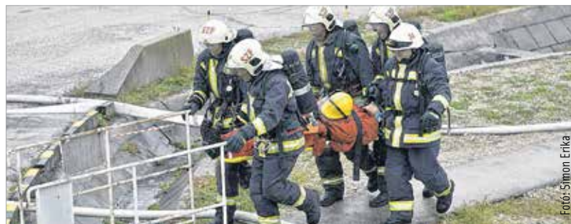
A feltételezett szituáció szerint megsérült egy ember, őt a tűzoltók vitték ki a mentőkhöz, akik védőfelszerelés hiányában nem léphettek az üzem területére

valódi vészhelyzet esetén hatékonyan tudják előkészíteni a döntéseket. Dél előtt tizenegy óra előtt néhány perccel a városban működő harminchat sziréna is megszólalt. Ez a hang jelezte a védelmi terv gyakorlati megvalósításának kezdetét. A kéklámpás szervezetek ezután a Sóstói Ipari Parkba, a gáztöltő állomásához siettek. A gyakorlatban tíz tűzoltóautó és közel ötven katasztrófavédelmi szakember, mentők és rendőrök, valamint a cég dolgozói vettek részt. Ugyanezen a napon minden iskolában tűzriadót tartottak, de a lakosságnak nem volt feladata. Székesfehérvár külső védelmi tervét háromévente gyakorolják teljes körűen a szakemberek. Erre az ügynevezett felső küszöbértékű veszélyes anyaggal foglalkozó üzem, a gáztöltő állomás működése miatt van szükség.