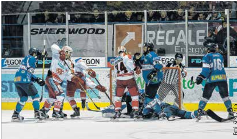
A kapu előtt sosem könnyű