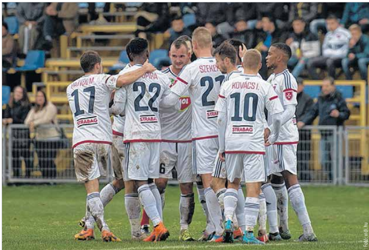
Andráshidán kétszer ünnepelhetett a Videoton. A hétvégén a Honvéd ellen is nagy szükség lesz a gólokra.