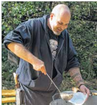
A Koppány-napi kondérban gyümölcsös-húsos ragu főtt – hasonló ételt a korabeli vadászó, gyűjtőgető magyarok is ehettek

A hétvégén ideális idejük volt a Zöld tanyára látogatóknak, akik kirándulásokkal, növénygyűjtéssel és különböző hagyományörző tevékenységekkel mondtak igent a természet hívására. A gyermekek íjzhattak, növényt gyűjthettek, és megismerhették, milyen volt ősünk lakhelye, a jurta. Aki pedig megéhezett, egy különleges bográcban főtt ételből kóstolhatott.