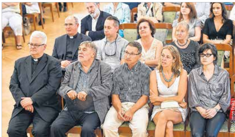
„Az élet minden területén szükség van igazi keresztény emberekre”

„Olyan családból származom, ahol a katolikus hit, az egyházzal való kapcsolat gyermekkoromtól megvolt. Úgy érzem, a munkáimon keresztül ez tükröződik. Hívó katolikus családból jöttem, és úgy gondolom, hogy azok a munkák, amiket Székesfehérváron is bemutathattam, mélyen tükrözik hitvallásomat. Nagy megtiszteltetés számomra, hogy kiállíthatok az Ars Sacra Fesztiválon, hogy ezeket a műveket, amelyek valamilyen szinten reprezentálják gondolkodásomomat, elhozhattam ide Szent István városába.”