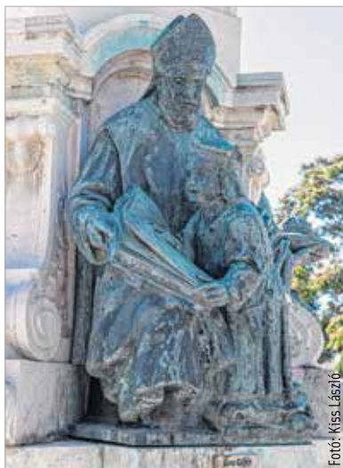
Szent Gellértet, a magyar keresztény tanítók példaképét Bory Jenő is megformálta a Püspökút emlékoszlopon, amely a Piac téren található