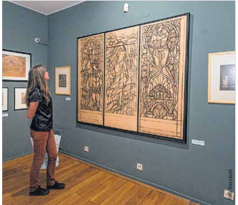
Megnyílt Nagy Sándor életmű-kiállítása a Városi Képtárban. A gödöllői szecesszió kertje című tárlat a 2015-ös év legkiemelkedőbb történeti, képzőművészeti kiállítása Székesfehérváron.

A tárlat városunkban a 2015-ös év legkiemelkedőbb történeti, képzőművészeti kiállítása. Az európai mércével mérve is jelentős magyar szecessziós művészet megteremtésében, a gödöllői művésztelep létrehozásában és fenntartásában Nagy Sándor meghatározó szerepet vállalt. „Változatos és következetes életművében a festészeti és grafikai alkotások mellett könyvillusztrációkat, bőrtárgyakat, egyházi és világi textileket, ablakfestményeket és freskók terveit is megtaláljuk. A