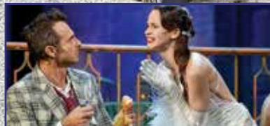
Csókos asszony – szívünkbe zártuk 5. oldal