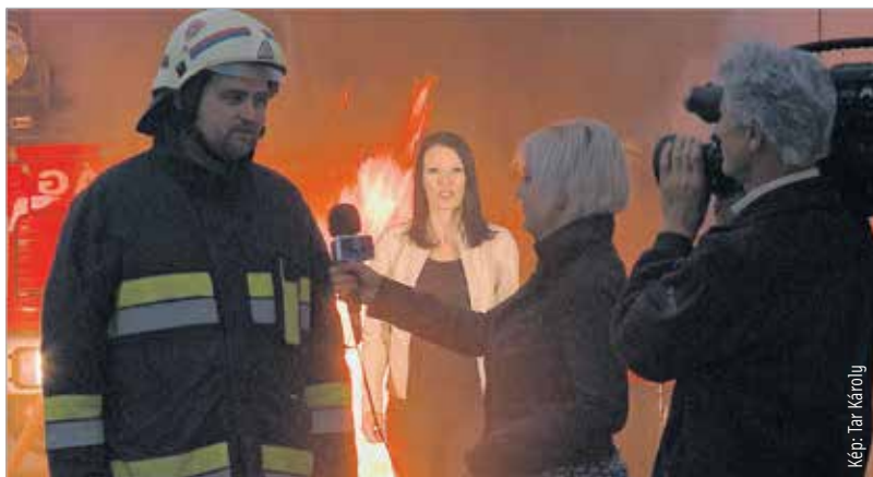
Az új hírműsor szlogenje: Figyelünk! – Minden, ami Fehérvár; Kérdezzük! – Minden, ami hír; Tájékoztatunk! – Híradó 1-kor minden hétköznap, hogy ön is időben képben legyen!

Minden székesfehérvári eseményre, megoldásra váró problémára reagálunk, és tájékoztatjuk a városban élőket. Éppen ezért az a lényege a délután egykor kezdődő hírműsornak, hogy időben, frissen jusson el az információ mindenkihez, akár a tv-ből, akár az internetről tájékozik az illető. A korai időponttal a figyelem nem csupán azokra az eseményekre terelődik, amelyekre este, esetleg másnap is hírtértekük van, hanem olyanokra, amelyek aznap kapnak jelentős szerepet. Ilyen például egy útlezárás, egy baleset, de ilyen lehet egy gyors politikai reakció nem várt eseményekre. A kulcs a jelenlét, és az, hogy a néző is nyomon tudja követni a városban történeteket a napközbeni események ismeretében.