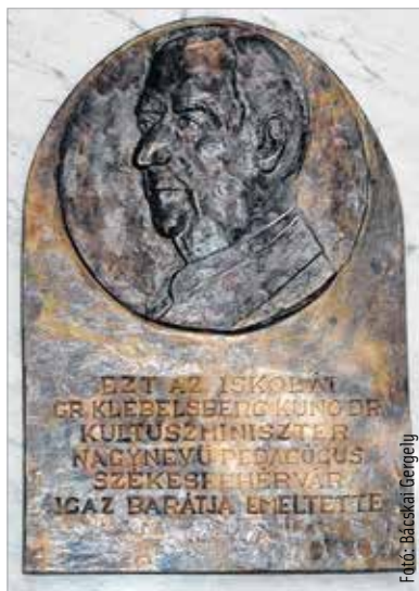
Az egykori kultuszminiszter domborművének reprodukciója

Az egykori vallás- és közoktatásügyi miniszternek köszönhetően építették fel a mai II. Rákóczi Ferenc Magyar-Angol Két Tanítási Nyelvű Általános Iskola épületét. Klebelsberg Kunó az iskola jogelődjének felépítésére négyszázezer pengőt folyósított. Az 1932-es beköltözéskor az intézmény a miniszter nevét vette fel. Tiszteletére 1938-ban domborművet avattak, melyet Lux Elek szobrászművész alkotott, a II. világháborúban azonban ez megsemmisült. A II. Rákóczi Ferenc Általános Iskola udvarán felnöttek és gyerekek az intézmény fennállásának 95. évfordulója alkalmából Klebelsberg Kunó tiszteletére ismét domborművet helyezhettek el az intézmény falán. A reprodukció Szakál Antal keze munkáját dicséri. Cser-Palkovics András köszöntőjéből kiderült, pár embernek köszönhetően fény derült arra, hogy ennek az iskolának a falán egykor állt egy Klebelsberg-dombormű, amiről sokáig a város vezetősége nem is tudott, hiszen még azok a dokumentumok sem voltak meg, amelyek ezt alátámasztották volna. A lelkes Klebelsberg-tisztelő azonban igazolni tudták,