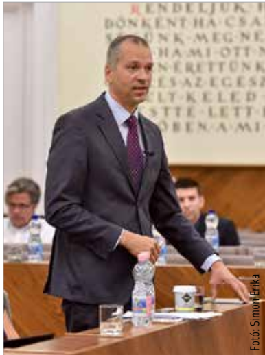
A baloldali frakció is támogatta a fideszes előterjesztést a katonák és rendőrök megsegítésére

Pénteki ülésén Székesfehérvár Önkormányzata első napirendi pontként döntött arról, hogy tízmillió