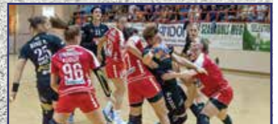
Egyszer lenn, egyszer fenn 14. oldal