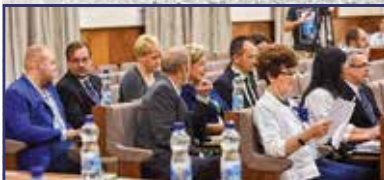
Támogatás a határ őrzőinek 2. oldal