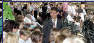
Domborműavató ünnepség a Rákócziiban 12. oldal