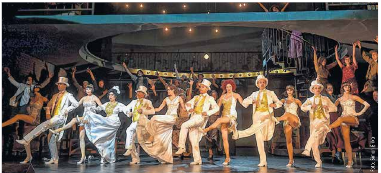
Az örökzöld slágerek mellett rengeteg tánc, nevetés és egy remek történet várja a publikumot a Vörösmarty Színházban