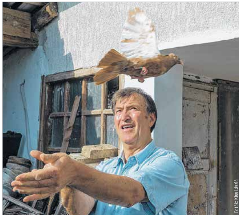
A galamb általában hat-nyolc évig él, minél öregebb, annál sötétebb a tollazata

sorszám. Ha a madár Magyarországon valahol elveszne, akkor a személyi alapján az interneten ki lehet deríteni, ki a tulajdonosa.” A másik fészkből első pillantásra egy sólyom és a galamb szerelemgyerekeinek tűnő madár bukkant elő. A bácskai hosszú csőrű keringő igazán érdekes látvány: egyszerre jámbor