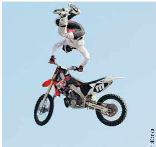
Első nekifutásra azt mondaná az ember, nem normális – mégis precíz, pontos és látványos volt a motokrossz-bemutató