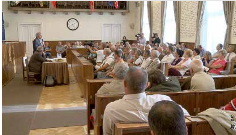
A városházára meghirdetett előadásra sokan voltak kíváncsiak, sőt véleményüknek hangot is adtak

Az előadás levezetője Vargha Tamás honvédelmi államtitkár volt, szakértője Tóth Péter, a Nemzeti Közszolgálati Egyetem Stratégiai Védelmi Központjának igazgatója. Vargha Tamás az előadáson elmondta, hogy a honvédség állományát migrációs válság esetén vetik be, de akkor is csak a rendőrség segítségével, annak támogatására. Önálló műveleteket a katonák nem hajtanak végre. A kialakult helyzettel kapcsolatban az államtitkár kijelentette: annak lehetünk tanúi, hogy Görögország nem csinál semmit, a migránsokat átengedi az országán, Szerbia és Macedónia hasonlóan cselekszik, bár ők nem tagjai az Európai Uniónak. Vargha Tamás kiemelte, mindez úgy történik, hogy a konfliktusok hosszan elhúzódnak: a Szovjetunió 1980-ban vonult be Afganisztánba, Irakot huszonegy éve támadta meg az USA, már Szíriában is túl vagyunk a tűréshatáron, de mindeközben semmi nem oldódott meg. Tóth Péter a kialakult helyzet közvetlen okait így jellemezte: „Polgárháborúk dúlnak Szíriában, Irakban. Líbia kettészakadt. Líbia