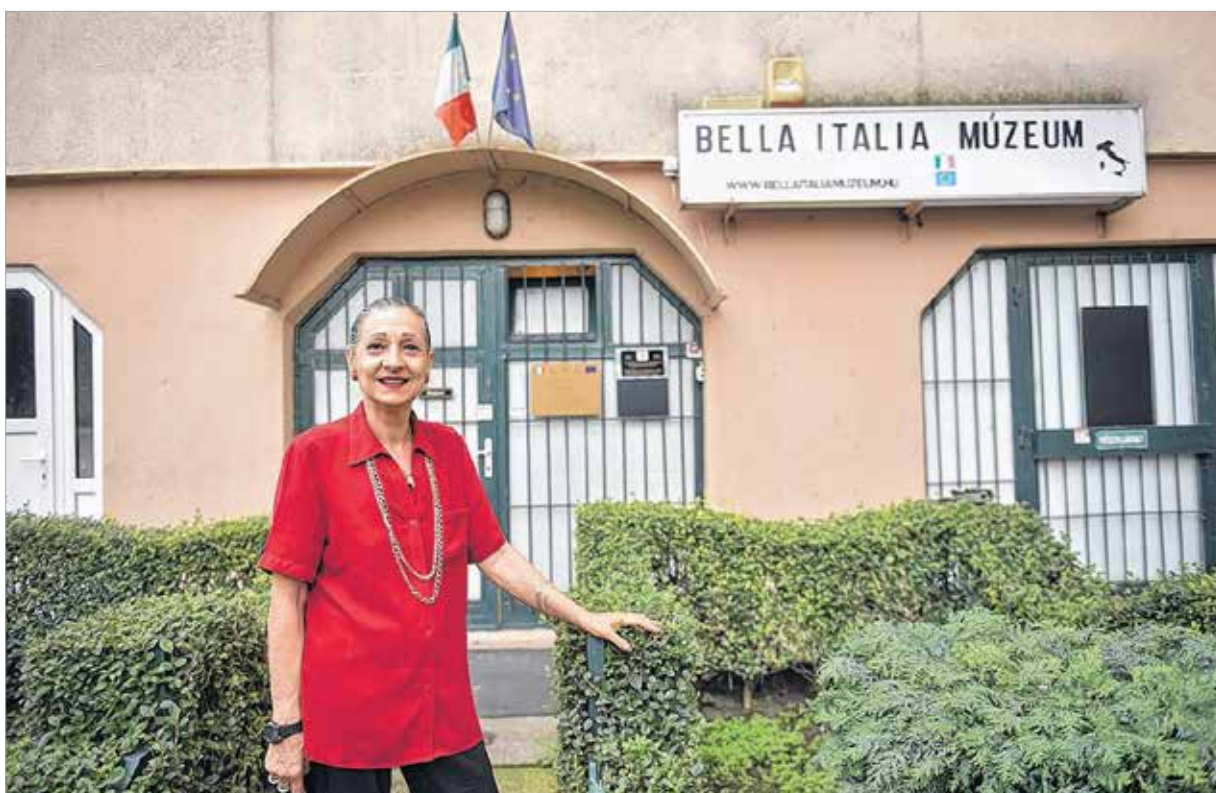
A Bella Itália Múzeum új utakon jár

Mikor kezdett el beérni munkája gyümölcse?