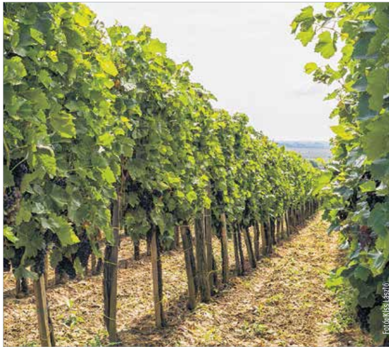
Az Oktatási Minisztérium által elismert képzési formában november 2-án, hétfőn indítják útnak a „Bolygó Hollandi” elnevezésű borismereti tanfolyam következő kurzusát

Magyarországon huszonkét borvidék található. A hozzánk legközelebbi móri borvidék méretében az egyik legkisebb, de a híresebbek közé tartozik. Múltja a történelmi időkbe tekint vissza, azonban bortörvényünk 1996-tól sorolja a borvidékhez Mór, Pusztavám, Söréd, Csókakő, Zámoly és Csákberény I. és II. osztályú szőlőkataszteri besorolású határterseit.