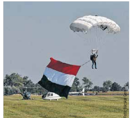
A szolnokiak és az albatroszos ejtőernyősök nemzeti trikolórral értek földre