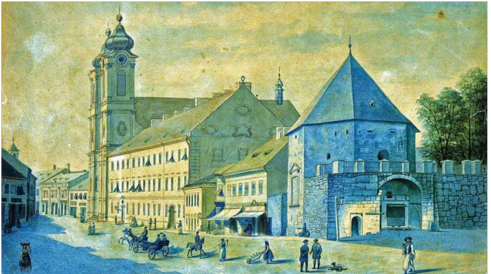
Székesfehérvár főutcája a budai kapu tornyával, a ciszterci rendházzal és templommal. Aujedszky Adolf festménye, 1870 (Szent István Király Múzeum)

gyakorlatban csupán a megszo-kottságon alapul. Ennek alapján a püspökség 1885 december elején Székesfehérváron a német nyelvű misét megszüntette. Az utolsó né-met nyelvű miét 1885. adventjének elején egy szerzetes tanár mondta a ciszterci templomban. A fehérvári