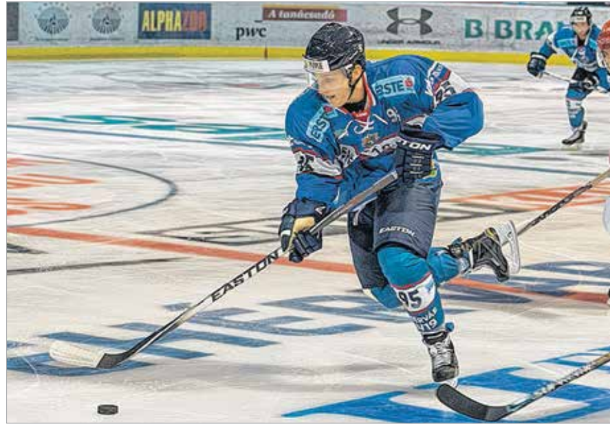
A fehér mezes Innsbruck csak üldözte, de nem érte utol a Volánt