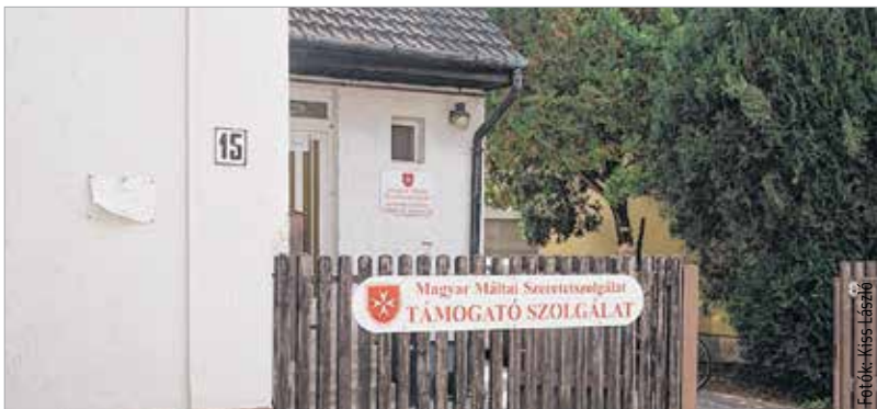
Minden szerdán várják a rászorulókat a Taksony utcában

A Máltai Szeretetszolgálat székesfehérvári csoportja 1992-ben alakult meg. A Taksony utcában két éve működnek. A csoport tagjai önkéntes alapon végzik a segítő, karitatív munkát. A rászorulókat szerdánként reggel 9 órától várják. Étél- és ruhaadományt szintén ide lehet hozni, hétfőn, szerdán és pénteken.