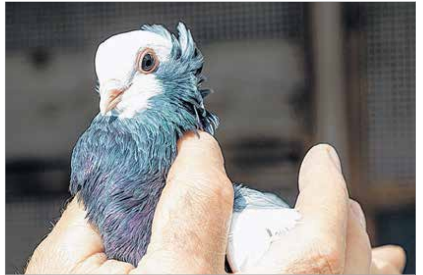
A székesfehérvári bukógalamb nemzeti kincs

A kis házban komplett duplexben fészkeltek a galambok. A felső polc sarkában állt a fészektányér, amiben folyamatosan