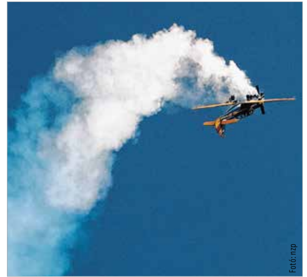
Teleírták a kék eget Börgöndön zuhanóban, fejjel lefelé, pörögve, kacszáva

gyakorlatáról volt szó. Ha már gyakorlat: kutató-mentők bevonásával folyik szeptember 24-ig a Személyi Mentés Egységesítési Képzés 2015 elnevezésű valós idejű nemzetközi repülőgyakorlat Börgöndön, amit a repülónap idejére felfüggesztettek, és csak a többi gyakorlóhelyszínen, Pápán, Szentkirályszabadján, Újdörögden, Taszáron, Kalocsán, Győrben és Szombathelyen folytattak.