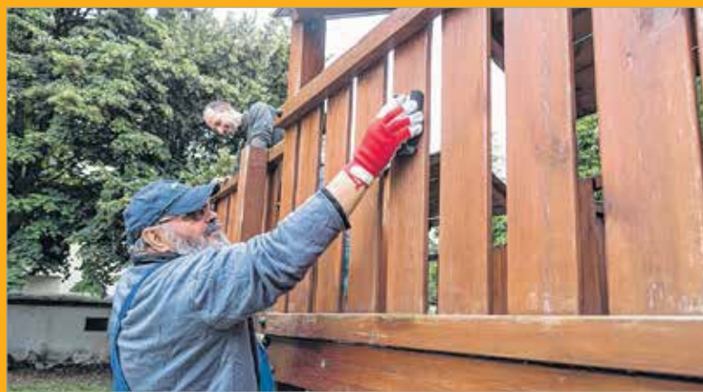
Ez már a harmadik alkalom, hogy a Széphő munkatársai a társadalmi felelősségvállalás jegyében felkeresnek egy intézményt, és rendbehozzák a padokat, játszószerkezeteket

Az idei évben az immár hagyományná vált segítségnyújtásban az Arany János Óvoda, Általános Iskola, Speciális Szakiskola és Egységes Gyógypedagógiai Módszertani Intézmény részesült a Széphő jóvoltából. A felső- és középvezetők munkaruhába bújtak, hogy az udvari játékok javításával, felújításával komfortosabbá tegyék a választott intézmény tanulóinak hétköznapjait.