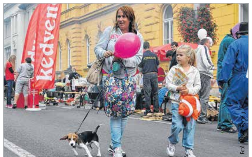
Még mondják, hogy a kutyának sem kell...

tuk Székesfehérvár polgármesterét Bajára, a halfőző fesztiválunkra. Ez a meghívás természetesen nemcsak Székesfehérvár polgármesterének, hanem a város minden polgárának szólt. Ezt a látogatást viszonzzuk most azzal a gondolattal, hogy a hasonló találkozóknak jövőjük lesz. Nagy megtiszteltetés számomra, hogy itt lehetek! Olyan élményekkel gazdagnodom, olyan újdonságokkal térhetek haza, amit otthon is hasznosítani tudunk. A kapcsolatunkat feltétlenül tovább építjük!” A megszólított csapatok válaszaik önmagukért beszélnek. Külön-külön is játékos harmóniát sugallnak. Ime, egy csokor a csapatvezetők lecsófőző stratégiájából. A felvezetés természetesen az újságíróé, a válasz azonban a különböző és mégis azonosan