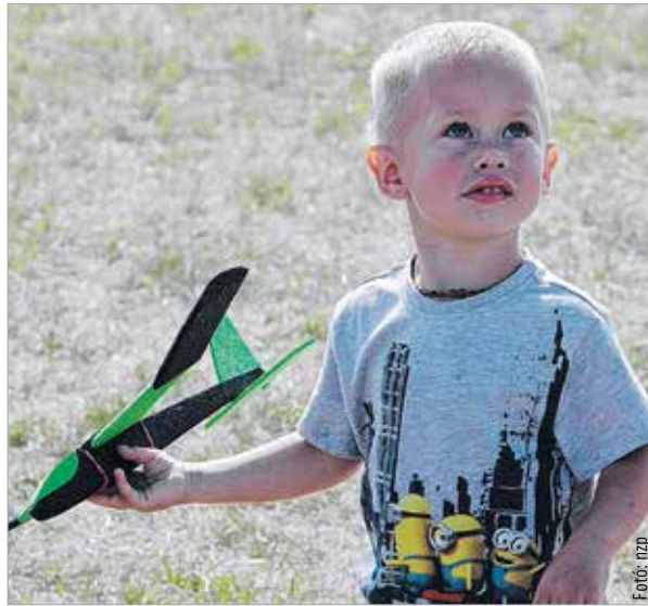
Szinte biztos, hogy pilóta leszek!

A repülónapon természetesen az eszem-izom is uralkodott, a