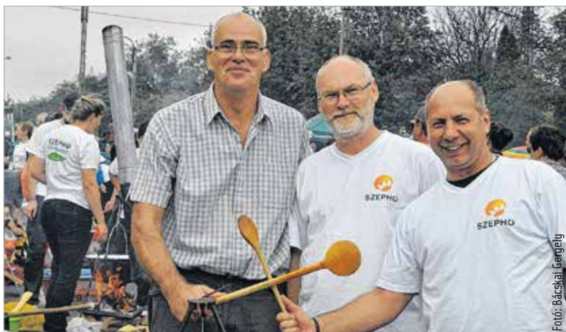
Három a testőr, kettő a fakanál

sokkal inkább a jelenlétük volt. „Olyan lecsót szeretnék főzni, ami a számunkra olyan kedves székely ízeket adja. Ahogy felénk szokás, házi szalonnával, házi kolbással ízesítjük. Mindent beleteszünk, ami jár, sőt még annál is többet, de nem az a lényeg, hanem hogy újra itt lehetünk!” A Városgondnokság jó szokása szerint vigyázott a szervezet jó