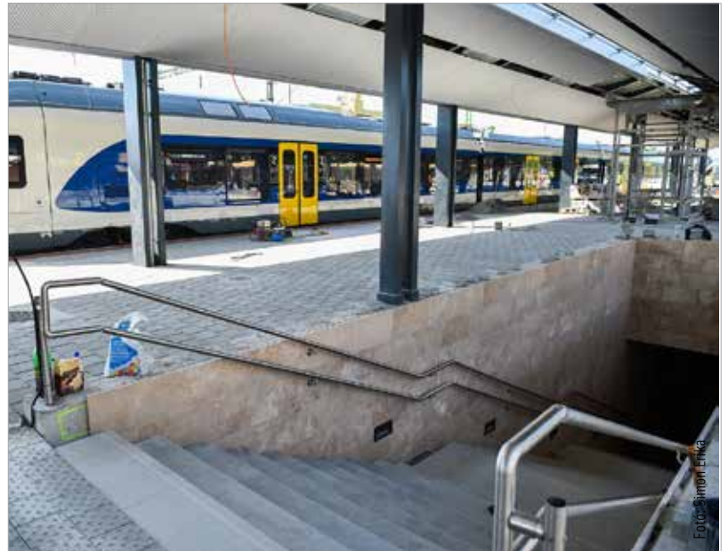
Keddtől már az utascsarnokon, az új aluljárón és az elkészült új peronon keresztül lehet megközelíteni az ideiglenes peronokat

A székesfehérvári vasútállomás felújítása várhatóan 2016-ban fejeződik be teljes vágányépítéssel, a Budapest és Börgönd felőli oldal még hiányzó új kiterőinek megépítésével és az ideiglenes peronok elbontásával.