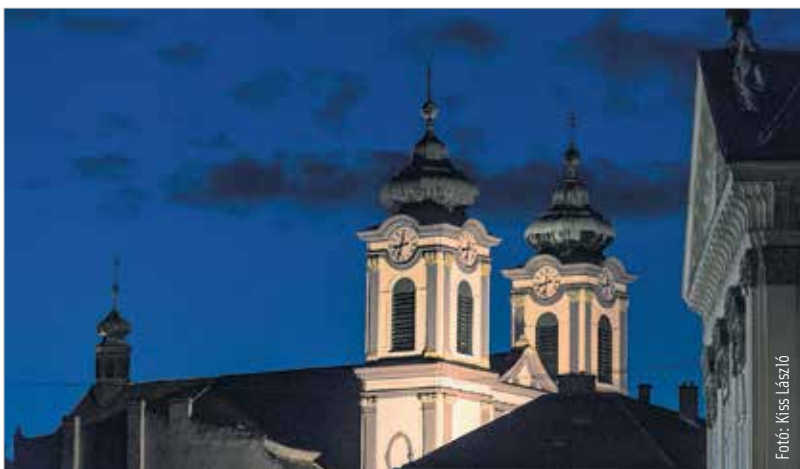
Lép be és láss! A Nagyboldogasszony Ciszterci Plébánia is csatlakozott a nyitott templomok napjához.

a kulturális örökség napjaival együtt a nyitott templomok napja, amikor a templomok, zsinagógák megnyitják kapuit, és a közösségek bemutatják templomaik művészeti értékeit. Színes kulturális programokkal, helyenként toronymászással várják az érdeklődőket. A felhívásra idén több mint száz templom jelentkezett. Lép be és láss! címmel a Nagyboldogasszony Ciszterci Plébánia is csatlakozott az eseményhez. Szeptember 19-én 10 órától egészen 20 óráig várják az érdeklődőket. A csatlakozó települések és templomok részletes listáját megtalálhatják a fesztivál honlapján az imatérképen: www.ars-sacra.hu