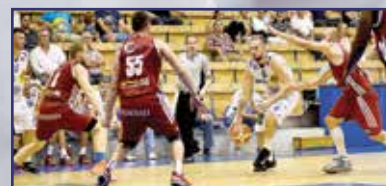
Még foghíjasan, de már pályán az Alba 15. oldal

Uniós pályázati kommunikáció egy kézben – Fehérvár Média Centrum