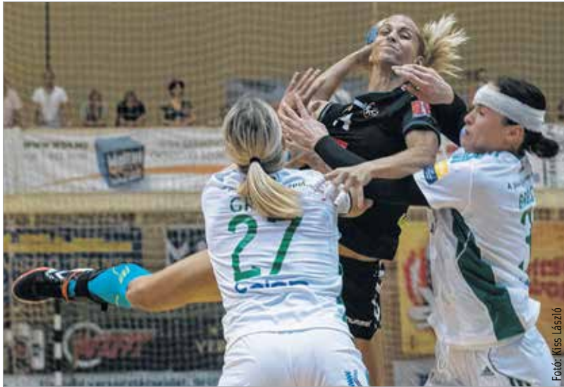
Tápai Szabinára végig nagyon figyeltek a győri védők, itt éppen Groot és Broch próbálják leberkőzni

Az első féldíó nagy részében kifejezetten szoros volt az állás, az FKC végig ott loholt ellenfele