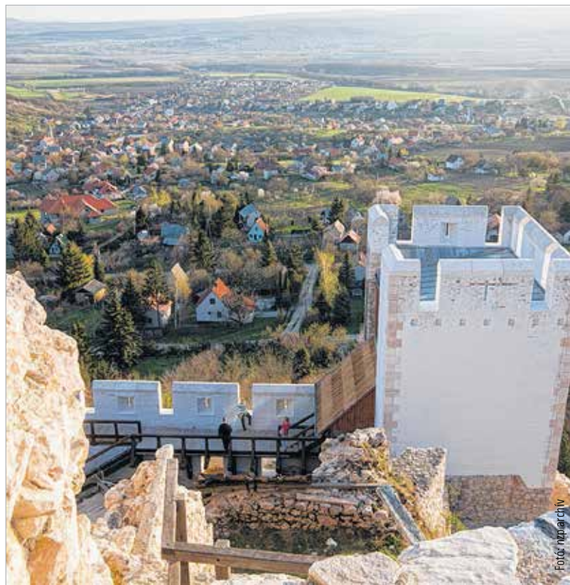
A csókakői vár lélegzetelállító lenről és fentről nézve egyaránt – hétfégi programjai mindezt csak fokozzák