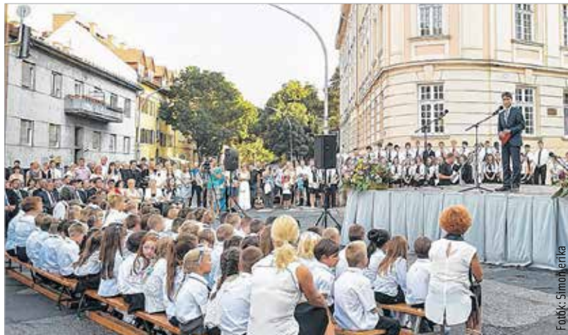
Ünnepelőbe öltözött diákokkal telt meg a Várkörút és a Budai út kereszteződése.

ják. A polgármester a város és az ország egyik legkomolyabb múlttal rendelkező iskolájának nevezte a Telekit, amely méltó helyet foglal el Székesfehérvár történelmében, és amely ebben az évben – a jubileum okán – nagyobb szerepet kap.