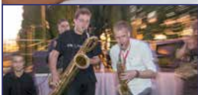
Színház és jazz az Öreghegyen 4. oldal