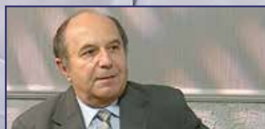
Búcsú a kórháztól 10. oldal