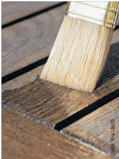
A festés minősége az ecseten is múlik!

Bizony nem! Tudni kell a fáról, hogy mérettartó-e, puha vagy keményfa. Sok minden meghatározza, hogy milyen anyaggal színezhetjük, ápolhatjuk a fát. Nagyon fontos az alapozó kérdése: el kell dönteni, melyik gyártótól veszünk lazúrfestéket, és az ahhoz tartozó alapozót érdemes megvásárolni. Van ugyanis olyan gyártó, amelyik a gomba- és rovarvédőt egyaránt az alapozóba teszi, de olyan is, amelyik csak a penész elleni szert teszi az alapozóba, a rovarölőt pedig a lazúrhoz, éppen azért, hogy a bevő együtt használja a két terméket.