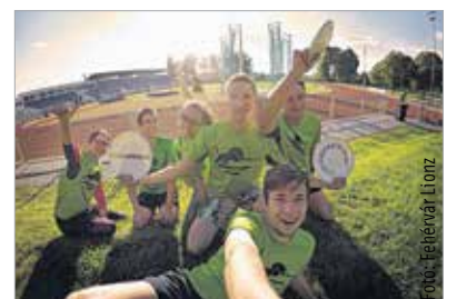
A Lionz vidám csapat, a sport mellett a jó hangulat is garantált

erősségei, ezt a pontvadászat második fordulójában is bizonyíthatják majd. A fehérvári gárda a haladó kategóriában az első kört a harmadik helyen zárta, a szeptember 5-én rendezendő második fordulóban a cél már az első két hely valamelyikének elérése lesz.