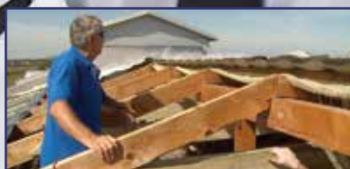
Tető kerül a fejük fölé 7. oldal