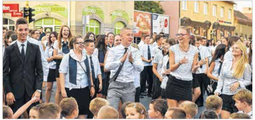
A Diákönkormányzat tagjai és az iskola új diákjai a gólyatáborban tanult osztánccal lepték meg a megjelenteket

A hagyomány szerint minden alkalommal egy jeles jubileumot ünneplő intézményben tartják a közös ünnepet, így esett a válsztás a város egyik legrégebbi