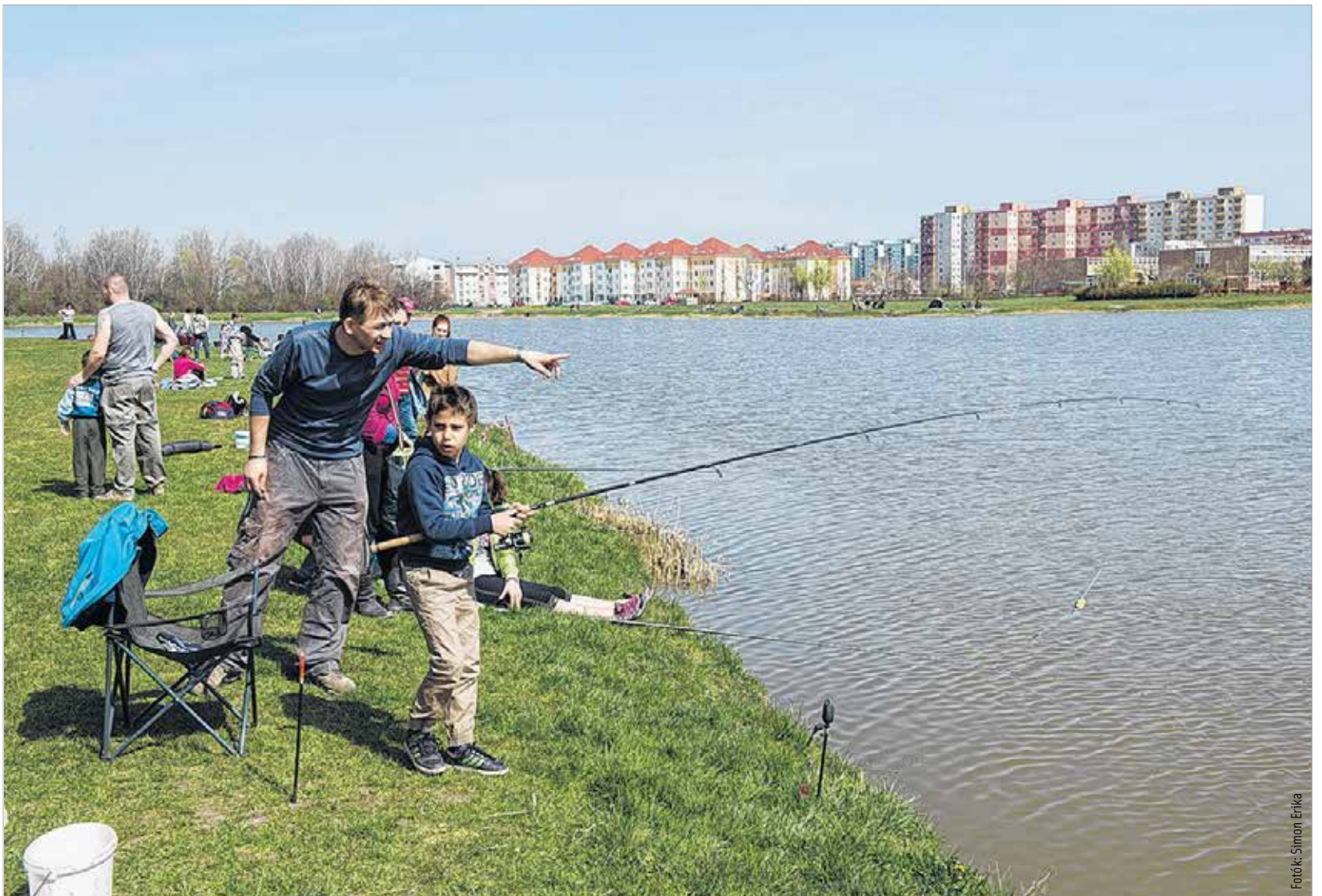
A horgásztáborban a gyerekek megismerkednek a pecázás rejtelmeivel