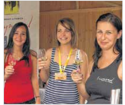
Három a kislány. A szerémségi Ipolynyék ifjú hölgyei is borbarátok.