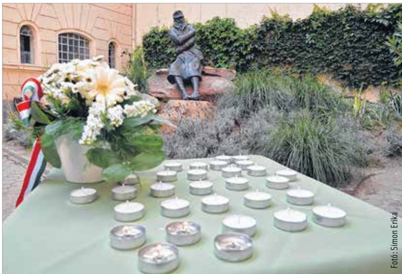
Gyóni Géza krisztusi korban, 33 esztendősen, hősi halottként búcsúzott a földi létől

miként maradhat valaki a háború poklában önmaga. „Méltósággal és felelősséggel kell emlékeznünk, hiszen ő az első nagy világegyesben vesztette életét. A mai világot látva – amikor az ember békéért kiabál, és békét szeretne, miközben hihetetlenül könnyen teremt békétlenséget – láthatjuk, hogy mindenhol, így nálunk, Magyarországon és határainkon túl is háború dúl, fegyverekkel és fegyverek nélkül. Nagyon nagy a felelősségünk, az emlékezésben is nagy, mert őriznünk kell azokat az értékeket és az egymás mellett élés értékrendjét, amelyek mentén tudunk békében, egymásra odafigyelve élni.”