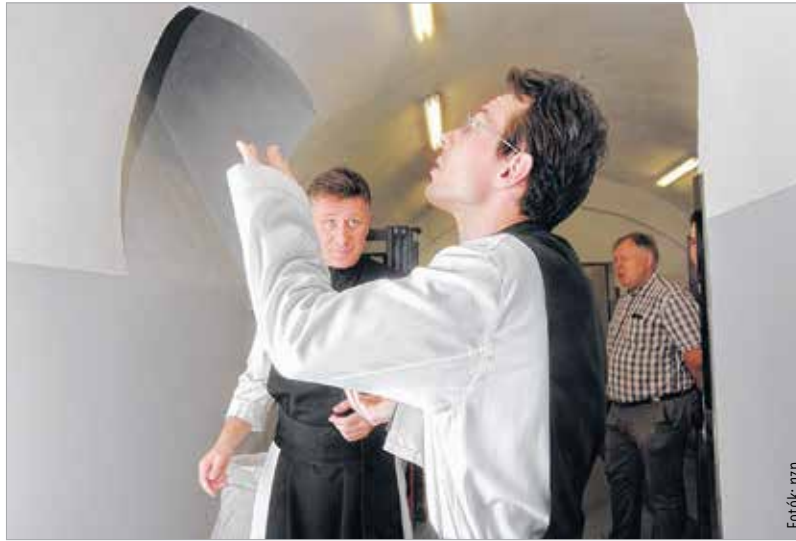
A rendház szerzetesei egyelőre a levegőből próbálják bekapni az illatos és ízletes malátát, az első sör csak három hét múlva érik be

A Fehérvár Televízió stábjába elsőként vehetett részt azon a mustrán, ahol az alapanyagokat, az őrlőket, erjesztőket és érleléket megnézhettk a sörfőzde elindulásakor. A boltíves pince felújított falai között természetesen már jó pár napja állnak a berendezések, de szerdán jött meg a hatósági engedély az arany színű nedű gyártására. A malátaillat betöltötte a teret, amikor megkérdeztük, mikor csapolják az első korsó sört. „Itt huszonegy napig biztos, hogy nem lesz sör!” – csattant fel az egyik szakember, aki a lelkes amatőrnek sem nevezhető stábot felvilágosította, hogy a ciszterci söroket legalább huszonegy napig, de lesz olyan is, amit nyolcvan napig kell érlelni. Azaz kiderült számunkra, hogy legjobb esetben is csak vizet ihatunk a zirci apátságban... A sörkészítés alapfeltétele a jó minőségű víz, hát megkérdeztük a főapátot, hogy szentelt vízből készül-e a szerzetesek söre. Dékány Árpád Sixtus így felelt: egy szentelt épületben a csapból is szentelt víz folyik, főleg ha az bakonyi karsztvíz! Ezután adta magát a lehetőség, hogy kifaggassuk a főapátot.