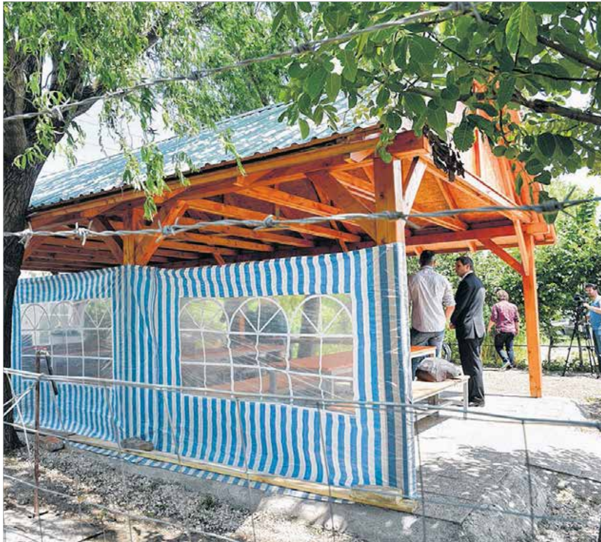
A pavilonban akár rendhagyó biológiaórárt is lehet tartani

mondott a HOFESZ-nek a palotavárosi fejlesztésért, ami a közösséget is építi, és jó programoknak biztosít helyet. A képviselő kiemelte, hogy a tavat rekreációs övezetté jelölték ki a város, az ehhez kapcsolódó fejlesztések sorra valósulnak meg. Viza Attila szerint a közösségi térben eltöltött idő is építi a várost, hiszen alkalmat ad arra, hogy jobban megismerjék egymást az emberek.