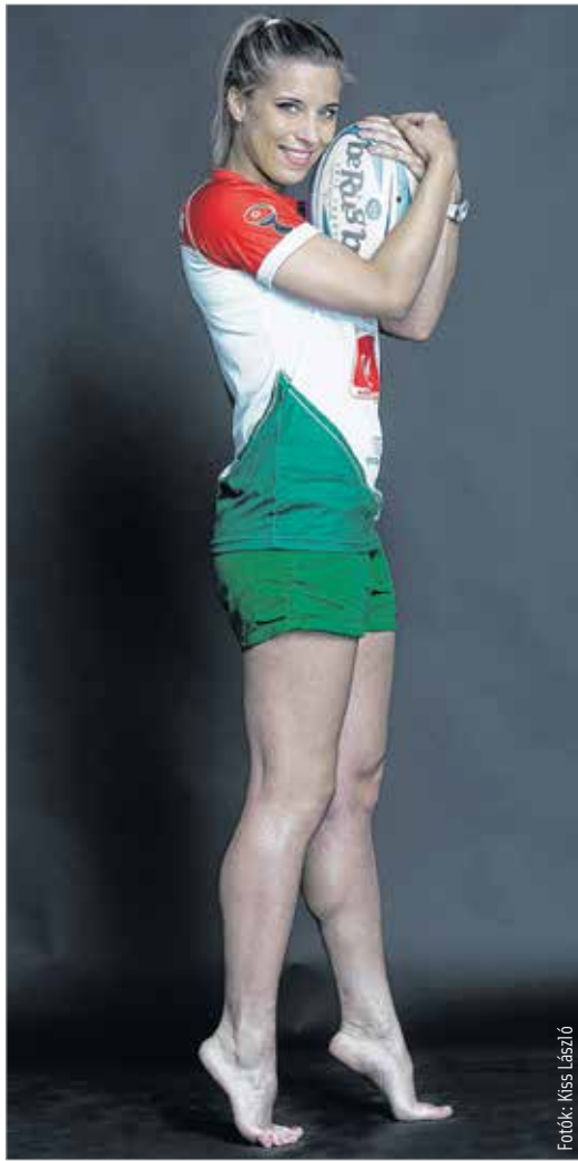
Pap Helga a válogatottban elért sikereire a legbüszkébb

Először nem hiszik el, de egy idő után kénytelenek, főleg amikor elkezdem mesélni a sztorikat. Azért az elején mindig előkerül, hogy egy ilyen törekeny lány hogy rögbizhet? Aztán persze kiderül, hogy én vagyok a pályán az egyik legdurvább játékos, sokszor állítottak már ki ezért. Volt olyan – persze nem szándékosan – amikor az ellenfeletem úgy lefejeltem, hogy szétrepedt az orra... Szóval nem vagyok