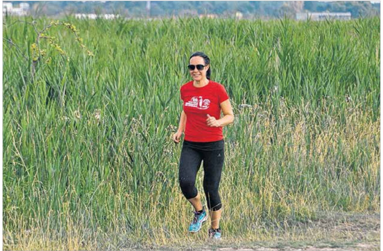
Műtete után néhány héttel a kétgyermekes édesanya élete első maratonját is teljesítette márciusban

érttem, huszonnégy órás imalánc volt értem. Összefogtak az emberek és Istenhez kiáltottak, és ő tényleg meghallgatta őket is és engem is.