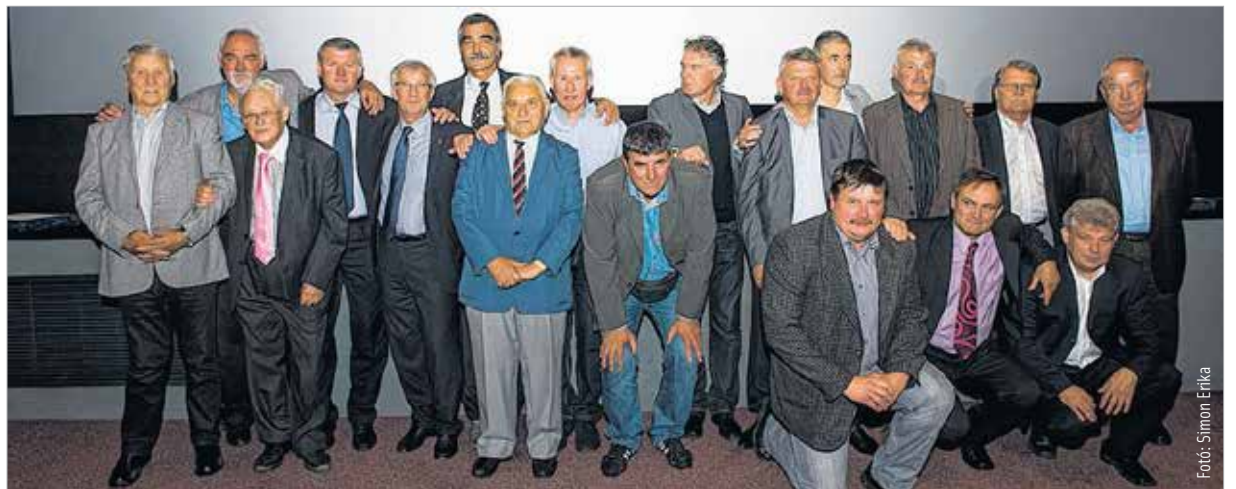
A filmvászon előtt a főszereplők, a harminc évvel ezelőtti menetelés résztvevői