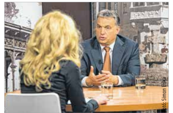
„A vidék fejlődésének a kulcsa a nagyvárosainkban van” – nyilatkozta Orbán Viktor miniszterelnök a Fehérvár Televízióan

A fűtőerőmű visszavásárlása megtörtént, amihez az állam adta a forrásokat. Megállapodtunk az elkerülő befejezésében, amit hamarosan át fogunk adni. Mintegy 8,4 milliárdos kórházfejlesztésben állapodtunk meg, amit a következő hónapban átadunk. A Gárdonyi Géza Művelődési Ház felújításáról is megállapodtunk, ott kis lemaradásban vagyunk, de reményeim szerint a következő hónapok során ezt ledolgozhatjuk, és akkor a 2013-as megállapodás is teljesül. Általában nem könnyen írok alá megállapodást. Azt ötször is meg kell gondolni – az ember inkább kétszer mérjen, mielőtt egyszer vágna. De