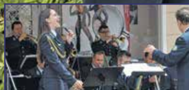
Katonaköszöntés fehérvári módra 6. oldal