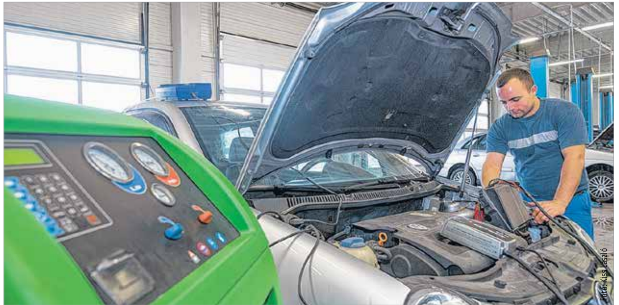
Az ózonos klímatisztítás a legkorszerűbb eljárás

Teljes mértékben megszünteti a kellemetlen szagokat, kiirtja a vírusokat, baktériumokat a rendszerből. Gombaölő hatású, így a megtelepedett gombaspóráktól is megtisztítja a légkondicionálót, így az autóra jutó levegőt. Ez azért is fontos, mert ezek a gombák megfázásszerű megbetegedést is okozhatnak. Emellett az ózonos tisztítással kiirtjuk a klímából az allergén anyagokat is.