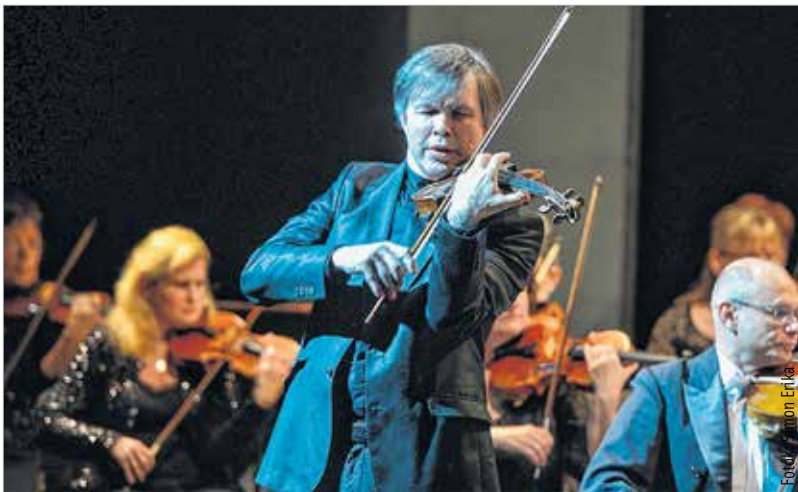
Szabadi Vilmos hegedűjátéka lenyűgözte a komolyzene szerelmeseit

szereplő alkotásain nőttek fel: „Ő egy olyan utat kezdett el járni alkotói korszakának elejétől, amit az jellemzett, hogy bevonta a magyar zene megismerésébe a külföldet is, megerősítve a magyar zene hagyományos jellemzőit. Ő volt az, aki elhelyezte a magyar zenét a világban. Segített abban, hogy öntudatot merítsünk azáltal, hogy mindenki megtudja, milyen fantasztikus dallamkinccsel rendelkezik hazánk. Megalkotta saját nyelvét, tudatos zsenialitása teremtette meg mindazt, ami Bartók, és hozta meg nekünk azokat a sikereket, amit a magyar zene a világtól megkaphatott.”