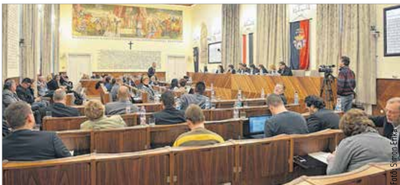
Óvodabővítés, városkártya, kerékpárút, közvilágítás – ezek a pénteki közgyűlés főbb témái

kézzelfogható előnyeit biztosítaná a fehérváriak számára. A kártya a helyi kereskedők és a vásárlók összefogását segíti elő, és jogosult lesz használatára minden székesfehérvári lakóhellyel rendelkező nagykorú személy a 2015. július és 2016. december 31-e közötti időszakban. A közgyűlésen a kerékpárút-hálózat fejlesztését célzó pályázatról és a stadionrekonstrukciós programról is tárgyalnak a képviselők. Téma lesz az Alba Regia Szimfonikus Zenekar 2015/2016-os hangversenysorozata is, a tervek szerint halottak napi hangverseny, újévi hangverseny, skandináv est és Beethoven C-dúr miséjének előadása is szerepel a programban. Zárt ülésen értékeli a Székesfehérvár közvilágítási rendszerének városrészi korszerűsítése elnevezésű projekt és az Új Belváros-Várkörút rehabilitációja című projekt közbeszerzési eljárását is.