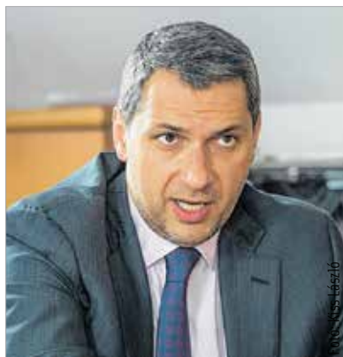
Júniusban újra napirendre kerül a Honvédelmi Minisztérium költözésének ügye

Jelenleg a városban három százalékos a munkanélküliség. Ha holnap idehoznánk egy céget, amely munkahelyet teremtené az iparban, nehéz lenne megfelelő munkaerőt találni. Ahhoz, hogy Székesfehérvár ipari húzóvárosként segítse