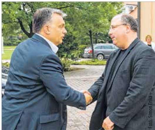
Orbán Viktor miniszterelnök a Fehérvár Média centrumot is felkereste