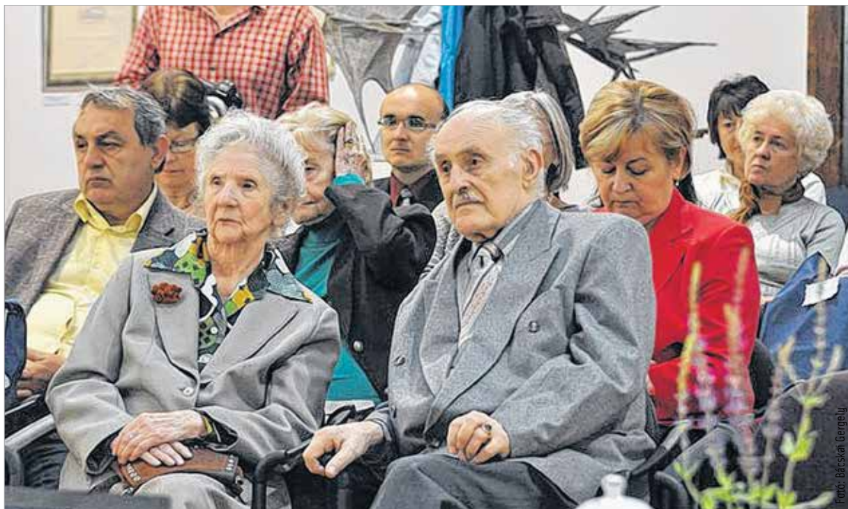
A jubileumi emlékülésen részt vett két egykori patikus is, akik '71 előtt még a működő gyógyszerárban várták a vásárlókat

Az emlékülés kapcsán szervezett patikuskonferenciára az ország különböző pontjairól érkeztek szakemberek a Csók István Képtárba. A konferencia