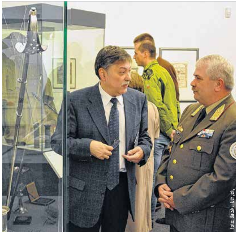
A honvédelem napja alkalmából szervezett programsorozat meghatározó eseménye a „Volt egyszer egy tisztikar” című kiállítás volt, amit a Szent István Király Múzeumban lehet megnézni július 7-ig