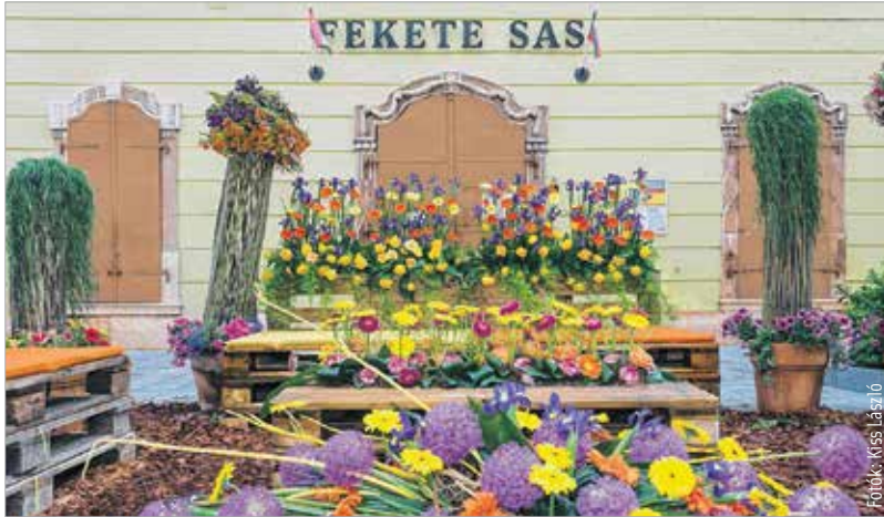
A patikamúzeum előtti tér kompozíciója második helyezést ért el

A helyi virágkötők szinte az egész belvárost virágba borították. Összesen tizenegy kompozíció díszítette a hosszú hétvégén a város főterét és a Fő utcát. Cser-Palkovics András polgármester pénteki megnyitója után a rangsort a látogatók állították fel: a legtöbb szavazatot az Országalma díszítése kapta. Székesfehérváron a helyi virágkötők összefogásának köszönhetően tizenegyedik alkalommal szervezték meg a programot. A Fehérvári Programszervező Kft. célja az volt, hogy a pünkösdi ünnepét hangsúlyozzák, valamint különféle programokkal készültek, hogy a családok kellemes kikapcsolódást találjanak a hosszú hétvégére.