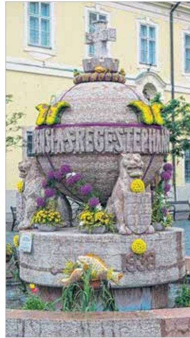
A Budai 66. virágüzlet díszítette Országalma bizonyult a legszebbnek