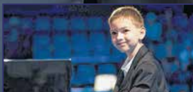
Komolyzene, ahogyan még sosem hallottad 4. oldal