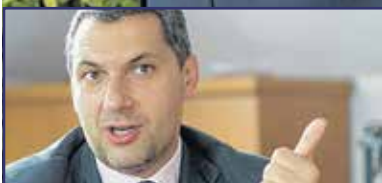
„Székesfehérvár kiemelt helyzetben van” 2. oldal