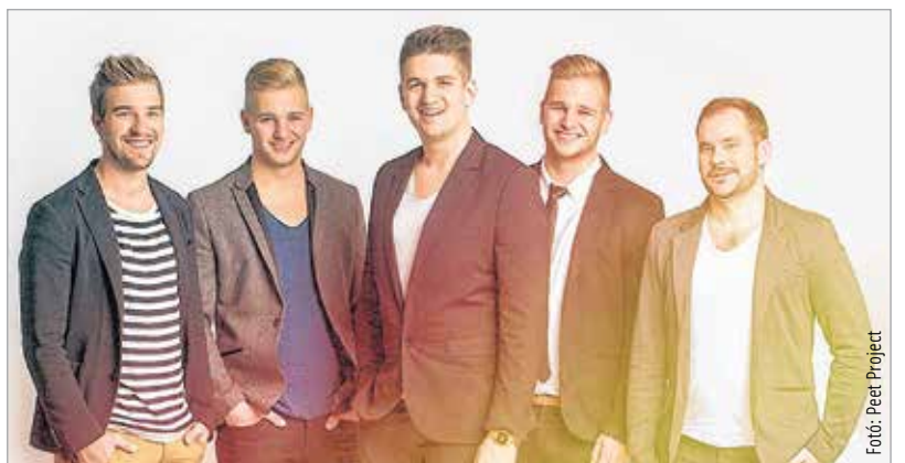
Harmadszor is amerikai turnéra indul a Peet Project, de nyáron Fehérváron is találkozhatunk velük