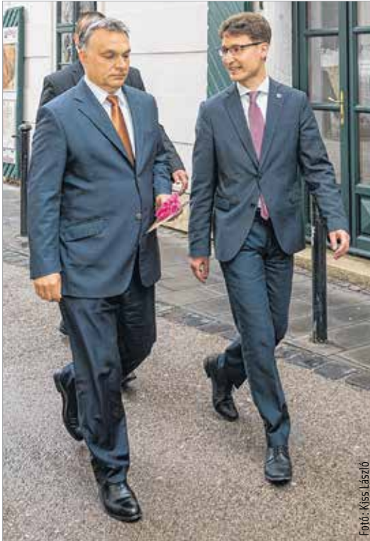
Kis lépés két embernek, nagy lépés Fehérvárnak

A jó ízlés és a törvények is kijelölik, mit tehet egy miniszterelnök a városért. De azon belül mindent meg fogok tenni. A mai megállapodás egyébként egy korrekt megállapodás, ami jár a fehérváriaknak, mert megoldoztak érte. Fehérvár egy olyan város, amely nem hozomra kér, hanem már bizonyított.