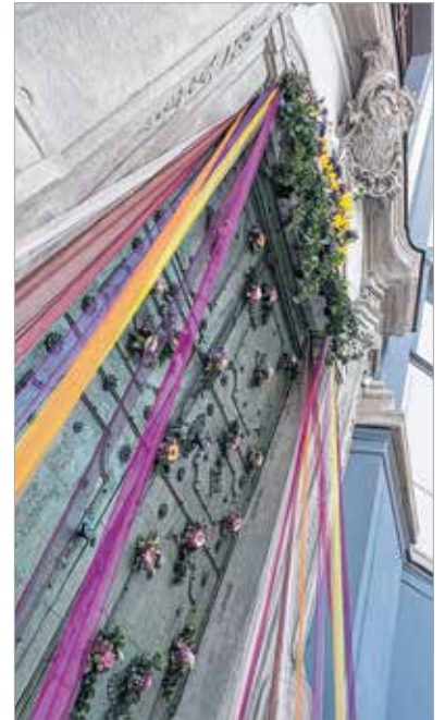
Az Arany János Iskola virágkötői a Ciszterci templomot díszítették, és a harmadik helyezést érték el a színes, szalagos megoldással