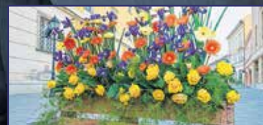
Pünkösdi Virágálom 7. oldal