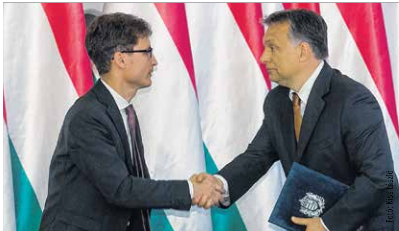
Húsz-huszonöt milliárd forint fejlesztési forrás érkezik Fehérvárra a kormány és a város megállapodása nyomán

Ennek megfelelően az együttműködési megállapodás többek között tartalmazza egy székesfehérvári középiskolai művészeti és sportcampus létrehozását és az ipar munkaerő-igényét szolgáló lakásépítési programot. Sport és üzleti célú repülőteré