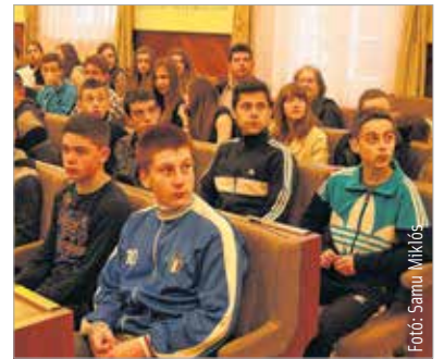
Négy napot töltöttek nálunk a gyulafehérvári Gróf Majláth Gusztáv Károly Teológiai Líceum diákjai és tanárai

A gyulafehérvári Gróf Majláth Gusztáv Károly Teológiai Líceum tizenhét diákja és négy tanára látogatott el a városházra a múlt héten. Az erdélyi intézmény már több mint másfél évtizede ápol testvériskolai kapcsolatot a fehérvári Ciszterci Szent István Gimnáziummal. A Székesfehérvárra látogató vendégek négy napot töltöttek városunkban.