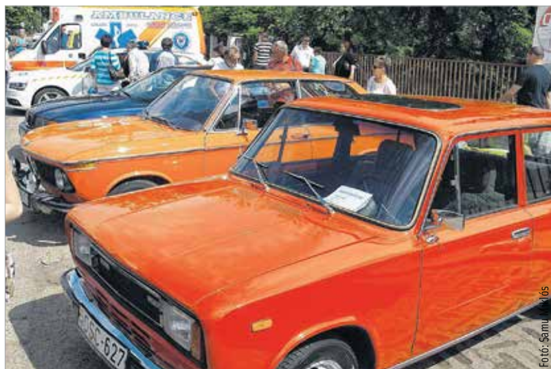
Az autós road show egyik veterán autója: a régi Seat nem véletlenül hasonlít kísértetiesen a Zsigulira