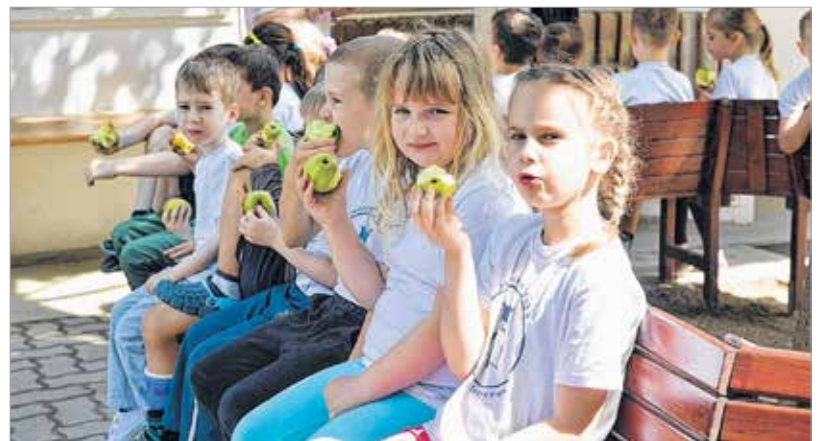
A mozgás után alma dukál – egészség már az óvodában is

városlakók kiemelkedő aktivitására idén is számítottak a szervezők. A Bregyó közti Sportcentrumban, a bölcsődékben, az óvodákban, az általános és középiskolákban, a laktanyában, a polgármesteri hivatalban, a kórházban és az uszodában mozgott az egész város. A rendezvény este kilenckor zárult, és hamarosan az is kiderül, vajon idén is Székesfehérvár volt-e a legsportosabb város.