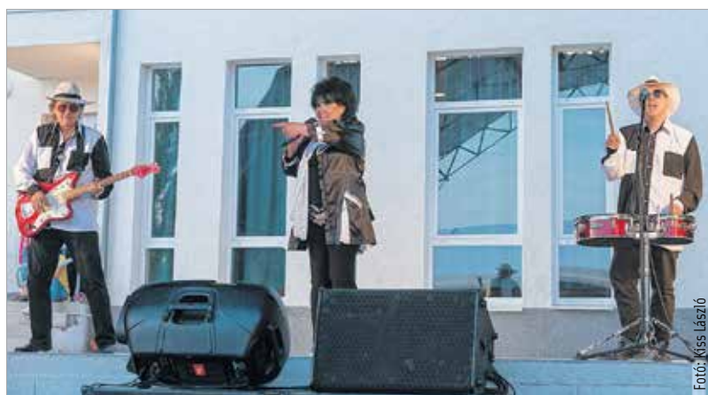
Dolly Roll-koncerttel koronázták a feketehegy-szárazréti majális

repülőalkalmatosságokat, többek között a motoros sárkányrepülőt. Volt hőlégballon-bemutató, és különféle harcászati eszközökkel is megismerkedhettek az érdeklődők.