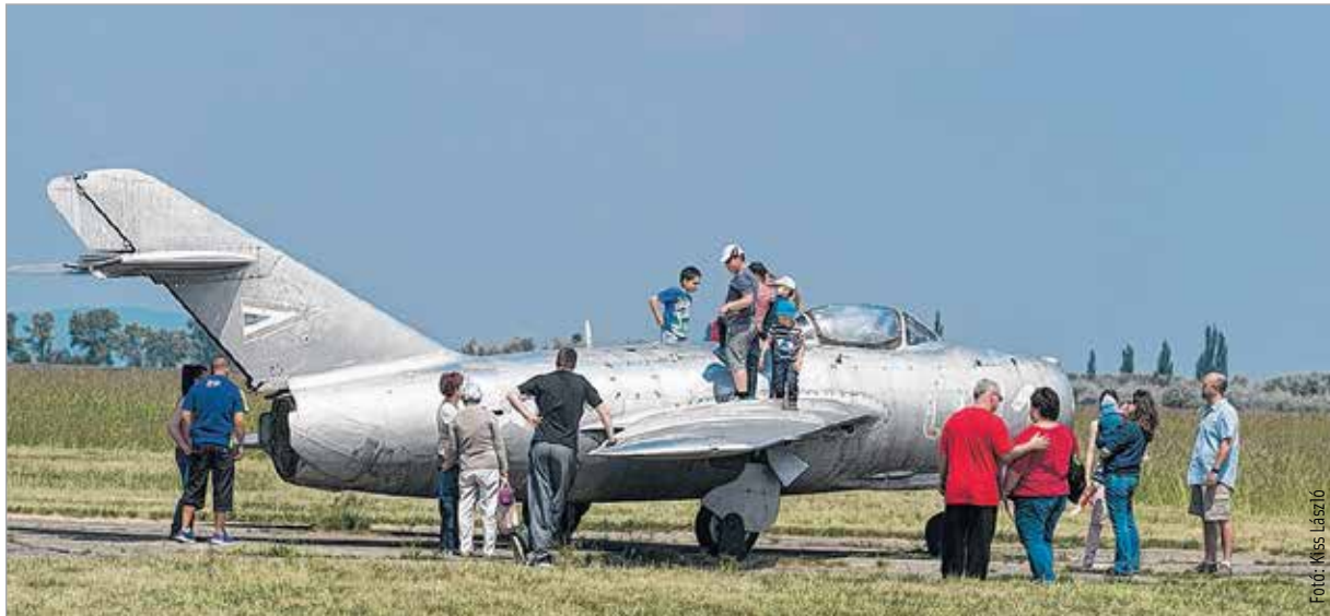
Ha a felszállást nem is, a beszállási engedélyt megadták