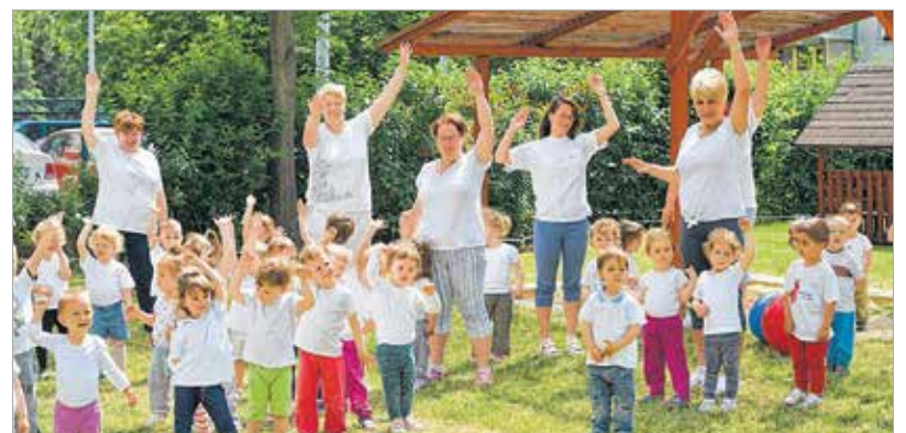
„Szél, szél fújdogálja, eső, eső veregeti...” – játékos zenés torna kicsiknek és nagyoknak