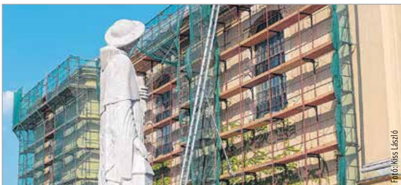
Jövő év tavaszára készülhet el a bazilika