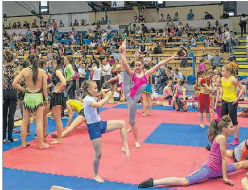
A hétfévi Fit-Kid versenyre közel háromszáz versenyző nevezett