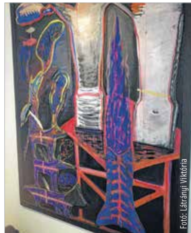
Támad a Fonalkommandó