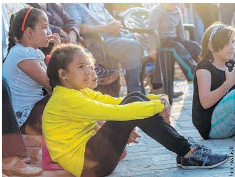
Üres szék nem volt, aki akart, az aszfaltra is ülhetett a szárazréti majálison

címmel. Délután a Székesfehérvári Ifjúsági Fúvószenekar lépett fel, majd a Kákics együttes adott gyerekműsort. Az este a retró jegyében telt, hiszen színpadra lépett a Dolly Roll, hogy ütemet diktáljon a mulatni vágyók lábába. Aki pedig tovább