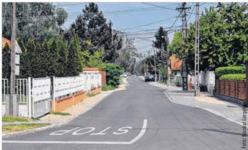
Megújult a Száva, a Dráva és a Bodrogi utca

együtt készült el. Tizenöt éve húzódó probléma oldódott meg az utak felújításával. Minden igényt kielégítő szakaszok készültek el, ezek az elkövetkezendő két évtizedben jó közlekedési lehetőséget biztosítanak a környéken élőknek. Az egész beruházás 1.2 milliárd forintba került, és teljes egészében európai uniós támogatásból valósult meg. Ebből a három utca teljes újrateremtése több mint négyszázmillió forintot tett ki. A három felújított utcában a járdák térkövesek, 3680 négyzetméternyi burkolatot raktak le a szakemberek. Tizenháromezer négyzetméteren aszfaltoztak, 7900 méternyi szegélykővet helyeztek le, és mintegy hatszáz méteren csapadékvíz-elvezető csatorna épült.