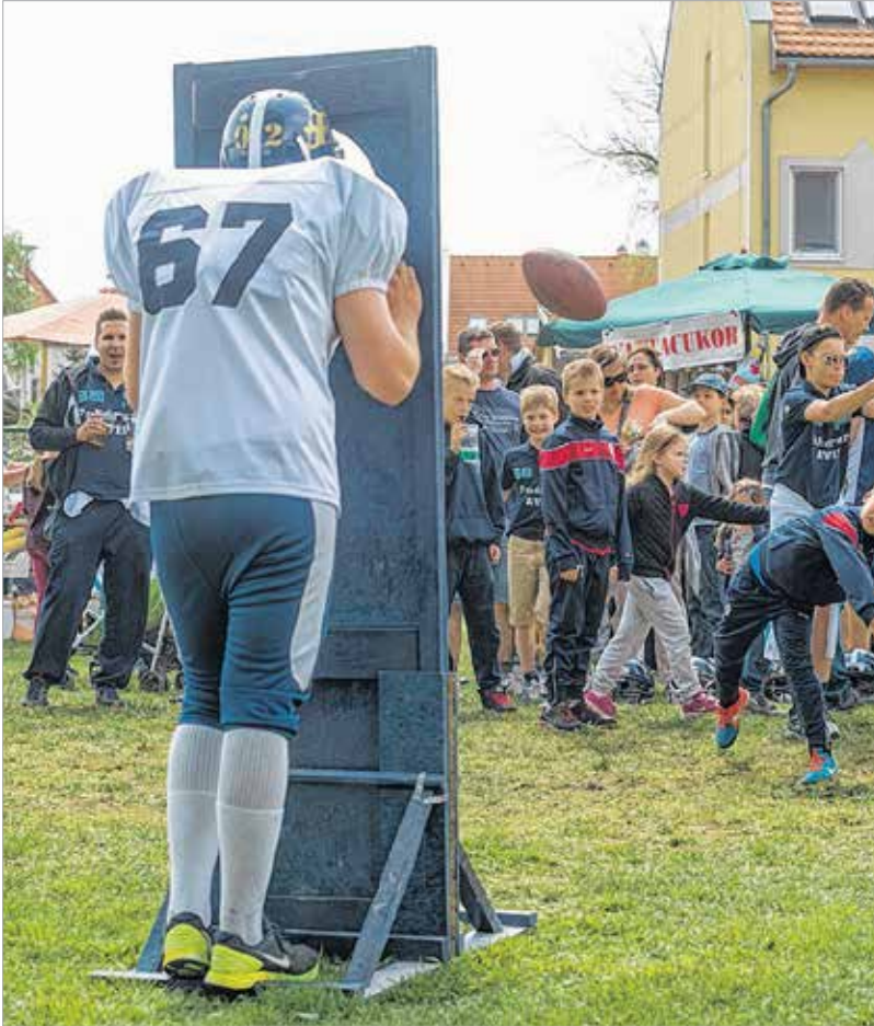
A Fehérvár Enthroners amerikaifoci-csapat most is valami különlegessel készült: ezúttal a játékosokat lehetett célba venni a tojáslabdával