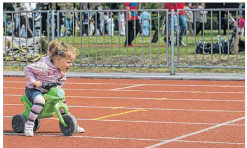
Vigyázz, kész, rajt! – a kicsik is keresték a kihívásokat