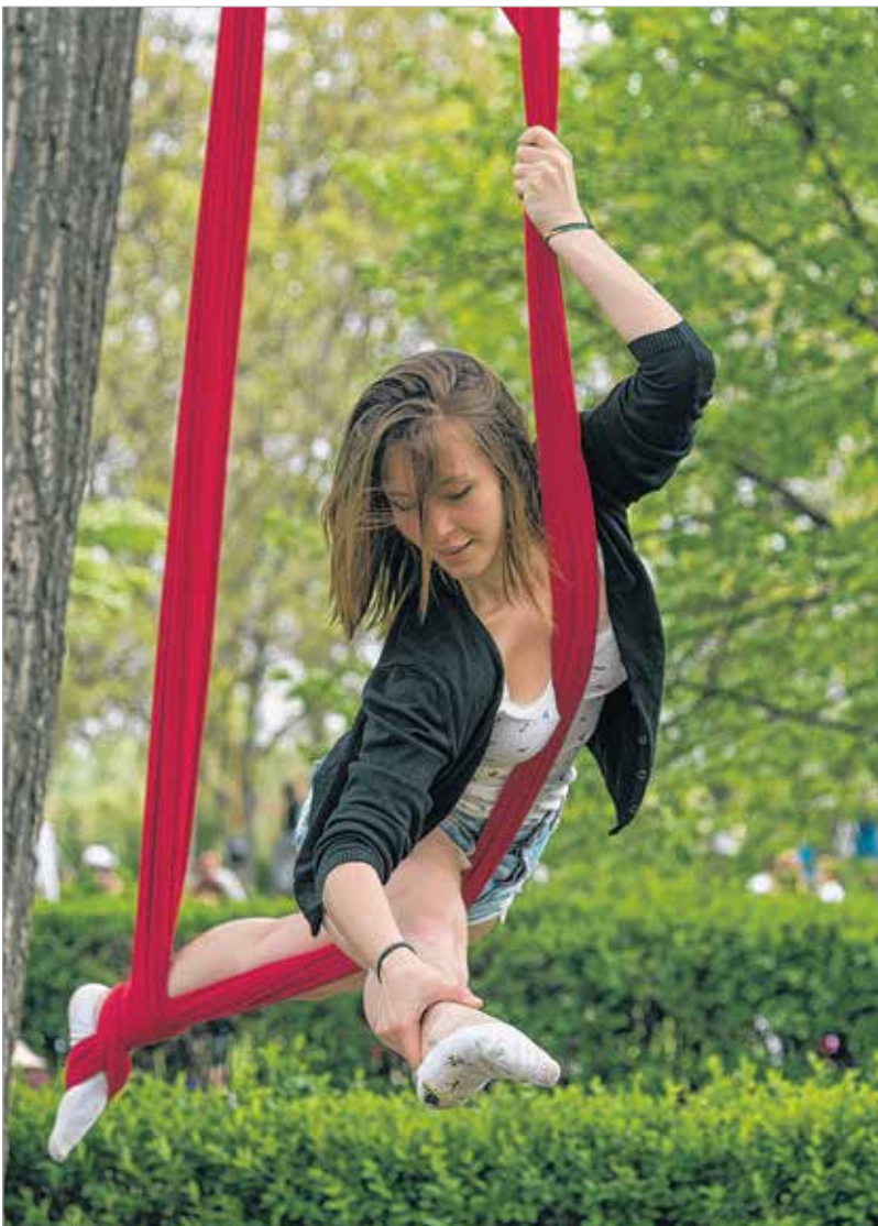
A flyfitness-bemutatón a szép hölgyek mellett a káprázatos produkciókban is gyönyörködhetett a nagydémű