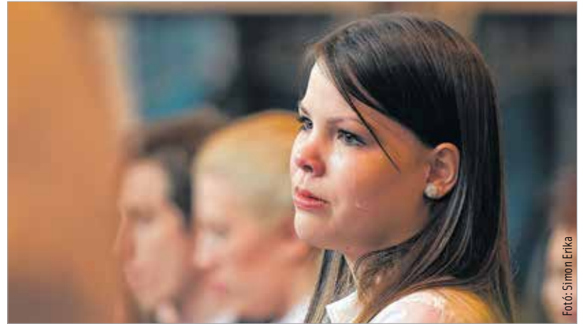
Utoljára együtt a hunyadi iskolapadban