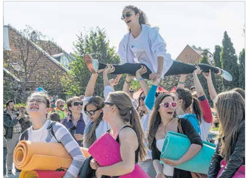
A szinkronúszó lányok vagánysága városszerte ismertté vált, köszönhetően látványos bevonulásuknak