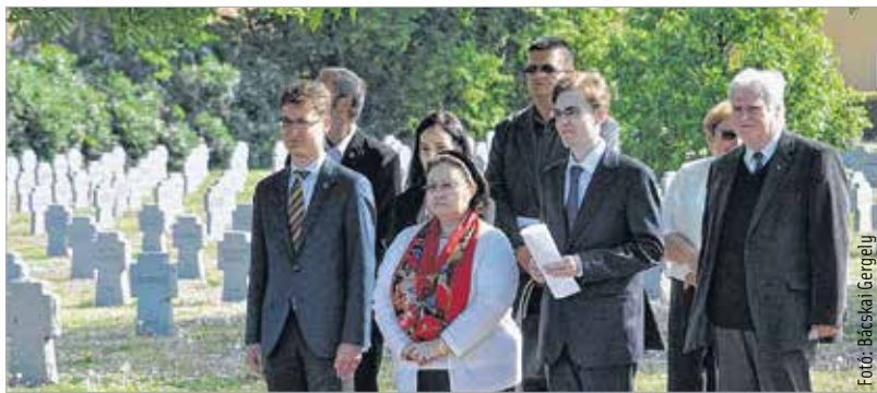
A konferencia előtt megkoszorúzták az első világháborús olasz katonák sírját a Szentlélek temetőben

emlékezni a múltra. A nagykövet felhívta a figyelmet arra is, hogy Európa népei rengeteg változattal, haladtak előre az elmúlt száz év alatt, de további fejlődés szükséges, ezért is fontos a közös emlékezet. A konferenciát követően a Zichy ligetben, a Magyar Királyi 17. Honvéd Gyalogezred emlékművénél is koszorúkat helyeztek el. Az 1915-ös esztendő komoly változást hozott az első világháború menetében: a központi hatalmakkal szövetségi viszonyban álló Olasz Királyság május 23-án hadat üzent az Osztrák-Magyar Monarchiának. A döntés senkit sem lepett meg, hiszen az olaszok számos okból sokkal inkább az antant irányába húztak. A szomszédos Ausztria-Magyarországgal szemben területi követeléseik voltak, és pozíciókat építettek ki a Balkánon. A gyors hadi sikerek helyett az Isonzó völgyében, Doberdónál és a Dolomitoknál több évig tartó állóháború alakult ki.