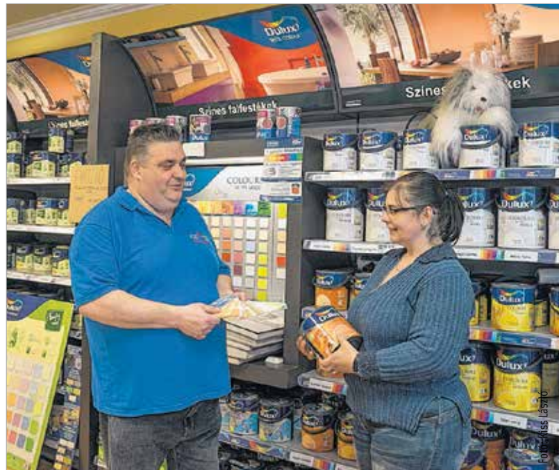
Újra trend a pasztellszínű fal, és egyre kedveltebbek a szürke különböző árnyalatai