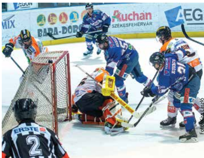
Gólhelyzet a Graz ellen – győzni aztán Linzben sikerült