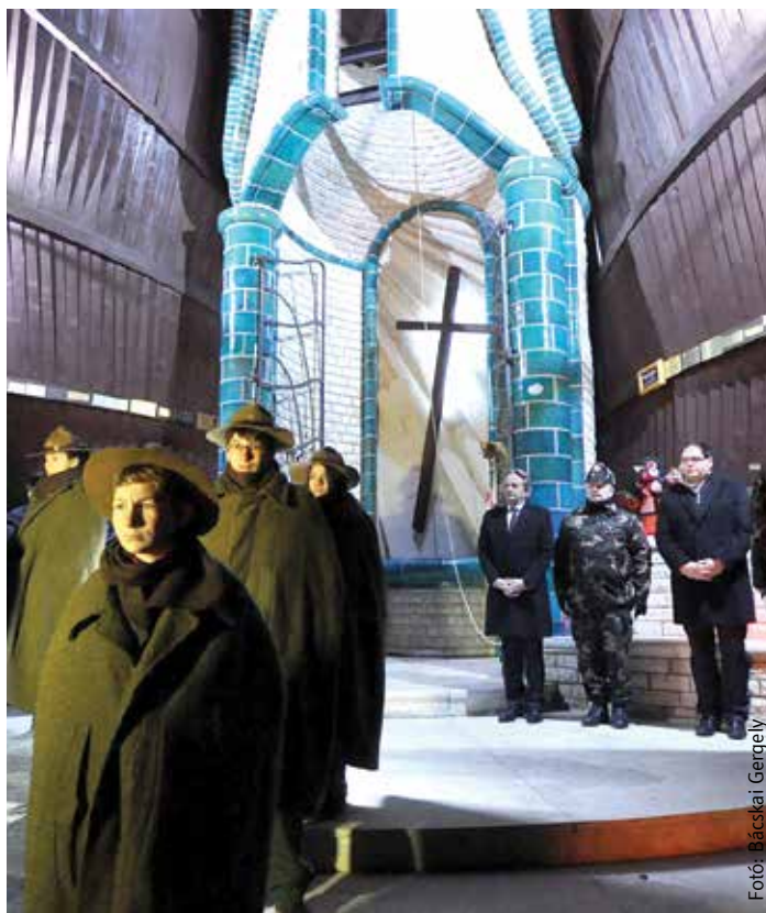
A II. Magyar Hadsereg emlékeit idézték meg a Mészeg-hegyen