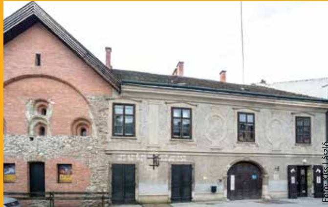
Az Oskola utca 6. szám alatti épület is a SZÉPHŐ kezelése alatt áll, ezért itt is érvényes a megújult elektronikus dokumentumkezelés, ahol a tulajdonosok bármikor online betekintheznek társasházuk hivatalos irataiba

Az osztályvezető a legfontosabb célként fogalmazta meg az ügyfelek elégedettségének elérését. Ennek érdekében elsőként fel kellett mérni Székesfehérvár lakóinak az igényeit. A változó piaci környezethez való alkalmazkodás mellett a működés hatékonyságát, minőségét javító in-