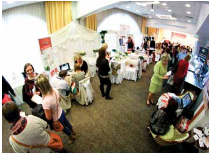
A hétvégén immár tizenegyedszer nyitja meg kapuit a házasulandók előtt a Novotel

Városunkban már hagyománnyá vált, hogy az év első hónapjaiban szervezik az esküvő kiállításokat. Nem véletlenül döntenek így a szervezők évről-évre, hiszen ilyenkor még elegendő idő áll a jegyespárok rendelkezésére ahhoz, hogy a javarészt nyáron rendezett menyegzőket zökkenőmentesen megszervezhessék. A legközelebbi fehérvári esküvő kiállítás január 24-25-én várja látogatóit, ahol ötvenkét kiállító standjával találkozhatnak az érdeklődők mindkét nap reggel tíz órától. Az idei évben ezer-ezerháromszáz érdeklődőre számítanak a szervezők. A színpadi programok mellett az idén immár negyedik alkalommal kerül sor a Miss Ara 2015 döntőjére is, melynek során az esküvőjükre készülő lányok gyönyörű ruhakölteményekben, csodás frizurával és sminkben versenyeznek a legszebb menyasszonynak járó címért és értékes nyereményekért.