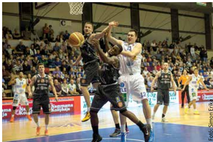
Kettő az egy ellen – a pécsiek csapatként küzdöttek

vár), könnyen elképzelhető, még mélyebb gödörből pislogunk kifelé hamarosan. A rájátszásra akkor lesz esély, ha a középszakaszban (nem a felsőházban, mint eddig mindig) két csapatot is megelőz az Alba. Addig még sok idő van, bele lehet nyúlni a keretbe. Kérdés, az a bizonyos győztes karakter megtalálható, kialakítható-e?