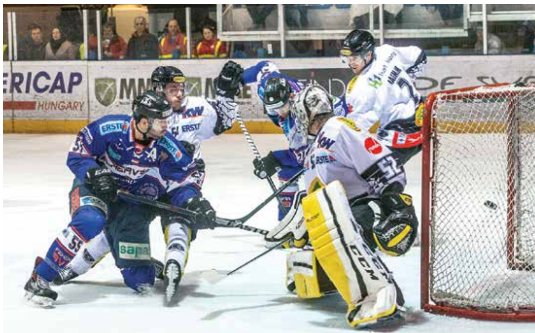
A Dornbirn csapatával kétszer játszottak Kovácsék, vereség után győztek