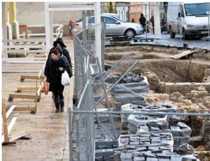
Kidöntötték a Bazilika kerítését – az ittas fiatalokat perceken belül elfogták