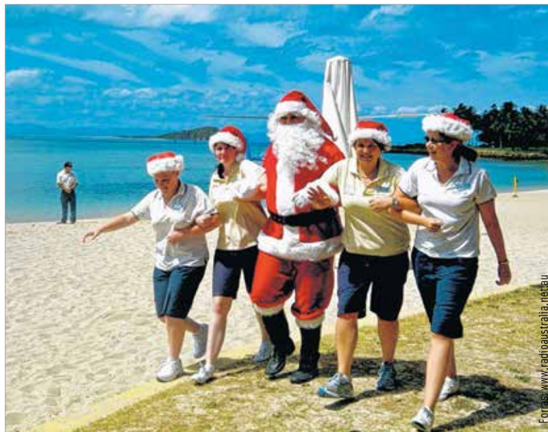
Ahová naptejet is vinni kell: karácsony az ausztrál tengerparton

Karácsonykor a svédek heringet, barna babot és tejberizst esznek.