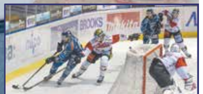
Indul a hokibuli 15. oldal

Áldott, békés karácsonyt és boldog új esztendőt kíván Székesfehérvár Önkormányzata!