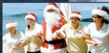
Így ünneplik a karácsonyt a világban 8-9. oldal