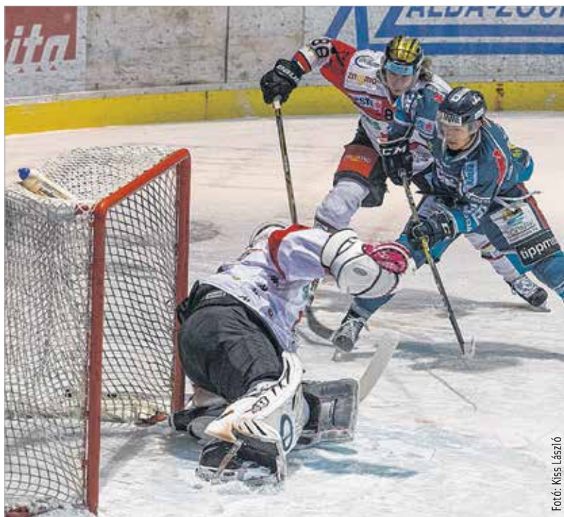
A Znojmo ellen igen hatékony volt a fehérvári támadógépezet

A formát és a mutatott játékot elnézve azt mondhatjuk, hogy a Fehérvár jelen pillanatban bármelyik riválisát képes „elkapni”, amire szükség is lesz az alapszakaszból hátralévő tizenegy találkozón. A jelenleg a kilencedik helyen álló csapatot hét pont választja el a felsőházi rájátszást jelentő hatodik helytől, így fontos lenne, hogy az ünnepek alatt is szállítsák a győzelmeket a fehérváriak. Márpedig unatkozni nem fognak