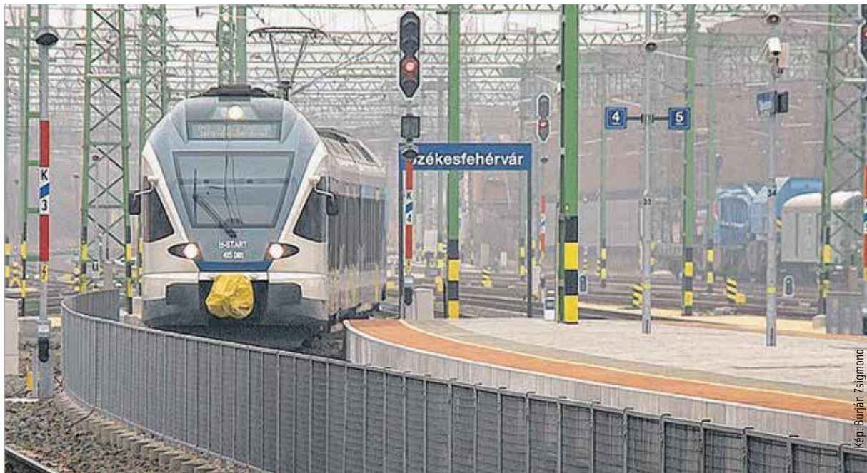
Az állomáson új felsővezeték létesült, a Mártírok útján zajvédő fal épült, és új tengelyszámálós vonatérzékelésű elektronikus állomási biztosítóberendezést létesítettek nyolcvankilenc központi állítású váltóval. Moha és Börgönd felé pedig ellenmenetet és vonatutolérést kizáró berendezést telepítettek.

meg az állomáson. Az intermodális csomópont várhatóan két-három éven belül kialakulhat, aminek következtében az állomás előtti tér az autóbusz-megállóval együtt megszépülhet, valamint a parkoló is bővíthet, hogy egy tel-