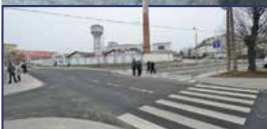
Befejeződött a Varga-csatorna felújítása 2. oldal