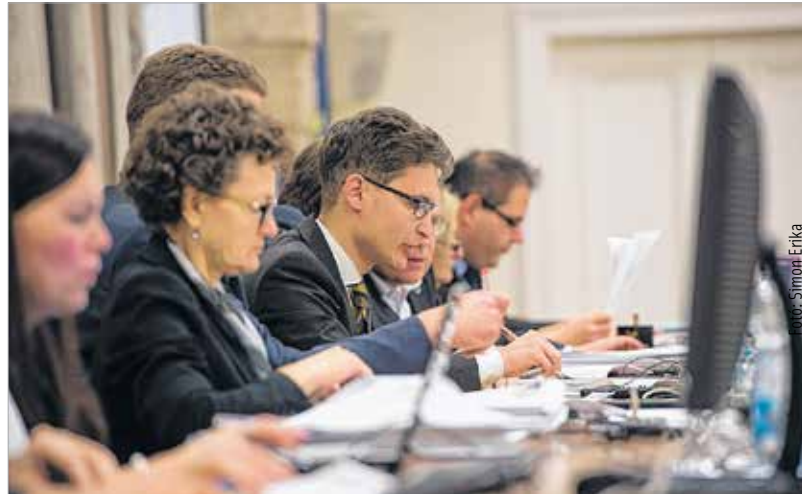
Jövőre áttekinti a testület a parkolási rendszert