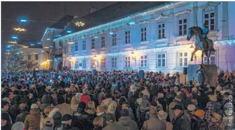
Mint augusztusban: lépni alig lehetett a Városház téren

karának két dalával kezdődött. Cser-Palkovics András polgármester ünnepi köszöntőjében reményét fejezte ki, hogy az idei adventi időszak az egymásra való odafigyelésről és a szeretetről szól, majd áldott, békés ünnepeket kívánt. Ezt követően Spányi Antal beszédben elmondta: a karácsonyi ajándék nem az, ami szépen becsomagolva a fa alá kerül, hanem a szívből áradó szeretet, ami egész életünket kell, hogy elkísérje. A köszöntők után az adventi koszorú utolsó gyertyáját Cser-Palkovics András és Spányi Antal közösen gyújtották meg, majd folytatódott a kisangyalok éneke.