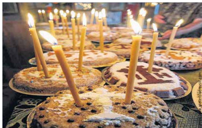
Nincs görög karácsony díszes kenyér nélkül

Az ünnepi finomságokat julmustal, egy vízből, komlóból, malátából és fűszerekből készült alkoholmentes üdítővel öblítik le. A gyerekek 24-én este kapják meg az ajándékot, amit Jultomten, a svéd mikulás és egy manó hoz. Reggel a család közösen elmegy a templomba, ami tele van égő gyertyákkal.