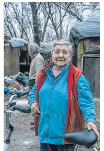
Jó helyre került a tricikli

A nappali, ahol esténként gyertyával világítanak