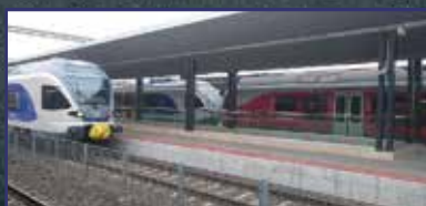
A vasútállomás már az utasoké 3. oldal