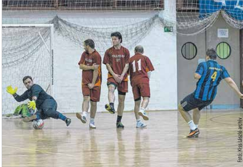
Mozgalmas jelenetekben idén sem lesz hiánya a VOK parkettjén

Egy nappal később megkezdődik a huszonnégy csapatos Masterplast-kupa, mely ebben az időszakban talán a legerősebb mezőnyt felvonultató teremtorna az országban. December 30-án este lesz a döntője, addig pedig rendeznek még női foci- valamint