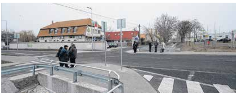
Az új híd és a megépült átkötőtűt a Kelemen Béla út és a Palotai út kereszteződését tehermentesíti

is megépültek, ennek részeként egy régen várt átkötőtűt és az ahhoz kapcsolódó csomópontok is elkészültek.”