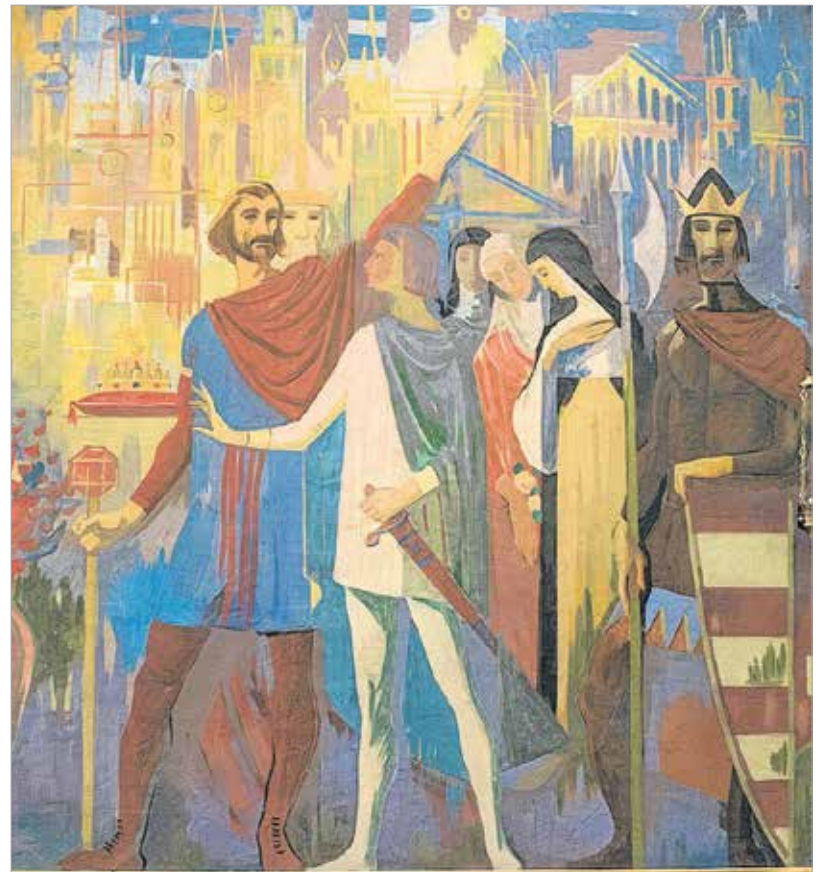
A magyarországi szentek

szülőföldemé.” Kozma Imre atya, Prokop Péter közeli jó barátja és tisztelője „emberközelen szemlélt evangéliumként” jellemezte képeit, melyek mindig nyitottságot, jóságot sugallnak, és párbeszédre sarkall keresztény és nem keresztény embert egyaránt.