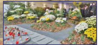
Méltó emlékezés szeretteinkre 11. oldal