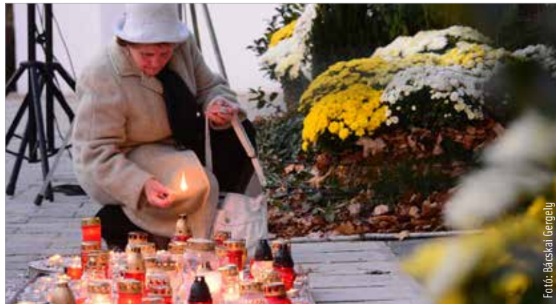
A gyertyafény az örök világosságot jelképezi

város vallási felekezetei: a katolikus, a református, az evangélikus valamint a baptista egyház.