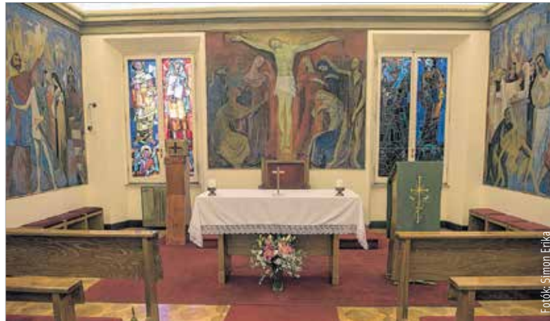
Az intézet kápolnája Prokop Péter és Hajnal János alkotásaival

Mindszenty József hercegprímás pere és a magyarországi egyházüldözés után a kommunista diktatúra megtiltotta a magyar értelmiségiek és a papok római útjait. A római intézet azonban tovább működött, mert az intézet vezetői nem tértek vissza Magyarországra, nem csatlakoztak az