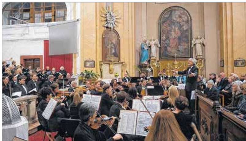
A Requiem fensége mindenkit megérintett