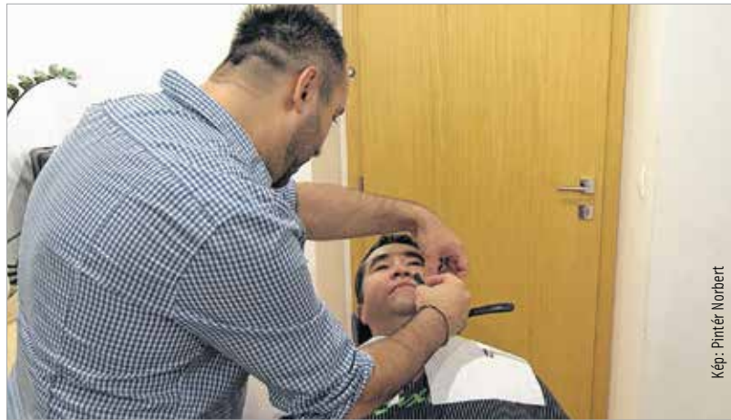
Középpontban a bajusz és az urak egészsége