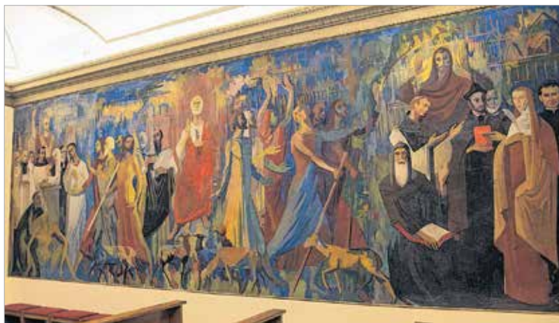
Szent Péter az apostolokkal és a hívőket jelképező bárányokkal