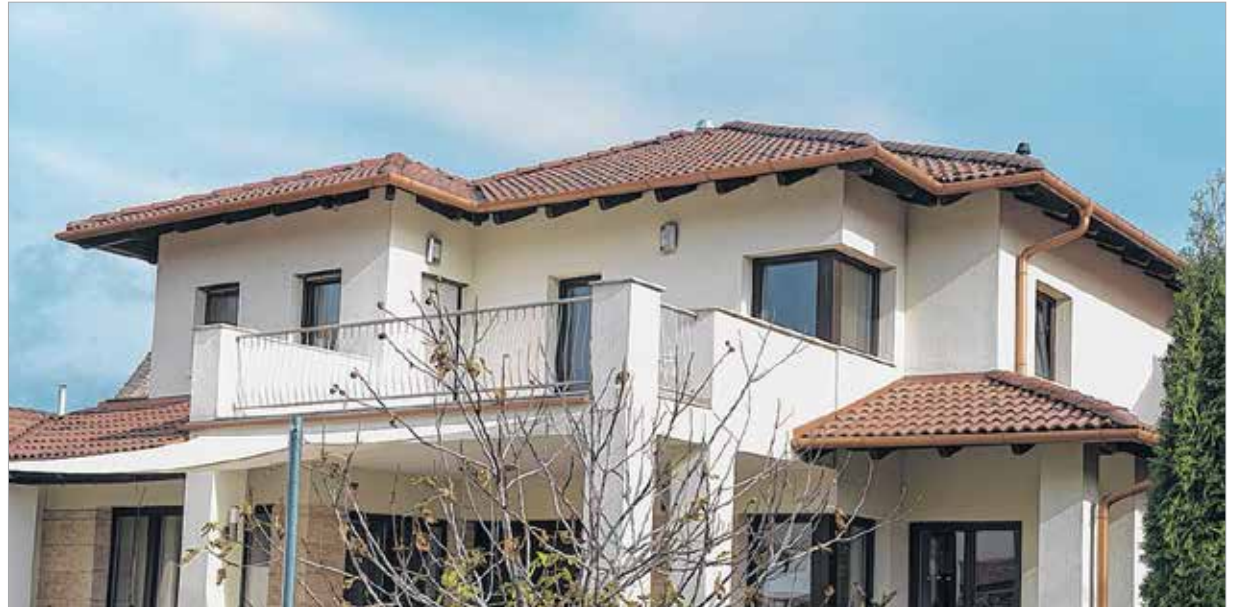
A betont már az ókorban is használták

A betont három természetes alapanyag: homok, kő és víz alkotja. Több ezer éves múltra tekint vissza. Kr. e. 2000-ben az ókori görögök már használták az égetett mészt és a homok keverékét, melyhez a rómaiak vulkáni hamut is keverték. Kevesen tudják, hogy a kétezres éves Pantheon kupolája is betonból készült.