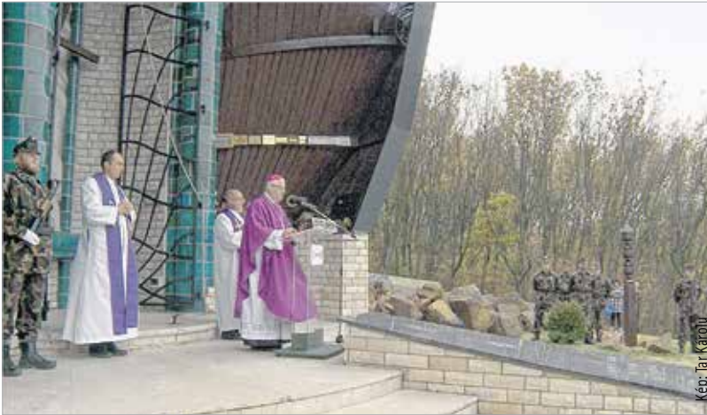
Az emlékkápolna volt az első hely Magyarországon, ahol kegyelettel lehetett emlékezni a hősi halált halt katonákra

január 12. és február 9. között a Don-kanyarban megsemmisült. Azok, akik a hazától távol, mint hősi halottak haltak meg, s akik most idegen földben, talán közös sírban várják a föltámadást, azoknak a sírját nem tudjuk felkeresni – kezdte gondolatait a megyés püspök. A Mészeg-hegy alkalmas hely arra, hogy együtt emlékezzünk meg a Don-kanyarban vagy bárhol máshol meghalt magyar katonákról, a hősekről, akik az országért, a nemzetért és miértünk harcoltak, és adták a legtöbbet: saját életüket.