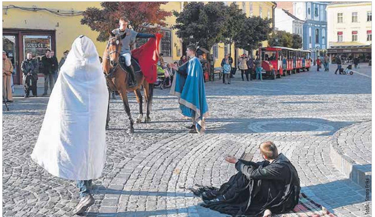
Szent Márton legendáját a ciszter diákok idézték meg

est koncerttel búcsúzzunk. A célunk ma nemcsak az, hogy a szent emléket felemléssük, hanem szeretnénk minél több embert arra sarkallni, hogy nyissa meg a lelkét, és tevékeny módon segítsen a rászorulóknak, Szent Márton és a többi szent példájára.” Az emlékév szeretetteljes méltóságra, a Savariában született legenda életének, útjainak különleges állomásai, az elesetteknek, a rá-