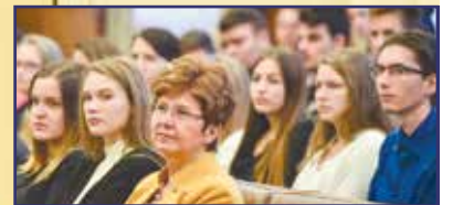
A szabadság narratívái 4. oldal