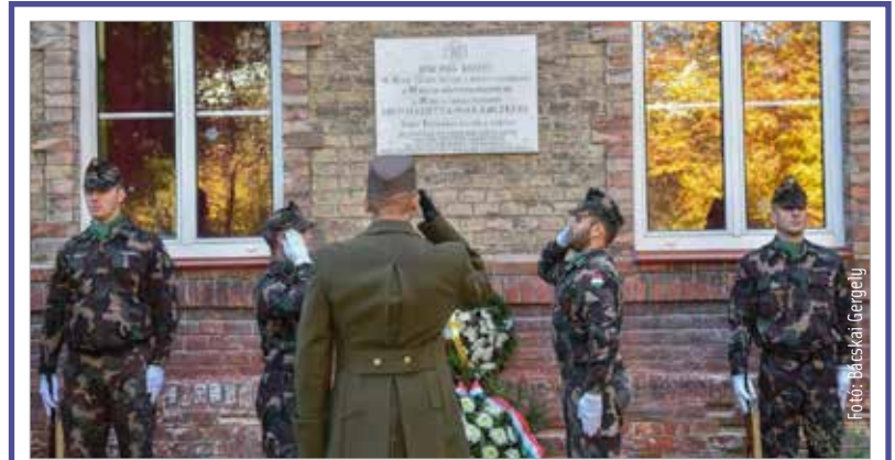
A halottak napja alkalmából városszerte több helyszínen és időpontban tartottak megemlékezéseket. A város és a megye önkormányzata valamint a Honvédség Összhaderőnemi Parancsnoksága is koszorúzással emlékezett meg a fehérvári katonatemetőkben nyugvó hősi halottakról.

nem emlékeznek meg. A 9. század óta kötelező ünnep, az üdvözült lelkek emléknapja, az egyháztan szerint a megdicsőült egyház ünnepe. A katolikus egyház tanítása szerint ezen a napon az élő és az elhalt hívek titokzatos közösséget alkotnak. Ilyenkor halottainkra emlékezünk, hozzátartozóink sírjánál gyertyát gyújtunk, mely az örök világosságot jelképezi. Halottak napja előestéjén immár évek óta hagyomány, hogy Székesfehérvár közösen emlékezik az elhunytakra. A Béla úti köztemetőben idén is közös megemlékezést tartanak a