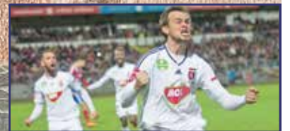
Jó, de lehetne jobb! 15. oldal