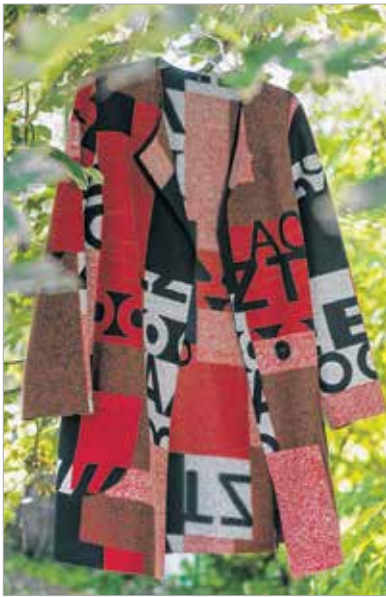
A vörös örök divat, de idén a játékos oldalát mutatja

Törtfehér, keki és barnás-vöröses árnyalatok uralják a ruhaboltok polcait – ezek az ideai ősz divatszínei. „A földszínek melegséget, nyugalmat, kiegyensúlyozottságot