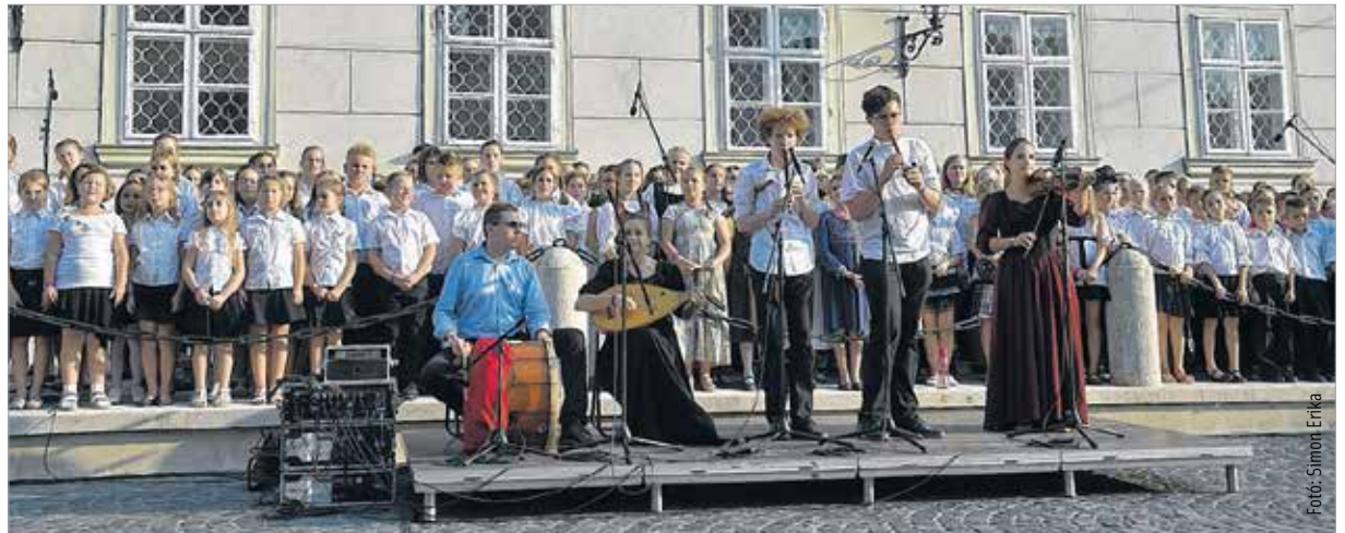
A magyar népdal hagyományai az ifjú szívekben élnek