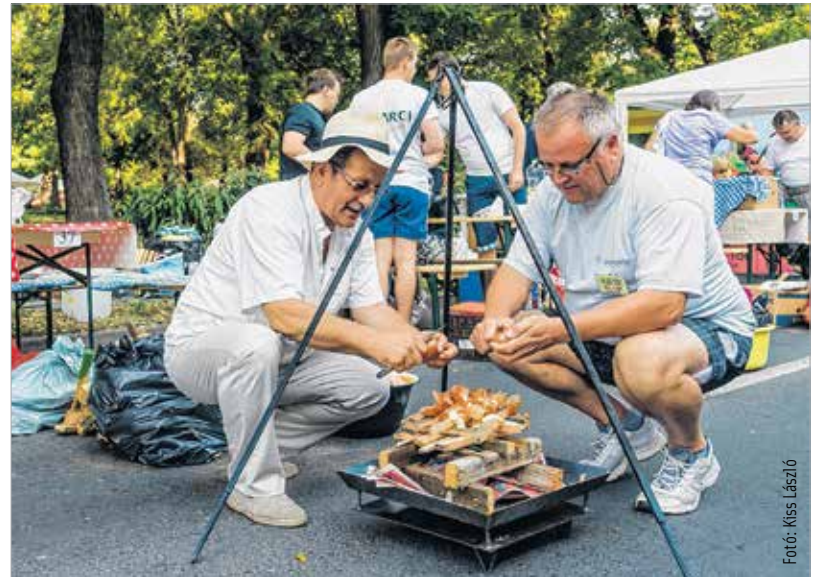
A hagymahéj alternatív hasznosítása

A Sipi-emlékkupa tulajdonosa idén a 61-es sorszámú asztaltársaság lett, míg a zsűri különdíját a Pulyka 152-es asztalnál főző csapata