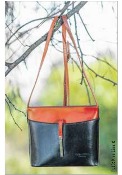
A klasszikus eleganciával nem lehet mellőzni

Nadrágban is nagy a választék, annak ellenére, hogy a nyáron egyre népszerűbb nadrágszoknyákat az őszi kollekció már nem tartalmazza. Van viszont helyette kövekkel díszített, alakkövető nadrág. Továbbra is hódít az egyenes szárú, és visszatérő divat lett a kissé bővülő trapézszárú nadrág. Jó hír, hogy ma már nemcsak szezon végi, de szezon eleji akciók is vannak, így aki kedvet kapott a vásárláshoz, nézzen körül az akciókat kínáló boltokban!