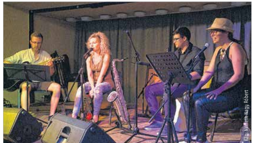
A MissMister's zenekar nagy sikert aratott

Kodály Zoltán országában mindig lesz népdal, amíg világ a világ. A szülők és a tanárok felelőssége, kötelessége, hogy ez így történjék.” Kallós Zoltán, a magyar népi kultúra erdélyi atyja mondása,