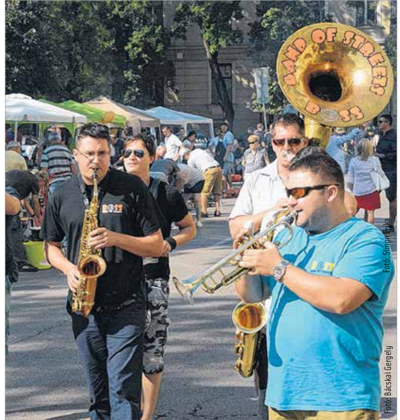
Zenéből sem volt hiány

A főzésnél alapkövetelmény, hogy a lecsó ne legyen pempős, ne ússzon a zsírban és ne legyen ehetetlenül erős. A tökéletes lecsó Mikszáth szavaival élve olyan, mint a felbőszült bika vére: tűzpiros, tűzforró, enyhén csípős, jó szaftos.