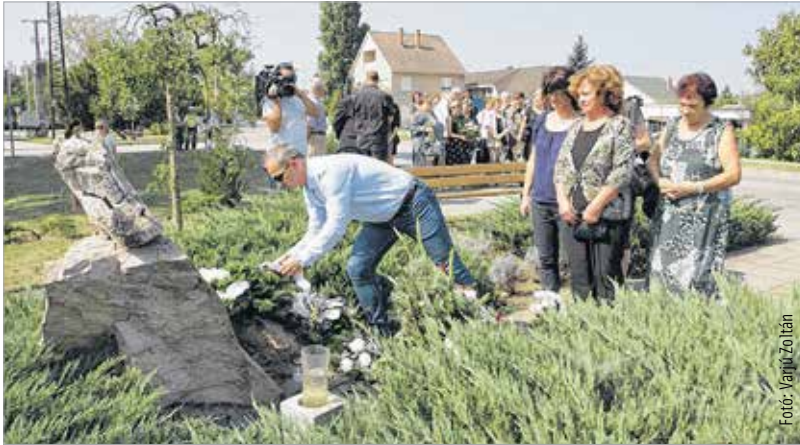
Az emlékezők, hozzátartozók virágokkal, koszorúkkal borították a baleset helyszínén felállított emlékművet

Az áldozatok között nyolc gyermek is volt, köztük egy kilenc hónapos csecsemő, aki huszonegy éves édesanyjával együtt halt meg a balesetben.