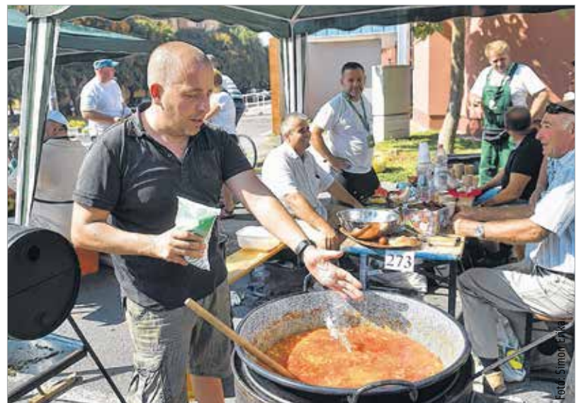
Egy marék, meg még egy marék, és akkor lesz pont jó!