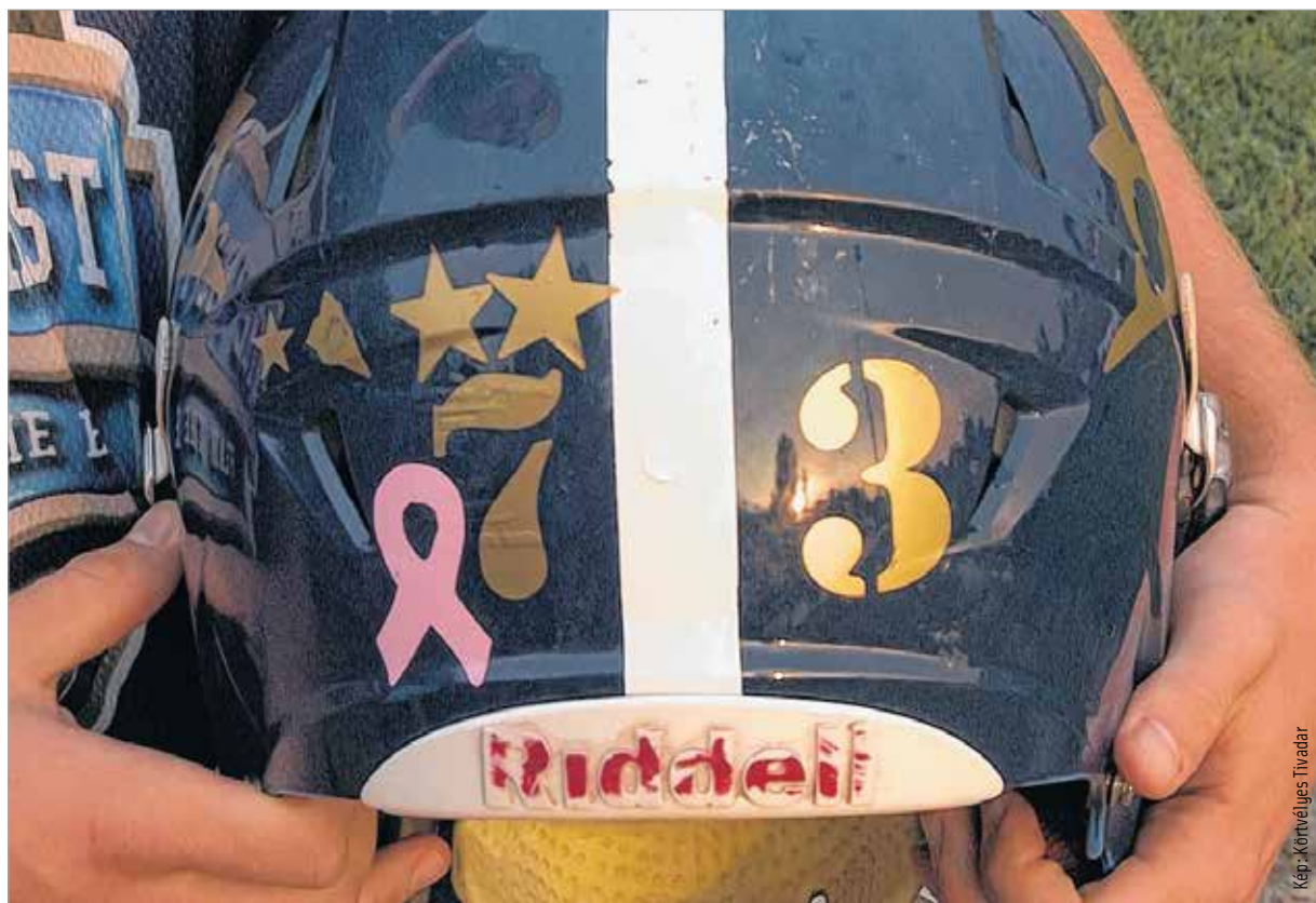
A Fehérvár Enthroners amerikaifutball-csapat játékosainak sisakjára is felkerült a rózsaszín szalag

A mellrák elleni harc jelképe a rózsaszín szalag, amit Evelyn Lauder (1936-2011) és újságíró barátja, Alexandra Penney vezetett be 1993-ban.