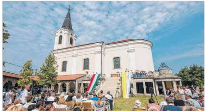
A Segítő Szűz Mária-kegytemplom minden évben több ezer zarándokot hív közös imádságra

Szűzanya tiszteletére. A király és fia, Imre herceg többször is elzarándokoltak ide, de járt Bodajkon Szent Gellért, sőt Szent László király is, aki 1090-ben az Al-Duna felé igyekvő, Székesfehérvárt ostromló pogány tatár csőcseléklet egy keresztvetéssel futamította meg. Legalábbis így emlegeti a legenda. II. Géza idején kereszties lovagok gondozták a kegyhelyet, majd a török megszállók – ahogy másutt – itt is mindent tönkretettek. A törökök kiverése után a kapucinus rend építette újjá a kegyhelyet, és