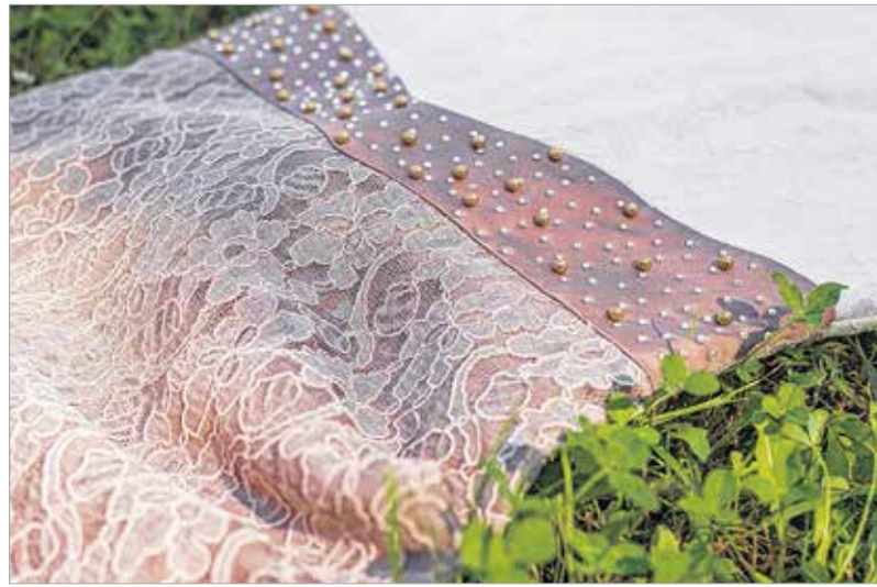
Csipke és kövek – nem múltak el a nyárral