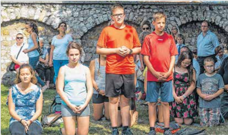
A zarándokudvar a hálaadó imádság helye is

vetette meg a Dunántúl egyik leglátogatottabb kegyhelyének alapját. Ebben az időben épült a Szent István-kápolna alapjaira a ma is álló barokk kegytemplom, és a ma is látható szép freskók egyidősek az építménnyel. A műértők szerint ezek festéséhez némi köze volt a nagy osztrák barokk művészeknek, Maulbertschnek is. Az új barokk templomba Szent István felesége, Boldog Gizella királyné szülővárosából, Passauból érkezett az oltárkép,