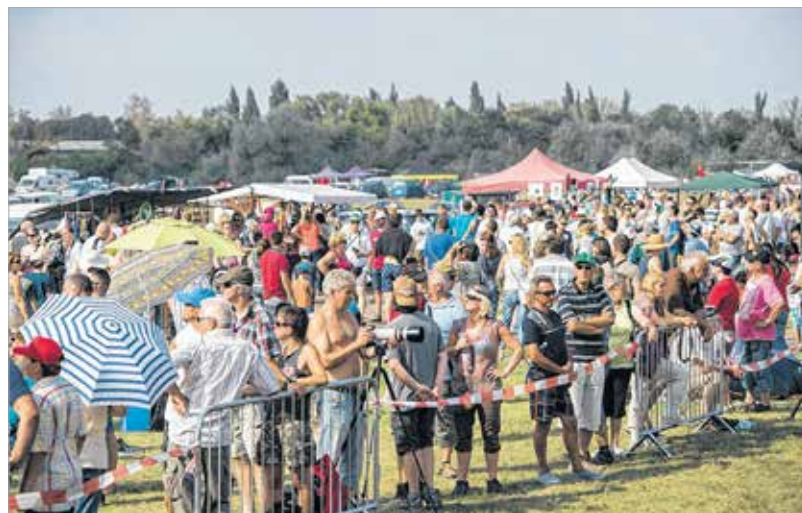
Tízezer látogató köszöntötte a százéves fehérvári repülést