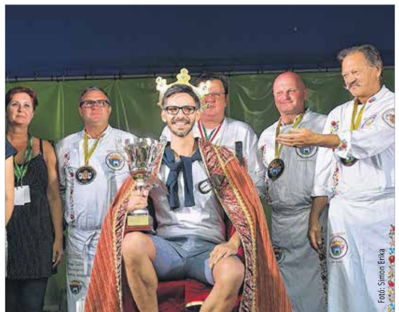
Íme, a lecsókirály!