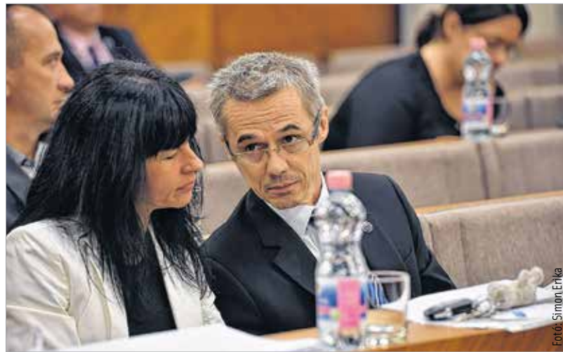
A képviselők arról is döntöttek, hogy a fehérvári diáksportot az idei tanévben összesen tizenöt millió forinttal támogatja a város