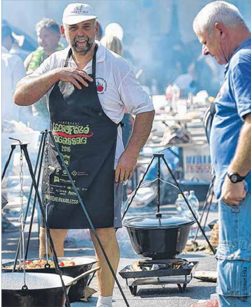
Füst nélkül nincs lecsó