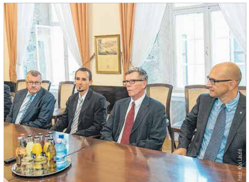
Jövőre lesz hatvanéves a testvérvárosi kapcsolat Kemi és Székesfehérvár között

köszönetet mondott a vendéglátásért és az élményekért, amiben a Lecsófőző Vigasságon és a börgöndi légi paradén volt részük. Elmondta, hogy jövőre hatvanéves lesz a két város közötti barátság, ami jelentős időszak mindkét város életében. Reményét fejezte ki, hogy a következő hatvan évben is folytatódik ez a szoros kapcsolat. A látogatás alkalmával a finn delegáció újabb meghívást tolmácsolt Székesfehérvár önkormányzatának abból az alkalomból, hogy jövőre fennállásának századik évfordulóját ünnepli a Finn Köztársaság.