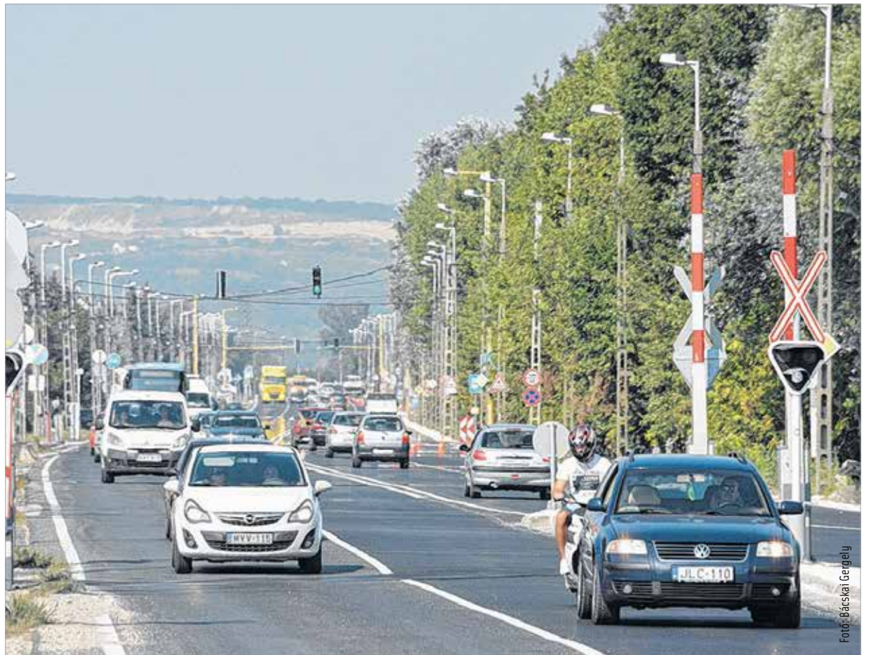
Az Új csóri út belső szakaszán mintegy harminc százalékkal csökkent a forgalom

Július közepén nyílt meg a nyugati elkerülő út III. üteme a forgalom előtt. A hét kilométer hosszú, új nyomvonalon megépült kétszer két sávú út a biztonságosabb és gyorsabb közlekedést szolgálja: csökkent a tranzitforgalom, mérséklődött a zajterhelés és a dugók. A Magyar Közút Nonprofit Zrt. Fejér Megyei Igazgatósága forgalomszámláló műszert telepített az új elkerülő Veszprém felőli csomópontjához az elkerülő forgalmi adatainak és az Új csóri út forgalomváltozásának elemzése céljából. Az Új csóri út belső szakaszán – az elkerülő forgalmi adataival összevetve – a forgalom mintegy harminc százalékkal csökkent, a külső, városhatáron kívüli szakaszon a forgalomcsökkenés ötvenhárom százalékos. Az utatadás óta jelentősen kevesebb a tehergépkocsi is: a forgalomcsökkenés a belső szakaszon negyven százalékos, a külsőn negyvenkilenc százalékos jelent. A Magyar Közút Nonprofit Zrt. tapasztalatai alapján a forgalomátrendeződéssel hosszabb időszak alatt történik meg, ezért hosszú távon még jobb eredmények várhatók.