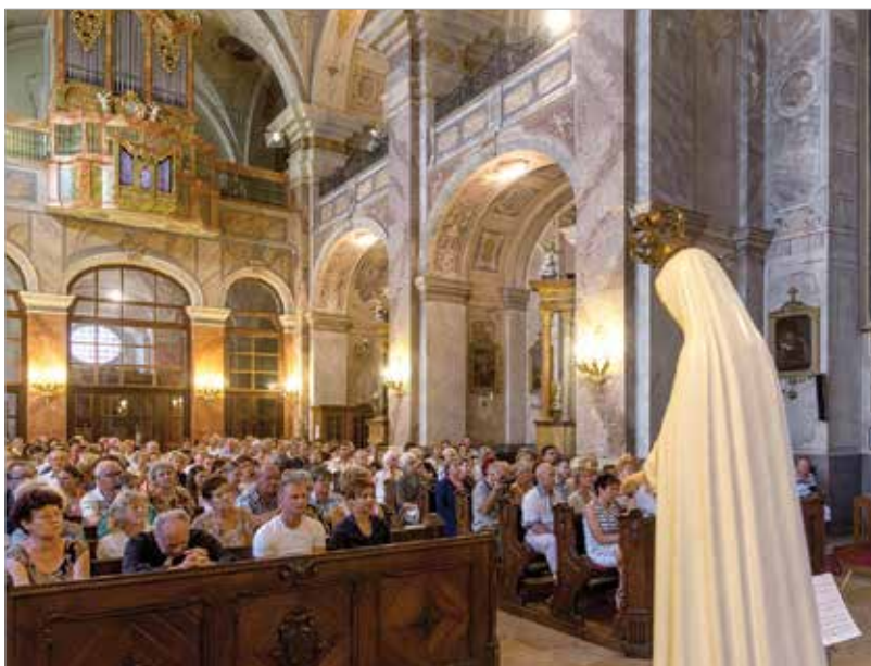
A teltház koncert minden résztvevőnek élményt jelentett

időztek el műveik komponálásakor a két hangszer, a cselló és az orgona világának bemutatása mellett.