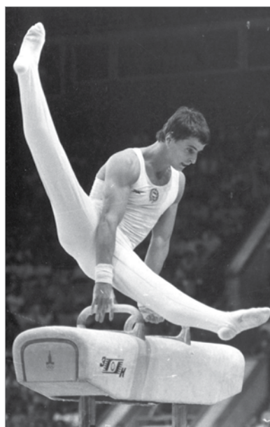
Montreal és Moszkva közös nevezője: magyar arany, pontosabban Magyar-arany lólengésben

lehetett. Az NDK atlétikában, úszásban és evezésben halmozta az aranyakat, az éremtáblázaton összesen tíz ország neve volt olvasható, a Szovjetunió sikerét további hat „szövetséges” tette