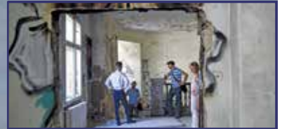
Már nem sokáig lesz ilyen romos 3. oldal