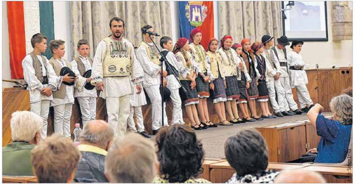
Kóstelek gyermekei és tanáruk a Gyimes-völgye tisztaságát hozták el hozzánk