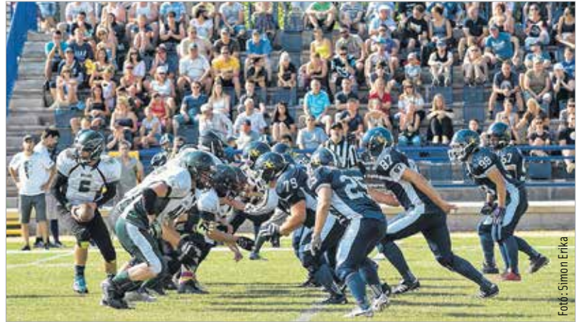
Ezüstérmesként zárt a Fehérvár Enthroners amerikaifutball-csapata a FEZEN Divízió II-ben, miután a sorozat döntőjében 35-13-as vereséget szenvedett a Budapest Eagles gardájától. A fehérváriak ősszel még kivívhatják a feljutást a Divízió I-be, az osztályozón a Tatabánya Mustangs lesz az ellenfél.