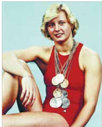
Egy (nemcsak sport-)korszak bajnokai voltak az NDK úszónői. Kornelia Ender 1976-ban négy aranyat nyert, volt, hogy két egyéni döntője között fél óra sem telt el. Jól bírta...

nekünk. A magyar küldöttség négy arannyal, 1924 óta a legszerényebb mértékkel zárta. És még így is megmutatkozott a magyar sport hagyományokban rejlő ereje, hiszen két fiú is olimpiai bajnok apa gyermekeként folytatta a tradíciót. Németh Miklós gerelyhajításban a kalapácsvető