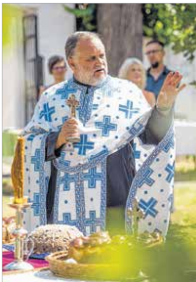
Az áldás, mely ünnepivé teszi a napot

Vasárnap tartotta a Székesfehérvári Szerb Nemzetiségi Önkormányzat és a Szerb Ortodox Egyház közösség a hagyományos Iván-napi búcsút a Rác utcában. Az ünnep délelőtt püspöki szentmisével kezdődött, amit délután a kalács- és koljivószen-telés illetve színpadi program követett.