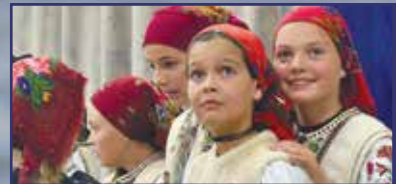
Tiszta forrásból 5. oldal