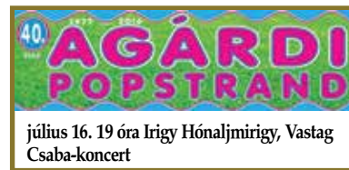
július 16. 19 óra Irigy Hónaljmirigy, Vastag Csaba-koncert

Történelmi mozaik képekkel, színekkel, kvízekkel. Belvárosi séta egy picit másKÉpp.