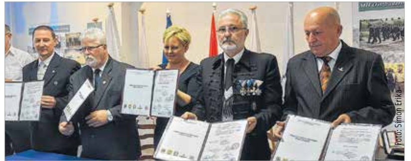
Az együttműködési megállapodás országosan is egyedülálló