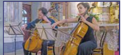
Nemzedékek párbeszéde 4. oldal