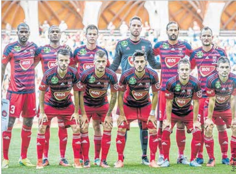
Az első körben simán nyert hazai pályán a Videoton. Kérdés, mire mennek a fehérváriak a szerb bronzérmes ellen.

lett. Így sem gyengült azonban a Csukaricski, nyáron négy játékosal erősítette meg keretét. A selejtező első körében remekelt is a támadószekció: a kazah Ordabaszai hálóját hat góllal terheltek meg (3-0, 3-3). A góljaikon három játékos, Matics, Mandics és a macedón Kajejics osztozott.