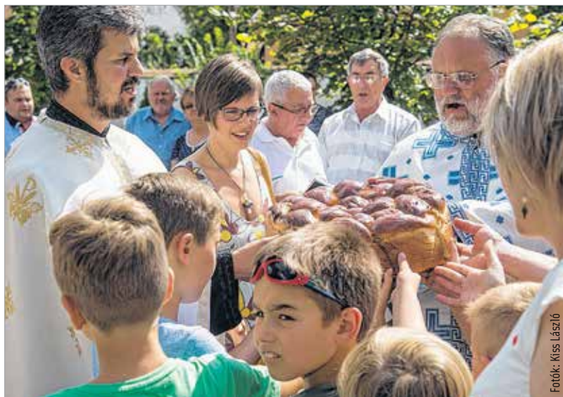
Az ünnepi kalácsot közösen fogyasztották el a résztvevők

A kalács mellett a koljivót is megszentelték, amit az újjászületés jelképeinek is hívnak. A rituális ételnek számító darát főtt búzából, aszalt gyümölcsökből és mézből gyúrnak össze. A búza a megújulás, a továbbélés, a születés szimbóluma. Ezt a speciális édességet a szerbek nemcsak ünnepeiken készítik, de a gyász alkalmával is.