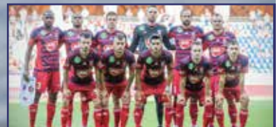
Ez már keményebb dió lesz 15. oldal