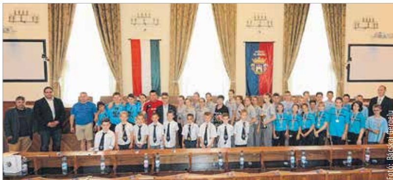
A Városháza Dísztermében köszöntötték csütörtökön délután az Országos Diákolimpia döntőjébe jutott székesfehérvári intézmények csapatait. A 2015/2016-os tanévben számos szép sikert értek el a korosztályos megmérettetéseken a fehérvári fiatalok. Az eseményen jelen voltak a testnevelő tanárok, a szakadók, a versenyzők és a szülők is. L. T. K.