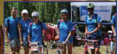
Fehérvári sikerek Kaposváron 15. oldal