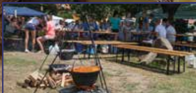
A halászlé és az első szerelem 9. oldal