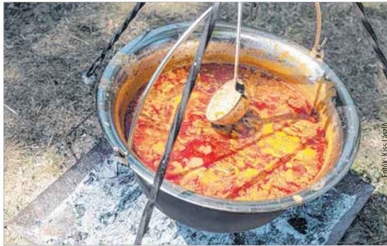
A tökéletes halászlében a lé és a hal harmonikus egységet alkot