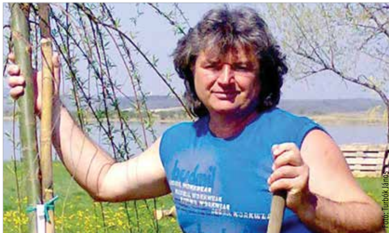
Negyven éve a zene ura és szolgálja

A zenekaraimhoz örök lelki, zenei, emberi szerelem, barátság köt. Az a szó, hogy értékalapú, számomra meghatározó volt egész életemben. Megbecsültem a szepet, a jót, az emberit. Édesapám egy félvak alkoholista volt, tehát nem volt hátterem, magamnak teremtettem meg mindent, és azt őrzöm ma is. A zenében találtam meg mindazt, amit a környezetem egy része még ma is csak keres. Ezt ültettem át a művészetekre is, megke- restem a miérteket és a hozzá tartozó válaszokat. Az Eddának 1979-ben úgy adtam oda „Az év ígérete” díjat, hogy