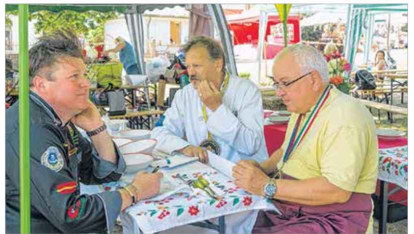
A zsűri szerint kiélezett volt a küzdelem