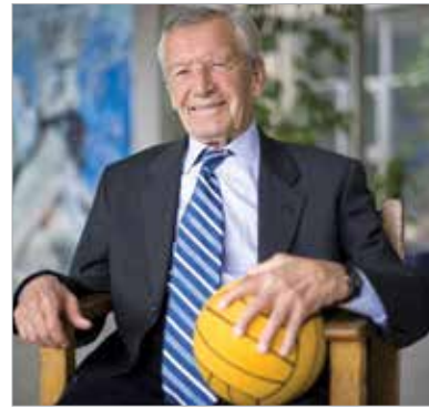
A vízilabda óriása: Gyarmati Dezső öt olimpián vett részt, három aranyérmeket nyert ezeken, a harmadikat Tokióban

technikával és épületekkel volt méltó egy olimpia megrendezésére. Tovább nőtt a résztvevő nemzetek száma, már közelített a százhoz: kilencvenhárom országból érkezett a versenyzősereg. Pedig a kommunista világ két erős bástyája, Kína és a Német Demokrati-