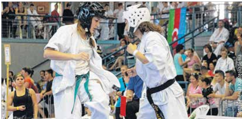
Ismét Szentes adott otthont a II. All Kyokushin Karate World Tournament elnevezésű utánpótlás-világversenynek a hétvégén. A Fehérvár Karateakadémia mind a hat versenyzője dobogóra állhatott, a csapat mérélege egy arany-, két ezüst- és három bronzérem lett. K. T.