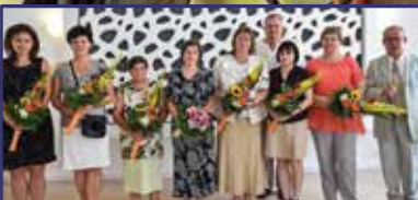
A magyar egészségügy napja 6. oldal