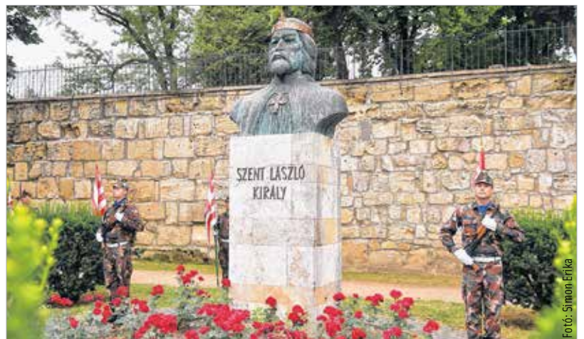
A hazáját védelmező Szent László dicső haditettei és emberi nagysága alapján az első világháború utáni időkben választották a lővészek védőszentjévé