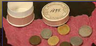
Időkapszulába zárt titok 12. oldal