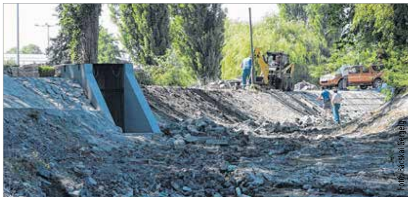
A mederkotrás mellett a partfalat is megerősítik

Augusztus elejéig elkészül a kivitelező a mederkotrással és a partfal megerősítésével, ezzel párhuzamosan pedig a Városgondnokság elvégzi a Deák-kút medencéjének kiépítését a szigeten. A Sóstó Természetvédelmi Terület rehabilitációjához kapcsolódva állami támogatással végzik a Csónakázó-tó megújításához tartozó munkálatokat. A több évtized után leengedett víz alatti mederrendbetétele és a partfal megerősítése mellett a tó környékét is érinti a beruházás. Sétány fut majd körbe, a kis szigeten elhelyezik a Deák-kutat és a csónakázás lehetőségét