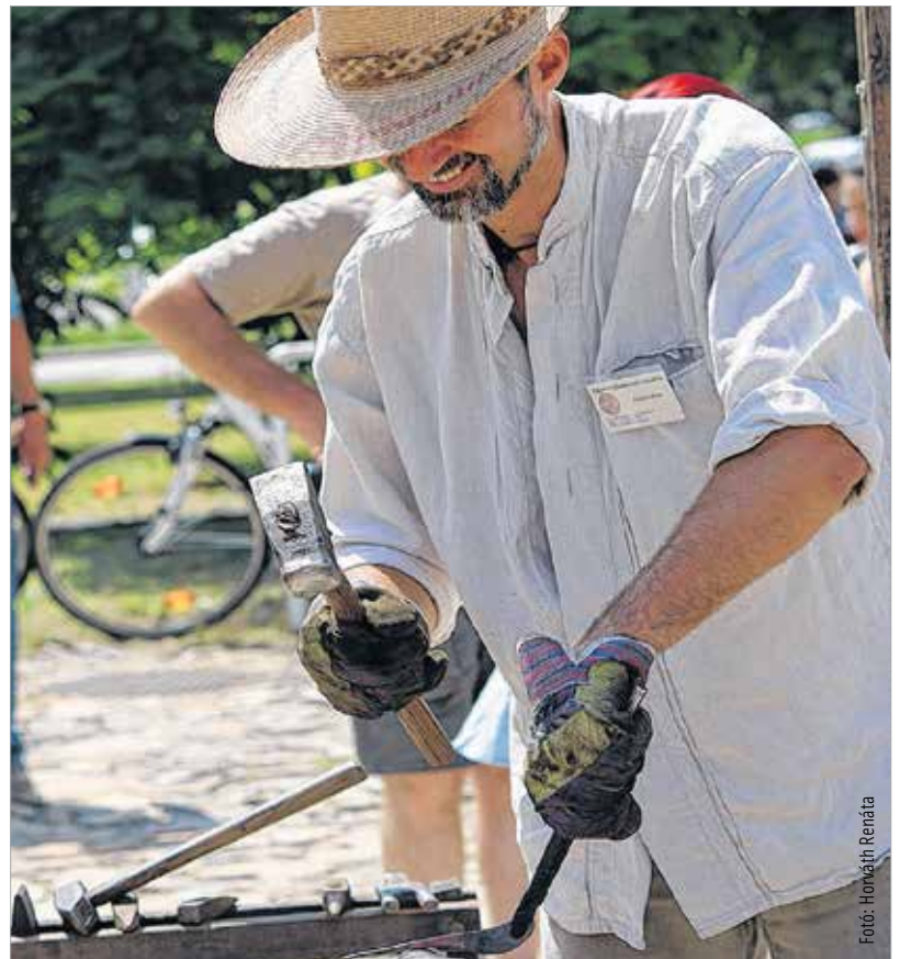
Ágyúdörgés, sólyomröptetés és fegyverbemutató is volt a 13. Tűzzel-Vassal Fesztiválon, melynek keretében a késes, kovács és fegyverműves szakma hazai és határon túli képviselői mutatkoztak be K.T.