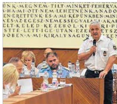
A városi rendőrfőkapitány elmondta: kiemelt feladatuk a drogterjesztők elleni küzdelem