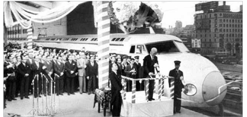
Az olimpiára időzítették a 300 kilométeres sebességre képes szupervasút, a Sinkansen első, Tokió és Oszaka közötti vonalának átadását

Nekünk magyaroknak több babér temett a távoli Ázsiában, mint Rómában. Kardozóink csodás hagyományát Pézsa Tibor ápolta tovább – igaz, csapatban 1928 óta először nem mi örülhettünk. Egyéb csapataink viszont remekeltek, hiszen női törben (ahol egyéniben Rejtő Ildikó nyert) és férfi párbajtörben is a magyar Himnuszot játszották el az eredményhirdetésnél. És vízilabdában valamint futballban is mi voltunk a császárok, bár Japánban ezzel nem így illett dicsekedni. Öttusában nem indulhatott a világbajnok Balczó András, de nélküle is született magyar arany, a későbbi sikerkapitány, Török Ferenc révén. A sportlövő Hammerl László ugyanezt a pályát járta be: olimpiai bajnokból bajnokok edzője lett. Birkózásban két nagy legendánk ért célba: az őstehetség Kozma István mellett végre aranyat akasztottak Polyák Imre nyakába. Ha valaki, ő megérdemelte: előzőleg három olimpián volt második.