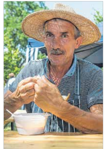
A szalmakalap a nyári főzések elengedhetetlen kelléke

A végeredménynél sokkal többet mondott, hogy délután fél kettőre gyakorlatilag minden kondér üres volt. A csapatok és a látogatók jóízűen falatoztak a halas finomságokat, és nem számított az sem, ha paprikafolt maradt egy-egy kackiás, őszes bajuszon. Közben szólt a