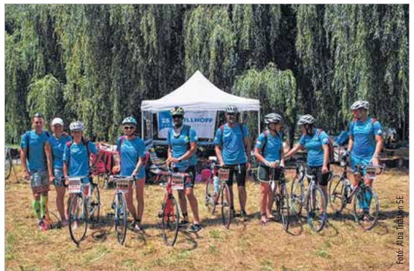
Rajtra készen! Igazán összetartó egyesület az Alba Triatlon: depózni is együtt megy a csapat.