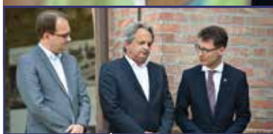
Elindul az Árpád-ház program 3. oldal