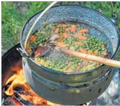
Borsófesztivált máshol nem rendeznek