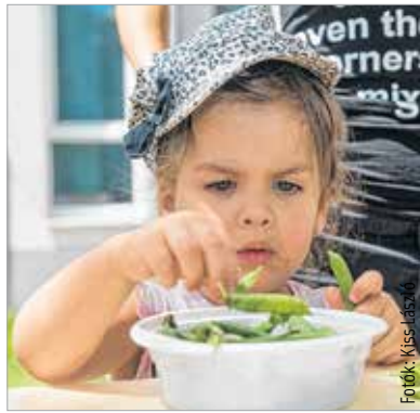
A borsófejtőverseny ifjú reménysége