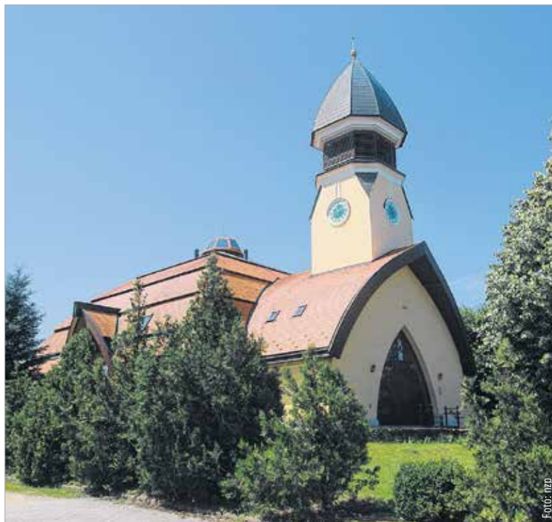
A nívódíjjal kitüntetett építmény tetőszerkezete a modern technikák alkalmazása mellett is esztétikai értékkel bír, és a belső térben kellemes akusztikát biztosít