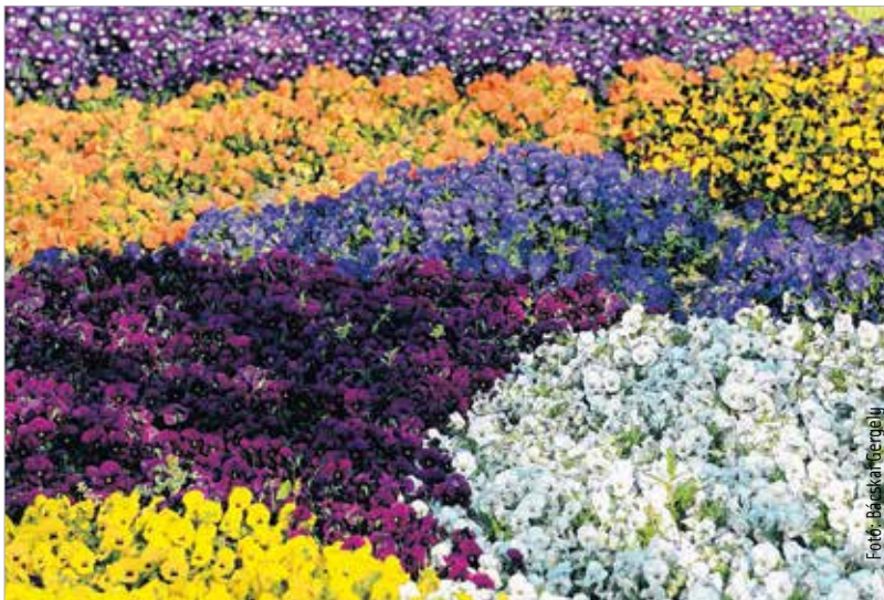
A fehérvári köztérek virágkompozícióira igazán nem lehet panaszunk!

keretében a magyar határvédelmi feladatokban kiemelkedő helytállást tanúsított honvédek díjazták. „Hihetetlen bevándorlóáradat érte el hazánkat, és ezt a kihívást a hagyományos eszközökkel nem tudtuk kezelni. Így hatalmas szükség volt a Magyar Honvédség tagjaira, hogy megvédjék az ország szabadságát és a magyar emberek biztonságát.” – mondta Vargha Tamás honvédelmi miniszterhelyettes az ünnepségen. Cser-Palkovics András polgármester kiemelte: Székesfehérvár ezt követően is mindent megtesz majd a déli határon szolgálatot teljesítő katonáért, hogy családtagjaikkal tartani tudják a kapcsolatot.