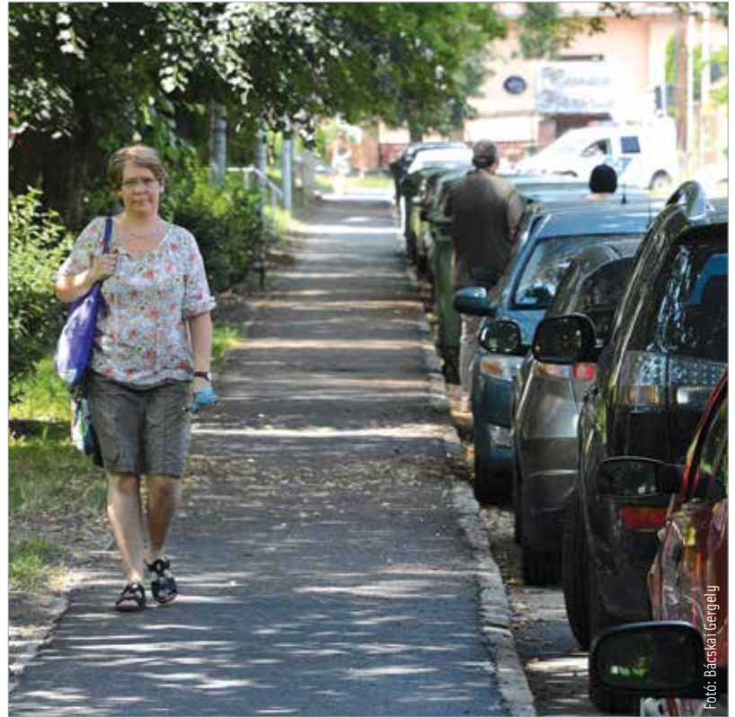
A környék lakói már birtokba is vették az új járdát a Mikes Kelemen utcában

szakaszhoz kapcsolódó zöldfelületek rendezése és füvesítése is megtörtént.