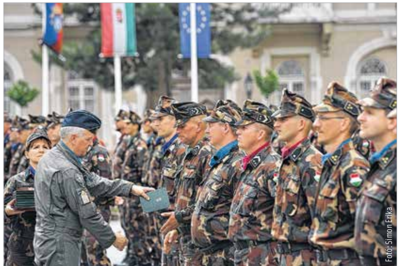
A kitüntetést a kormány tavaly decemberben alapította