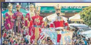
Életre kel a történelem 4. oldal