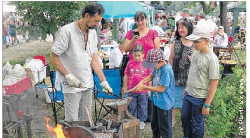
Az idei rendezvényen is sok érdekes program várja az odalátogatókat

A szervezők a gyerekes családokra is gondoltak, hiszen lesz kézműves foglalkozás, arcfestés és játszóház, sőt még egy igazi lufibohóc is. A kirakodóvásáron a látogatók többek között lekvárok, mézek, különféle ínyencségek és helyi kézműves termékek között válogathatnak. Akik a nagy melegben megszomjaznak, megkóstolhatják az érmelléki, muravidéki és délvideki borokat. Délután a hagyományőrző műsoroké lesz a színpad, később pedig Szabó Leslie és csapata zenél a közönségnek. Az este pedig egy fergeteges Charlie-koncerttel ér véget, amire mindenkit szeretettel várnak!