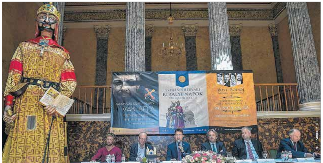
Az idén Vak Béla korába repít vissza a koronázási szertartásjáték

István-émlékében elég akarat és erő volt bennünk, hogy a lelkünkben újra felépítsük az ősi templomot. A szertartásjáték után, augusztus 16-án ugyancsak az ország egyik legnagyobb épített szabadtéri színpada ad otthont a Musica Sacra című ünnepi koncertnek. A hangverseny kuriózum lesz a komolyzene kedvelői számára, akik Rossini világhírű egyházi remekművét, a Stabat Matert hallgathatják meg.