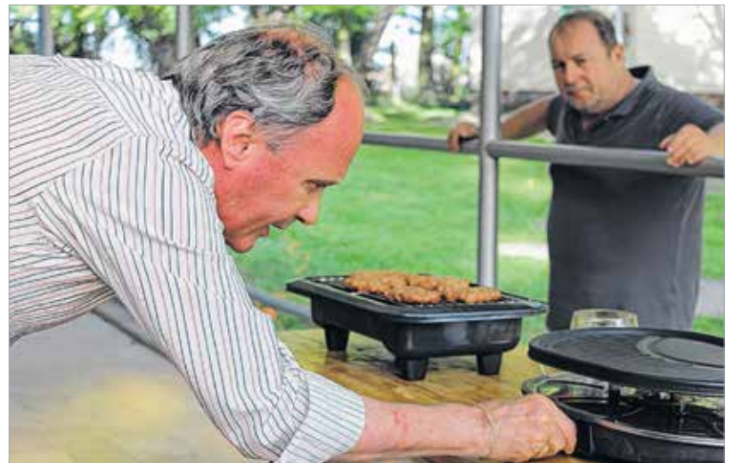
A pljeszkavica fokozott koncentrációt igényel

A zsűribe mindegyik csapat delegált egy főt, hogy teljesen egyenrangú legyen a küzdelem. Az asztalon egymás mellett sorakoztak a finom-