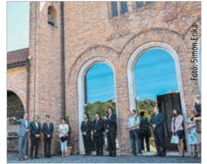
A program keretében egy korszerű látogatóközpontot is kialakítanak

Az ötmilliárd forint felét egy olyan kulturális körút kialakítására szánják, amely képes lesz a királysírok helyszínét összekötni a majdani látogatóközponttal, azaz a volt Köztársaság mozi épületével. A következő szakaszban 2022-ig pedig a körúthoz a Városház tér és a székesegyház is becsatlakozna. Ezen kívül létrehoznának egy kutatóközpontot, sőt az Árpádok örökségét egy nagy kiállítás keretében szeretnék összegezni 2018-ban a Magyar Nemzeti Múzeumban, amit szeretnének számos európai