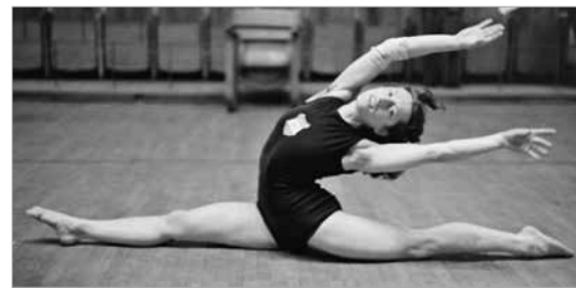
Keleti Ágnes négy aranyat nyert Melbourne-ben, ahonnan nem tért haza. később Izraelben telepedett le.

Még ilyen körülmények között is – nem kis lelki terhet cipelve – újra remekeltek a magyar sportolók.