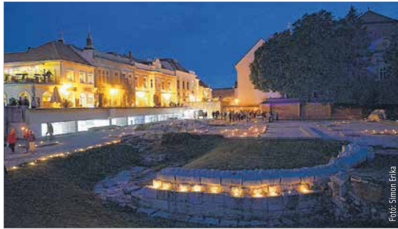
A Nemzeti Emlékhelyen idén is lesz fáklyás tárlatvezetés

Tárlatvezetések, koncertek, előadások, kreatív foglalkozások és számos egyéb érdekesség is lesz az év legrövidebb éjszakájához, a Szent Iván-éjhez legközelebbi szombaton. Székesfehérvár évről évre egyedülálló összefogással készül erre a napra, idén is több fehérvári és vidéki szervezet állt össze, hogy a látogatók minőségi kulturális élményekben