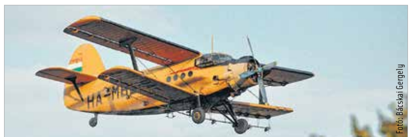
A légi szúnyogirtás naplemente előtt kezdődik

Naplemente előtt kezdik a légi irtást, amely során Coratrin, Aqua K-Othrin illetve Mosquitox 1 ULV Forte szert használnak. Az anyag melegvérű állatra és emberre veszélytelen, a környezetet nem károsítja, kizárólag a rovarokra van káros hatással. Ezúton is felhívják a méhészek figyelmét, hogy tegyék meg az ilyenkor szükséges óvintézkedéseket.