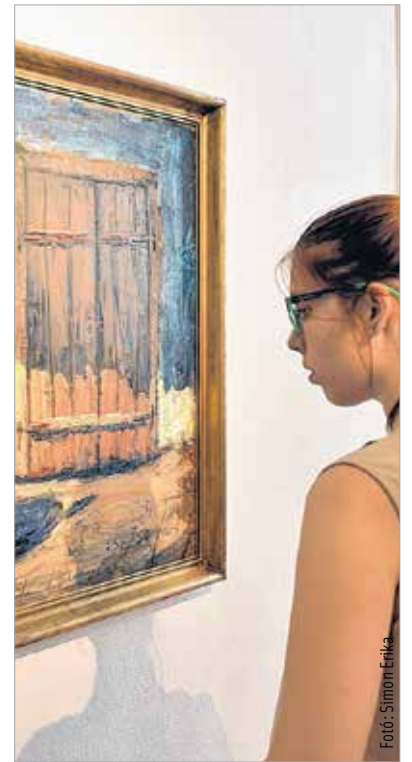
Az alföldi festészet alkotásaiból válogat az a tárlat, mely június 18-tól szeptember 18-ig várja a látogatókat a Csók István Képtárban. A megnyitón Náttyi Róbert művészettörténész kiemelte, hogy a tárlaton látható festők a táj szellemi karakterét adják vissza, ami túlmutat a pusztá romantikáján. G. P.