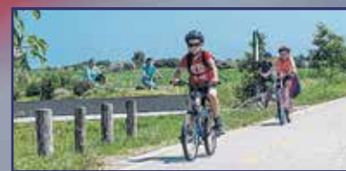
Kerékpárosbarát tervek Fehérváron 8. oldal