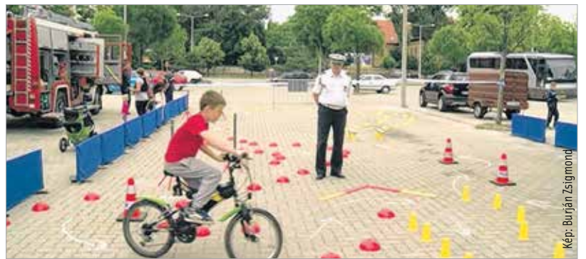
Nem is olyan könnyű a kerékpáros akadálypályát teljesíteni!

különböző versenyek is várják majd a bátrabbakat június 25-én, a harmadik Kölyökjuniálison. A program legfőbb célja a szórakoztatáson túl a gyerekek értékrendjének fejlesztése. A juniálison az érzékenyítő programok mellett bemutatkoznak a rendvédelmi szervek is. Lesz kerekesszékes akadálypálya, kerékpáros ügyességi verseny és tűzoltóbemutató, egész nap kézműveskedés és ügyességi vetélkedők. A III. Kölyökjuniális június 25-én tíz órakor kezdődik a Budai úti barkácsáruház parkolójában.