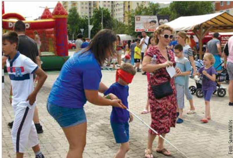
A harmadik Kölyökjuniális szombaton várja a vízivárosiakat