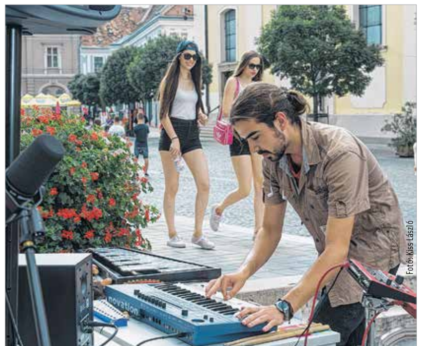
Az alkalmi muzsikus az utcán terem

Országalmánál helyeztek el, és kedden délután várta az arra járó zenerajongókat. A látogatóknak lehetőségük volt a zenészekkel együtt zenélni. A székesfehérvári pop-up zenestúdió mindenféle hangszerezelt és zenei rögzítő és keverő eszközökkel volt ellátva, amiket bárki arra járó zeneszerető kipróbálhatott. Sőt a zenekedvelő és zenét csinálni is kedvet érző laikus és professzionális zenész látogatók rögzíteni is tudták a zenészekkel közös alkotásaikat, amiket el is vihettek magukkal.