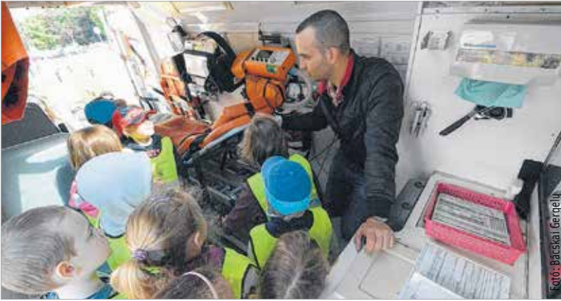
A mentők napján koszorúzással kezdtek a fehérvári állomás emléktáblájánál, majd a gyerekekkel ismertették meg a hivatás szépségeit