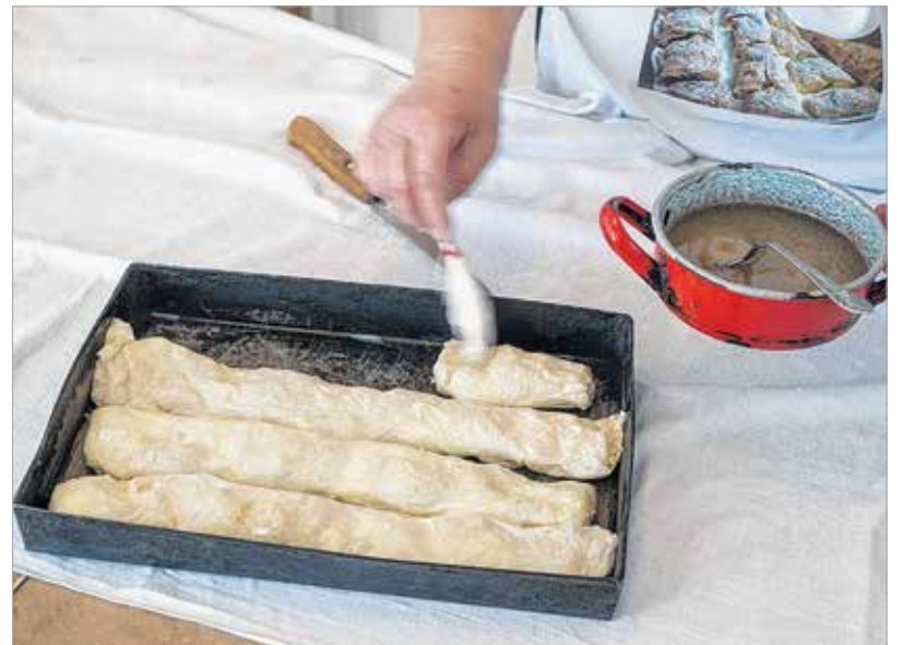
Még egy kis zsír, hogy ne száradjon ki