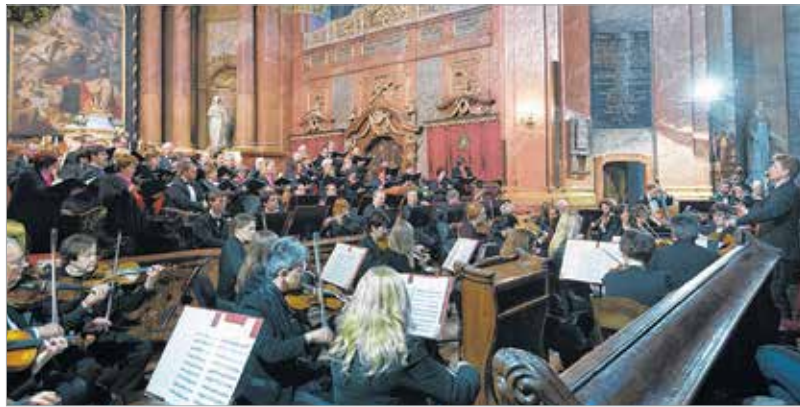
Haydnt az Isten adta nekünk, cserébe ő megkomponálta szimfóniáit

igazi, ha egy olyan helyen vezényelheti kórusát, ahol megbecsülik a megszólaló alkotót: „Nagy várakozással készültünk, és magát a műsorválasztást is úgy próbáltuk összehozni, hogy a szép alkalomhoz illő legyen. A Te Deummal, egy dicsőítő himnusszal kezdtünk, amely Joseph Haydnnak egy kevésbé ismert, de annál pompásabb műve. Igazi különlegesség, hogy ez megszólalhatott. Ezt követően a megújulás jelképeként egy korai Haydn-mű, a Reggel szimfónia következett, ami egyfajta újrakezdet szimbolizál. A műsor legnagyobb része a Harmoniemesse, ami Haydn hat nagymiséje közül a legutolsó, s talán a legértékesebb alkotás.”