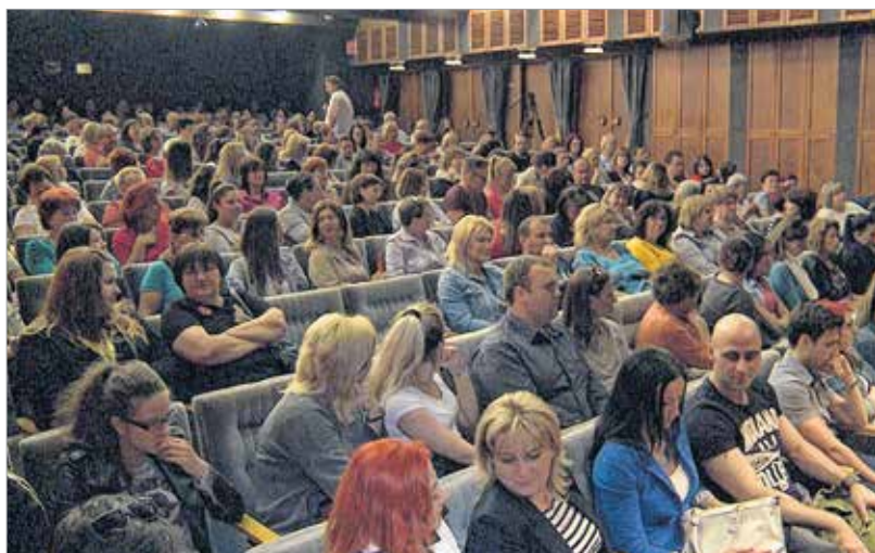
Az előadáson résztvevők megoszlásából arra lehet következtetni, hogy a párokapsolatok pszichológiája főként a női nemet érdekli

nem. Ez az önbizalomhiány jele. Az emberek nagy része ugyanis még azt sem tudja, hogy az önbizalmat lehet fejleszteni racionális és emocionális szempontból. A racionális szempont a mérhető tudás, az érzelmi szempontú önbizalom-fejlesztésből pedig az ember előbb-utóbb megszerzi a belső nyugalmát.”