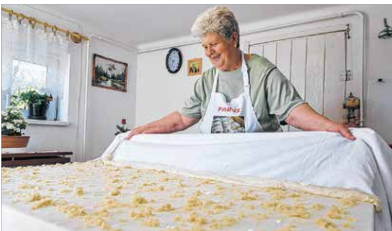
Tekeredik a rétes, kigyó akar lenni...