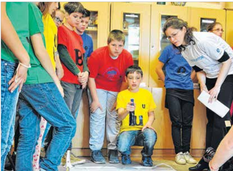
A gyerekek a gyakorlatban is láthatták, milyen messzire jutnak el a kórokozók, ha tüsszentünk. Csúpnál egy kis ételfestékre volt szükség a szemléltetéshez.

programjához csatlakozott oktatási intézményben. A Guinness-rekord-kísérletet az Országos Tisztifőorvosi Hivatal kezdeményezte. Fejér megyében tíz iskola közel ezer résztvevővel jelentkezett a korábbi rekord megdöntésére, országosan pedig összesen százkilencven iskola tizenháromezer tanulója fogott össze azért, hogy megelőzzék az eddigi csúcstartót, Glasgow-t, a maga 3039 résztvevőjével.