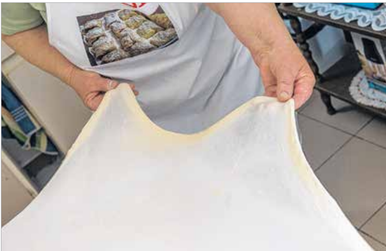
Már most szinte teljesen áttetsző

rendezni, utána meg tizennyolc évig voltam az óvoda konyháján. Előfordult, hogy tizenöt kiló lisztet dagasztottam be kézzel! De arra is volt példa, ha ősszel sok almát hordtak össze a gyerekek, akkor almás rétest vagy pitét sütöttünk nekik! Ha megtermett itthon, mindig vittünk be paradicsomot, paprikát, zellert, petrezselymet