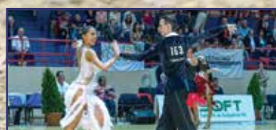
A parkett ördögei