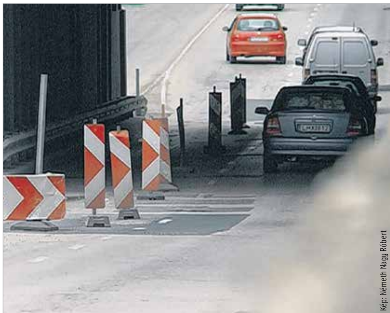
A vasúti felüljáró ugyan elkészült, az autósok viszont csak május végén vehetik birtokba az alatta megújuló útszakaszt

is csak a közlekedési hatóság külön engedélyvel lehetett az aluljáróban két közúti sávot átvezetni. Az autósok biztonságának érdekében a falak mellé magasított szegély és szalagkorlát került. Így az oldalakadálytávolság nullára csökkent, ami miatt fél méteres biztonsági sávot kellett kijelölni. A megmaradó útfelület már nem elegendő két sáv átvezetéséhez, mivel autóbuszok és tehergépkocsik forgalmát is biztosítani kell, melyek helyigénye három és fél méter.