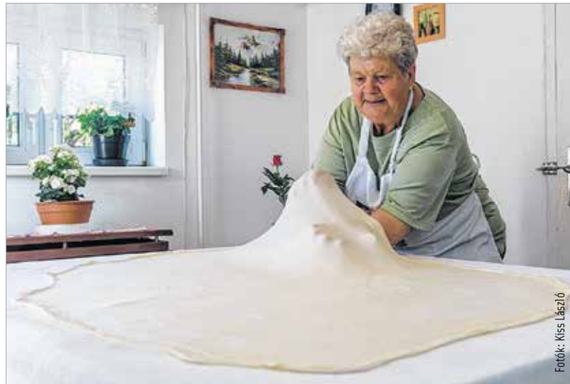
A rétestésztát, ha úgy gyúrjuk, mint a kelt tésztát, nehezebben lehet kinyújtani