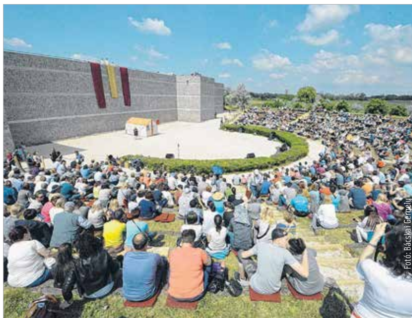
Ezrek a tavaszünnepen

A visszatérését egybekötötte a pannóniai határ szemlélésével. Ez az egyetlen olyan nagyon jelentős történelmi esemény, amit Gorsiumhoz tudunk kapcsolni. Ezt idézzük fel a hagyományokhoz hűen a Floralián is minden évben.” – mondta