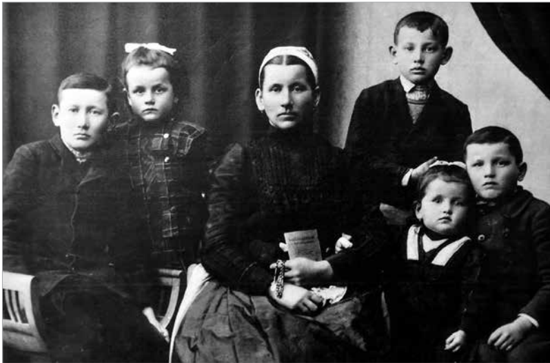
A gyerekek már nem beszéltek a német nyelvet

kaszni – konyhaszekerény stelázi – polcos konyhaszekerény sublót – komód sifon – akasztós szekrény stafirung – hozomány hecsecli – csipkeboggyó