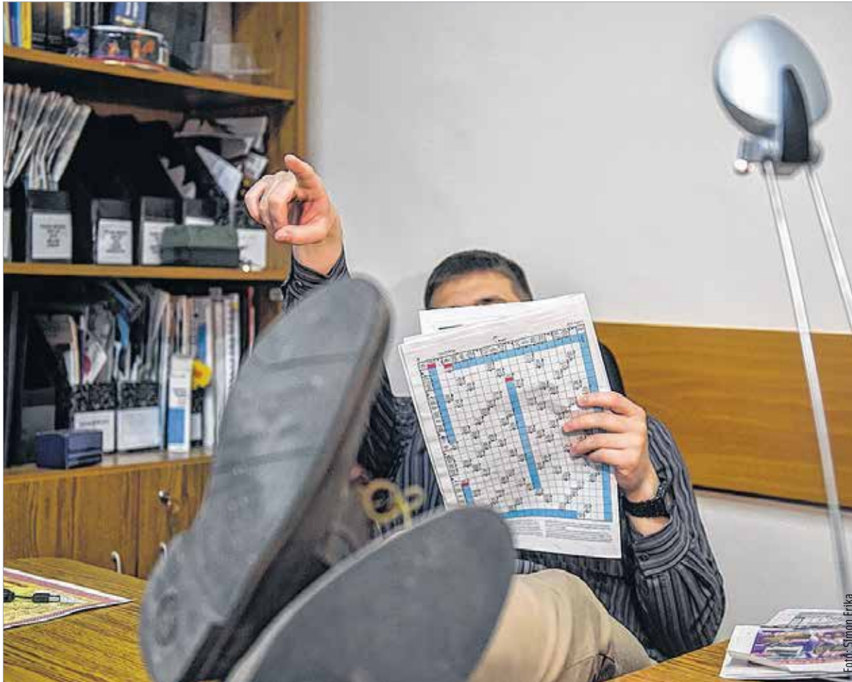
A vezetőnek mindig példát kell mutatnia

dicsérnék, akkor az alkalmazottak sokkal elfogadóbbak, ragaszkodóbbak lennének.”