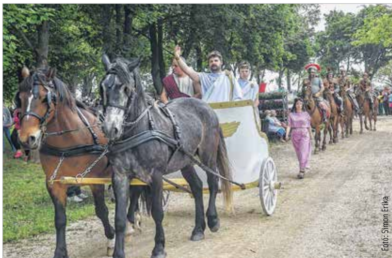
Az imperátor népes kíséretével vonult be Gorsiumba, ahol megtekintette a tiszteletére rendezett gladiátorjátékokat is

Pannónia fontos szerepet játszott a Római Birodalom életében. A pannóniai légiók Septimius Severus, Felső-Pannónia helytartóját kiáltották ki imperátornak, és elkísérték Rómába, hogy átvegye a hatalmat. Ez a segítség az uralkodót és családját több évtizeden át ehhez a provinciához fűzte, s számtalan formában fejezte ki hálóját Pannónia iránt. „202-ben, amikor keleti hadjáratáról visszatért Rómába, hogy megünnepelje uralkodásának tízéves évfordulóját, akkor sem egyenesen a fővárosba ment, hanem előbb Pannóniába.