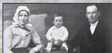
„Mindig legyél ízumflájszig!”