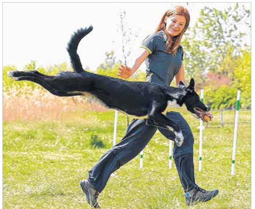
Az akadályokat is remekül veszi a páros

Kutyázni mindig jó! – legalábbis a kutyások nagy része így gondolja, akkor is, ha a házi kedvenc vagy a profi munkatárs éppen megmakkolja magát, és kihasználva a gazdi pillanatnyi figyelmetlenségét a mocsárba rohan, és akkor is, ha sikerül egy trükköt megértetni a szőrőmókkal és a kutya hibátlanul teljesíti a versenypályát.