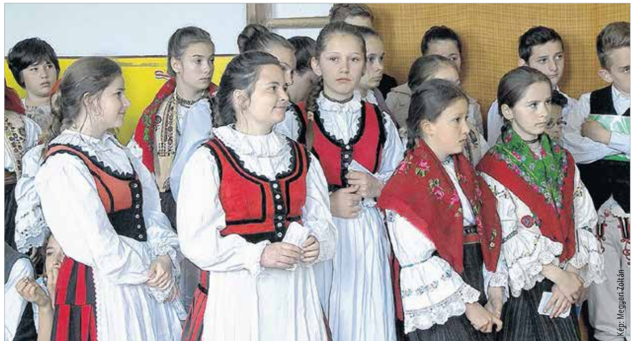
„S fogcsikorgatva hirdetem: / nem ért véget a küzdelem! / Mert valami még megmaradt. / Görcs zsiabasztja a markomat, / de markomban még itt a Szó: / a láthatatlan lobogó!” (Wass Albert)