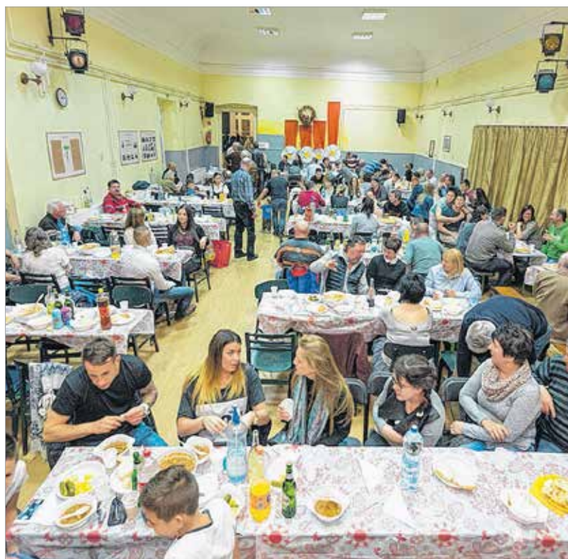
Együtt szórakozott idős és fiatal