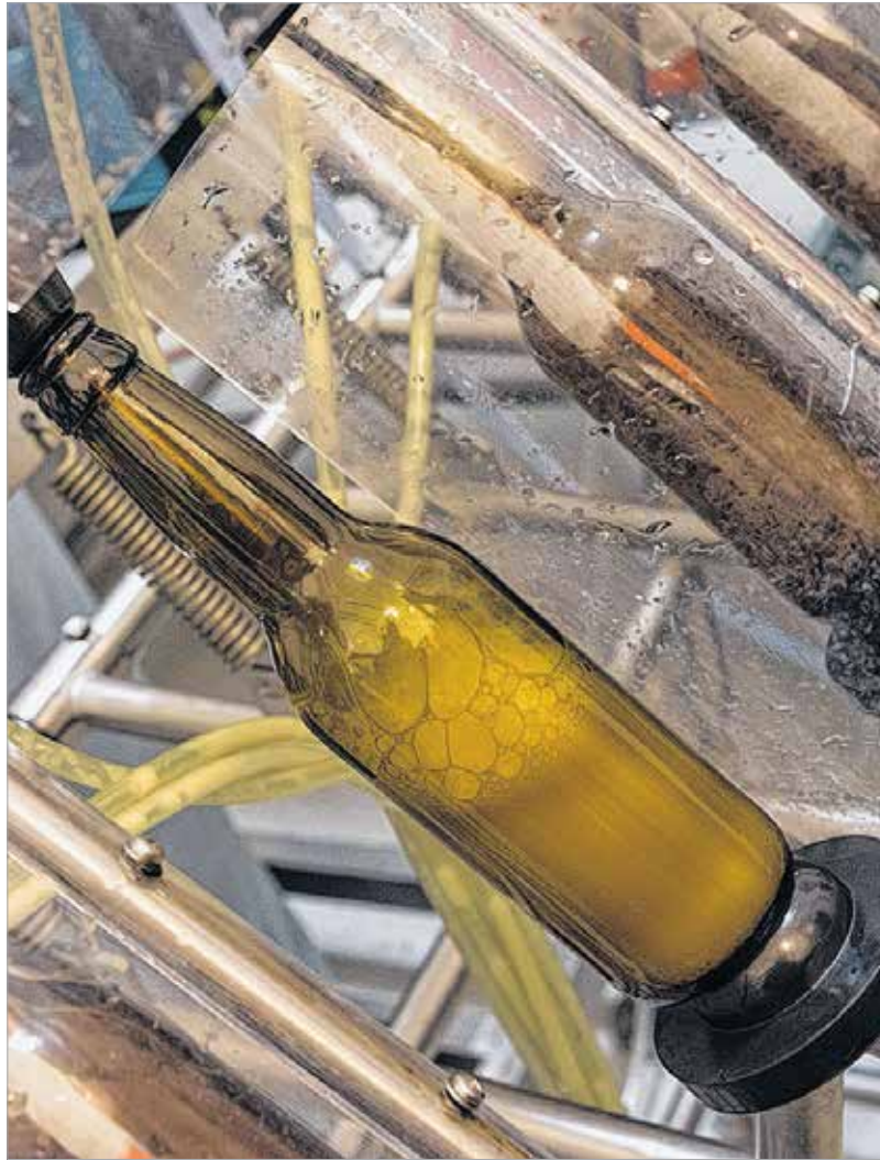
Sör a palackban

1987-ben a Reinheitsgebotot az Európai Gazdasági Közösség hatályon kívül helyezte az európai piac megnyitásának részeként. Számos német sörgyár úgy döntött azonban, hogy ennek ellenére fenntartja a Tisztasági törvényt a sörfőzési tevékenységében, a szakmájuk és örökségük iránti tiszteletből.