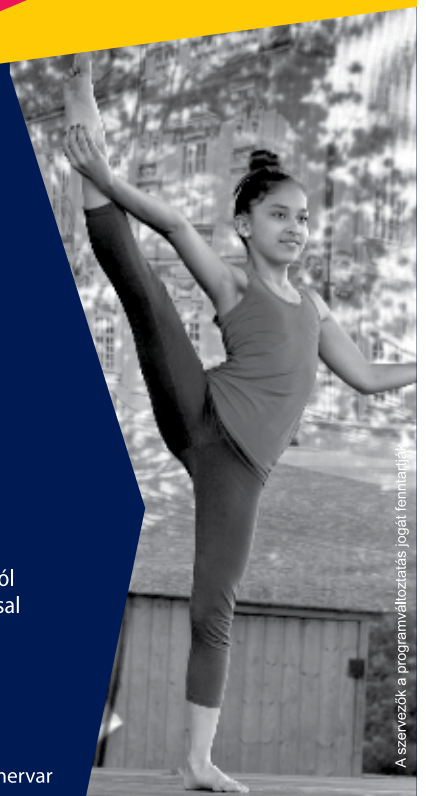
A szervezők a programváltoztatás jogát fenntartják