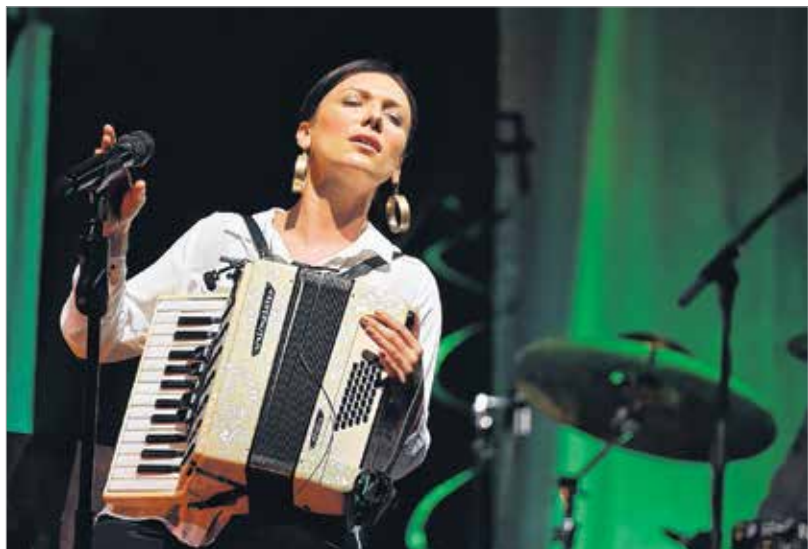
Hang plusz hangszer