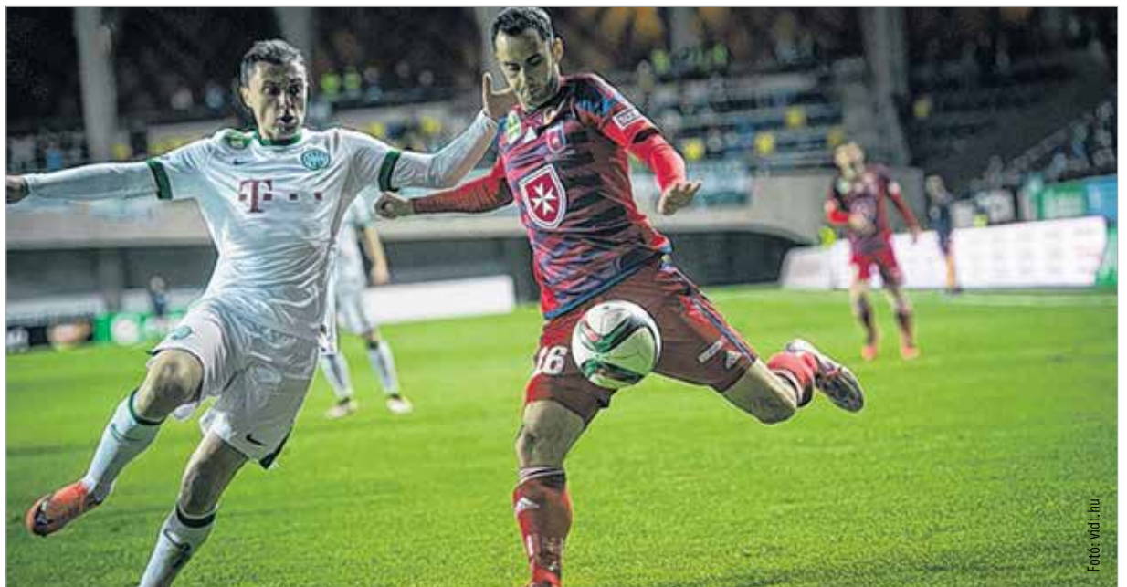
Oliveira a rá jellemző jó játékkal jelentkezt a Fradi ellen. A Videoton sikerével újra dobogós, és saját kezébe vette sorsát a nemzetközi kupaindulásért zajló versenyfutásban.

A szünet megnyugvást hozott, a második félidő pedig előbb egy ferencvárosi helyzetet, majd hazai gólt. Az 55. percben újra Busai járt közel a gólhoz, de becsúszva fölé lőtt közelről, egy perccel később a másik oldalon Stopira már nem hibázott. Egy szöglet után a labda a Vidi légiósa elé került, aki közelről, a földön fekvő a hálóba kotorta a labdát. A gól után a Ferencváros kapusa, Jova Levente hevesen reklamált a játékvezetőnél, mondván, Simon a találat előtt lökte őt. Solymosi Péter játékvezető