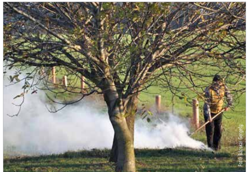
Május másodika és hetedike között újra lehet égetni

emberi egészségre ártalmas lehet. A helyi jelentőségű, védett természeti területen tilos az égetés. A nedves, frissen levágott levelek és gallyak égetése fokozott füstképződéssel jár, ami balesetveszélyt és légzési nehézségeket okozhat. A tüzgyűjtés során ügyelni kell arra, hogy az a környezetre veszélyt ne jelentsen, a növényi hulladék közelében más éghető anyag vagy épület ne legyen. A kert égetését minden esetben felügyelni kell, mert az esetlegesen feltámadó szélben a lángok pillanatokon belül továbbterjedhetnek!