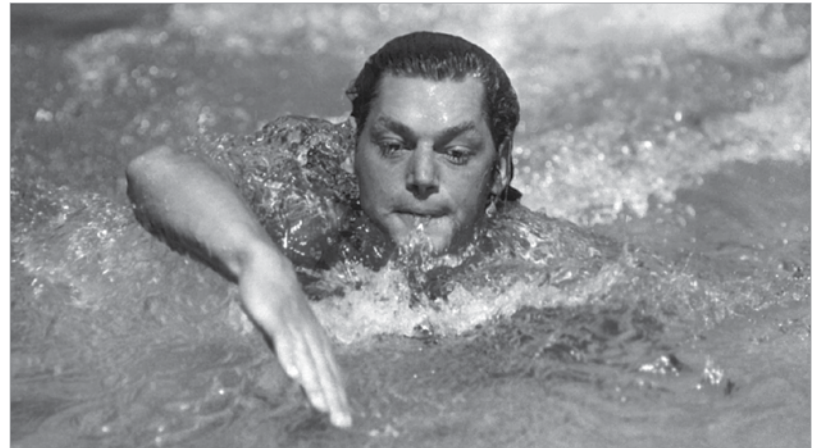
Hosszútávon nem lehetett legyőzni a repülő finnt: Paavo Nurmi a két olimpián nyolc aranyat szerzett

Az olimpiára visszatérő Magyarország nyolcvankilenc fős küldöttséggel utazott Párizsba. Tíz érmet szereztünk, ebből két arany volt. „Természetesen” vívásban, kardban született az egyik: miután a