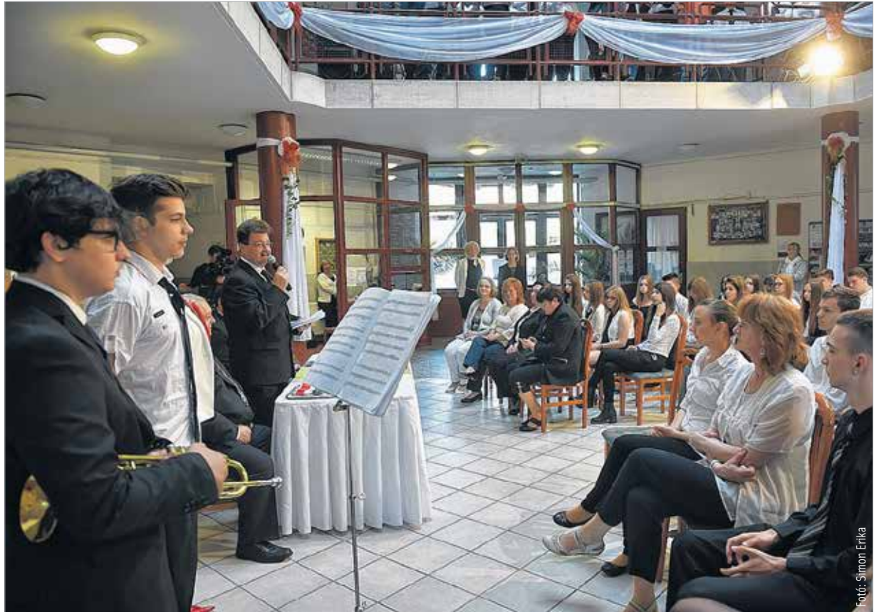
Ünnepi díszbe öltözött a huszonöt éves Deák Szakképző Iskola

Az ünnepség keretében átadták az iskola megújult tornatermét. A város nevében Mészáros Attila köszöntötte a Deák pedagógusait és diákjait: „Köszönet jár mindazoknak, akik hozzájárultak, hogy ez az önálló szakmacsoportokat oktató intézmény kiváló eredményeket érhesen el. Az idei tanévet beárnyékolta egy sajnálatos tűzeset: tavaly novemberben a tornaterem jelentős része leégett. A város azonban megtalálta a megoldást az azonnali segítségre. A közgyűlés döntése alapján az önkormányzat ötvenmillió forintos azonnali segítséget nyújtott a tornaterem felújításához. Most pedig ezen a jubileumi ünnepségen örömmel avatjuk fel a tornatermet, hogy újra a Deák iskola növendékeinek sportéletét szolgálja.”