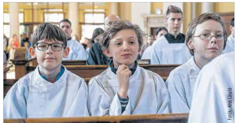
Igazán jókedvű nap volt!