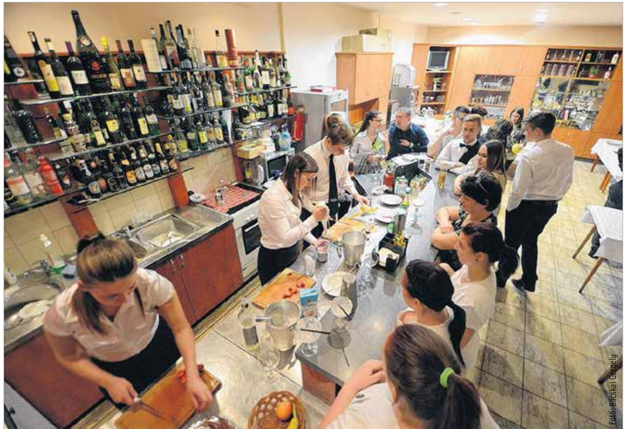
A deákosok megmutatták, miért is telitalálat a „Próbáld ki, csináld meg, ismerd meg!” jelmondat

Az esemény megnyitóján Mészáros Attila, Székesfehérvár alpolgármestere örömet fejezte ki, hogy a Székesfehérvári Szakképzési Centrum csatlakozott a Szakképzés éjszakájához. „Bízom benne, hogy az intézmények