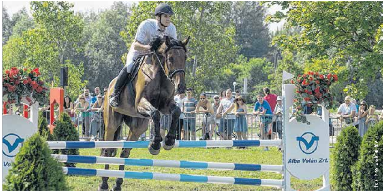
Kecskeméten hibátlanul lovagolt, és megnyerte a tusát a Volán kiválósága