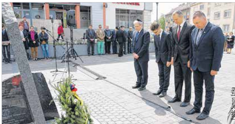
Néma főhajrás az áldozatok emlékére

Székesfehérvári Zsidó Hitközség elnöke. Székesfehérvár polgármestere arról beszélt, hogy ambivalens érzéseket keltenek benne az emléknapok, hiszen nem szolgálhatják azt a célt, hogy egyetlen napra korlátozzuk egy sorstragédia felidézését, és ezzel kipipáljunk egy feladatot, amivel nem foglalkozunk többet az év többi napján. Az emléknapok sokkal inkább azt szolgálják, hogy 364 napon gondoljunk arra, amire egy bizonyos napon emlékezünk és emlékeztetünk. „Ne felejtjük el, hogy felelősséggel tartozunk azért a csaknem három ezer fehérvári polgárért, aki nem tért haza. Felelősek vagyunk családjaikért, barátaiért, ismerőseikért.” – fogalmazott a polgármester. A beszédek után koszorúzással és néma főhajrással zárult a megemlékezés.