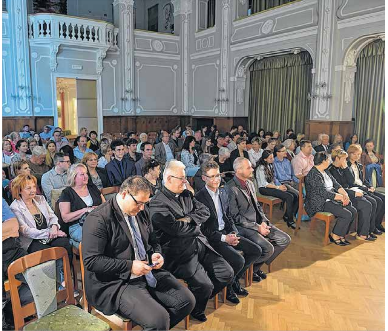
Megtelt a Szent István Művelődési Ház