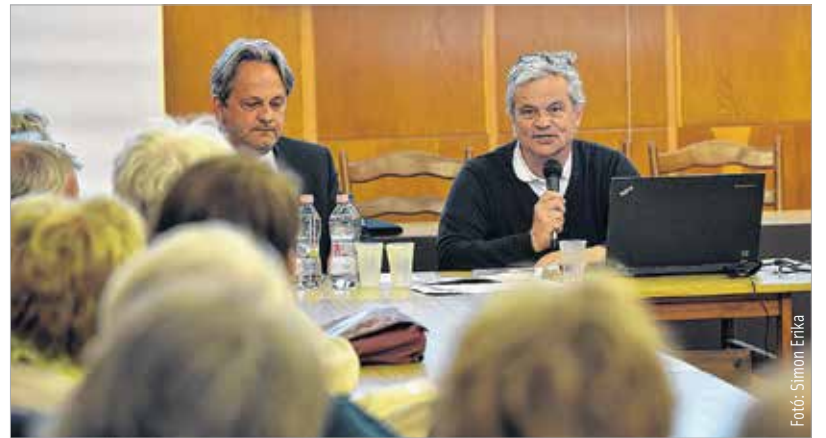
Telt ház előtt tartotta meg a CÖF székesfehérvári rendezvényét

és sok emberben ellentmondásos érzéseket vált ki az, hogy nem akarunk segíteni. Szerinte szó sincs erről, ezért minden jóakarati ember nyugodtan elmehet a kvóta ellen szavazni. Kiemelte, észre kell azt venni, hogy Európa elveszíti a józan esztét. Példaként említette Krisztust, aki kiverte a kufárokat a templomból. Ezért nekünk is ki kell tessékelnünk az Európába, az országunkba vagy az otthonunkba nem illőket. Útalt Bőjte Csaba ferences szerzetes szavaira, aki arra hívta fel a figyelmünket, hogy azt, aki a tengerben fuldoklik, kihúzzhatjuk a partra, de a hálószerzőnkben már nem vihetjük be.