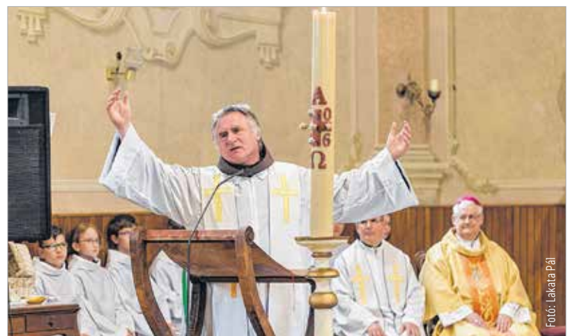
„Jót tenni jó!”

ünnepségén. „Jót tenni jó, és ha az ember kipróbálja, akkor megtapasztalja, hogy a sokféle öröm mellett ez a legnagyobb, ami érheti a földön.” – mondta, majd hozzátette: „Nincsenek kis dolgok és nagy dolgok, ahogy kis Szent Teréz írta, nincs kis szeretet és nagy szeretet. Jézus elment a garadai ördögöshöz és megszállt Zakeusnál, a bűnös vámosnál. Ő nem válogatott, neki nem volt nagy és kis ember, mert számára mindenki Isten remekműve és csodája volt.” – fogalmazott a szerzetes.