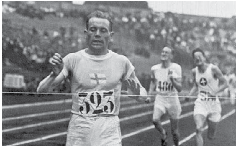
Hosszútávon nem lehetett legyőzni a repülő finnt: Paavo Nurmi a két olimpián nyolc aranyat szerzett

Coubertin báró mindent megtett, hogy gyermekét, az olimpiai mozgalmat megóvja az ellenségeskedésektől, politikai alapú széthúzásoktól, de nem mehetett szembe a nagyhatalmak akarataival. A háborúban vesztes oldalon harcoló országok sportolóit nem hívták meg az antwerpeni játékokra. Németországot, Ausztriát, Magyarországot, Bulgáriát, Törökországot és Szovjet-Oroszországot érintette a kizárás, vagyis az újkori játékok történetében először nem voltak ott a versenyeken. Pedig eredetileg Budapest rendezett volna 1920-ban! A Nemzetközi Olimpiai Bizottság 1917-es körlevele javaslatot tett rá, hogy a meg nem rendezett játékok ne elhalasztottnak minősüljenek, ezért azok sorszáma nem száll tovább a következőre. Így az V., stockholmi olimpiát a VII. követte egy olimpiai mércével kis városban, Antwerpenben. Ez is kiérdemelte a „történelmi” jelzőt, hiszen először mondtak esküt