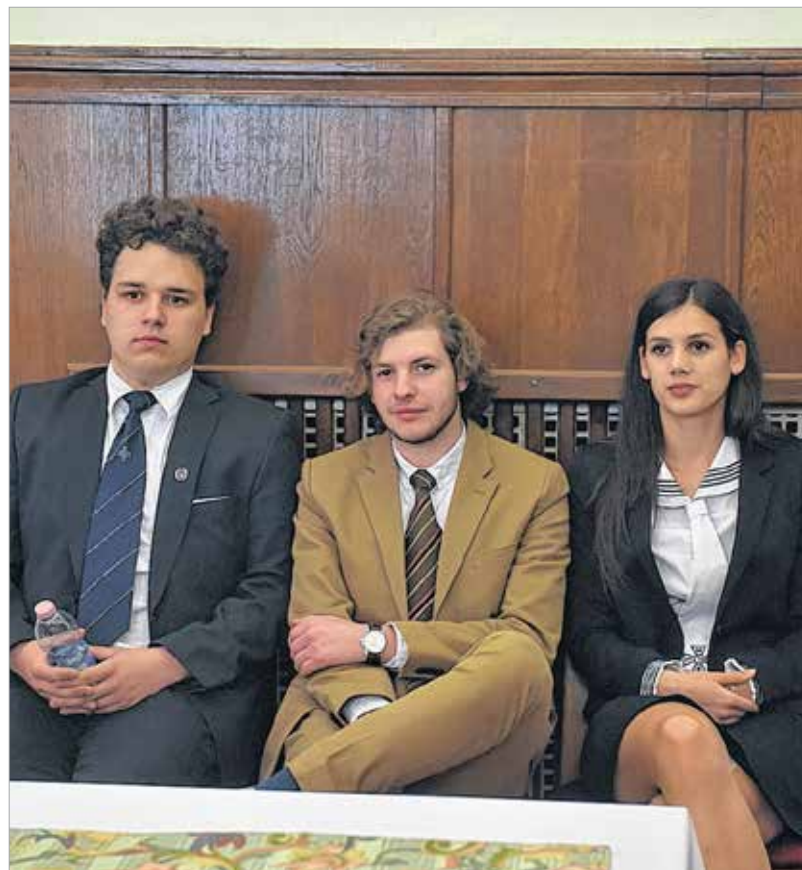
Mindenki egyért – egy mindenkiért

emlékszem című költeményével érkezett, Kertész Adám pedig talán a legjobb hazaszeretetről szóló magyar verset, Illyés Gyula Haza, a magasban című költeményét szavalta el a döntőben. Ferenczy-Nagy Boglárka Tóth Árpád Tetemrehívás című versét