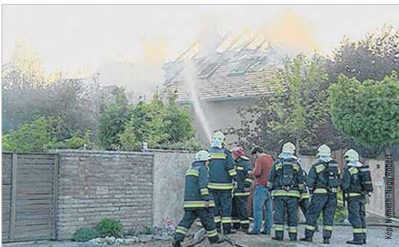
Hét vízsugárral fékeztek meg a lángokat a tűzoltók, szinte teljesen megsemmisült a családi ház. De Teki életben maradt!

tót riasztott, a legénység összesen hét vízsugárral fékezte meg a lángokat. A tűzoltás idején három robbanás történt, valószínűleg egy propán-bután palack robbant fel. Az épületekben összesen tizenegy gázpalack volt, a főkapitányság mesterlövészeinek hatot kellett hatástalanítaniuk. A tüzeset miatt senkinek sem esett baja, sőt a tűzoltók megmentették Teki is, aki az ott élő család kislányának kedvence, egy teknős. Hogy mi okozta a tüzet, a Fejér Megyei Katasztrófavédelmi Igazgatóság vizsgálja.