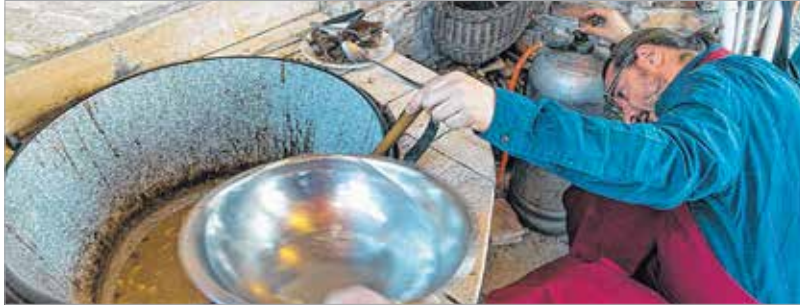
Az író a lángot ellenőrzi