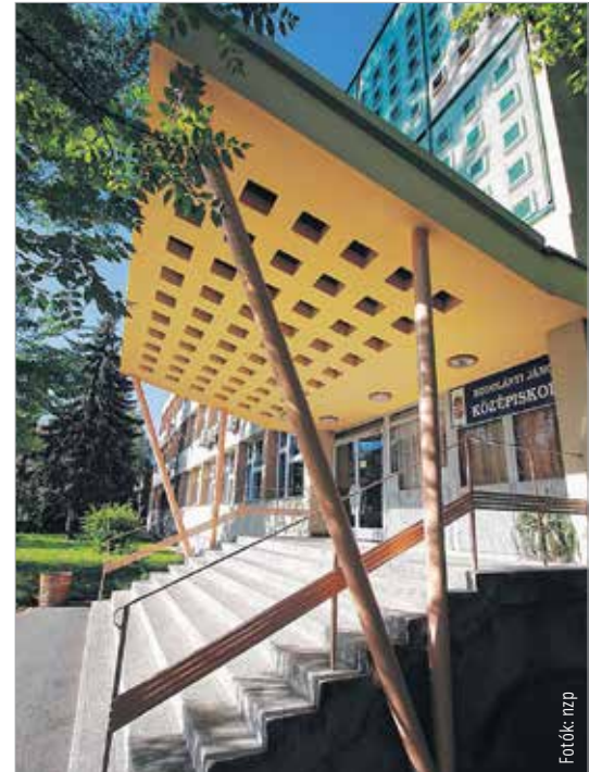
Még az első ütemben felújítják a Kodolányi Szakközépiskolát

Az első ütemre már a forrást is megkapta a város, ennek értéke hét és fél milliárd forint, de már a második ütemről is tárgyalunk. Három iskolát érint az átalakítás, de ezen belül fontos, hogy mindegyik iskola képes legyen megőrizni a hagyományait, miközben a jövőképet maga alakítja ki! Ugyanakkor egymás mellett a lehetőségeket közösen tudják kihasználni. A kis Ybl iskola lebontásra kerül, mert a felújítása nagyon sok pénzbe kerülne. Helyére egy zöldmezős beruházással épül meg az új Vasvári Gimnázium. Persze mindez nem holnap történik meg, úgyhogy a vasvárisok a régi épületbe menjenek még iskolába,