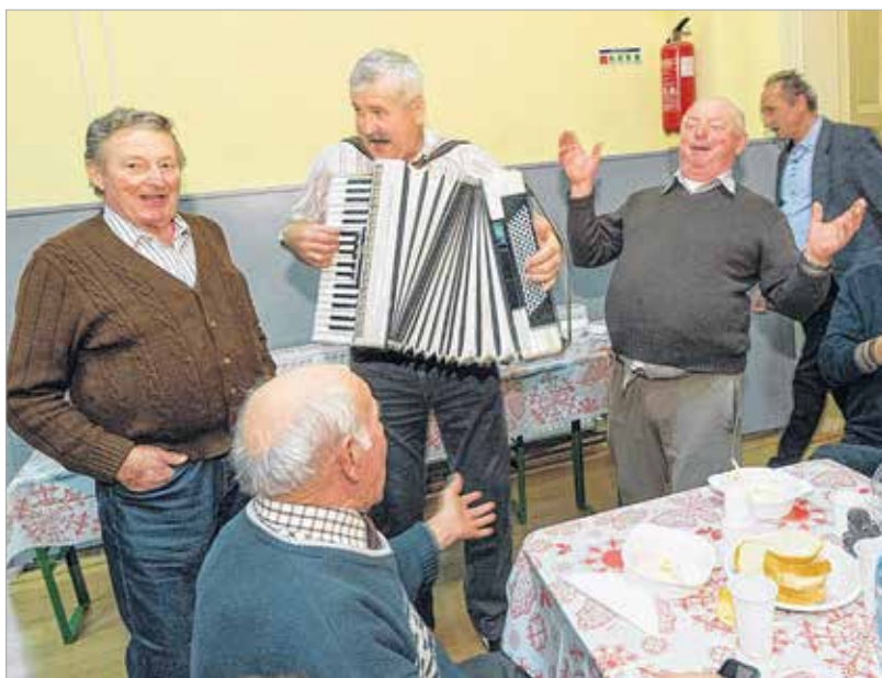
Elhúzta a nótáját...