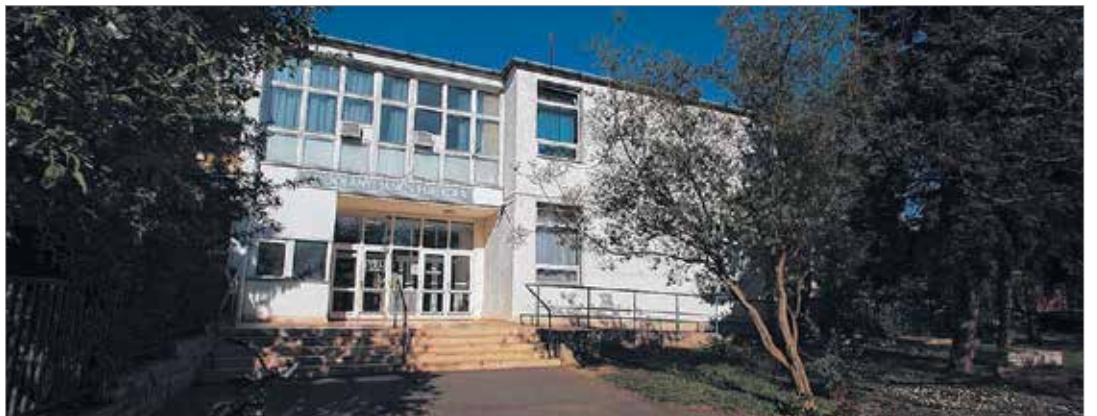
Az Ybl Általános Iskola helyén épül meg az új Vasvári

Még idesorolnám a megépült új kosárcsarnokot is. Ezek együtt mind azt a célt szolgálják, hogy a sporttagozat tovább fejlődhessen. Ott, ahol megfelelő nagyságú közösségi terek vannak, nem lehet akadály az időjárás.