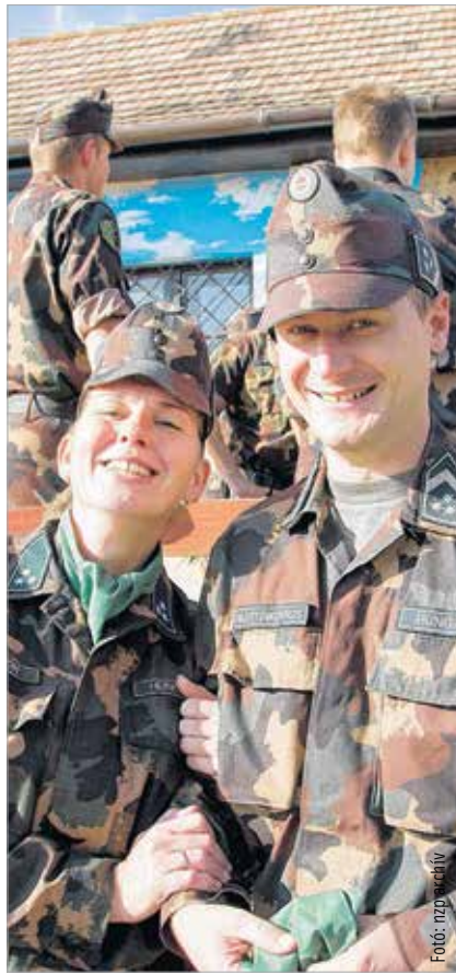
Katonák testközelből: a Rózsa ligetben és a Szabadságharcos úton újra találkozhatunk velük

A Rózsa ligetbe és a Szabadságharcos útra kilátogatók mobil toborzóponttal is találkozhatnak, ahol azonnal információt kaphatnak a bekerülés feltételeiről. Látványos haditechnikai bemutató, repülőgép-szimulátor és lézerpuska-lövészet is színesíti a programot.