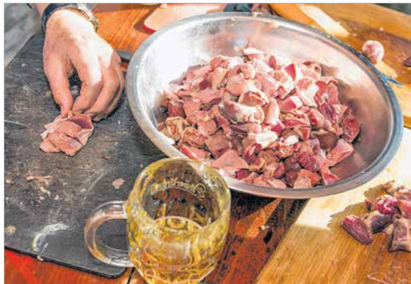
A jó munkához kell a sör

A kések úgy csattogtak a deszkán, hogy már majdnem elnyomták az éppen megörülni készülő dzsesszbanda háttérben szóló lemezét. A biztonság kedvéért az író lekapcsolta a lemezjátszót. Rendelt még egy korsót, és kiolvasztotta az üstben a szalonnából a zsírt. Külön is rakott hozzá zsírt, beledobálta a bőrkét, és