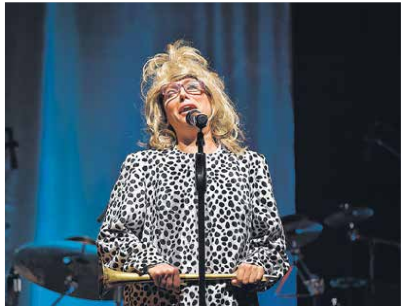
Magdicsku, a csúnya lány

R. M.: Számomra az maga a csoda, hogy jön valaki mindenféle zenei képzettség nélkül, csak a hangja van, amit úgy-ahogy kezel, aztán minden felfordul. Az első körben fogalmam sem volt, mit csinállok.