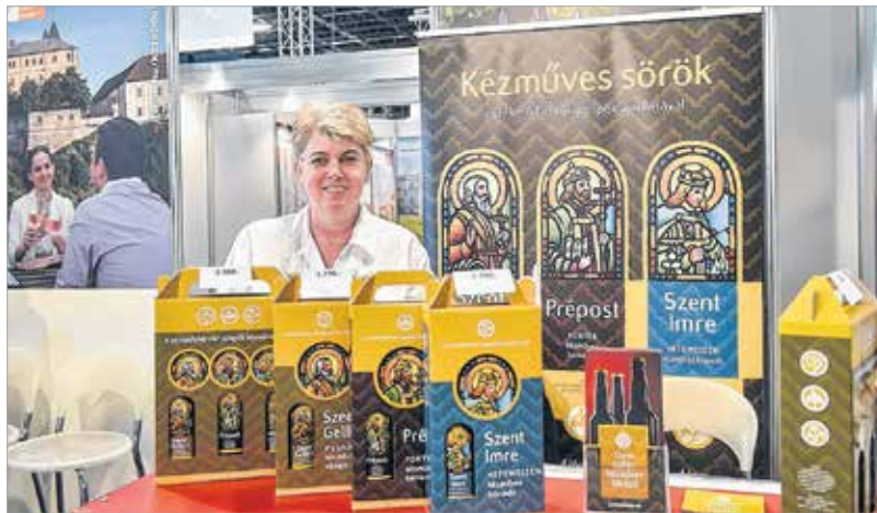
A sörtket meg lehetett kóstolni

a park nyitórendezvényét, a tavasz-köszöntő Floraliát hirdető plakátra. A fehérvári kiállítóhelyen mindenkit történelmi időutazásra hívtak, mely kétezer évet ölelt fel. Az ókort Gorsium képviselte, ami az idei esztendő legnagyobb idegenforgalmi újdonságát is jelenti. A látogatóközpont, az újjáépített erődfalszakasz, szolgáltatások és rendezvények teszik még vonzóbbá a régészeti parkot. Az ókor után