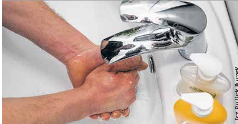
Fotó: Kiss László illusztráció

„Első lépése a seb ellátásának, hogy az, aki a sebet kezeli, alaposan, szappannal tisztára mosott kézzel kezdjen neki. Minden esetben, legyen szó akár a frissen keletkezett seb kötözéséről, ellátásáról, vagy ha csak kötést szeretnénk cserélni a már korábban szerzett seben!