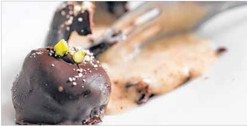
A roppanós étcsoki folyékony töltelékert rejt

A töltelékert egy villa vagy kanál segítségével beleforgatjuk a csokiba, aztán a sütőpapírra tesszük. A tetejére apróra darabolt pisztáciát vagy darált mandulát szórunk, aztán hűvös helyre – spájzba, erkélyre vagy az ablak alá – tesszük, hogy a bevonat megkőssön. Ha marad ki csoki, nehogy kidobjuk! Egy kiskanál segítsé-