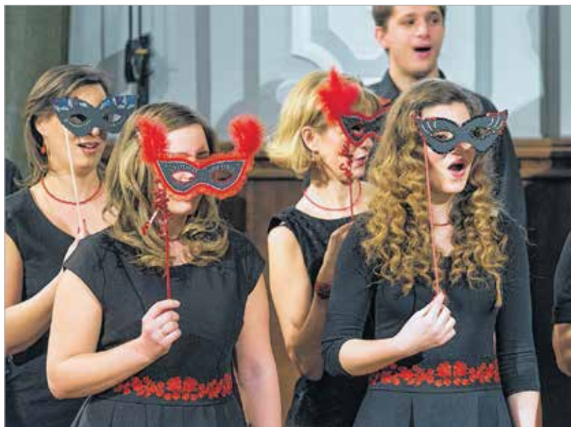
Álarcban is jól szóltak a kóristák

bérletünket valamilyen ünnep köré szervezzük, minden hangversenyünknek lesz egy bizonyos tematikája, és ebbe szeretnénk bevonni az eddigi