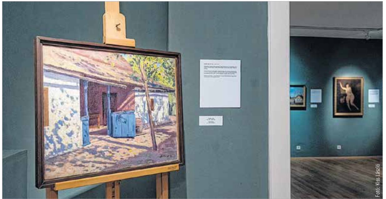
A tárlat huszonhárom alkotó életművébe nyújt betekintést. Szeptember 11-ig látogatható a Városi Képtár – Deák-gyűjteményben.

A szolnoki alkotóműhely egy tizenkét műtermes lakásból indult 1902-ben, és még ma is működik. A gyöngyházfényű ragyogás kifejezetten az itt alkotó művészekre jellemző. Ebben a térségben sok a szállópor a levegőben, ami nagyon érdekesen törli a fényt. Ennek a fénynek a visszaadása nagy kihí-