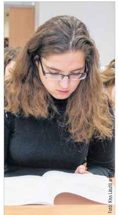
Az Alba Regia Középiskolai és Felsőoktatási Ösztöndíjat középiskolások és felsőoktatásban tanuló hallgatók kaphatják idén szeptembertől

Székesfehérvár januári közgyűlése fogadta el az Alba Regia Középiskolai és Felsőoktatási Ösztöndíj-program alapelveit. Végső döntés a márciusi közgyűlésen várható, így idén szeptemberben már elindulhat az ösztöndíjprogram. A programmal azt szeretné elérni a város, hogy egyensúly legyen a munkaerőpiaci kereslet és kínálat között, növekedjen a fehérvári felsőoktatásban tanulók száma, és nem utolsósorban azt is, hogy erősödjön a fiatalok város iránti kötődése – mondta el lapunknak