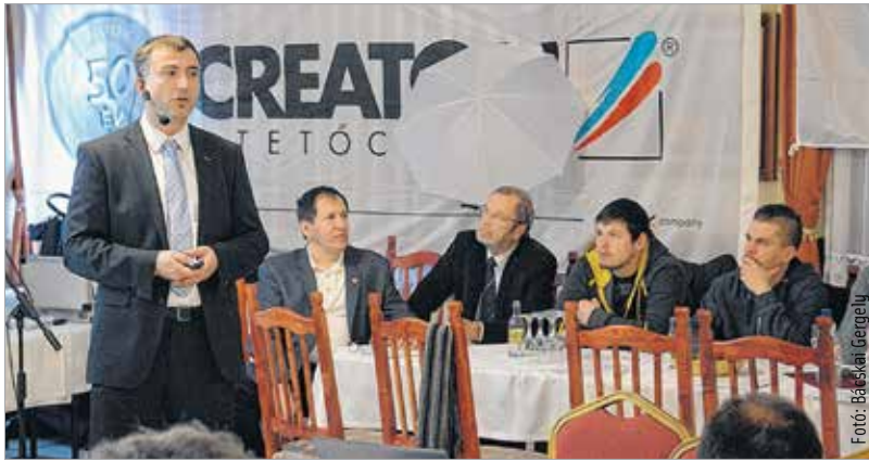
A konferencián a legújabb tetőtrendeket ismerhették meg a résztvevők