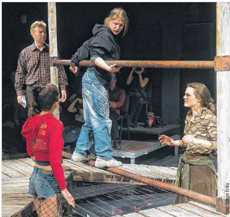
Egyszerre lent és fent

Ezen az estén gyakorolhattuk az azonosulás képességét, megfigyelhettük egyes karakterek jellemének és viszonyainak változásait, azok okait. A dráma társadalmi kérdéseinek aktualitása, a zárt, példabeszédszerű történet közös gondolkodásra sarkall. Együtt éljük meg a tanítói attitűdöt, a létező végleteket, a nagyon is valóságos lentet és a felfelé vezető utat, köszönhetően Hargitai Iván rendezői kvalitásainak: „Ez a darab ahhoz a vicces, groteszk gondolkodásmóddhoz áll a legközelebb, aminek óriási hagyománya van ebben a térségben. Hašek, Hrabal, Örkény István vagy a pesti kabaré valamilyen módon kapcsolódik ehhez a darabhoz. Egy ilyen múltbeli dilemma, miként maradjon komoly, hogyan ne legyen paródia. Izgalmas feladat rendezőnek, színésznek egyaránt. A szerepek megformálásánál fontos, hogy ha meg is jelenik egy-egy negatív értéktétel a figuráról, attól még szerethetőnek kell maradnia. Ha ez nem így történik, akkor elszakítjuk magunktól az embert. Ez a darab arról szól, hogy mennyire