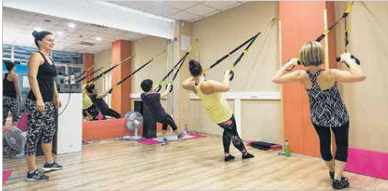
A hón áhított alak eléréséhez hetente három-négy alkalommal célszerű edzeni

„Ha jelentősebb túlsúllyal rendelkezünk, célszerű személyi edző segítségét kérnünk, aki a testalkatunknak megfelelő, izületkímélő edzéstervet állít össze részünkre. Segít az ideális étrend kiala-