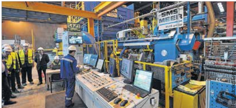
A helyi adóbevételek biztosítják a közösség számára a városfejlesztési forrásokat. Fehérváron tizenkétezer vállalkozás működik, melyek tavaly közel tizenhárom milliárd forint iparüzési adót fizettek.