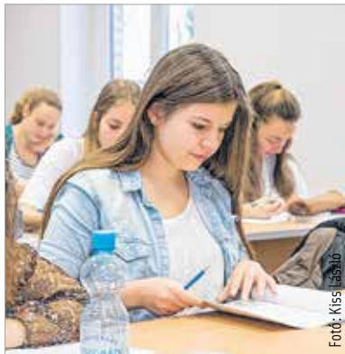
A feladatok megoldását a Studium Generale oldalán is meg lehet tekinteni

A program a felvételire és a szakokra vonatkozó tájékoztatással kezdődött: szeptembertől emberi erőforrások, gazdálkodás és menedzsment, pénzügy és számvitel, gazdaságinformatika, nemzetközi tanulmányok valamint kommunikáció és médiatudomány szakokra várják a jelentkezőket Fehérváron. A találkozó minden szükséges információt megtudhattak a leendő hallgatók az egyetem programigazgatóitól, tanulmányi vezetőitől valamint a hallgatók képviselőitől. A tájékoztatókat követően ingyenes lehetőséget nyújtottak az érettségi előtt álló diákoknak, hogy a májusban megírandó, már tétre menő érettségi előtt a valósághoz minél közelebbi körülmények között tehessék próbára tudásukat. A próbaérettségi feladatsora struktúrájában és követelményeiben teljes mértékben megfelelt az Oktatási Hivatal által meghatározott elvárásoknak. A szervezet oktatói az összes