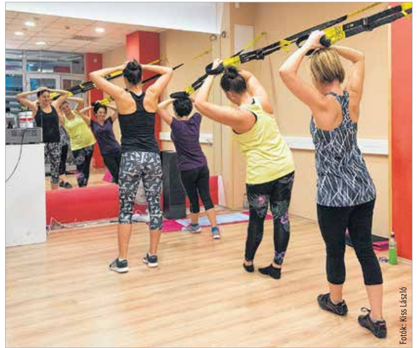
A trx az egész testet átmozgatja