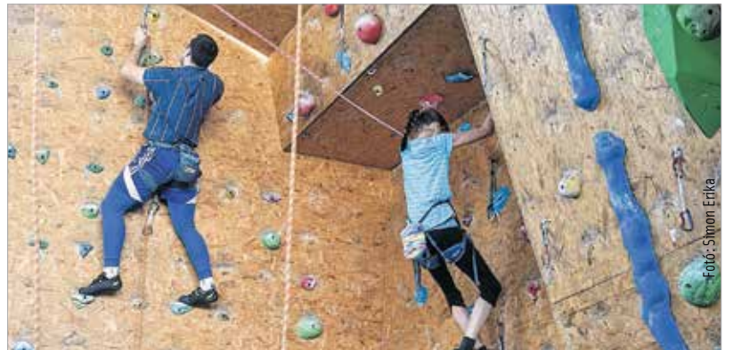
Fotó: Simon Erka

Nehézségi falmászóversenyt rendezett a Rotpunkt Sziklamászó Egyesület az István Király Iskolában. Gyerek, kezdő és tapasztalt mászók számára nyílt kategóriát hirdettek. Utóbbiak mezőnyében feltűntek országosan ismert versenyzők, összesen negyvenegyen neveztek. A versenyt Bubb Ferenc nyerte. S. Z.