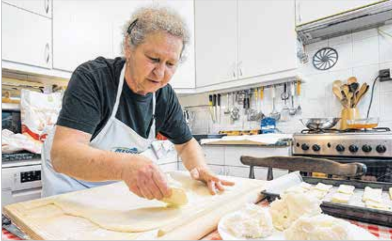
A hájat nem olyan könnyű a tésztára felvinni

Ismerjük meg a híres felsővárosi hájas pogácsát!