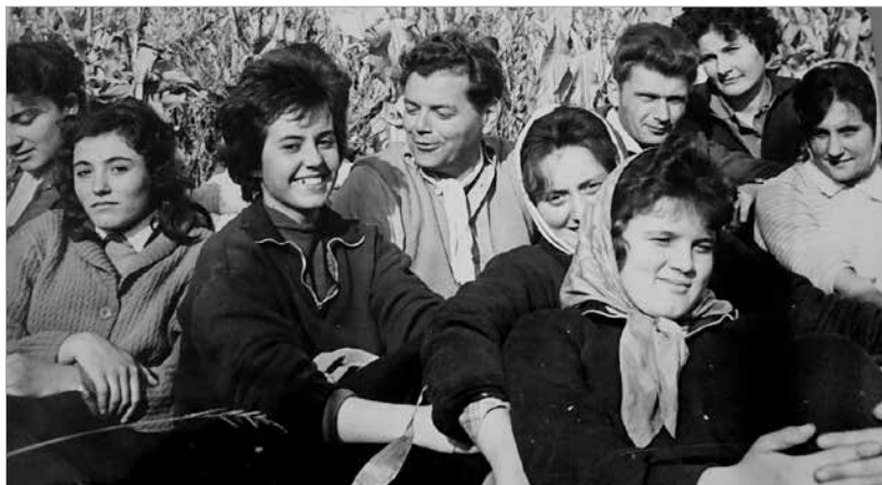
A videotonos műszerésztanulók elmentek kukoricát fattyazni