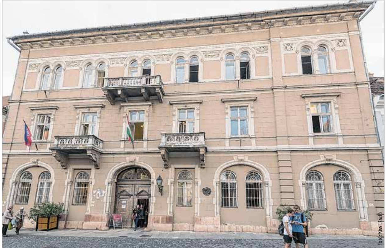
Ákár költözik a zeneiskola, akár marad, az épületet biztosan nem értékesítik. A város főterén nem kíván ingatlant eladni az önkormányzat.

Még semmilyen döntés nem született. A zeneiskola felújítására ebben a pillanatban nem látunk forrásokat – itt is több milliárd forintról beszélünk! Ha véglegesen eldől, hogy a Hermann költözik, akkor fogunk foglalkozni a zeneiskola épületével. Ebben az esetben szeretnénk olyan funkciót találni az épületnek, ami továbbra is városi közösségi tulajdonban tartja azt. A város főterén nem kívánunk ingatlant eladni, ezt sem. Az elmúlt években bizonyítottuk, hogy nem ez az a közgyűlési többség, amelyik a város vagyonát értékesíti és feléli. Ez a közgyűlési többség vagy visszavásárol, vagy megvásárol, és növeli a város vagyonát. Egy ilyen értékes épületet nem akarunk értékesíteni, akkor sem, ha más funkciót találunk a számára. Szállodáról is lehetett hallani.