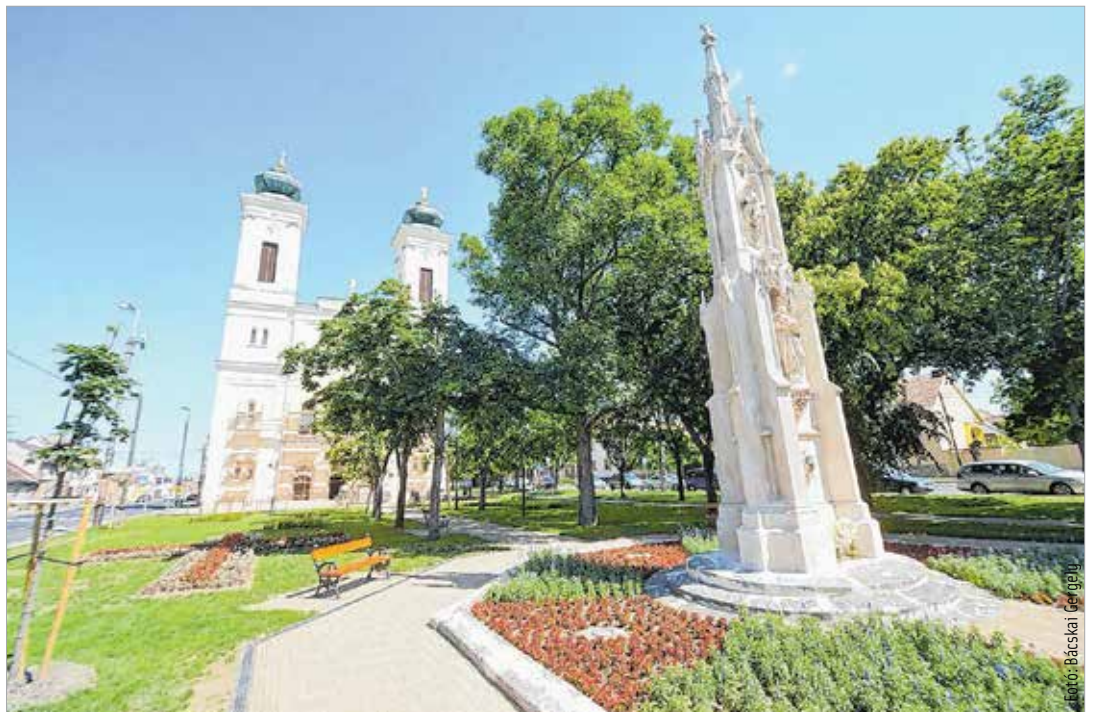
Ezen a téren avatják csütörtökön a második világháborús felsővárosi áldozatainak emléket állító szobrot

„A csütörtöki emlékműavatás ünnep és gyász egyszerre. A Doni Bajtársi és Kegyeleti Szövetség magától értetődő természetességgel állt az ügy mellé, megtisz-