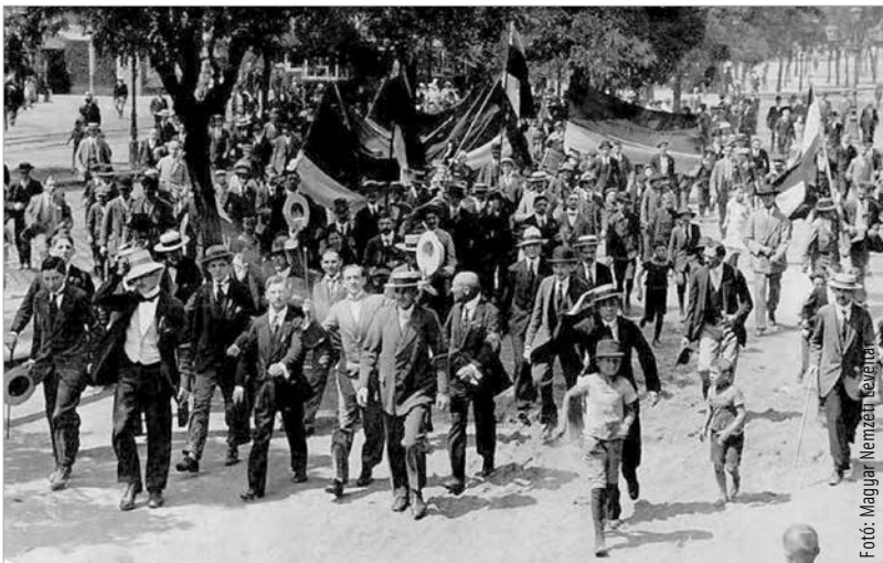
A Székesfehérvári Friss Újság 1914. július 28-án, kedden arról számol be, hogy a kaszárnyákban nem férnek el a katonai szolgálatra behívottak, sokan magánházakba szorultak