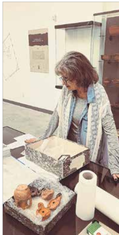
Látványos elemek, eddig nem látott műtárgyak – készül az állandó kiállítás