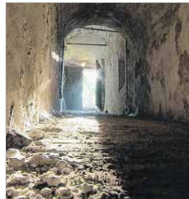
Rejthet még titkot a különleges hangulatú pince

Az Almási-pince több száz éves. Biztos, hogy az 1700-as években volt már itt pince. Az épület préházként, később pedig nagysága alapján valószínűleg rövidebb-hosszabb ideig lakóházként is szolgált. 1829-ben Wüstringer József felmérte az Öreghegyet, így a préházak, a telkek szinte centire pontos meghatározással térképre kerültek. Mintegy három hektáros birtok volt ez annak idején, s mint Öreghegyen mindenütt, itt is volt szőlő, borászat, sőt valószínűleg gyűjtőpincéként is működhetett a birtok annak idején. A ház környéke elvadult, de ha végigsétálunk a környéken, érezzük és tapasztaljuk azt a különleges atmoszférát, ami körülöleli a helyet. Maga a pince jó állapotú, egyetlen helyen vár javításra, ugyanis a két pincszakaszt összekötő rész részlegesen beszakadt. A ház állapotáról azonban ez már nem mondható el: az épület beázik, teteje beszakadt.