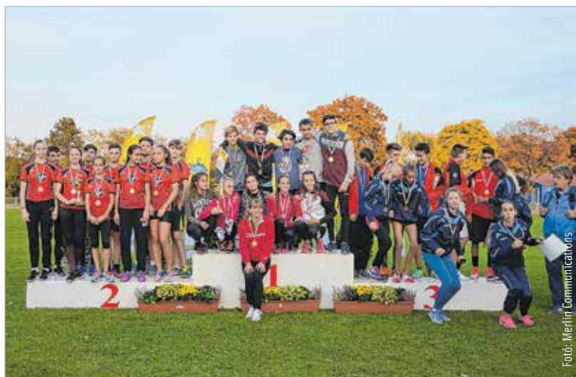
A 10x200 méteres váltófutás dobogójának tetején a Hétvezér Iskola csapata