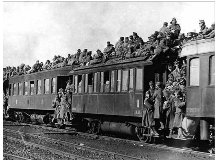
Frontról hazatérő katonák 1918 őszén