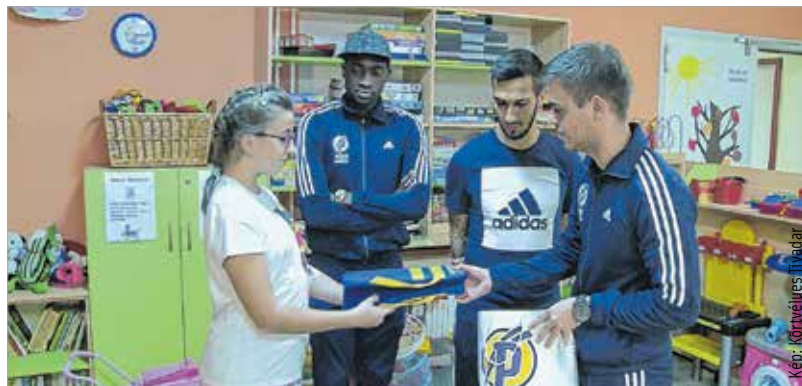
A Puskás Ferenc Labdarúgó Akadémia NB I-es csapatának képviselői látogattak el a kórház újszülött- és csecsemőosztályára. A focisták nem érkeztek üres kézzel, fonalakat és egyéb ajándékokat hoztak a kórháznak és az apróságoknak.