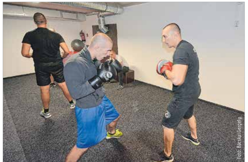
Hamarosan új edzőteremben készülhetnek a VT Vasas bunyócsai

Ha a klub nevét hallja valaki, nagy valószínűséggel eszébe jut 1941. és a Videoton jogelődjét jelentő labdarúgócsapat alapítása. Nem véletlenül: „A névváltoztatás oka egészen egyszerűen az volt, hogy az egyesületünk alapjait Vidi-szurkolók tették le. Először egy kis baráti társasággal kezdtünk boksolni, és a Vörösmarty Általános Iskolában tartottunk edzéseket, majd a Prohászka úton béreltünk egy termet. Szépen fejlődöttünk, és hittünk abban, amit csináltunk.”