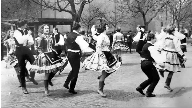
A felsővárosi néptáncosok rendszeresen felléptek a május elsejei műsorban