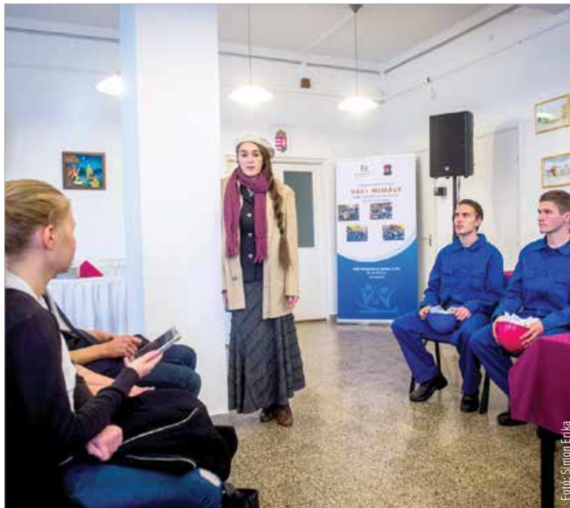
Az október 23-i előadásban a Váci Mihály Mihály Szakközépiskola diákjai is közreműködnek