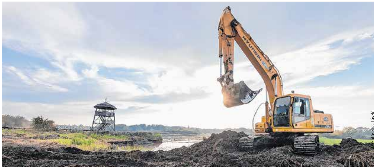
Jól halad a Sóstó rehabilitációja. A teljes rehabilitáció magában foglalja majd a természetvédelmi terület környezetében lévő utak, járdák, parkolók, sétányok felújítását, valamint a Sóstó keleti kapujánál a Vadmadárkórház kialakítását és egy közösségi ház megépítését is. Jövőre pedig újra birtokba lehet venni a már megmentett Sóstót.

Nézzé meg ön is, mire kíváncsiak a fehérváriak, és mit kérdeznek a polgármestertől! Október 20-án, pénteken 19 óra 25 perctől még több téma terítékre kerül a Fehérvár Televízió Köztér című műsorában!