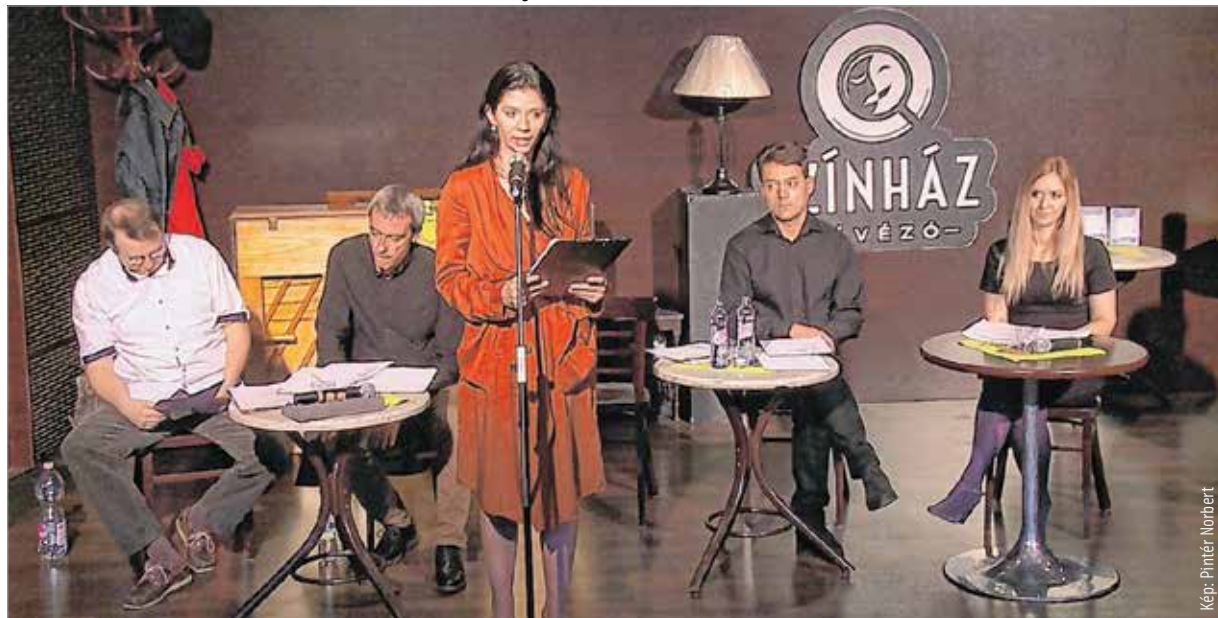
A Vörösmarty Irodalmi Szalon kivételes ajándék a versek kedvelőinek