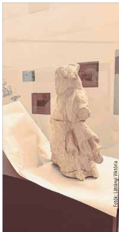
A tárgyak folyamatosan kerülnek be a tárolókba