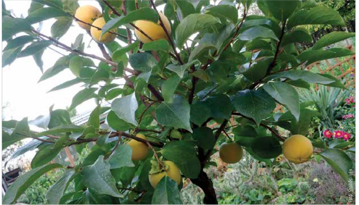
A datolyaszilvafa első termése a napokban érik

Dehogyan! Nyugdíjasklubba is járok, a Kertbarát Egyesület alelnöke vagyok, a szárazréti és a palotavárosi közösségi kert is hozzánk tartozik. Azon kívül van egy nagyobb