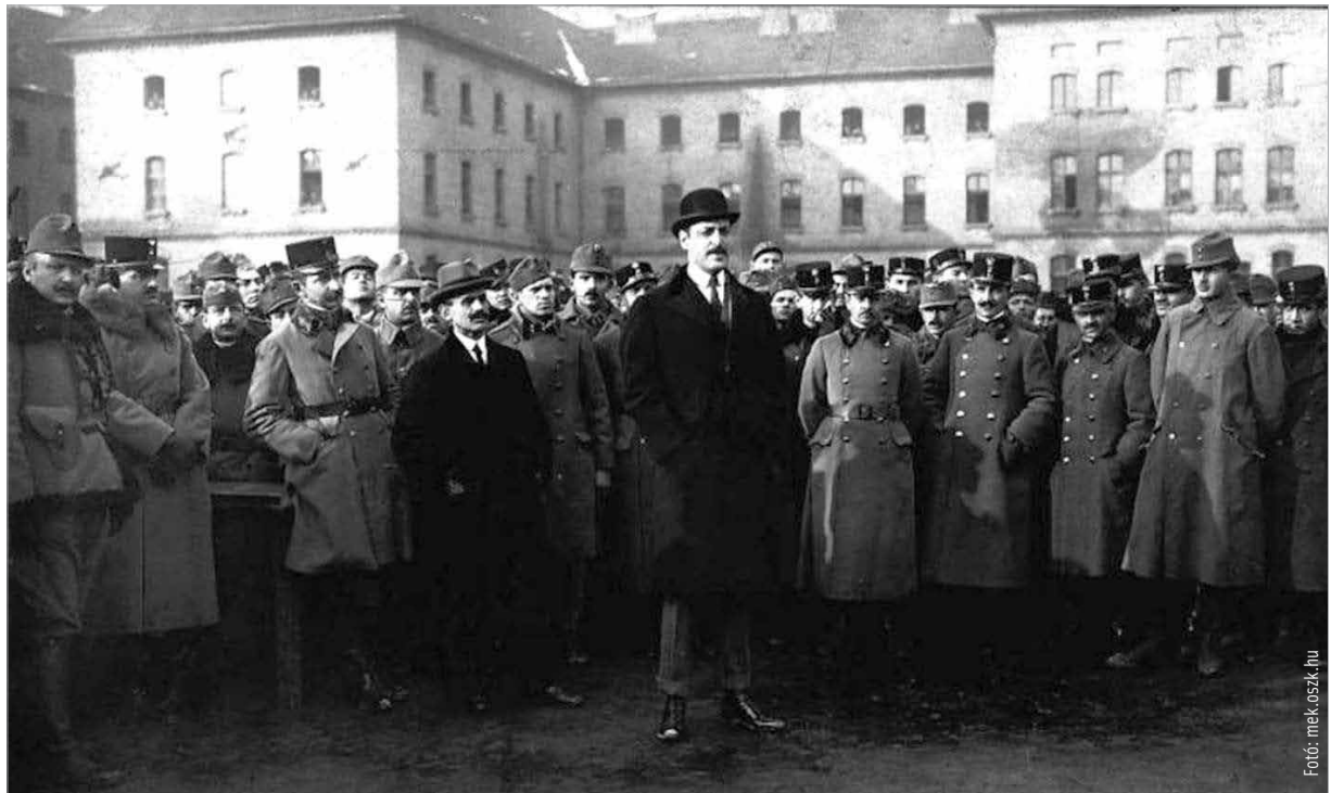
Károlyi Mihály, mint honvédelmi miniszter az 1. honvéd gyalogezrednél. Budapest, 1918.

lemondó nyilatkozattal valami végleges és visszafordíthatatlan dolog történik. Kétségbeesett gyorsasággal a megyegyűléshez fordult, hogy indítványt terjesszen elő a törvényes jogállapot, azaz a királyság visszaállítására. A megyegyűlés azonban süket csenddel válaszolt. Értve a finom jelzésekből, mely szerint a főispánnal szemben