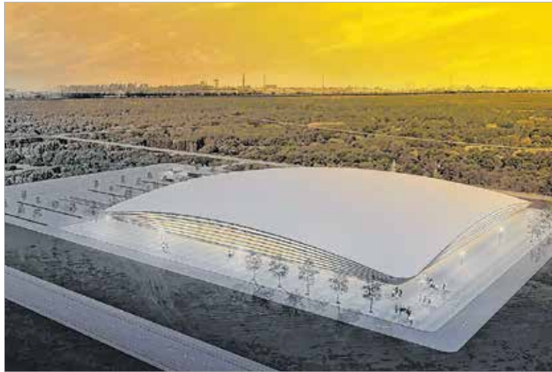
A látványterv alapján impozáns építménnyel gazdagodhat Fehérvár