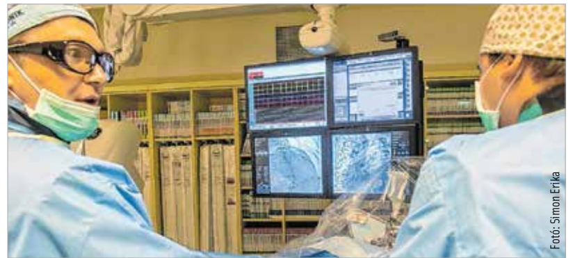
A két műtőasztalon szívkatéterezés és pacemaker-beültetés végezhető