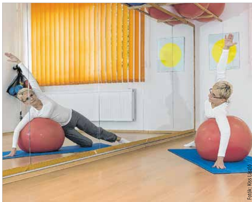
Az egyéni órák teljesen testre szabottak

Joseph Pilates közel száz évvel ezelőtt kidolgozott egy több mint háromszáz gyakorlathal álló edzéssorozatot, ami megerősíti a hátizmokat, hasizmokat, farizmokat – ez biztosítja a megfelelő tartást a gerincoszlopnak. A gyakorlatokat részekre lehet bontani, ezért mindenki számára elvégezhető. Természetesen egy kezdő vendég esetén állapotfelmérést végzünk, megbeszéljük, hogy mik a problémák, és ezeket figyelembe véve alakítjuk ki a gyakorlatsort. A legszebb a dologban, hogy a