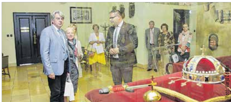
A konzultációt követően az alpolgármester megmutatta a vendégeknek a koronázási eszközök másolatát, az Aba-Novák-szekkőt és a Városháza Dísztermét

állami feladatként működnek, és az iskolák fenntartója megváltozott. Hangsúlyozta, hogy komoly erőfeszítéseket tesz a város az életpálya-modell folytatása illetve kiterjesztése mellett a szociális területeken is. Romain Wolf a szervezet munkájával kapcsolatban ismertette, hogy öt éve végzi az elnöki feladatokat. A Luxemburgban működő CESI haramincezer tagot számlál. Hangsúlyozta a nemzeti és európai szinten egyaránt fontos szociális pillér jelentőségét, melyben a sikerek elérését a bérek emelésével és a munkakörülmények javításával tűzték ki – ez lesz számukra a következő hónapok tárgyalásainak elsőrendű témája. A székesfehérvári intézmények feltételeiről és fejlődéséről pedig azt mondta, ez a helyes és járható út. Forrás: ÖKK