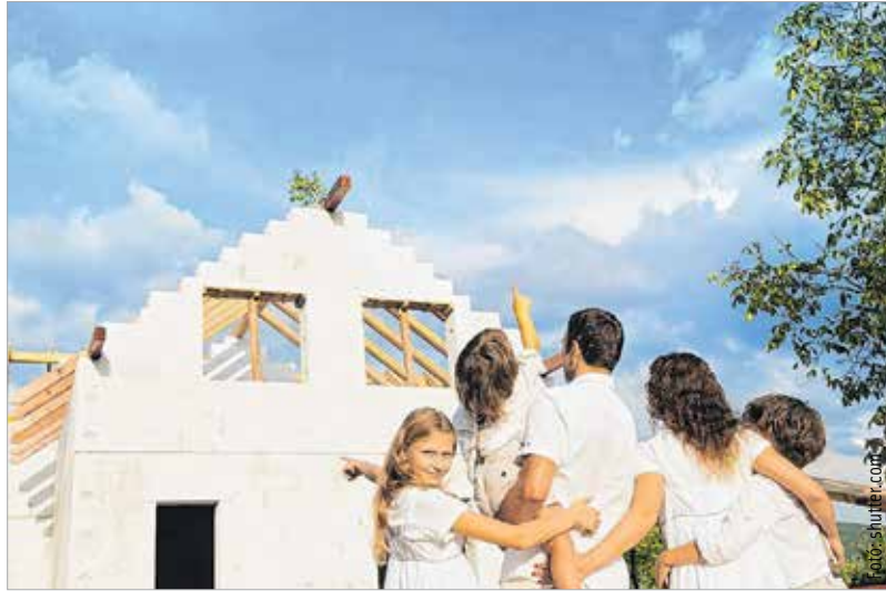
Az utóbbi másfél évben negyvenezer család élt a csok-kedvezménnyel

Sokan kezdtek új ház építésébe, az adatok szerint folyamatosan nő