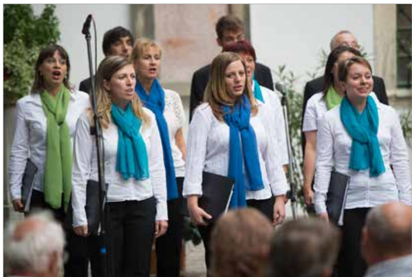
A Vox Mirabilis Kamarakórus szombaton este az Ars Sacra Fesztivál részeként, a nyitott templomok napján adott koncertet a múzeum díszudvarán. Lengyel zeneszerzők művei fogták keretbe az előadást, mindkét mű a békeért felcsendülő könyörgés volt.