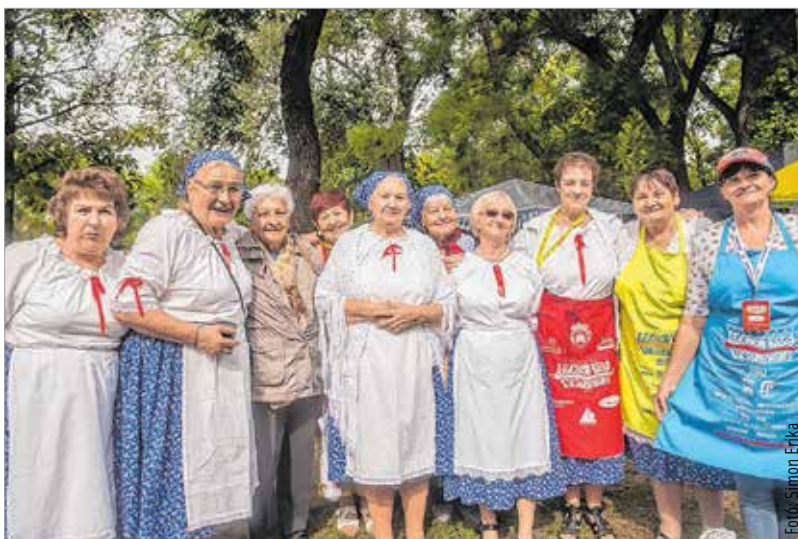
Együtt a nagy generáció