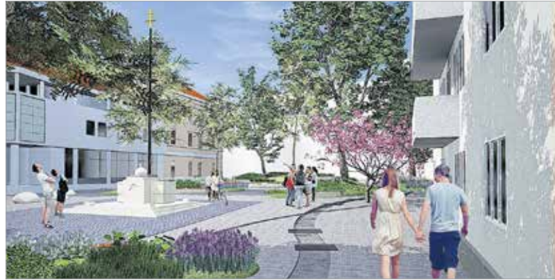
A régészeti feltárást követően indul a munka az Országzászló téren. Eredeti helyén marad a Virágóra, és méltó módon megújul az országzászló emlékműve.