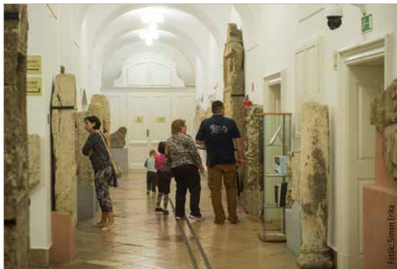
A fehérváriak és az ide látogatók örömmel fogadták, hogy egész hétvégén nyitva álltak a Szent István Király Múzeum kiállítóhelyei. Emellett olyan különleges helyeket is felkereshettek, mint például a Nemzeti Emlékhely, a Hiemer-ház, az Árpád fürdő, a Szent Anna-kápolna, a Rác templom vagy a Fejér Megyei Levéltár.