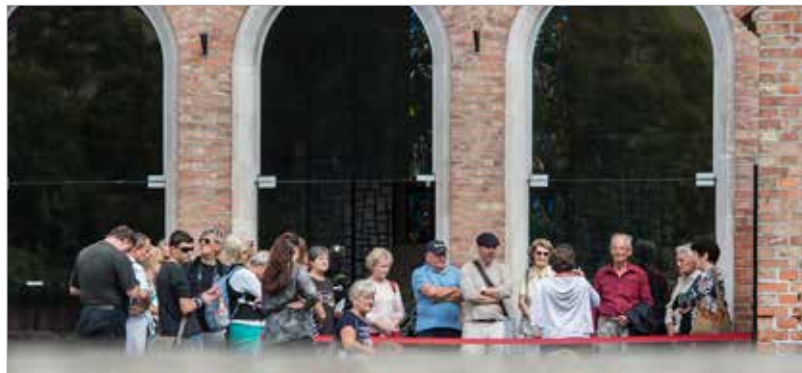
A koronázási bazilika története címmel kiállítás nyílt a Nemzeti Emlékhelyen. A tárlat interaktív módon, gazdag látványelemekkel mutatja be az egykori koronázótemplom történetét a kezdetektől napjainkig.

Hétvégén az összes székesfehérvári kiállítóhelyet ingyenesen lehetett látogatni, és érdemes volt este is a belvárosban sétálni, hiszen az érdeklődők egyedülálló fényfestést láthattak a mauzóleum homlokzatán. A tízperces, három dimenziós animációs film az egykori koronázótemplomot elevenítette meg, életre keltek a Szent István Király Múzeumban őrzött kőtöredékek, de megjelent III. Béla király arc-rekonstrukciója is.