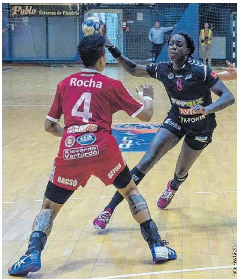
Menyéknek a Kisvárdá ellen nem, a Kecskemét ellen összefőtt az első idei győzelem