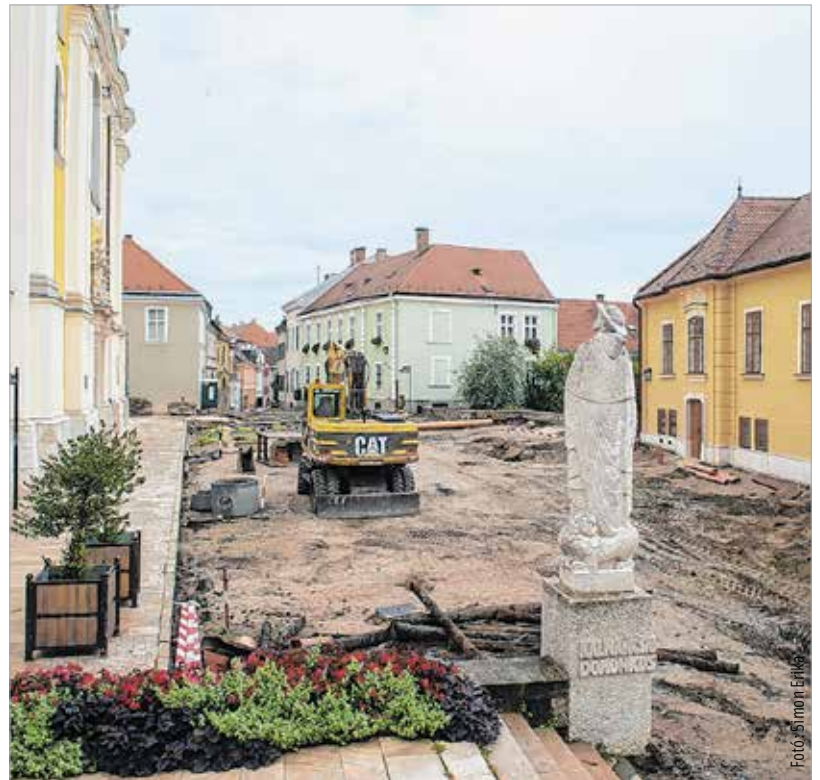
A bazilika előtti téren üvegfedéssel mutatják majd be a régészeti feltárások eredményét

Közbeszerzési eljárást írt ki a város a bazilika előtti ősi négykaréjos templom bemutatására. A II. János Pál pápa téren üvegfedést mutatják majd be a régészeti feltárások eredményét. A képviselők döntöttek arról is, hogy pályázatot írnak ki a közösségi közlekedés szolgáltatójának kiválasztására. A jelenlegi szerződés az év végén jár le, az új megállapodás 2018. január 1-jétől 2020. június 30-ig szól majd. Cser-Palkovics András lapunknak elmondta, hogy a pályázat jelentős előrelépést jelenthet majd a szolgáltatás színvonalában. Térfigyelő kamerákat helyeznek el a Túrósáki út mellett épülő szabadidőpark és sétány területén. A kivitelezőnek november végéig kell elkészülnie a munkával, melynek során a park közvilágítása mellett a pályák megvilágítását is kiépítik, továbbá kicserélik a villanyoszlopokat. A 246 millió forintos beruházás uniós forrásból zajlik: rekreá-