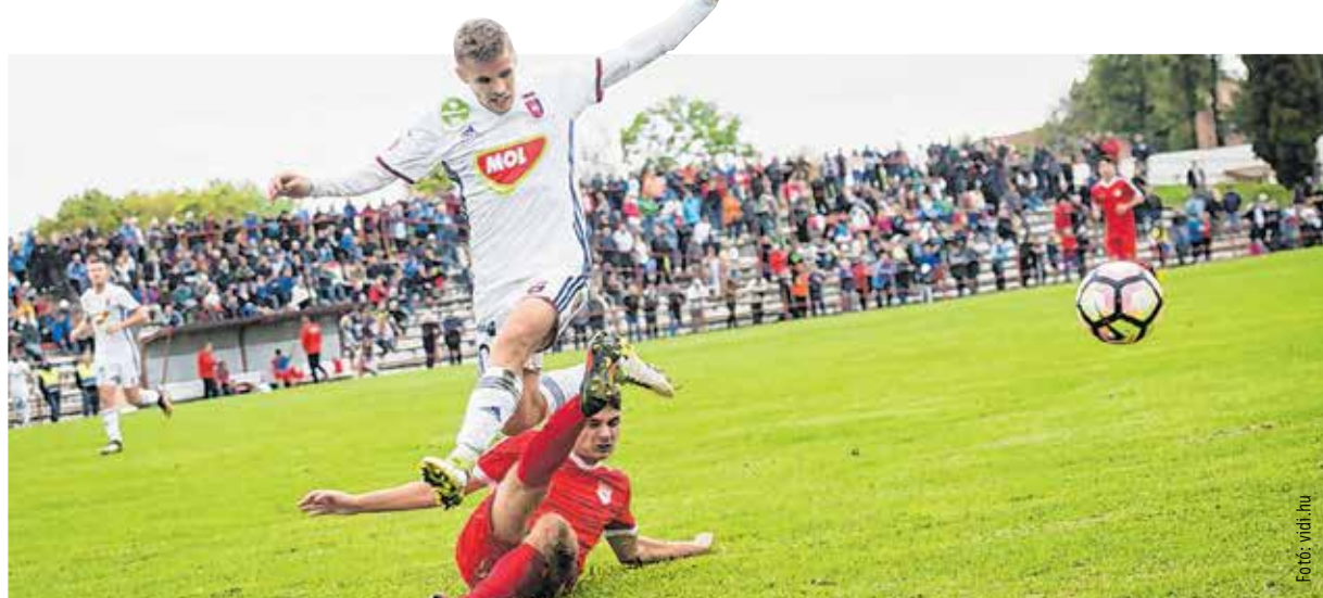
A Vidi könnyedén szárnyalt, a mohácsiak – ha kellett – csúsztak-másztak

Csendesen csordogált a meccs, ha a mohácsiak levegőhöz jutottak, bátran futballoztak, de esély sem volt arra,