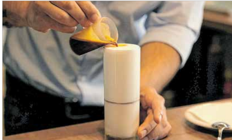
A tejeskávé is egy presszóval kezdődik

egy héten akár többször is változik, de egyszerre mindig csak kettőt használunk. A világosból általában nem rendelünk nagy mennyiséget, hiszen szeretnénk minél többféle kávé t kóstoltatni a vendégeinkkel,