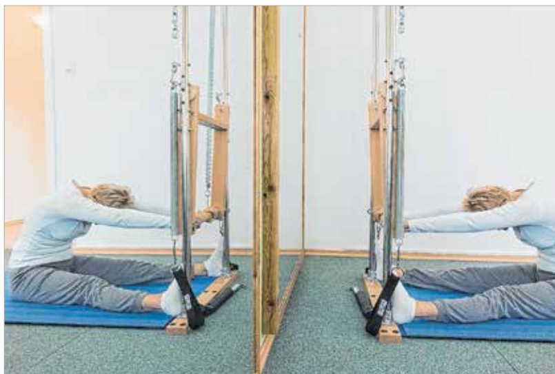
A gerinc nyújtását gépek segítségével is végezhetjük

Egy profi stúdióban vannak csoportos és egyéni órák. A csoportos órákon is csak nyolc-tíz ember dolgozik együtt az oktató irányításával, aki nem tornázik, csak figyeli a vendéget és javít. Az egyéni órák teljesen testre szabottak, pilates gépekkel és egyéb eszközökkel. Mozgásszervi problémákkal először ezt szoktuk javasolni, és a legnagyobb eredmény, amikor a vendég átkerül a csoportos órára.