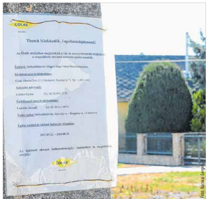
A kátyúzás folyamatos lesz a téli időszak alatt, nagy sár, járhatatlan szakaszokra nem kell számítani. De a lakók bármikor hívhatják az építésvezetőt, akinek a telefonszáma több helyen megtalálható az utcában, és jelezhetik, ha valahol a süllyedés miatt mégis kátyúzásra van szükség.

sa a fásítással, növénytelepítéssel és füvesítéssel együtt. Komoly mennyiségű új fa és bokor kerül a Csutura utcába, melyek ültetését csak ősszel lehet elvégezni.