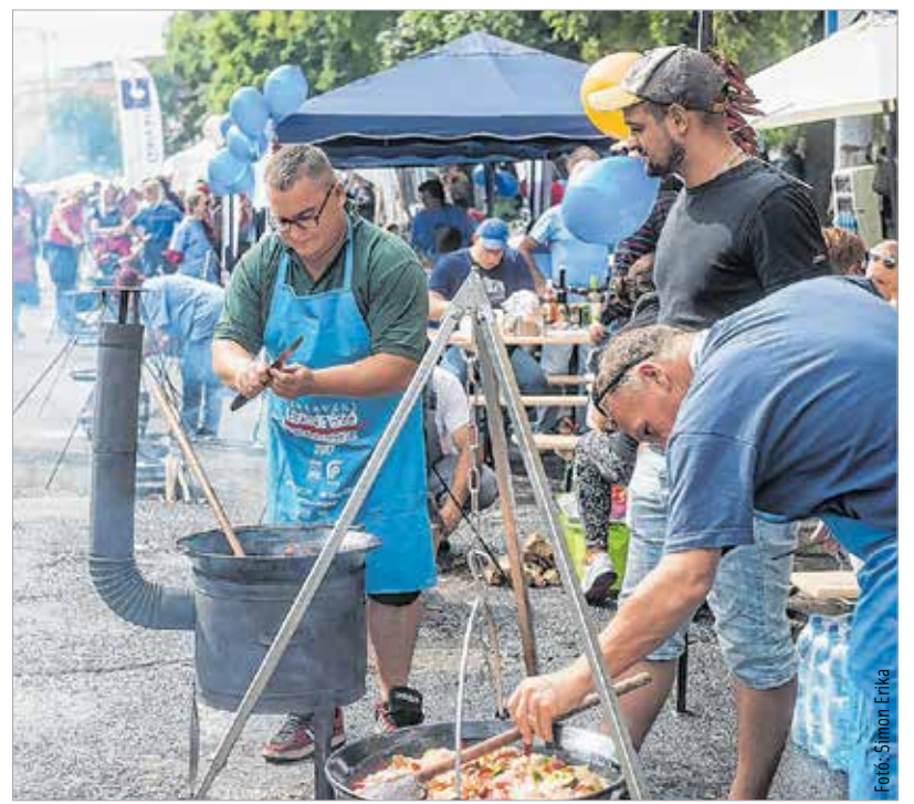
Füst szötte csodanap