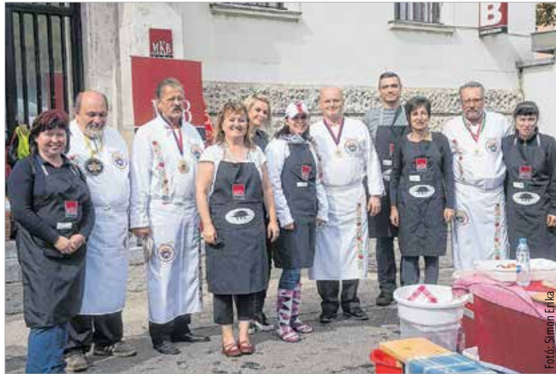
Fehérek és feketék

Idén végérvényesen bebizonyosodott, hogy a lecsófőzés egy közös játék, ahol a füst szötte világban dalsokrokkal, bográcsközelben, az üdvözült gasztromágusok uralta térben egymásra találhat minden jó szándékú ember, kicsik és nagyok. Vargha Tamás honvédelmi miniszterhelyettes kiemelkedő közösségi élménynek tartja a találkozót: „A lecsó ürügy az együttlétre. Egy egyszerű étel, ami veszélyt rejt magában, hiszen könnyű elkészíteni, mindenki ért hozzá. Ugyanakkor lehetőséget nyújt arra, hogy kreatívan, a saját ízlésünk szerint készítsük el. A közösségi élmény az, ami ezt a találkozót különlegessé teszi!” Cser-Palkovics András polgármester köszöntő gondolatsora a múltból indult ki, hogy megérkezzen a jelenbe, és megmutassa a jövőt: „Ez a közösség évről évre osszejön a lecsófőző vigasságokon. Láthatóan