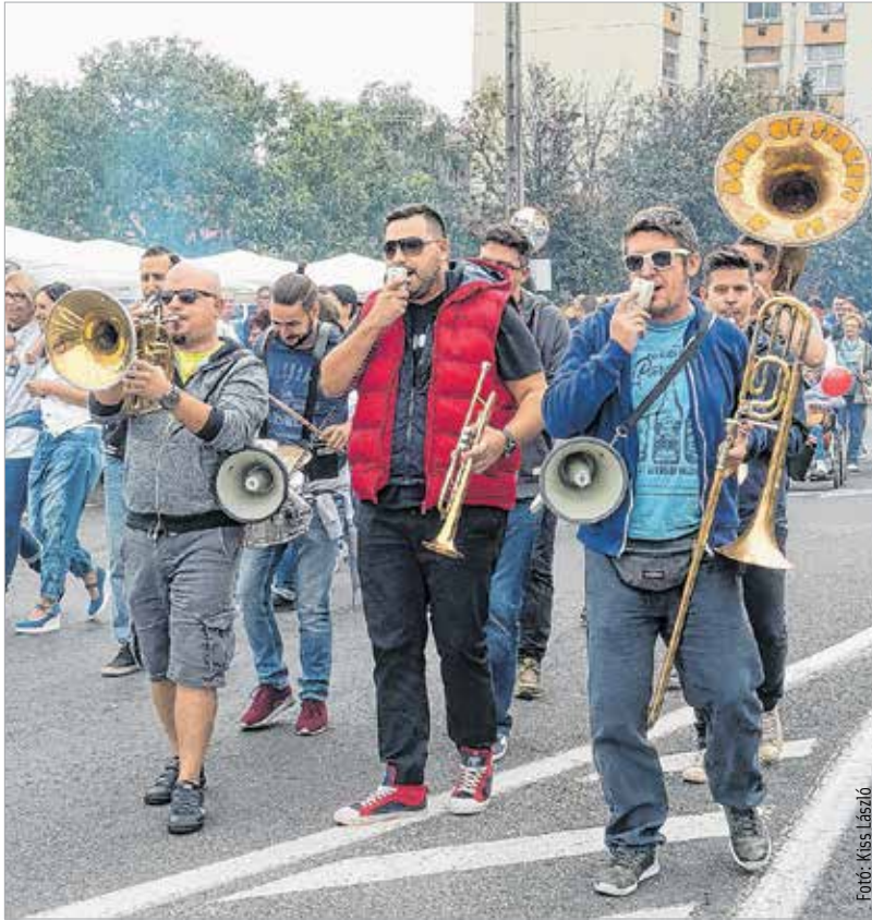
A rézfúvos utcazene elűzte a felhőket, de a főzőket táncra perditette