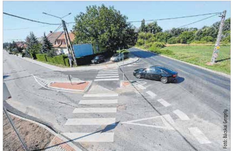
Nagyméretű útsatlakozást építettek, melyet biztonságosabban lehet használni a korábbinál. Új közvilágítási oszlop is épült, illetve a meglévőknön lecserélték a régi lámpafejeket.

Rózsáhegyi út közötti szakaszán korábban nem volt járda, így a gyalogosoknak a 811-es úton a kamionok között kellett közlekednie. „Nagyon örülök annak, hogy ez a balesetveszélyes, áldatlan állapot megszűnt. Ezzel együtt felújítottuk a Béla úton a Szeredi és a Rózsáhegyi utca közötti járdaszakaszt, és elkészült a csapadékvíz elvezetés is.” – mondta a képviselő, aki köszönetét fejezte ki a Városgondnokságnak és a kivitelezőnek.