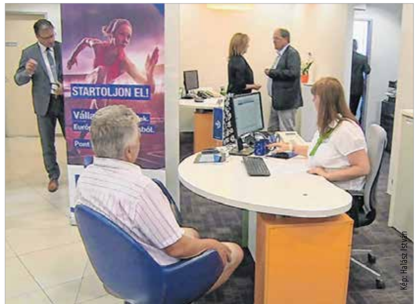
Mostantól egyszerűsödik az ügyintézés

Unió forrásokhoz való hozzáférést minél szélesebb körben, minél hatékonyabban biztosítsa. Összesen 16 termék közül választhatnak a vállalkozók és magánszemélyek. Újdonság, hogy minden termékben van visszatérítendő rész, azaz hitel. Nemcsak a megszokott vissza nem térítendő támogatásokról van szó, hanem a pénzek egy részét visszakapják, és ezeket újból ki tudják helyezni. Ezeknél a hitelek-nél az önerő-elvárás, a biztosítéki rendszer és a hitelbírálati elvárások is eltérnek a kereskedelmi banki sztenderdektől.