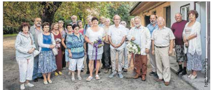
A sárkeresztúri szülői háznál emlékeztek meg a költő Bella Istvánról, aki egy ideig a Fehérvár Televízió főszerkesztője is volt