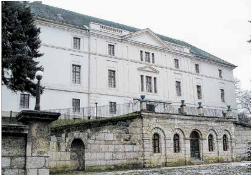
A bicskei Batthyány-kastély napjainkban