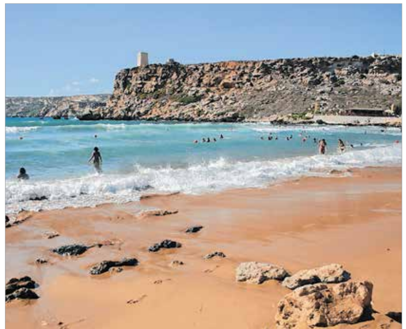
Málta egyik legszebb öblében homokos strand is van

A máltaiak persze minderről nem akarnak tudni.” Jó azért ezekkel is tisztában lenni. Szent Pál-kápolnája után aztán még megnéztük az öblöt védő, nemrég újjáépített Wignacourt-tornyot, amit Adrien de Wignacourt Grand Master építtetett 1610-ben. Röviden összefoglalva ezek lennének Bugibba látnivalói. Ha a tengerpartok és Szent Pál-öble mellett mást is fel akarunk fedezni, akkor tegyünk egy kirándulást a fővárosba, Valettába is. Sajnos a szigetország másik híres látnivalója, a gozói Azúr-ablak 2017. március 8-án összeomlott.