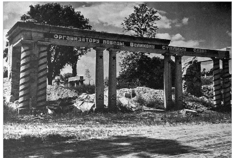
Az utolsó felvételek egyike a romokban álló polgárdi Batthyány-kastélyról, amin orosz felirat dicsőíti a diktátort, Sztálint

megtorlatlanul. Börtönbe és elmeegógyintézetbe zártak koncepcióis ítélet alapján, mert a hatalmat nem lehet büntetlenül kicselezni. Előbb azonban megvárták, míg a köztisztviselőben álló, szerteágazó kapcsolatokkal rendelkező szülők meghalnak, hogy semmilyen akadály ne gördüljön megsemmisítése elé. A mondén világ biszex festője egyéni stílussal, színesen jelenítette meg a felső körök életének epizódjait, a mára végleg eltűnt miliőt, csillogó szépre retusálva a kezükben pezsgőt tartó elegáns hölgyeket. A csaknem két méter magas gróft korának legelegánsabb társasági szereplőjeként tartották számon. 1946-ban még díszvendége volt az extravagáns Esterházy Pál herceg és a primabalerina Ottrubay Melinda szűk körben megtartott esküvőjének. Elizabeth Arden, a divatvilág királynője is rajongott érte. Tízezer dollárt küldött részére, hogy kimenekítse az országból a nehéz időkben. Nem leszek egy amerikai milliomosnő pincsikutyája – mondta, talán kissé elhamarkodottan. Leülte, amit kiszabott rá a hatalom, a volt inasánál töltötte el hátralévő éveit, és felfokozott munkatempóban ontotta a festményeit. Bálint nevű fiának is akkor kellett bíróság elé állnia, amikor édesapja már nem élt. 1960-ban egy állítólagos 56-os tettéért, amelyet soha nem ismert el. Vasúti pályamunkásként halt meg. A „véletlenül”