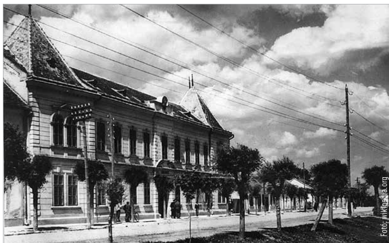
Az enyingi Batthyány-kastély az 1960-as években

A XX. század elején a grófi kastélyok egy részét tulajdonosaik értékesítették. Földjeik, gazdaságaik már nem termelték ki a kastélyok és pazar életmódjuk fenntartásának költségeit. A földreform, a gazdasági válság sem kedvezett a családi költségvetéseknek. Ez időtájt adta el a székesfehérvári, Kossuth utcai Zichy palotát Rafael gróf a város részére, a szintén Kossuth utcai Széchenyi palotát Széchenyi Viktor gróf úri kaszinó céljára. Hasonló sorsra jutott egy sor pesti palota is. Károlyi Zsuzsanna alighogy megvásárolta a bicskei birtokot és benne a 80 helyiségből álló kastélyt, 14 év múlva értékesíteni kényszerült. A vevő, Népjóléti és Munkaügyi Minisztérium ingyenes használatra továbbadta a Fővárosnak szociális célokra. Anya- és csecsemővédelmi intézet, átmeneti leányotthon, ma pedig gyermekotthon működik a falai között. Folyamatos használatával ez a kastély is megmenekült a pusztulástól. Polgárdi a Batthyányak legrégebbi birtoka, még a Kóvágó Orsi időszakból való. A kastély a XVIII. században épült barokk stílusban. A család grófi