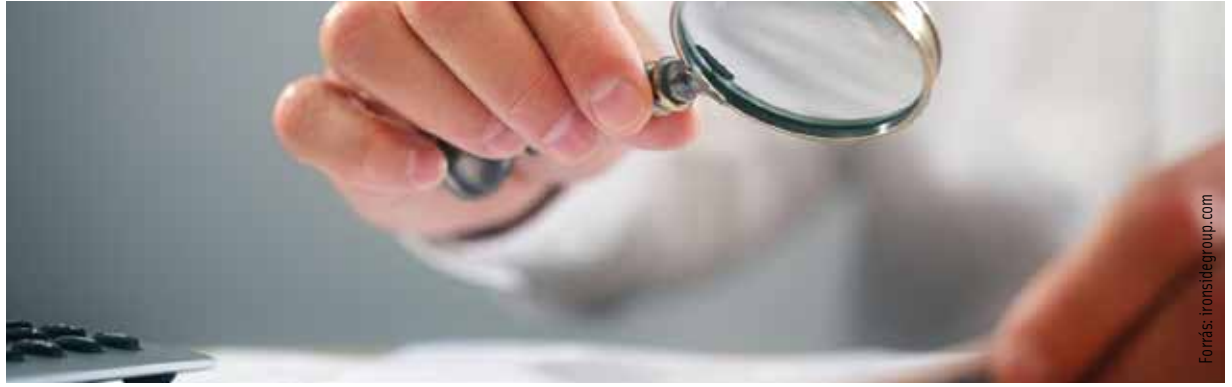
A városban huszonnyolc cég került feketelistára

adóhatóság határozatának bírósági felülvizsgálata iránt keresetet indítottak, az adatok közzétételére a bíróság jogerős és végrehajtható határozata alapján kerül sor." - olvasható az adóhatóság weboldalán. A NAV honlapján ( www.nav.gov.hu ) közzétett adatok, a név mellett a székhely és adószám ráadásul legalább két évig elérhetőek maradnak a nyilvánosság számára, ezután törlik őket. Ha azonban az érintett ismételtén vét a szabályok ellen, akkor újra kezdődik a feketelista-időszámítás.