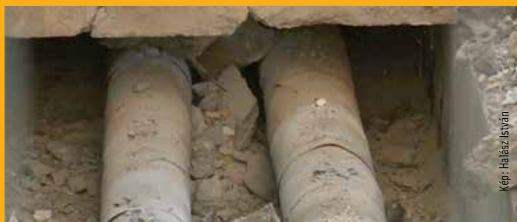
Új csövek kerülnek a földre ezek helyett

További információ a Széphő Zrt.-ről a www.szepho.hu oldalon olvasható.