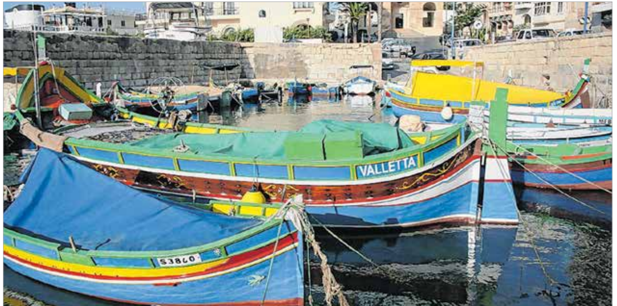
Jellegzetes máltai hajók

A toronytól a part menti sétányon némi kaktuszlikórt is szürcsölgetve sétáltunk a Szent Pál-kápolnáig (San Pawl Milqi). Az apró templom pontosan azon a helyen áll, ahol Pál apostol az egykori római kormányzóval, a később keresztény hitre térített – és emiatt mártírrá vált – Publiusszal találkozott. (Egy másik bédekker szerint a templom azon a helyen áll, ahol Szent Pál vipérát dobott a tűzbe). A kápolnától is jól látszott az öböl kijáratánál levő Szt. Pál-sziget (Il-Gzejjer): itt érte az apostolt i.sz. 60-ban az a bizonyos hajótörés, amelyre – és a szigeten való három hónapos tartózkodására – márványból készült 12 méter magas szobra emlékeztet. És ha már újra felhoztam Szent