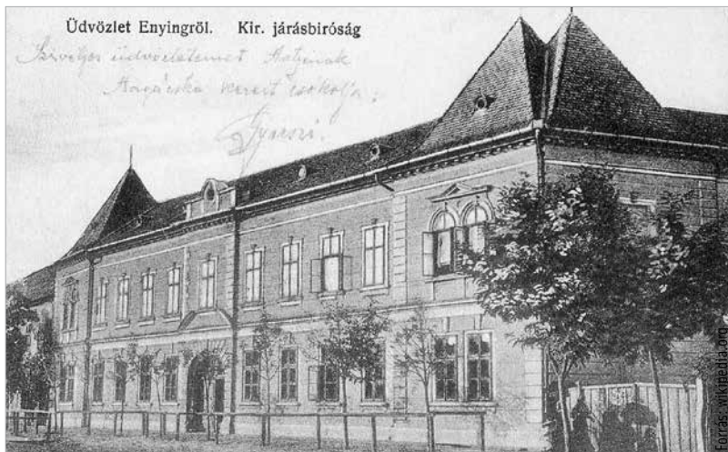
Az enyingi Batthyány-kastély a huszadik század elején egy képeslapon

1848 előtt csupán három hercegi nemzetség élt a hazai főnemesség soraiban. A Pálffy, Batthyány és az Esterházy család viselhette a címet. A három család közül kettő – a Pálffy és Batthyány – Fejér megyei kötődésű. Nagyhercsökpuszta adott otthont Pálffy Miklós 4. hercegnek Zichy Margittal kötött házassága révén. Enying és Bicske pedig a Batthyány hercegeknek. A magyar hercegi cím akkoriban még nem létezett. E három hercegi család a német birodalmi,