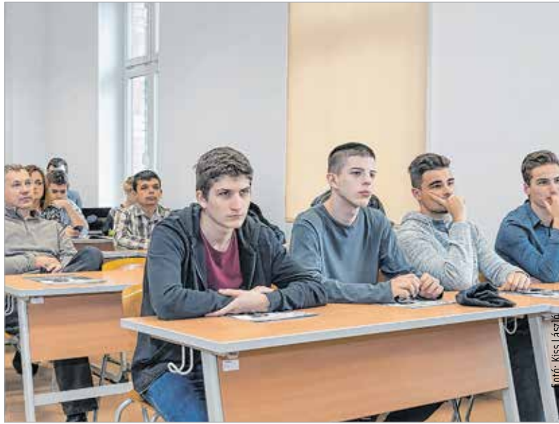
A Corvinus Egyetemen háromszor annyi hallgató kezdheti meg tanulmányait szeptembertől, mint a korábbi években