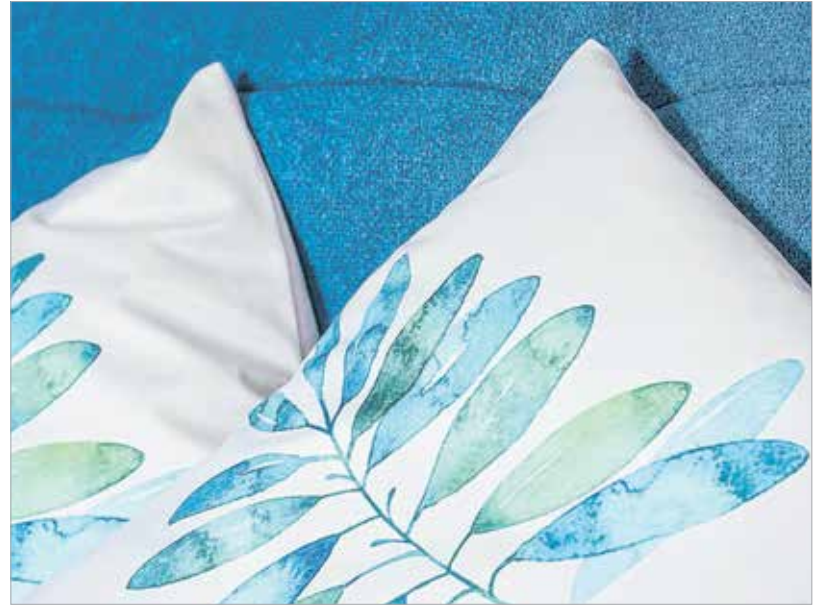
A türkiz-fehér kombináció a kék eget és a tengert hozza be a szobába