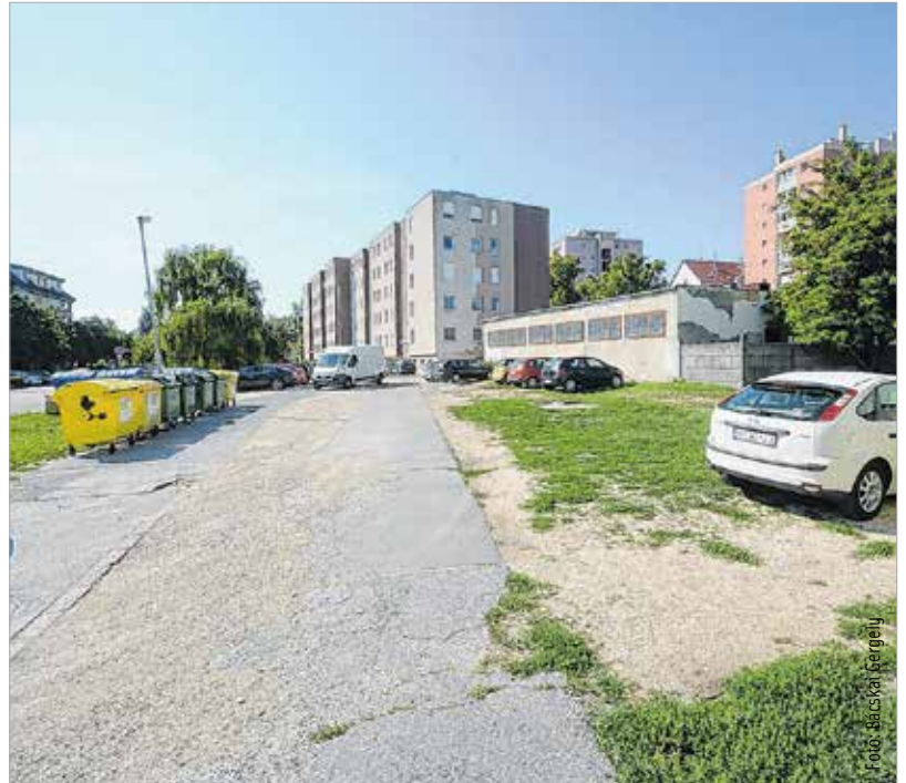
Ezek az autók még oda parkolnak, ahol helyet találnak, szeptember végén azonban már az új parkolóhelyekre állhatnak