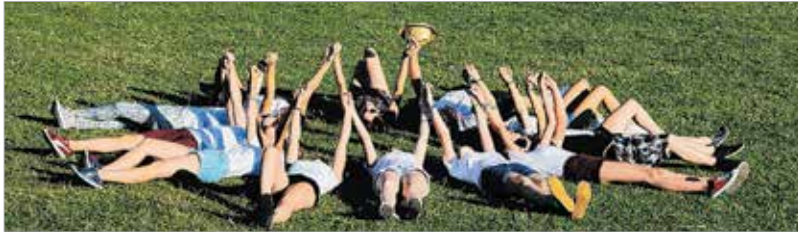
Eget kémlelőpróba, a beszédtechnika javítására