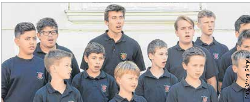
A testvérvárosi szerződés lényege, hogy nem az önkormányzatok, nem a polgármesterek és nem is a hivatal szintjén van a legerősebb része a kapcsolatnak, hanem az egyes emberek, családok, civil szervezetek, óvodák, iskolák, zenekarok szintjén. A testvérvárosunkból érkezett fiatalok adtak rögtönzött előadást a Városház téren. A schwabisch gmündi kórus tagjai templomi- és világi énekekkel köszöntötték a Belvárosban sétálókat.