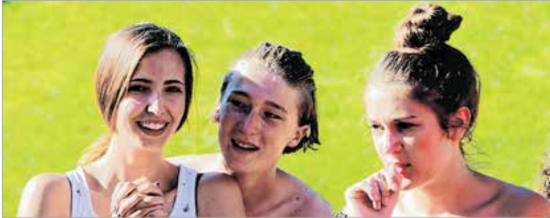
A felhőtlen mosoly tíz napjából egy kiragadott pillanat

Ezzel a mottóval, az Arany János évhez kapcsolódva indult el immár hetedjére a Székelyföldi Varga Sándor Verstabor. A Csíkszereda melletti Csíksomortánban szinte minden évben összegyűlnek a versszerező fiatalok, hogy irodalommal, zenével, tánccal és a magyar kultúra hagyományainak megismerésével töltsenek el egy hetet. A fehérvári versünnepe döntősei és különdíjasa mellett városunkból érkeztek az úgynevezett „táborcsináló” fiatalok is, akik a fiatalabbaknak segítenek a verstábori élet mindennapjaiban. De jöttek Felvidékről, Kárpátaljáról, Erdélyből, a Vajdaságból, és Budapestről is. A fehérvári versünnepek táborozását az önkormányzat, a Széphó Zrt. és a Fehérvár Média centrum Kft. támogatja.