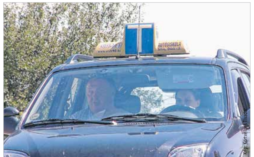
Kevés a vizsgabiztos, ezért kell sokáig várni a forgalmi vizsgára