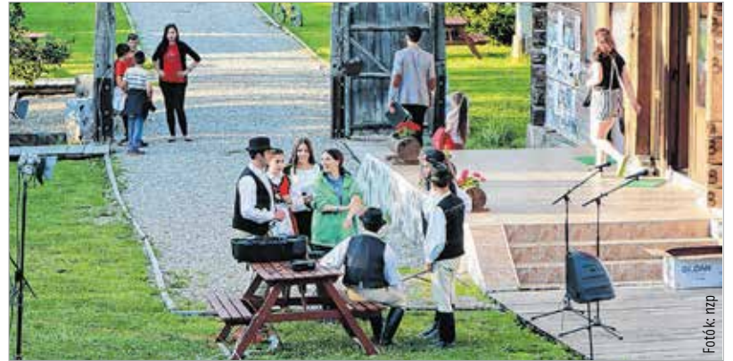
A Csíksomortáni hagyományőrző csoport ismét elhozta az ősi székely kultúrát a táborba