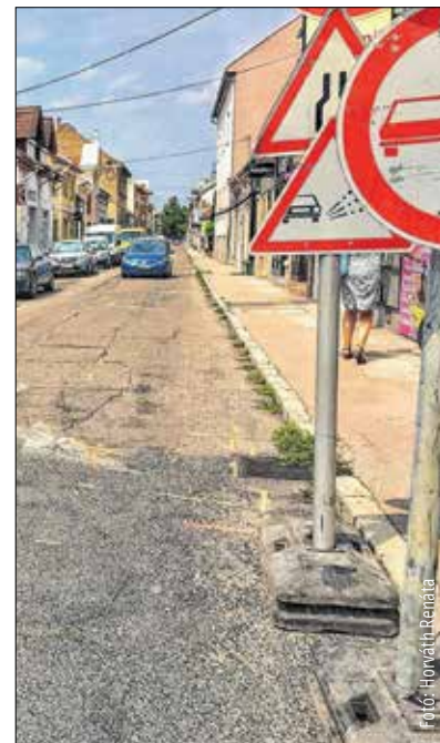
A Távirda utca felújítása januárig tart

állapotban volt. A munkálatok a tervezett ütemben haladnak. A felújítás ideje alatt a gyalogos- és kerékpáros-forgalom zavartalan, az autósoknak kell csak kerülniük.