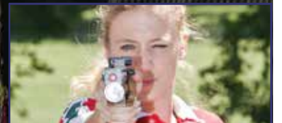
Öt fehérvári érme az öttusa Eb-n 14. oldal