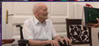
Legenda a Don-kanyarból 4. oldal