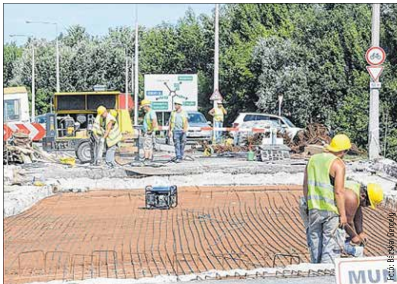
A terveknek megfelelően halad a Gaja-híd felújítása