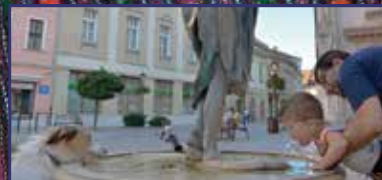
Kis nyári felfrissülés: ivóutak és díszutak Fehérváron 13. oldal