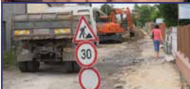
A Liget sort és a Budai út egy szakaszát is lezárják 2. oldal