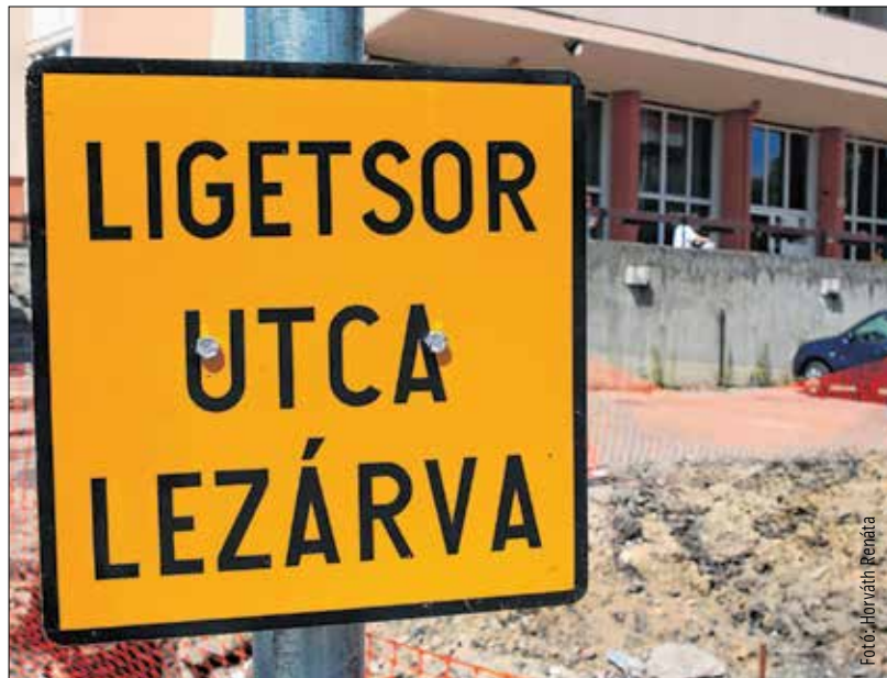
A Liget sort augusztus elsejétől teljes egészében lezárják

A felújítás miatt módosított útvonalon közlekednek a 10-es, 11-es, 12-es, 13-as, 14-es és 16-os autóbuszok. A Szedreskerti lakónegyedről induló és oda érkező buszok a Palotai úti Hosszú temető megállótól illetve megállóig közlekednek. Nem érintik a járatok a Liget soron található Uzsoda, Liget sor és Szedreskert lakónegyed megállóhelyeket. A Mészöly Géza utcán található Uzsoda megálló kiszolgálása változatlan marad. A módosított