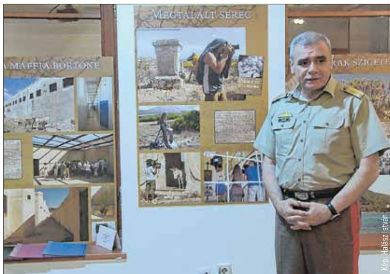
Szabó István tábornok főhajtása

a magyar hadifoglyok méltatlanul elfeledett történetével, szenvedéseivel szembesít bennünket. Az 1915-ben szerb fogságba esett magyar katonák hadifogságának története, a kéthónapos, havas hegyeken, mocsarakon át vezető menetelés balkáni halálmarsként vonult be a történelembe. Az alkotók célja, hogy méltó vizuális emléket állítsanak annak a mintegy hetvenezer magyar hadifogolynak, akik végül az olaszországi haláltáborban, Asinara szigetén áldozták életüket hazájukért.