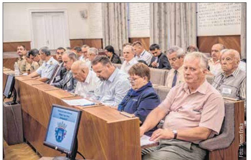
A bajtársi egyesületek élén járnak a közösségépítésben

mindenkor kiemelt szerephez jutnak a város életében. A bajtársi egyesületek mindig példaként állíthatók más civilszervezetek elé, hiszen összefogják azokat az embereket, akik kikerülnek a honvédség intézményi keretei közül, de mégis valamilyen szinten kapcsolódnak a honvédelemhez. Ez az a közösségépítés az, amit