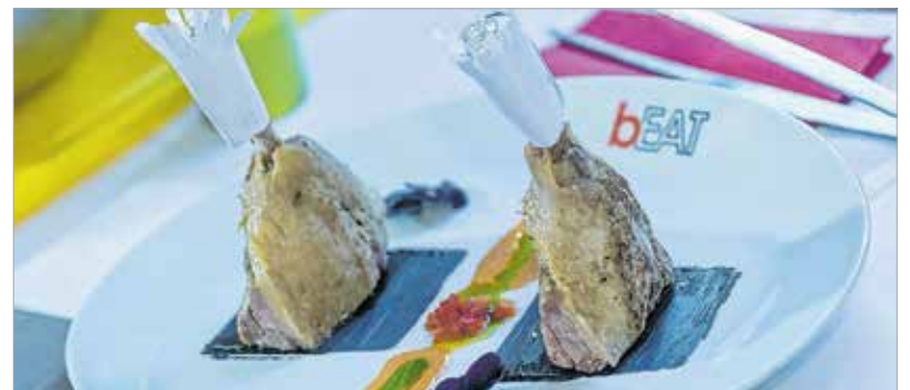
A csirkepaprikás kortárs verziója