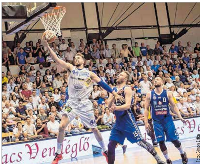
Fogcsikorgatva küzdött Lóránt és az Alba, de a ZTE nyert

A negyedik negyedben az idővel is játszott a ZTE, és bár sok támadásuk végén nem jutottak vagy csak rossz dobásig, ez nem zavarta őket, hiszen közben az Alba is fáradt és hibázott. Edwards és Mohammed így is triplát dobott, hatpontos hátránynál támadhatta a házigazda, de nem tudott