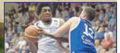
Egy félidő előnyt adtak 14. oldal