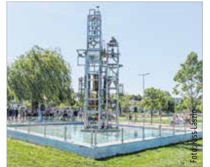
A Deák Dénes-kút mostantól a Csónakázó-tó szigetét díszíti

Haraszty István a több mint nyolc méter magas alkotást 1993-ban készítette el, és eredetileg a Téráztató címet adta neki. A köztéri alkotást 1992-ben rendelte meg tőle Deák Dénes, akinek halálát követően került csak felavatásra a mobil szobor 1993. október 2-án Székesfehérváron, a Bartók Béla téren. A berendezés néhány évig működött, majd egyre kevesebb alkatrészt lehetett csak látni rajta, mert jelentősen korrodálódott, és több darabját megromlott az állapota, hogy elengedhetlenül vált a kút felújítása. A teljes rekonstrukción átesett köztéri alkotás ma már a Csónakázó-tó szigetét díszíti. Az avatási ünnepségen Vargha Tamás országgyűlési képviselő emlékeztetett arra, hogy amikor az 1990-es években az akkori József Attila Gimnáziumban tanított, a kút rendszeresen hangokat adott, csobogott belőle a víz, és a működése gyakran elvonta a diákok figyelmét a tanórákról. De „... ez egy szerethető alkotás, mely végre méltó környezetben, szépen felújítva újra gyönyörködteti a városlakókat, a látogatókat.” Cser-Palkovics András polgármester igazi értékmentésnek nevezte a szobor