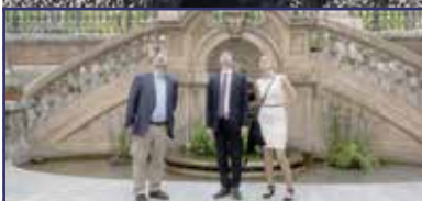
Közelednek a nagy évfordulók 3. oldal