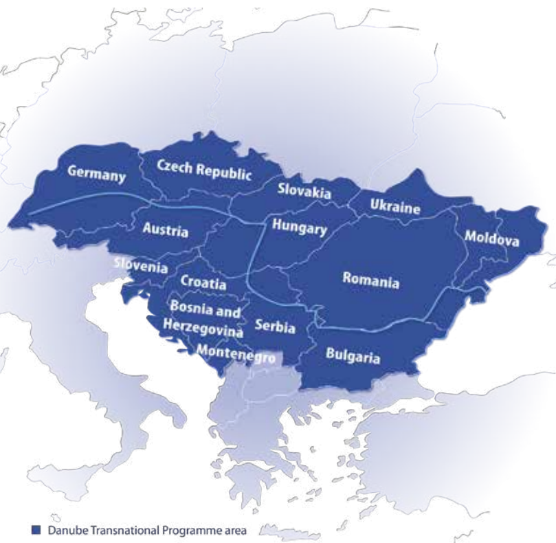
■ Danube Transnational Programme area

Amennyiben segítségre lenne szüksége vállalkozásával kapcsolatban, keresse munkatársainkat!