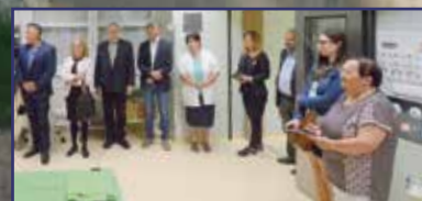
Megújult a fül-orr-gégészeti műtőblokk 6. oldal