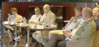
Székfoglaló – két magyarországi bemutató 5. oldal