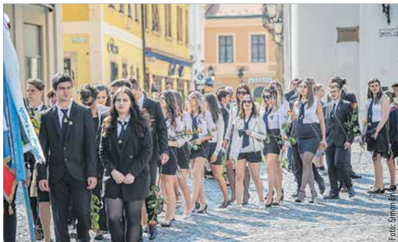
Ünnepélyes menetben, a szélrózsa minden irányából érkeztek ballagók a Városház térre

ünnep az élet rangja, felsőbb értelme”. A diákoktól Luther Márton tanácsaival búcsúzott, aki szerint „a világnak tetsző prédikátor legyen nagy tudományú, szép orgánumú, ékesszóló, szép küllemű, és olyasmit mondjon, amit az emberek szívesen hallanak.” Az Istennek kedves prédikátor viszont „képes