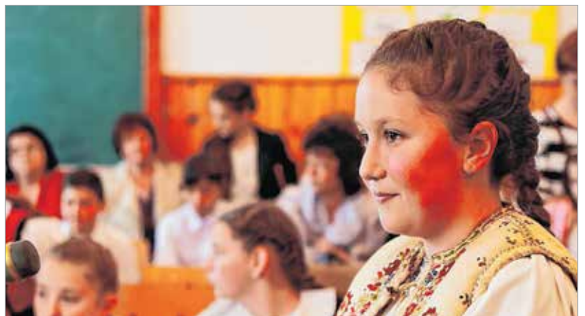
A versmondók többsége viseletben jelent meg, mert szerintük az öltözet támasza a védett, őrzött nyelvnek