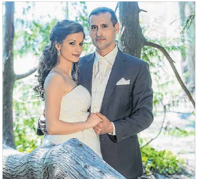
Székesfehérváron is egyre nő a házasságkötések száma

nagyszabású ünneplést szeretnénk csapni utána, sok vendéggel, arra mégiscsak a hétvégék a legalkalmasabbak. Ha az anyakönyvvezetők naptárai már megteltek a szombati és vasárnapi időpontokra, akkor