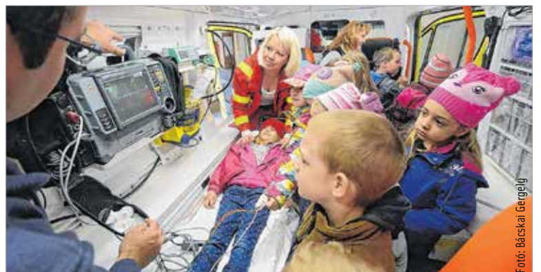
Egy nap a rohamkocsiban