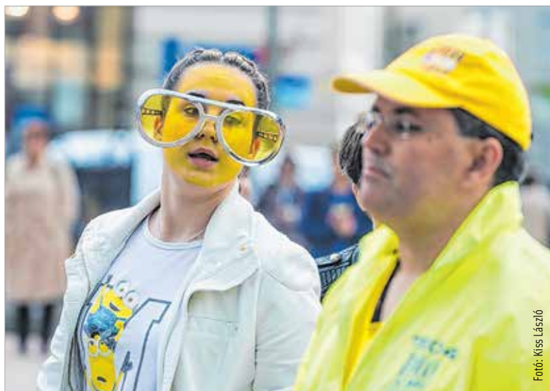
Minél nagyobb a szemüveg, annál többet látni!

tanulója szavalt el Kovács Ákos Azért vagy itt című dalszövegét. Ezt követően Székesfehérvár polgármestere mondott köszönetet a ballagóknak, hogy az elmúlt években fiatalos hangulattal töltötték meg a várost. Azt kívánta, hogy a ballagó diákok találják meg azt az életutat és hivatást, amit szeretnének, és amiben boldogan fogják eltölteni a felnőtt esztendőket. A ballagási műsor a One Day zenekar és az Alba Regia Szimfonikus Zenekar előadásával folytatódott. Josh Groban Mit ér egy hang? című dalát hallgatták meg a résztvevők. Sipos Imre miniszteri biztos felidézte, hogy egykori iskolaigazgatóként a ballagási szerenádokon számos osztályt fogadott a lakásán, és az ünnepi készülődés jegyében írta meg ballagási beszédeit. Elmondta, hogy a beszédírásához sokszor hívta segítségül Márait, akitől azt is megtanulta, hogy „az