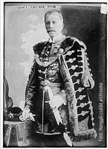
A világhálón mindenféle, bizonytalan eredetű képek keringenek Zichy Kázmérról, de a kocsisa és annak utódai által megőrzött kép talán az egyetlen hiteles fotó a grófról

nyújtó, a mai ember számára is élvezetes olvasmány. Messzi földön híres lövőként elnyerte a monte-carlo-i galamblovóverseny nagydíját. A Nádasdy-huszárok között századosként teljesítette az I. világháborúban katonai szolgálatát. 1916-ban mint rokkant került haza, de a szolgálatot a monarchia összeomlásáig teljesítette. Aztán ismét nyakába vette a világot. A birtokot bérlővel művelte, csak a kastélyt tartotta fenn saját használatra. Beutazta Európát és Amerikát. A ma már lakásoknak