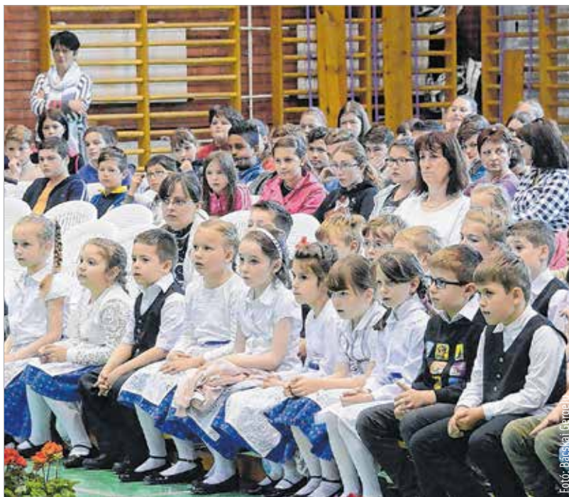
Városunkban a Felsővárosi Általános Iskolában és a Gyöngyvirág Óvodában folyik német nemzetiségi oktatás

A nemzetiségi nap elsődleges célja a német nemzetiségi hagyományok ápolása és felelevenítése. A Székesfehérvári Német Nemzetiségi Önkormányzat hagyományteremtő szándékkal rendezte meg tavaly első alkalommal az egész napos programot. A rendezvény sikere miatt az idén sem maradhatott el!