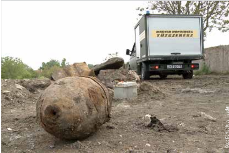
Ez az éles bomba okozott fennakadást a városban

A közlekedésben torlódás alakult ki, több helyütt a rendőrök segítettek a forgalmat, de szerencsére a lezárás mindössze másfél órán át tartott.