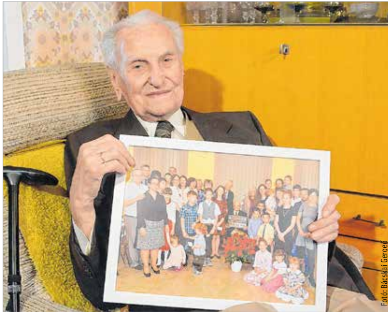
A sors hat unokával és húsz dédunokával ajándékozta meg