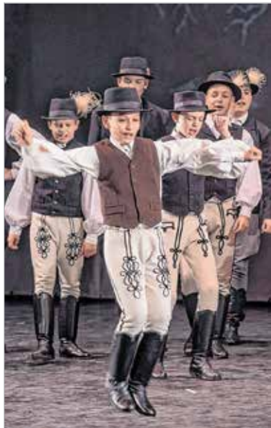
A legényes benne van a fiatalabbak csizmájában is

Az Alba Regia Táncegyüttes évente megújuló műsorral készül a tánc világnapjára, és tölti meg a Vörösmarty Színházat. A gálán a hagyományokhoz híven minden