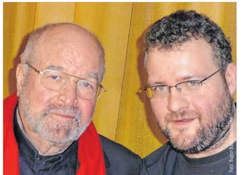
Apa és fia