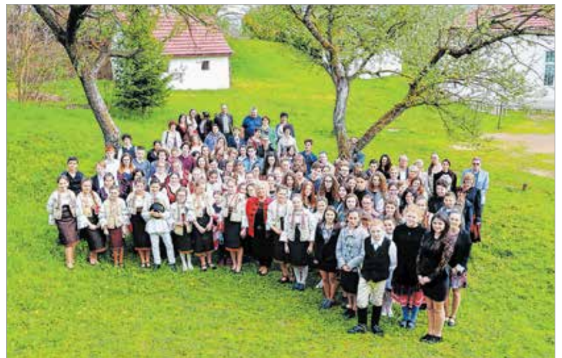
Akiknek estére nem ment el a busza, itt állnak a kamera előtt, ők a csíki versmondók, tanáraik, bírúik