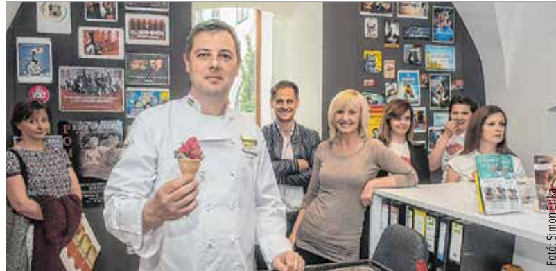
A történelmi múlt, a kulturális élmények és a gasztronómiai különlegességek miatt is szívesen jönnek a turisták Fehérvárra. Ennek köszönhető, hogy 2010 óta megduplázódott a vendégejszakák száma.

2011-ben nyílt meg a Fehérvári Ajándék-bolt, azzal a céllal, hogy széleskörű információkkal lássa el a hozzánk érkező turistákat akár programok, akár városismeret, akár szálláslehetőség terén. Mindemellett arra is van itt lehetőség, hogy minőségi, Fehérváron készített szuvenírt vásároljanak vendégeink. A bolt most megújult, letisztultabb, egységesebb külsőt öltött, és a falakra Székesfehérvár látkepe került.