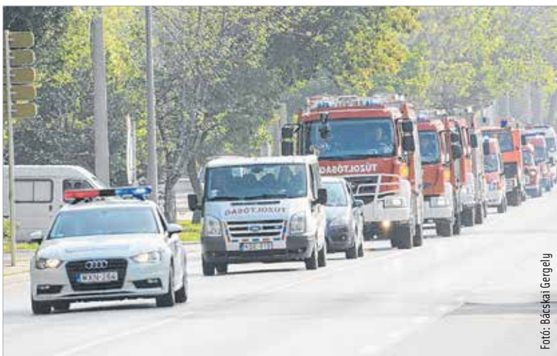
Szent Flórián-napi felvonulás Székesfehérváron

különböző felszereléseket megnézzék és ki is próbálják. A Fehérvári Tűzoltó Egyesület jóvoltából egy tűzoltóautóba is beszállhattak, és az eszközöket is megismerhették. Május 13-án, szombaton az Ikon Club előtti téren rendezik meg a mentők majálisát, ahol reggel 9 órától késő estig különböző érdekes programokkal várják az érdeklődőket. Május 14-én, vasárnap pedig a Haleszban tartják a Nagyok a kicsikért elnevezésű jótékonyági érőnapot.