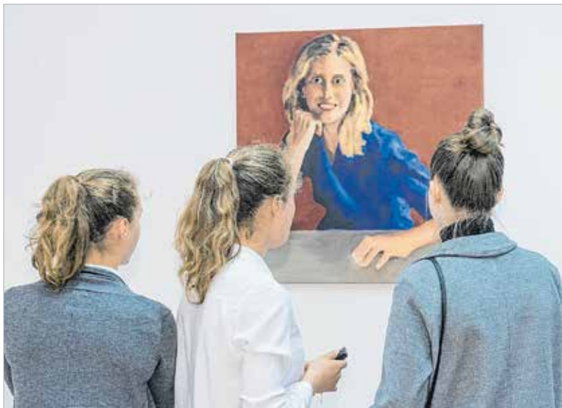
A Fanta-villába rengeteg ember érkezett

„Csalán a Kégl-kastély sajnos nem a család tulajdona. Nem titok azonban, hogy lennének közös terveink egy közösségi tulajdonba kerülő kastéllyal. Remélem, erre egyszer lehetőség nyílik. Fontos, hogy a nyilvánosság is megismerhesse a városnak ezt a szándékát!” – fogalmazott a polgármester a kiállítás megnyitóján.