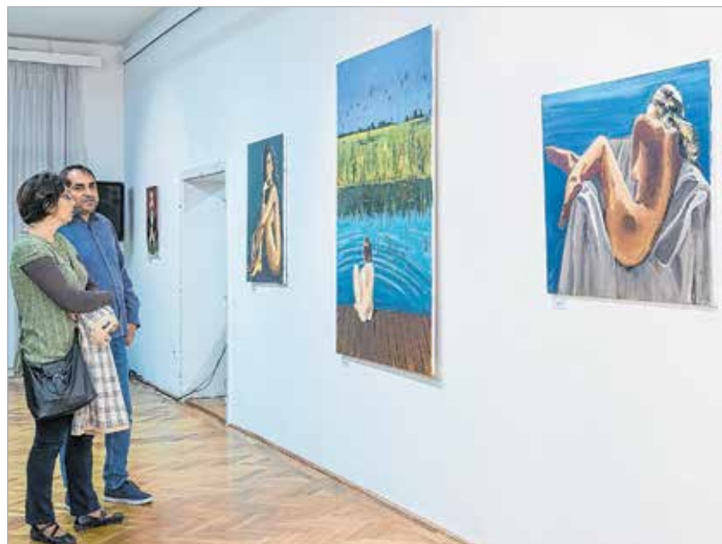
Dinamikus színek és határozott ecsetvonások a realizmus világában

Mikor határozta el, hogy Magyarországra költözik?