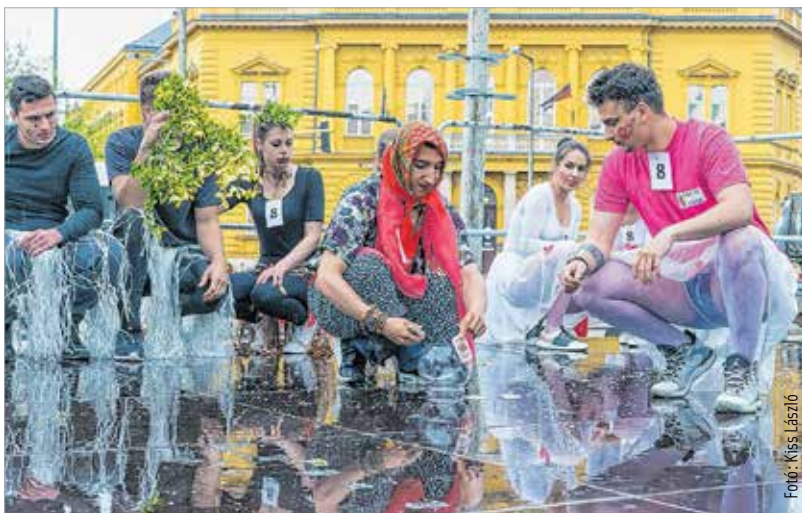
Nagyívű előadásokat láthattunk, volt olyan csapat, melynek műsorát a magyar népi kultúra inspirálta

A ballagási hét záró- és egyben legszébb ünnepén, a városi ballagáson tizenhét iskola ötvenkilenc osztályának ezerötszáz diákja sorakozott