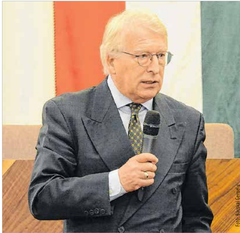
Először ülésezett a Duális Képzési Tanács Székesfehérváron

ötezer álláshelyből csaknem háromezer még mindig betöltetlen.