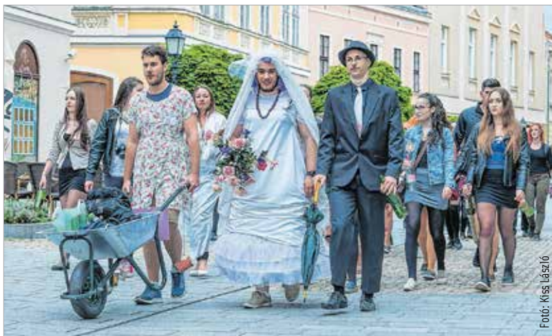
Megnőtt a házasulandók száma a Fő utcán

tanulója szavalt el Kovács Ákos Azért vagy itt című dalszövegét. Ezt követően Székesfehérvár polgármestere mondott köszönetet a ballagóknak, hogy az elmúlt években fiatalos hangulattal töltötték meg a várost. Azt kívánta, hogy a ballagó diákok találják meg azt az életutat és hivatást, amit szeretnének, és amiben boldogan fogják eltölteni a felnőtt esztendőket. A ballagási műsor a One Day zenekar és az Alba Regia Szimfonikus Zenekar előadásával folytatódott. Josh Groban Mit ér egy hang? című dalát hallgatták meg a résztvevők. Sipos Imre miniszteri biztos felidézte, hogy egykori iskolaigazgatóként a ballagási szerenádokon számos osztályt fogadott a lakásán, és az ünnepi készülődés jegyében írta meg ballagási beszédeit. Elmondta, hogy a beszédírásához sokszor hívta segítségül Márait, akitől azt is megtanulta, hogy „az