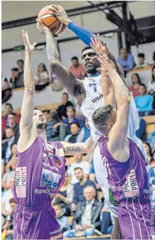
A győzelem összegyűjtött, de az alapszakasz lendületét még nem látjuk a csapaton