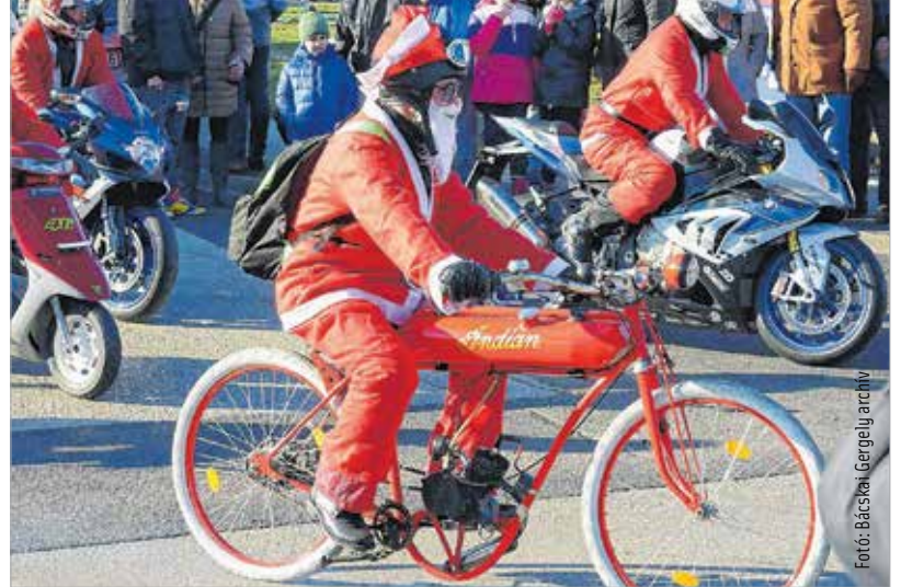
A szezonban először a mikulásfelvonuláson pattantak nyeregbe a motorosok

sok a téli időszakban elszokhattak a motorosoktól, így vezetés közben érdemes többször is tükörbe nézni. A motorosokat érintő balesetek egy része a két keréken közlekedők hibájára vezethető vissza, amikor a vezető megsért valamilyen közlekedési szabályt, de autós vagy gyalogos miatt is gyakran történik baleset. Az autós sofőrök sokszor nem számolnak azzal, hogy a motorosok sérülési kockázata kiemelkedően magas, ráadásul az észlelhetősége korlátozottabb.