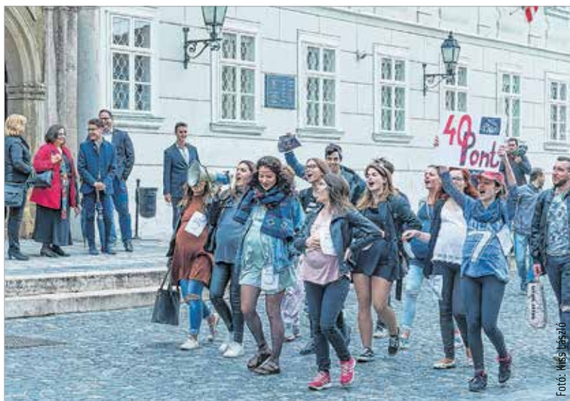
„Szakállá van, mégis terhes, negyven pontért mindent megtesz!” – ezt skandálták a kismamának öltözött gimis lányok

Péntek reggel több száz diák harsány kiáltásokkal és a legkülönfélébb táncok bemutatásával vonult át a történelmi belvárosban. Sem a rossz idő, sem a szerenád utáni fáradtság, de még a közelgő vizsgák sem szegték kedvüket: ez a nap egy óriási, utolsó hajrá volt, a középiskolás éveket záró tombolás. Társadalomkritika, némi fekete humor és bolondos csapatszellelem jellemezte a színes menetet, melynek fináléja a diákok színpadi produkciója volt. A bolondballagók az Alba Plaza előtt a Fő utcán át vonultak a Zichy színpadig, ahol a szakadó eső szakította félbe a jelmezes bemutatásokat. A produkciókat ezután a Vörösmarty Színházban adták elő. Az időjárási körülmények miatt a