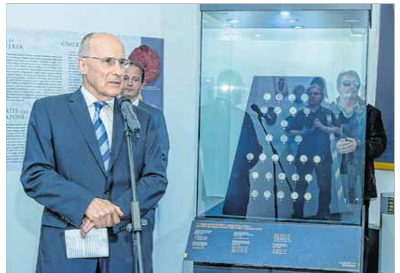
A Magyar Nemzeti Bank Értéktár programja sokat tett azért, hogy a gyűjtemény hazánkat gazdagítsa