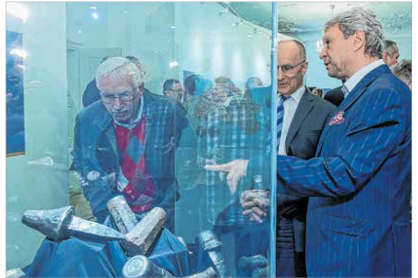
A tárlat különlegességei az eredeti erdélyi verőtövek

A kiállítás június 30-ig tekinthető meg a Szent István Király Múzeumban.