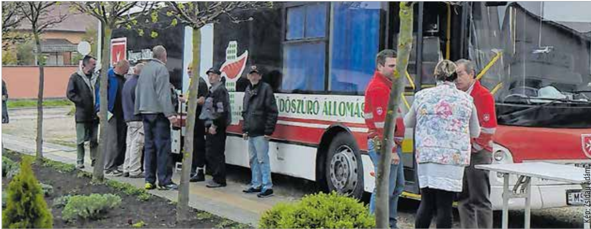
A tüdőszűrőbusz előtt várakozók száma is mutatta, hogy az egészségnap mindenki számára fontos

elmondta, hogy a hajléktalanoknak rendezett egészségnapon a Humán Szolgáltató Intézettel együttműködve elvégzik az általános szűrővizsgálatokat is a vércukor- és vérnyomásméréstől a koleszterinszint-mérésig. Hozzátette, hogy sokan vártak a tüdőszűrésre is, aminek elvégzésére a Máltai Szeretetszolgálat buszában nyújtottak lehetőséget. A programok között egy kis mozgásra is jutott idő. A testet és a lelket átmozgató zenés tornára a központ dolgozói is beálltak.