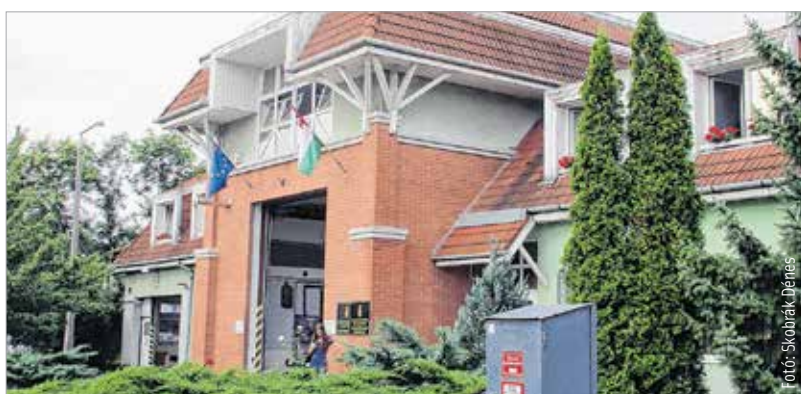
A Sárkeresztúri úton lévő Közlekedési Osztály és Útgyűri Osztály épületén az összes ablakot kicserélték, korszerű külső hőszigetelést is kapott. Több napelem is beépítésre került.