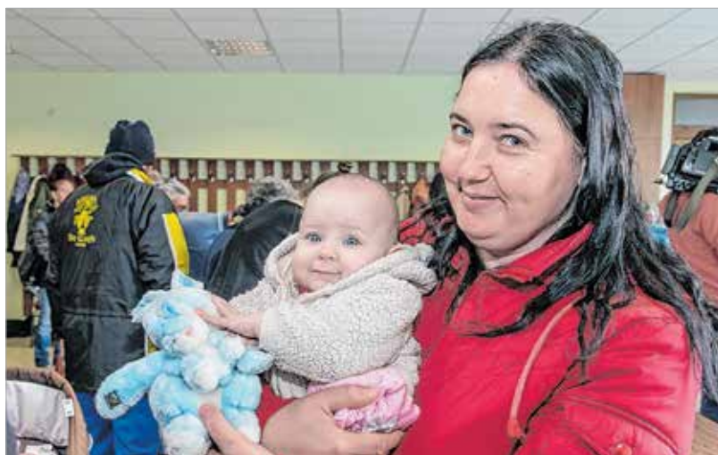
A gondoskodás megfizethetetlen

Április 13., nagycsütörtök 10 óra, székesegyház: nagycsütörtöki olajszentelési mise 18 óra, székesegyház: nagycsütörtöki utolsó vacsora emlékmise Április 14., nagypéntek 15 óra, Palotai úti kálvária: Székesfehérvár város keresztútja 18 óra, székesegyház: nagypénteki szertartás Április 15., nagyszombat 19 óra, székesegyház: nagyszombati feltámadási szertartás és szentmise Április 16., húsvétvasárnap 10.30, székesegyház: húsvétvasárnapi ünnepi szentmise