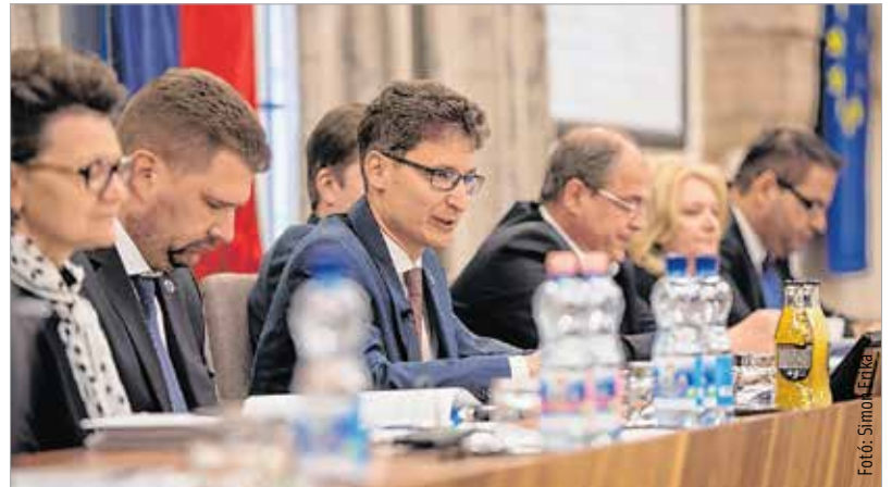
Székesfehérvár támogatója az egyetemi képzésnek: a Corvinus közel hetvenmilliós önkormányzati segítségre számíthat

„2021-ig több mint egymilliárd forintból – részben uniós, részben önkormányzati forrásból – lehetővé válik valamennyi rendelőintézet felújítása. Ezek akadálymentesítésre kerülnek, korszerűbb lesz az energia- és fűtészálólzat, de burkolatcserét is végzünk.” – fogalmazott a polgármester. Fontos támogatást szavazott meg a közgyűlés a Corvinusnak: az egyetem székesfehérvári campusa hatvanhat millió forint önkormányzati forrásra számíthat. Százötven millió forint visszatérítendő összeggel segíti a város a jégkorongcsapat működését is. „Szerencsére nagyon komoly bérletbevitel és sok helyi támogató van. Bizom benne, hogy hamarosan megérkezik a nagy névadó szponzor is, aki a klub támogatását megoldja, ezzel működése stabil lesz, és az önkormányzat a korábbi támogatási szintre térhet vissza. Annyit azonban meg kell jegyezni, hogy ez egy visszatérítendő kölcsön.” – szögezte le Cser-Palkovics András.