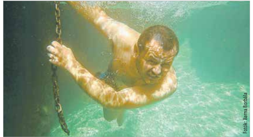
...és bátran fejest ugrik a mélybe