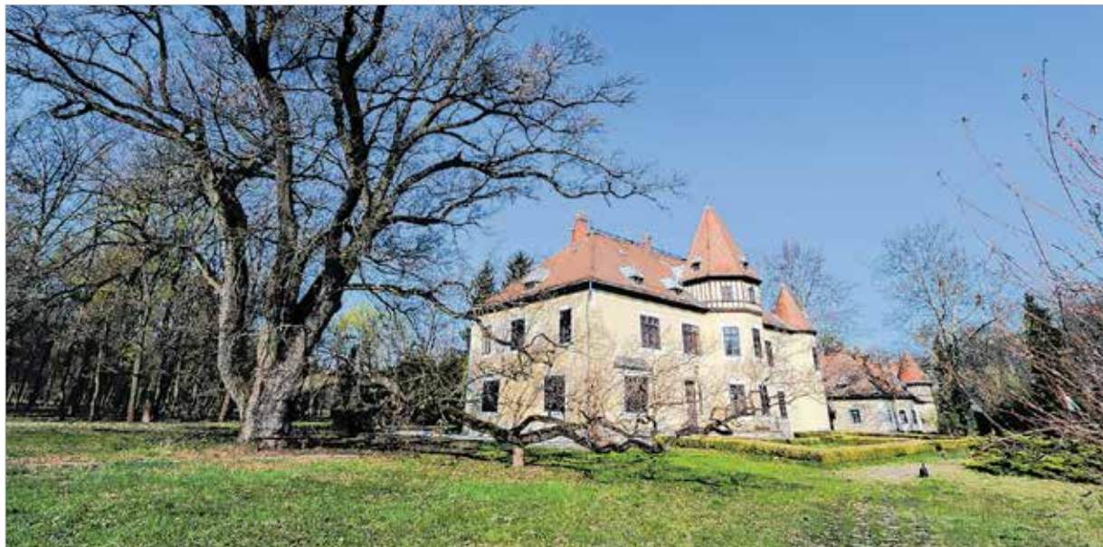
A kastély és a sok mindent látott 226 esztendő Quercus robur, azaz kocsányos tölgyfa

A magyar jogrend a válás intézményét csak 1895-től ismerte el. Az ezt követő huszonöt évben nem vált még gyakorlattá a házasság megszüntésének ezen módja az arisztokrácia számára. Korábban az egyházak döntöttek a válások ügyében. Pallavicini Edina hallani sem akart a válásról. Hitéletével összeegyeztethetetlen volt a „felbonthatatlan szentségi házasság” kötelekének elszakítása. Talán nemcsak ezért