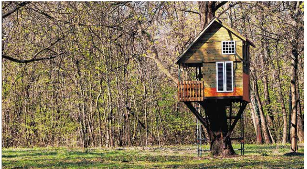
A hatalmas kastélyudvar közepén az egyik öreg tölgy törzsére épített a jelenlegi tulajdonos egy bungálót, ahol testközelben találkozhat a magánnyal

A Fővárosi Törvényszék – bár megállapította, hogy a házasság között az életközösség helyrehozhatatlanul megszakadt – a házasságot mégsem bontotta fel, mert a keresetben hivatkozott természet elleni fajtalanítás nem nyert minden kétséget kizáróan bizonyítást. A kereset egyéb hivatkozásai nem voltak elégségesek a bontás kimondásához. A grófit a bontóper első fokú bírósága hatvanmillió korona perköltségben marasztalta. A fellebbezés folytán másodfokra kerülő polgári per bírósága, a Budapesti Királyi Ítéltábla hasonló álláspontra jutott. Az ügyben a Kúria is állást foglalt: helyben hagyta az első és másodfokú ítéletet, és újabb perköltségben marasztalta el Rafael grófit. A férje által meghurcolt Zichyné Pallavicini Edina és a vele mély