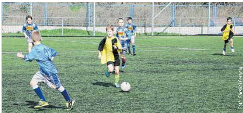
A II. korcsoportos fiúknál fociban a tóvárosiak voltak a legjobbak