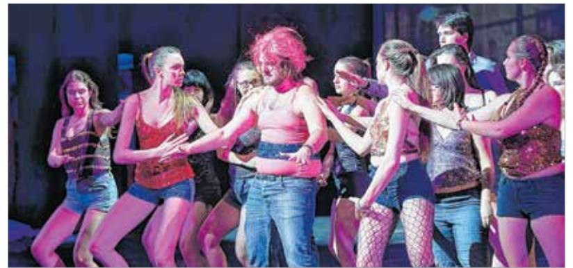
Az alapmű megannyi huszonegyedik századi, megvalósításra érdemes ötletre épülő előadást hozott