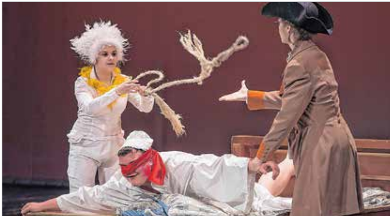
Háromszor adja Lúdas Matyi vissza!