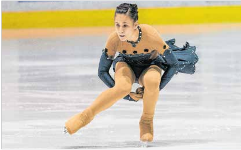
A Jégmadár kupán való részvétel már önmagában is rangot jelent

A Jégmadár Műkorcsolya-egyesületnek huszonöt igazolt versenyzője van, és mintegy hatvanfős utánpótlásbázist épített ki. A közel százfős csapatban egyetlen fiú van.