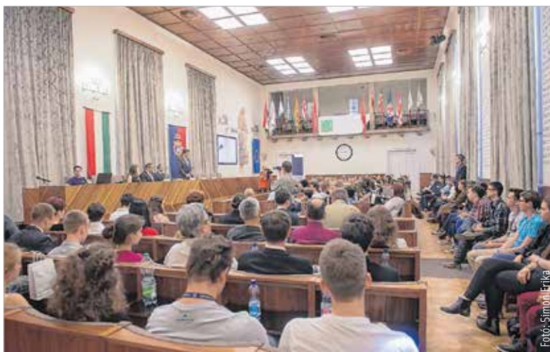
A kétnapos konferencián a jövő volt a tét

Ebben az évben sem kellett győzködni a Nostalgia Nyugdíjasklub tagjait, hogy vegyenek részt egy kis kert munkában. A klub már 2005 óta tartja rendszerben a bolt környékét, évente többször is kitakarítják a területet. Kedden délelőtt metszettek, gazoltak, gereblyéztek, és nagyon sok szemetet összegyűjtöttek. B. G.