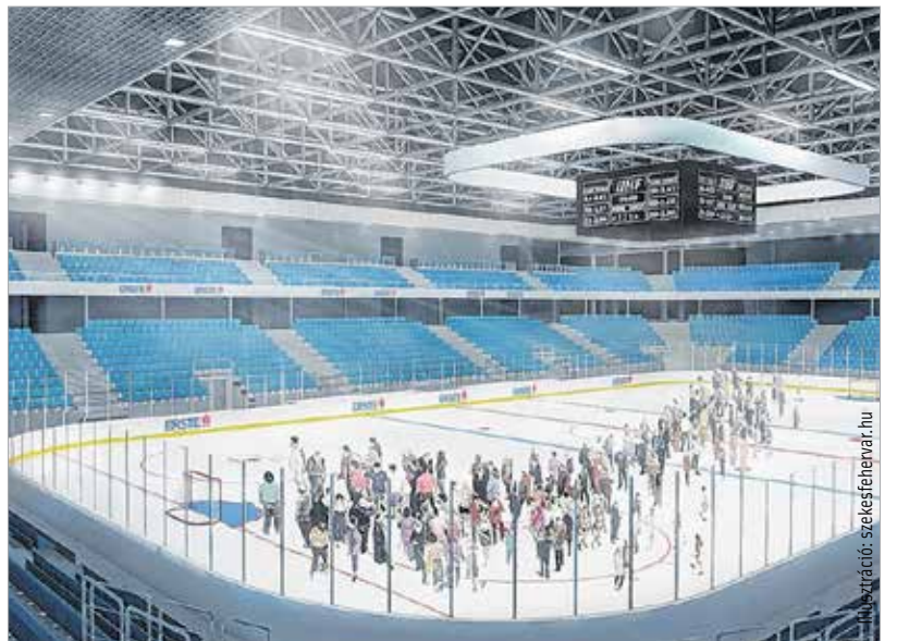
Az Alba Arénában új otthonra találnak majd a hokisok, de sok egyéb funkciója is lesz a csarnoknak

szakaszához érkezett a beruházás: a Kormányhivatal arról tájékoztatta Székesfehérvár önkormányzatát, hogy jogerőre emelkedett az Alba Aréna terveinek engedélye. A következő lépés a kiviteli tervek elkészítése, majd a szükséges közbeszerzési eljárások keretében a kivitelezők kiválasztása lesz. A munkaterület-átadásra és a kivitelezés megkezdésére ezt követően kerül sor. A tervek szerint 2019 őszétől már mérkőzéseknek és rendezvényeknek adhat otthont az Alba Aréna.