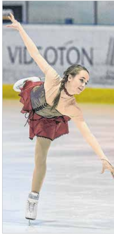
Amerikai, dél-koreai, horvát, olasz, szlovák, szlovén, szerb és magyar versenyzők léptek jégre