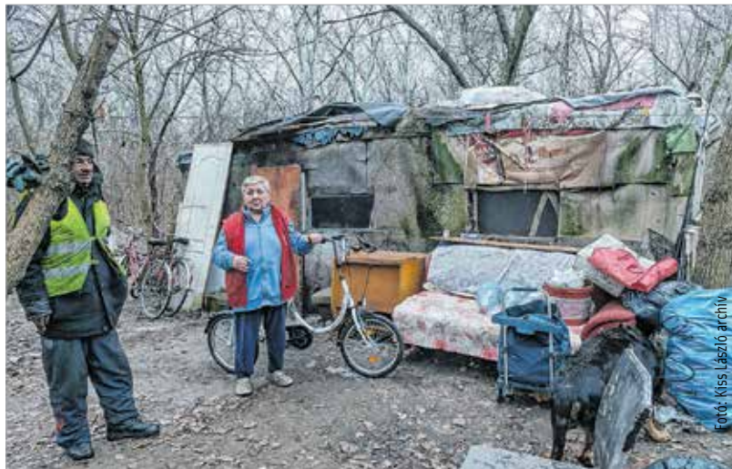
Fehérváron több mint százan élnek az utcán, az erdőben

A jubileumi év tiszteletére sajtókiállítást is nyitottak, ahol az intézmény elmúlt huszonöt évét bemutató cikkeket gyűjtötték össze.