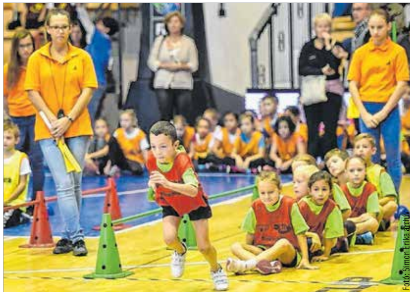
Cél az atlétika népszerűsítése a legkisebbek között