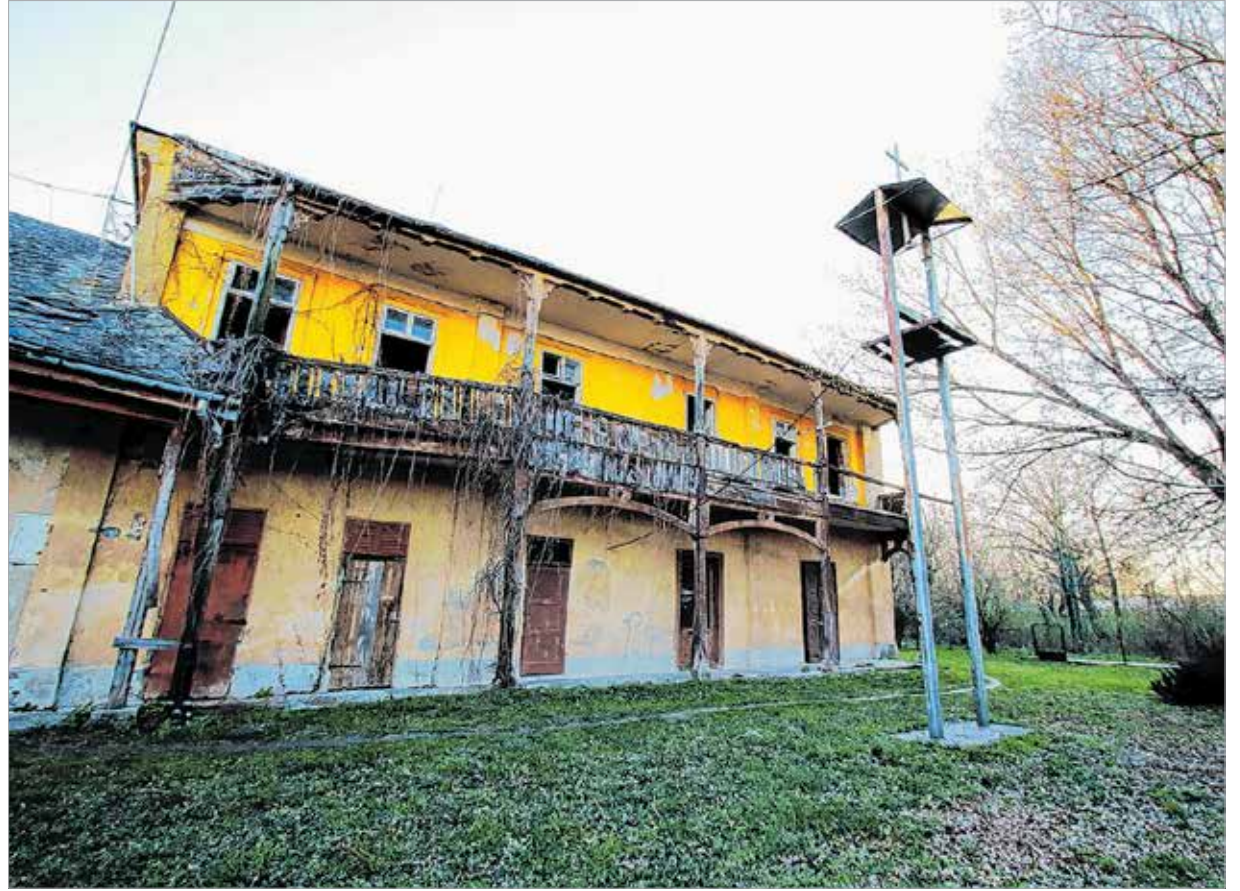
Az öreg épület bal szárnya már ebek harmincadján van, utoljára templomként használta a település, ezért áll a harangláb az épület előtt

Székesfehérvár határában a török hódoltság idején elnéptelenedett Kér és Ság nevű települések lassan éledtek. A Zichy család már a török kiűzése előtti években, 1650-ben megjelent a településen. Az uradalmat egy családi birtokmegosztás során a tehető, 62 úrbéri birtokkal rendelkező Zichy Ferenc főpohárnokmester kapta meg. A néhány majorságból, a Zichy család kúriájából, gazdaságából álló területen fia, Zichy Edmund gróf alapította meg Zichyfalvát, Sárszentmihály elődjét. Miközben a családban Seregélyesen, Soponyán, Kálozon az akkor friss klasszicista stílus jegyében hatalmas kastélyépítések folytak, a sárszentmihályi ág a fatornácos ősi kúriáját bővítette. A katonából császári és királyi kamarássá fejlődött, jeles vállalkozásokban kiváló közgazdasági tevékenységet kifejtő Edmund gróf Bécsen tekintette igazi életterének. Vagyonát hivalkodó sárszentmihályi kastélyépítés helyett a monarchiaszerte csodált bécsi műgyűjteményébe fektette. „Az ország művészet nélkül olyan, mind a kert virág nélkül.”