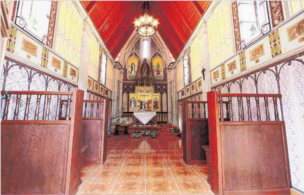
A kápolna belsejét jelenlegi tulajdonosa szépen felújította, mert mint mondta: csak a balga ember feledkezik meg Istenről

kellett cserélnie édesanya melletti hálószobáját a vendég írózóval, a szobalányok pikáns célozgatásairól, más hallomásokról és vallomásokról, végül a gróf úrtól kapott hálapénzekről is.