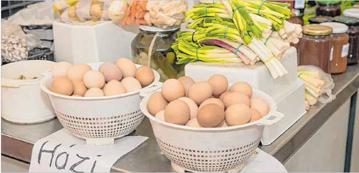
Házi tojás újhagymával. Kell ennél több?

vagy a bejárat elé „házórzőnek”. Húsvétig alig több mint egy hét van, így aki még nem kezdte el a készülődést, annak érdemes ellátogatni valamelyik fehérvári piacra. A következő héten talán az árak sem mennek feljebb.