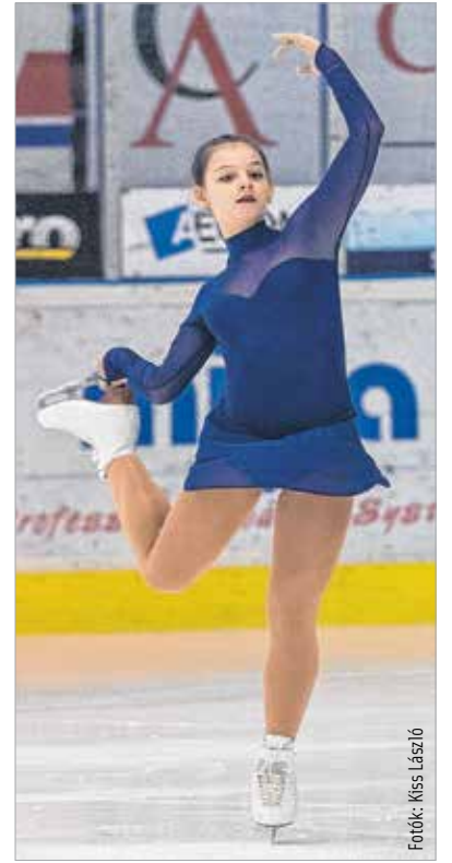
A teljes magyar utánpótlásmezőny képviseltette magát az Ifjabb Ocskay Gábor Jégcsarnokban