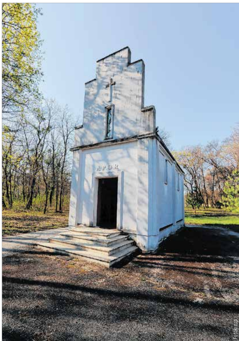
Az Apor-kápolna az imádságok helyszíne volt, amit elég ritkán használtak a grófi család szülei