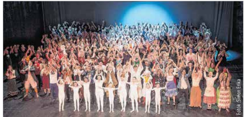
Együtt a fellépő tizenegy iskola

Döntésük alapján a legjobb diákszínpados előadás díját a Teleki Blanka Gimnázium és a Ciszterci Szent István Gimnázium kapta. A zsűrielnök különdíjában az Arany János Általános Iskola, Speciális Szakiskola és EGYMI részesült.