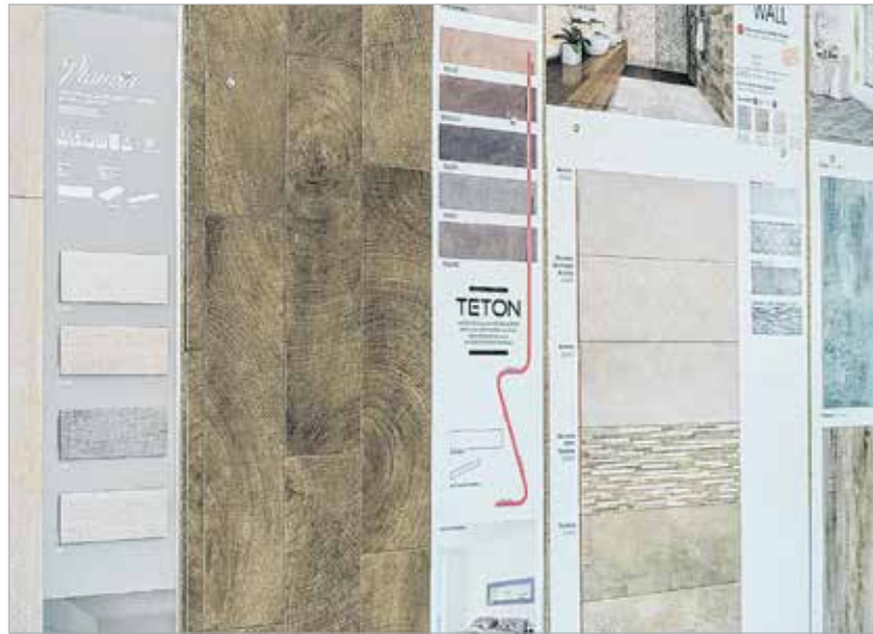
A szürke, a barna és a bézs árnyalatai az idei divatszínek

Milyen gyakran újítjuk fel a fürdőszobánkat? Mint a szakemberektől megtudtuk, a magyarok átlagosan tíz-tizenöt évente cserélnék ilyen jellegű burkolatot, legyen szó a fürdőről, a konyháról, a beltéri padlólapokról vagy a terasz térkövezéséről. Ez bizony hosszú idő ahhoz, hogy esetleg egy rosszul megválasztott csempét nézegessünk a falon. Erdemes alaposan átgondolni, mit választunk, figyelembe véve a berendezésre vonatkozó elképzeléseinket, a bútorok