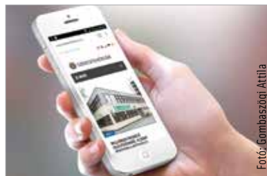
Az eddig megjelent körülbelül tízezer hír kivétel nélkül kereshető lesz az új honlapon, ugyanígy a Fehérvár TV híradói is

A székesfehérvár.hu szerkesztői kérik, hogy az olvasók az oldallal kapcsolatos észrevételeiket írják meg a fehevar@fehevar.hu címre.