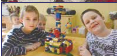
Boldogabb a játék