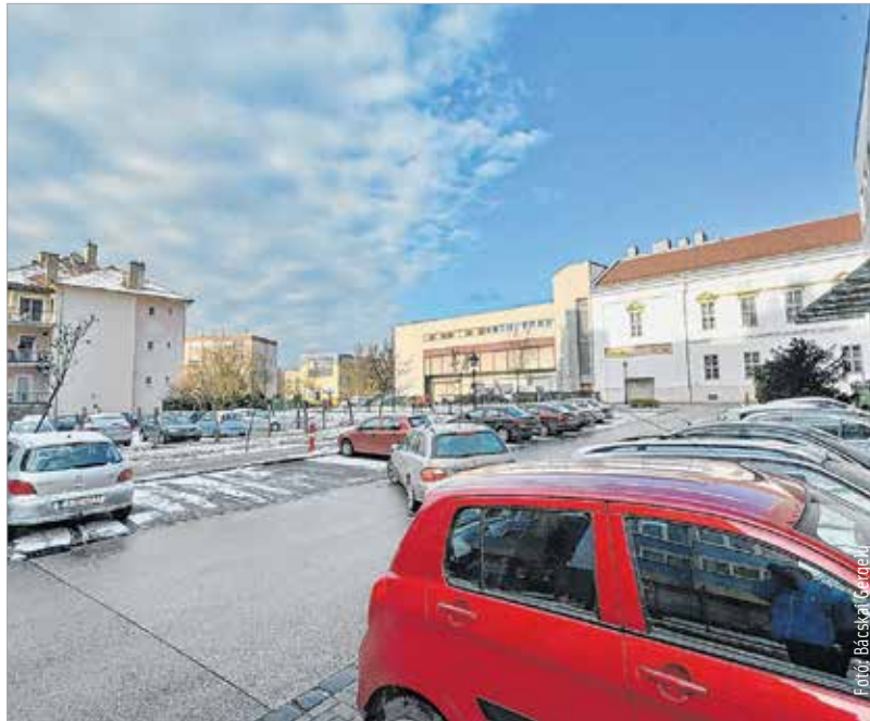
Ezer új parkoló a cél, melyek közül elsőként – még az idén – a Jávor Ottó téren létesül negyven. De vizsgálják a Palotai utat, a Koch László utcát és a Malom utca környékét is.

Ahogy arról a város polgármestere tájékoztatást adott: a 137 férőhelyesre tervezett Koch László utcai parkolóház helyett a belváros peremén, több helyszínen felszíni parkolókat alakítanak ki az elkövetkező években. Vizsgálják felszíni és zöldterület alatti parkók kialakításának lehetőségét is,