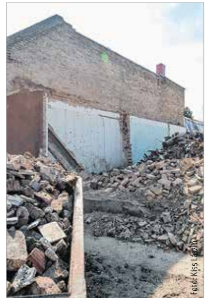
Gyakran találkozunk Fehérváron ezzel a képpel: a telken lévő régi házakat lebontják, helyükre új építésű társasházak kerülnek