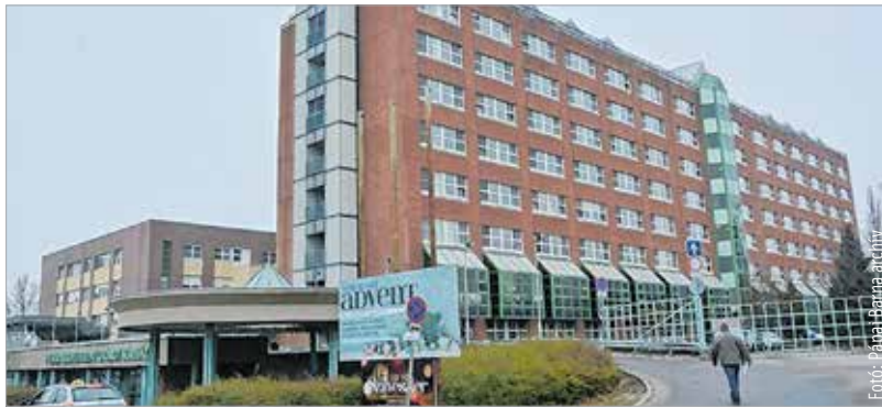
Csütörtöktől tilos a látogatás a Szent György Kórházban is

A Kormányhivatal Népegészségügyi Főosztálya felhívja a figyelmet a védőoltás hatékonyságára, melyet minden szezon előtt érdemes megismételni. Fokozottan veszélyeztetettek a hatvan év feletti, a krónikus betegségben szenvedők és a kismamák. Influenzaszerű megbetegedések halmozódásáról a második héten egy óvodából érkezett jelentés. Magas lázzal, felső légúti hurutos tünetekkel és hányással kezdődtek hét elején a megbetegedések. A hiányzások aránya elérte az ötvenöt százalékot.