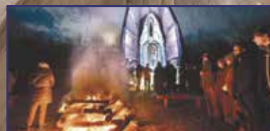
Ének a Don hőseiért