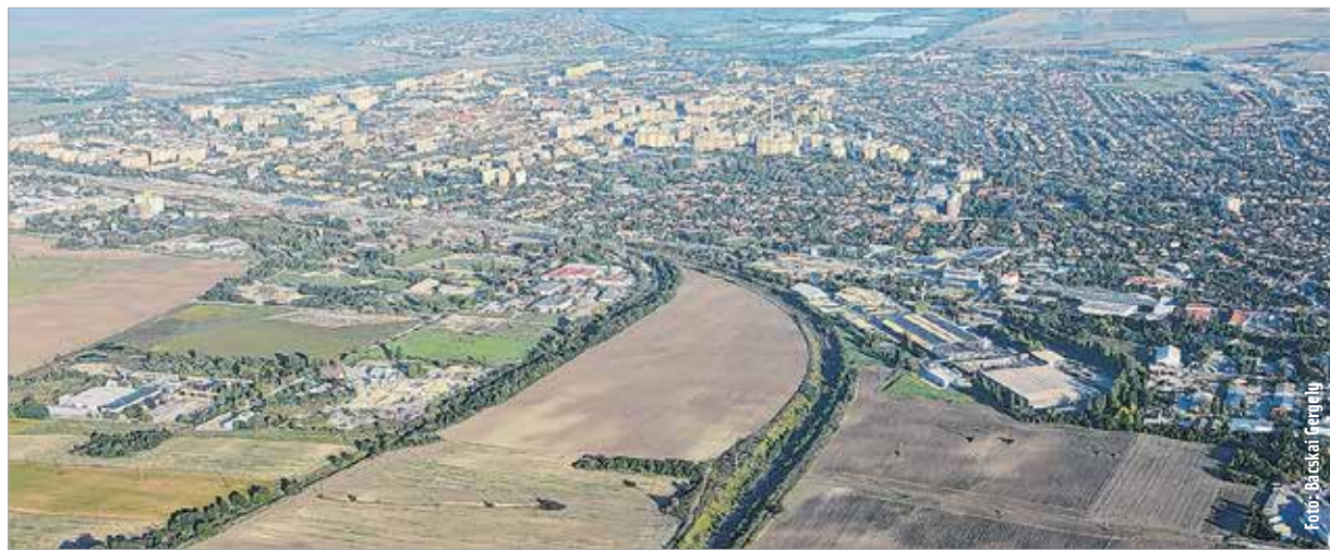
A nyomvonal kijelölése után megindulhatnak a tervezési és az engedélyeztetési eljárások

A terhelt gyűjtőúthálózatot kiváltó összekötőút építése várhatóan 2019-2020-ra fejeződhet be.