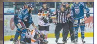
Nulláról indulva, de nem esélytelenül