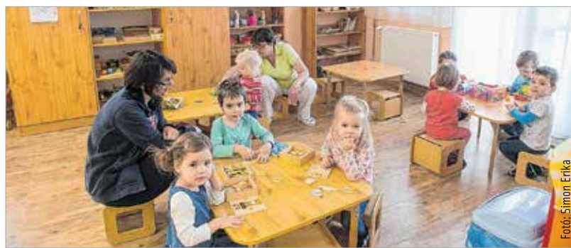
A felújítás komfortosabbá tette a mindennapokat

A Tulipános Óvoda és a 3. számú Bölcsőde régi, jól működő intézményei Székesfehérvárnak, mindkettő rászorult a komoly, komplex felújításra. Ez volt az első olyan beruházás, amit a város rendelkezésére álló, 2014 és 2020 között lehívható uniós forrásból valósítottak meg. A felújítás tehát fontos mérföldkő, hiszen a források felhasználása már a kivitelezési szakaszba jut több beruházás esetén is – hangsúlyozta a bejárómester Cser-Palkovics András. A polgármester hozzátette: a gyermekek biztonságos neveléséhez szükséges felújításokra és fejlesztésekre saját költségvetéséből valamint a pályázati lehetőségeket kihasználva továbbra is jelentős forrásokat fordít a város.