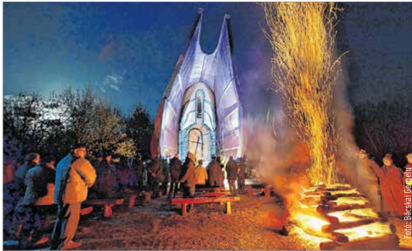
Emlékmű a feledés ellen