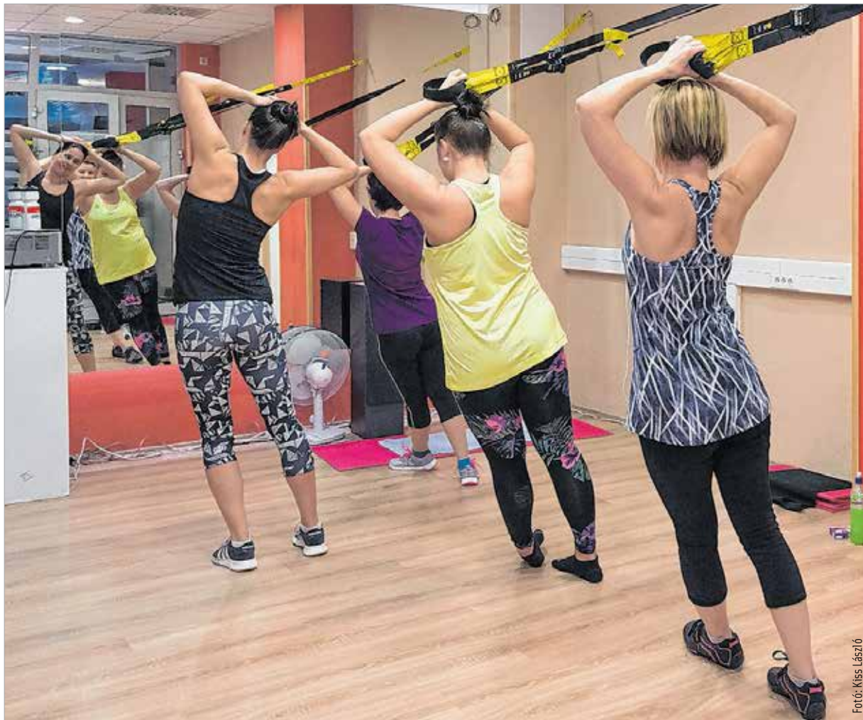
A trx az egyik leghatékonyabb edzésforma, itt ugyanis az ember a saját súlyát használja fel az izomépítéshez