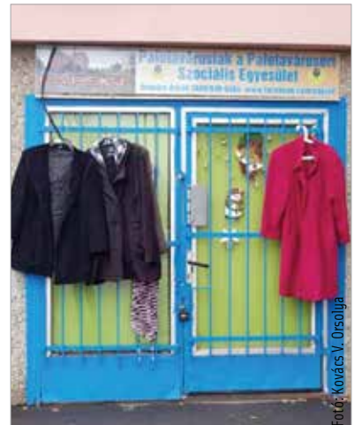
Elvihető kabátok a PAPSZE Egyesületnél