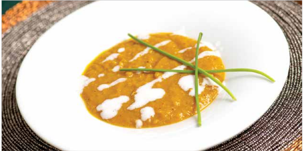
A vöröslencsét nem kell áztatni, könnyebben emészthető, és különleges újévi fogás készíthető belőle

A dahl (vagy dal, daal, esetleg dhal) egy sűrű indiai leves, mely rántás nélkül valamilyen hüvelyesből (például sárgaborsó, vörös lencse, csicseriborsó, kis szemű bab stb.) készül. Ezen kívül lehet bele rakni paradicsomot, zellert, sütőtököt, cukkinit, padlizsánt, de édesburgonyát és hagyományos krumplit is. Viszont hús sosincs benne. Indiában rizszel vagy naan-kenyérrel fogyasztják.