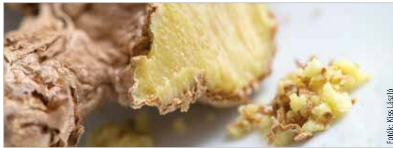
A gyömbérből karakteres lesz a dahl

(Ezeket a fűszereket ma már nem reménytelen fellelni a nagyobb fehérvári élelmiszer-áruházak „nemetközi” polcain, de ha biztosra akarunk menni, a Vámház körüti Ázsia boltig vagy más budapesti orientális élelmiszerüzletig kell utaznunk.) A befűszerezett alapanyagokat fedő alatt negyedórán keresztül