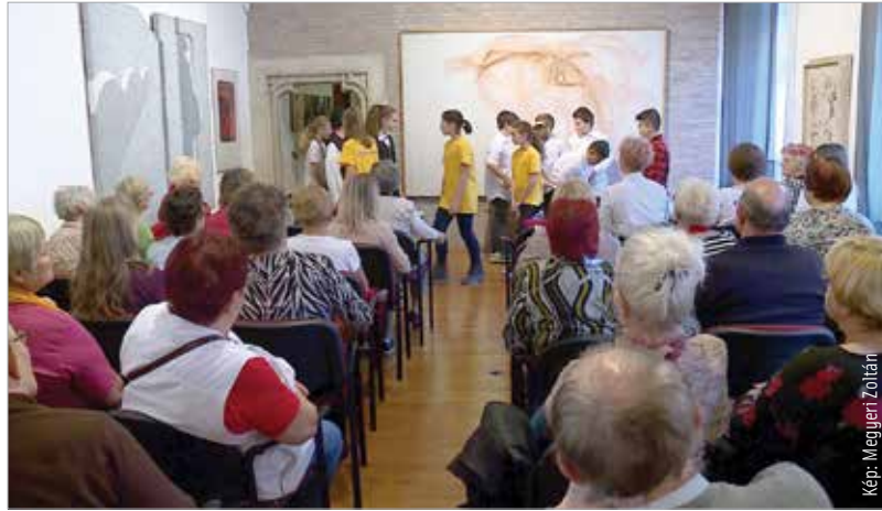
A hagyományokhoz hűen a Fehérvári Polgárok Egyesületének ünnepségén a Felsővárosi Általános Iskola diákjai adtak műsort

A Fehérvári Polgárok Egyesülete a hagyományokat tisztelve ebben az esztendőben is meghívta a székesfehérváriakat Szent Márton ünnepségére. A Szent István Múzeum Megyeház utcai épületében a város polgárainak apraja-nagyja megismerhette Szent Márton életét. „Tizenkét éve rendezzük meg a Márton-napokat, számunkra ez a hagyományörzés. Ilyenkor a családok, nagyszülők, szülők és gyermekek is szívesen látogatják rendezvényünket.