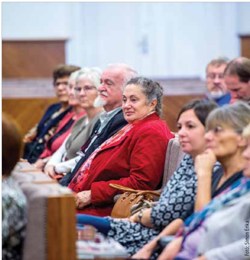
A szimpózium kiemelt célja volt, hogy Nagy László művészetét a hazai közönség számára is befogadhatóvá tegye

„Amikor a Szent István-emlékév alkalmából feljújtottuk ezt a csodálatos termet, az volt vele a célunk, hogy igazi közösségi tere legyen Fehérvárnak. Szimbolizálja és megjelenítse a város egészét. Ezért nagyon fontos – túl azon, hogy a város legfontosabb ügyei ebben a teremben dőlnek el – hogy széles körben használják ezt a termet, legyenek folyamatosan tudományos, kulturális és közösségi programok, melyek keretében mi magunk városként is fel tudjuk híni egy-egy terület fontosságára a figyelmet.” – hangsúlyozta köszöntőjében a Városháza Dísztermében Cser-Palkovics András, Székesfehérvár polgármestere, majd hozzátette: „Mindehhez az irodalmi élet különös mértékben és fontossággal tartozik hozzá, értékekről és arról szólva, hogy milyen világot képzelünk el a jövőben, és mit gondoltak erről elődeink.”