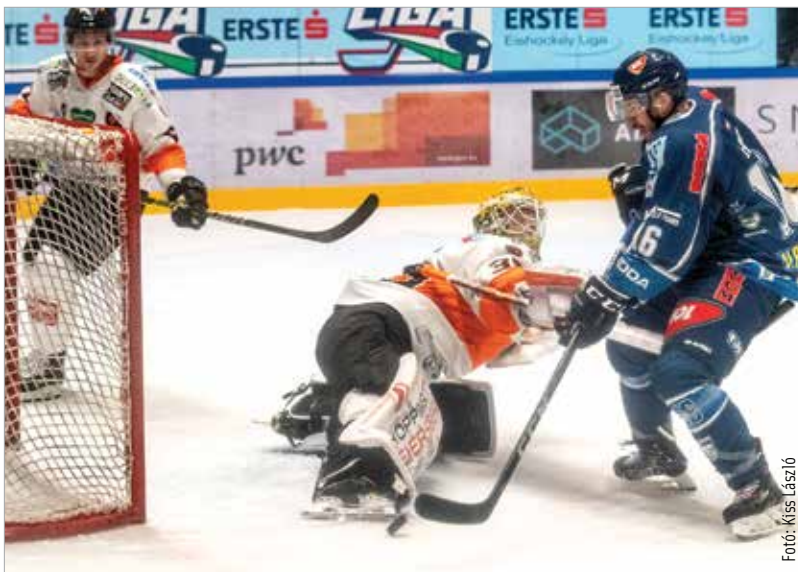
Gólparádét tartott a Fehérvár AV 19 a Graz ellen, de csak egy pontot csípett el itthon: az EBEL listavezetője 7-6-ra győzött a hosszabbításban

A lurkók a nagyok öltözőit is meglátogathatták abban a reményben, hogy egyszer majd saját szekrényük lesz a különleges helyiségben. A rendezvény karitatív célokat is szolgált, hiszen az Ifjabb Ocskay Gábor Jégkorong-akadémia felszerelésgyűjtést szervezett a Csíkszentimrei Sasok számára.