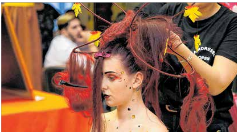
Az ős hajba komponálva