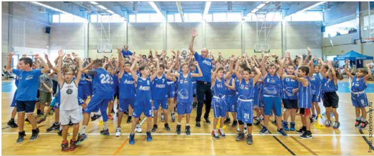
A gyerekek érdeke a legfontosabb

A Városházán jártak a Dávid Kornél Kosárlabda-akadémia Golden Triangle csoportjának képviselői, akik Fehérvár polgármesterével folytattak megbeszélést. Mindannyian egyetértettek abban, hogy a gyermekek elsődleges érdeke és a legfontosabb feladat az optimális edzés- és versenyzetési körülmények megteremtése.