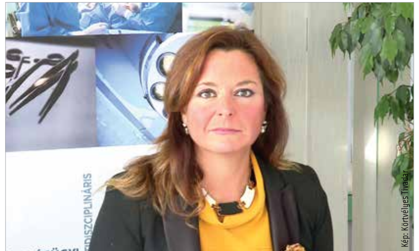
Vitályos Eszter európai uniós fejlesztéspolitikáért felelős államtitkár

Vitályos Eszter, az európai uniós fejlesztéspolitikáért felelős államtitkár szerint a fejlesztés nemcsak a betegek, hanem az orvosok helyzetét is könnyítheti. Csökken a pszichés nyomás, ami a betegre nehezedik azáltal, hogy nem otthoni körülmények között tud gyógyulni, hanem kórházban kell több időt töltenie. Nő a megbízhatóság, ami azt is jelenti, hogy kevesebb kórházban töltött idővel csökken annak a veszélye, hogy bármiféle kórházi fertőzést elkapjon a beteg – hangsúlyozta az államtitkár.