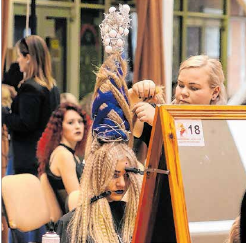
Még áll a torony

Az évszakok világa fantáziánévre keresztelt versenyszám ígérkezett a leglátványosabbnak. A kreatív kategóriában készülő frizurákra valóban azt lehet mondani, hogy hajköltemények lettek, akadt olyan is köztük, ahol két Chelsea-baba költözött a