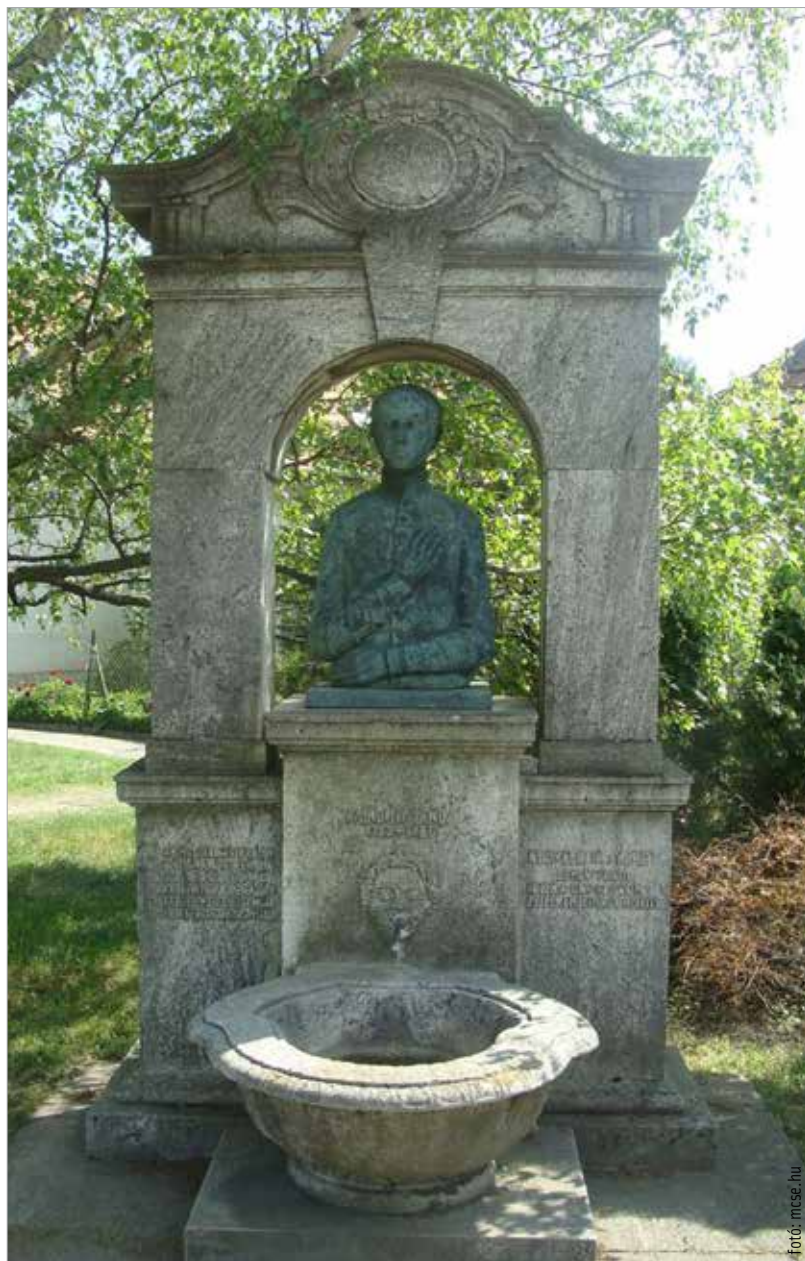
Sajnovics János, az összehasonlító nyelvészet egyik megalapozója