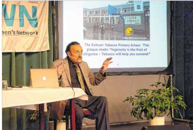
Zimbardo professzor nevéhez fűződik a híres stanfordi börtönkísérlet

Az azóta számos kritikával illetett kísérletről a professzor előadásában elmondta, hogy