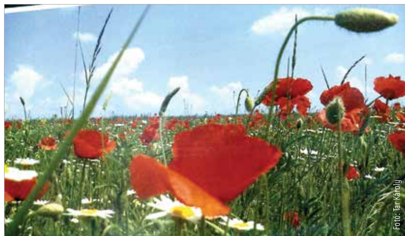
A végtelen rónákon a pipacstenger őrzi a hősök emlékét