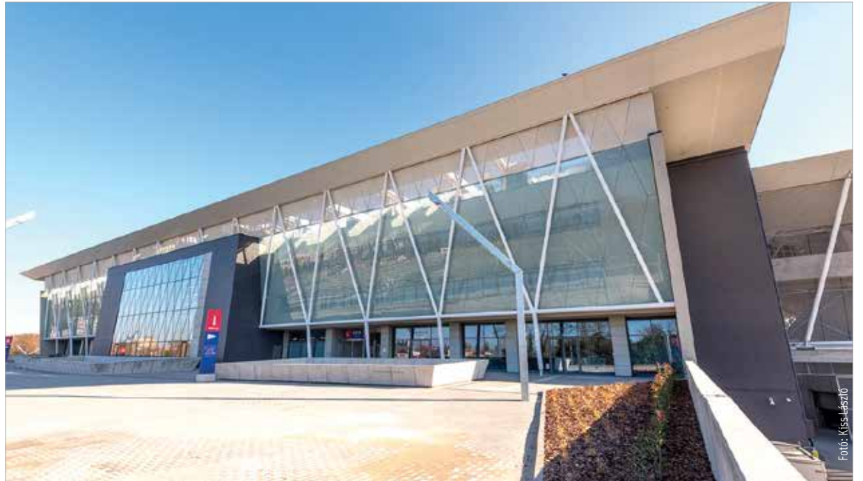
A parkolóból egyenesen a főbejárathoz vezet az út

A Sóstói Stadion centerpályájának főpróbáján a felvidéki DAC, a Puskás Akadémia és a Vidi U15-ös csapatainak részvételével rendeztek kedden minitornát. A