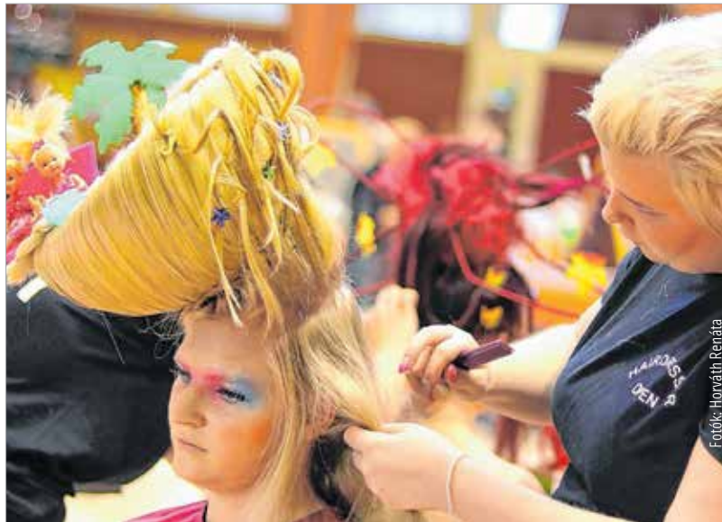
Lazulnak Barbie kistesói, a Chelsea-k

Persze azokat a frizurákat senki nem fogja egy álmos hétköznap reggelen, karikás szemekkel pár perc alatt a tükör előtt összedobni, amiket a Hairdresser Open 2018-on készítettek a fodrászstanulók. A nemzetközi fodrászverseny leglátványosabb része ugyanis nem az utca divatját, hanem az haute couture-t helyezte előtérbe – vagyis