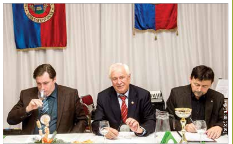
A zsűri ezúttal is megtalálta a legméltóbb nedűt Szent Márton napjára

8000 SZÉKESFEHÉRVÁR, BALATONI ÚT 10. ☎ +36 30 758 3136 WWW.JANCSARKERT.HU INFO@JANCSARKERT.HU FACEBOOK.COM/JANCSARKERT