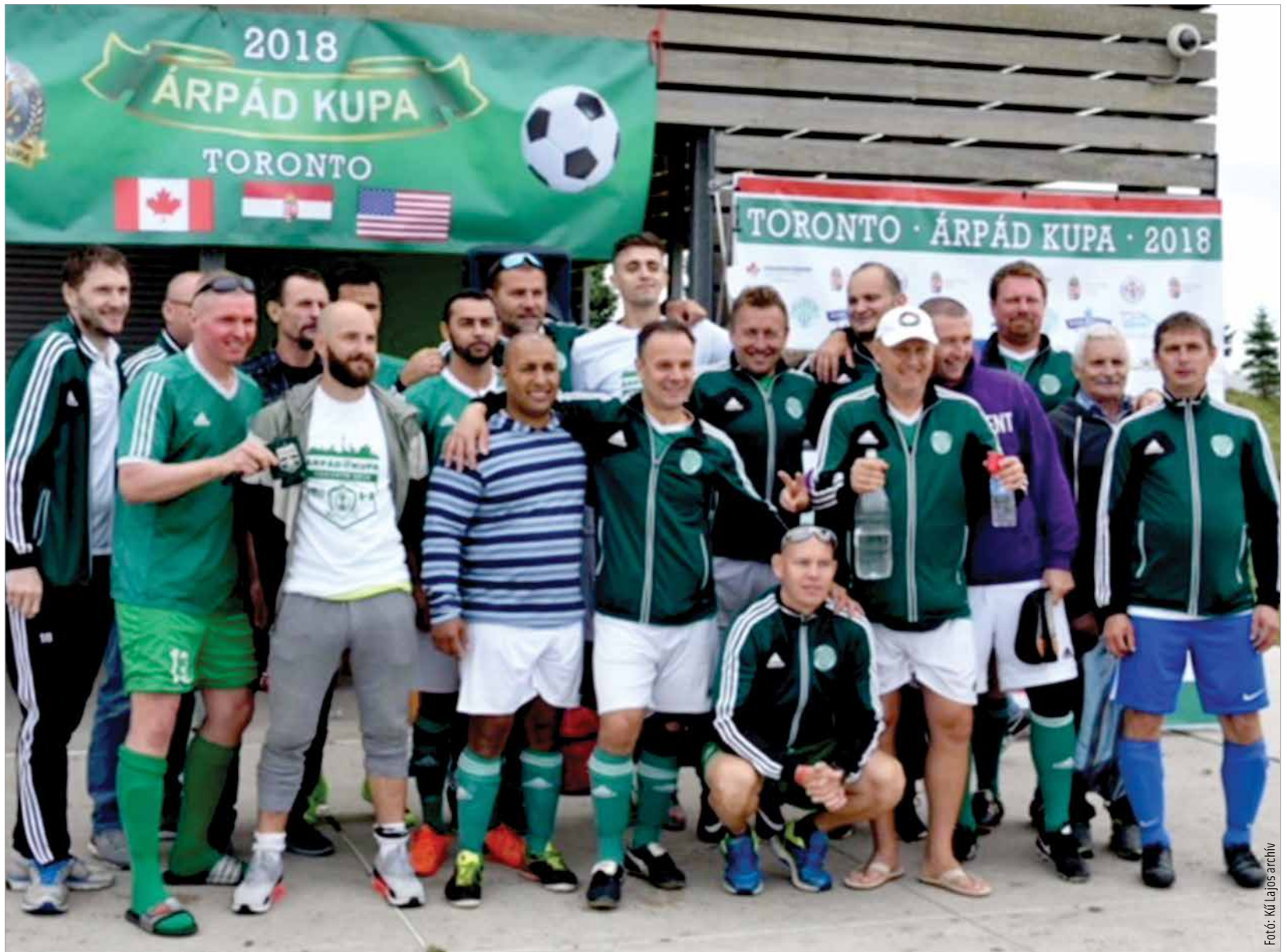
Együtt a torontói csapatok

Talán még most is tapsolnak. Az idei turnét egy Niagara melletti kisvárosban kezdtük, ahol rengeteg magyar él. Csodálatos pillanatok voltak, hiszen elvitük azokat a filmeket, amelyek a legnagyobb győzelmeiket őrzik, az angliai 6:3-at, az itthoni 7:1-et, a 8-3-as mérkőzés felvételét a