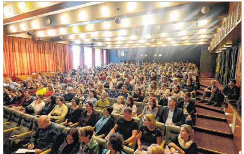
A terem teljesen megtelt

újsághirdetés útján keresett résztvevőket, végül a hetvenöt jelentkezőből huszonnégy főt választottak ki személyiségteszttekkel – olyanokat, akik mentálisan a legegészségesebbek voltak. Őket két csoportra osztották: fogvatartottakra és börtönőrökre. Az eredetileg kéthetesre tervezett kísérletet a hatodik napon be kellett fejezni, mert a résztvevők túlzottan valóságosnak élték meg a kísérletben kapott státuszukat: a börtönőrök kegyetlenkedni kezdtek, a rabok pedig fellázdáltak és többen idegösszeroppanást kaptak. A professzor, aki hosszú évtizedeken keresztül kutatta a gonosz természetét, hangot adott annak a meggyőződésének is, hogy a gonoszság elsősorban hatal-