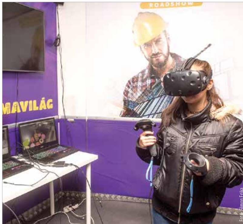
Virtuális szemüveg segített eligazodni a szakmák világában

Az eseményt, mely lassan húsz éve minden esztendőben megrendezésre kerül városunkban, a Fejér Megyei Kormányhivatal szervezte. Már a megnyitón több száz fiatal tolongott tanáraival, szüleivel, hogy megismerhesék a régió képzési, szakmai lehetőségeit. A pályaválasztási kiállításon a közel száz standon az érdeklődők átfogó ismereteket szerezhettek az egyes szakmákról – elsősorban a megyében működő szakközép- és szakis-