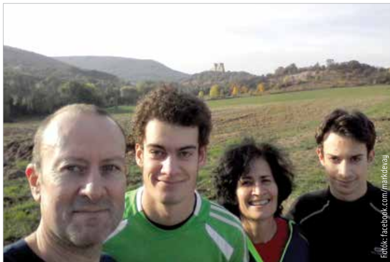
Igazi sportos, összetartó család a Dévay

Valahol a legjobb eredmények között! Miután tavaly kilencedik lettem a sorozatban, ez nagy előrelépés! Főleg úgy, hogy a pontszámok tekintetében legértékesebb versenyek is nagyon jól sikerültek, köztük a glasgow-i Európa-bajnokság vagy a sprint Eb. És persze a nagydöntőn, Madeirán is nagyon jól ment, volt egy jó ki szökés kerékpáron, így pedig előnnyel tudtunk kimenni futni. Végül negyedik lettem, az Európa-kupát pedig megnyertem! Azért mentem, hogy megnyerjem az összetettet, a mezőny pedig elég erős volt, mert ott volt többek között egy belga srác, aki már volt olimpián hatodik is. Így pedig különösen értékes ez a győzelem!