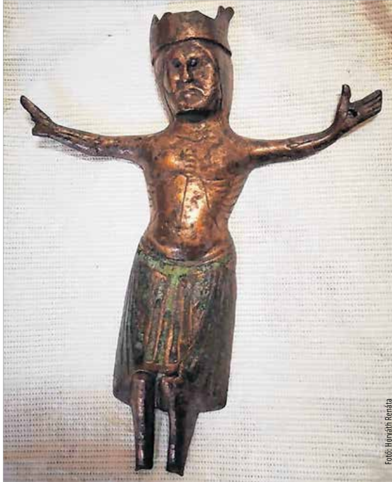
A korpusz minden bizonnyal egy dél-franciaországi ötvösműhelyből származik

A székesegyház kormányzati forrásból külsőleg már megújulhatott. A belső megújulás megkezdésével pedig létrejöhett a Csók István Képtárban a Barokk mennyország kiállítás és