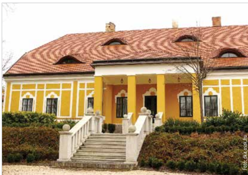
A rácalmási kúria, a Jankovichok egykori otthona