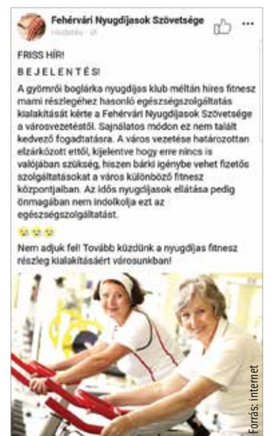
gei ügyében, így a megkeresésre való választól elzárkózni sem tudtak, sem határozottan, sem határozatlanul...