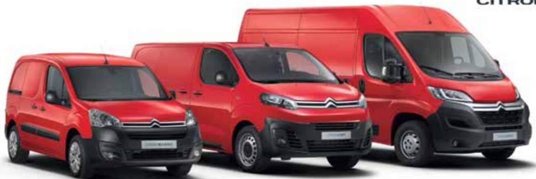
CITROËN BERLINGO FURGON