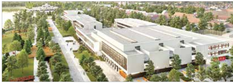
Így néz majd ki a középiskolai campus környéke

A Csónakázó-tó mellett a Szabadságharcos út és a Sár utca között 4,7 hektáron, harmincöt ezer négyzetméternyi hasznos területen valósul meg a beruházás. Négy intézmény – a Vasvári Pál Gimnázium, a Kodolányi János Gimnázium és Szakgimnázium, a Tóparti Gimnázium és Művészeti Szakgimnázium valamint a második ütem keretében a Hermann László Zeneművészeti Szakgimnázium és Alapfokú Művészeti Iskola – összesen több mint két és félezer diákjának biztosítja majd a tanulás lehetőségét egy 21. századi épületegyüttesben a beruházás. A lakossági fórumon elhangzott, hogy többféle szempontból vizsgálták az érintett területet, forgalomszámlá-