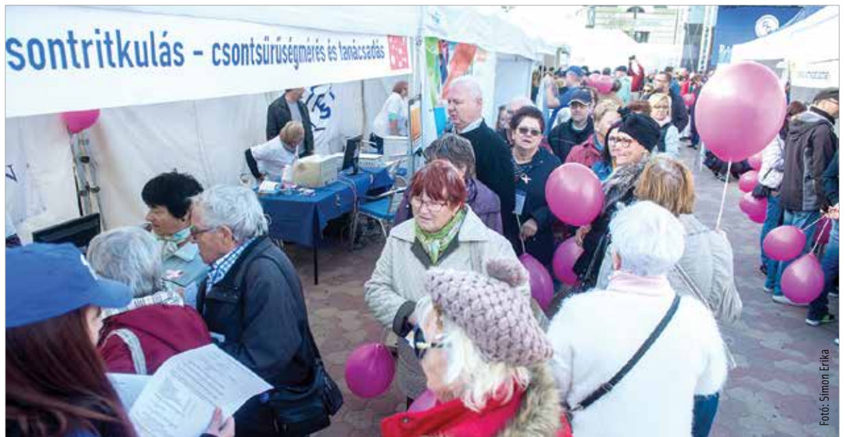
Több százan vettek részt a szűréseken

Idén is több százan vettek részt a rózsaszín lufis felvonuláson. A séta a Palotai kapu térre vezetett, és idén első alkalommal összefonódott a Richter egészségnap programjával. Az Alba Plaza előtt számos vizsgálat, tanácsadás és színpadi produkciók várták a fehérváriakat. Azok, akik részt vettek az ingyenes szűréseken, adománypontokat gyűjthettek, ezzel pedig egy jótékony ügy mellé is álltak.