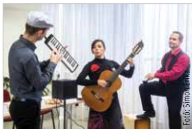
A Melodika Project három tagja rendhagyó hangszeres felállásban szólaltatja meg a jól ismert dallamokat

A Partitúra Ifjúsági Hangversenysorozat négy alkalommal, négy időpontban várja a fiatalokat az Alba Regia Szimfonikus Zenekarral. Elsőként október 8-án Rómeó és Júlia – ahogy Prokofjev látta címmel csendülnek fel a nagy orosz zeneszerző életművének talán legszebb dallamai, majd december 3-án népszerű válogatást hallhatunk Csajkovszkijtól Johann Straussig. 2019. február 5-én Változatok és fuga egy Purcell-témára címmel hallhatjuk Benjamin Britten remekművét, mely azzal a céllal született, hogy egy oktatófilm keretén belül mutassa be a gyerekeknek a zenekari hangsze-