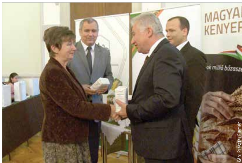
A Magyarok kenyere akció hozadéka, hogy a Gyermekvédelmi Központ is részesülhetett az összegyűjtött élelmiszer-adományokból

nyezettudatos, egészséges életmód segítése. A szakmai rendezvényen Jakab István, az Országgyűlés alelnöke megerősítette, hogy a kormány minden segítséget megad a helyi termékek népszerűsítéséhez: „A magyar mezőgazdaság egy olyan átalakulási folyamaton megy keresztül, ahol figyelembe kell vennünk az adottságainkat. Ebből kiindulva fontos számunkra az, hogy az emberekhez eljussanak a helyben előállított termékek, és minél kisebb legyen az ökológiai lábnyom. A cél, hogy a helyben megtermelt élelmiszer helyben kerüljön fogyasztásra!”