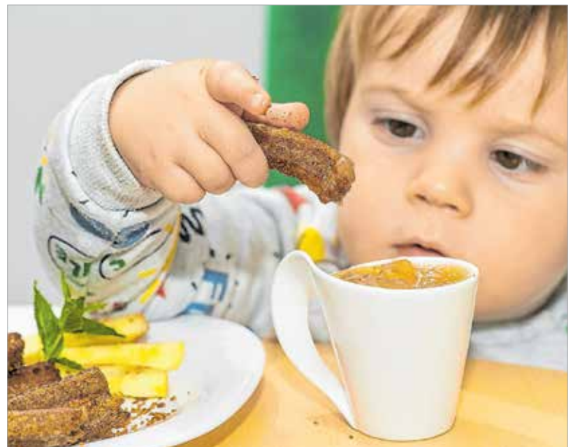
A fotózásra szánt adag pár perc alatt elfogyott...

megforgatjuk a fahéjas cukorban, és még melegen lekvárral vagy csokoládépudinggal tálaljuk.