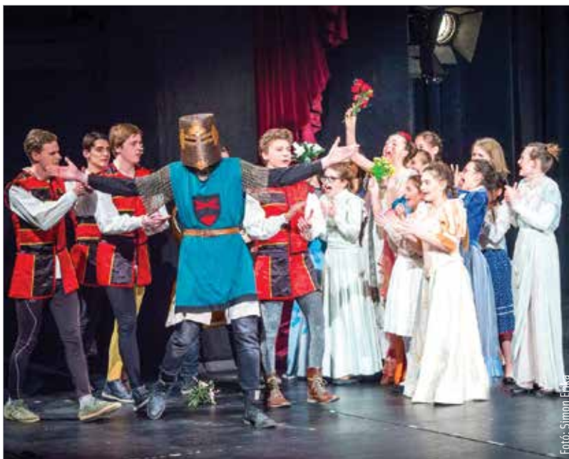
Tavaly összesen négyszáz diák szerepelt a Toldiban

A bojtárból tündérkirály program olyan népszerű lett az utóbbi