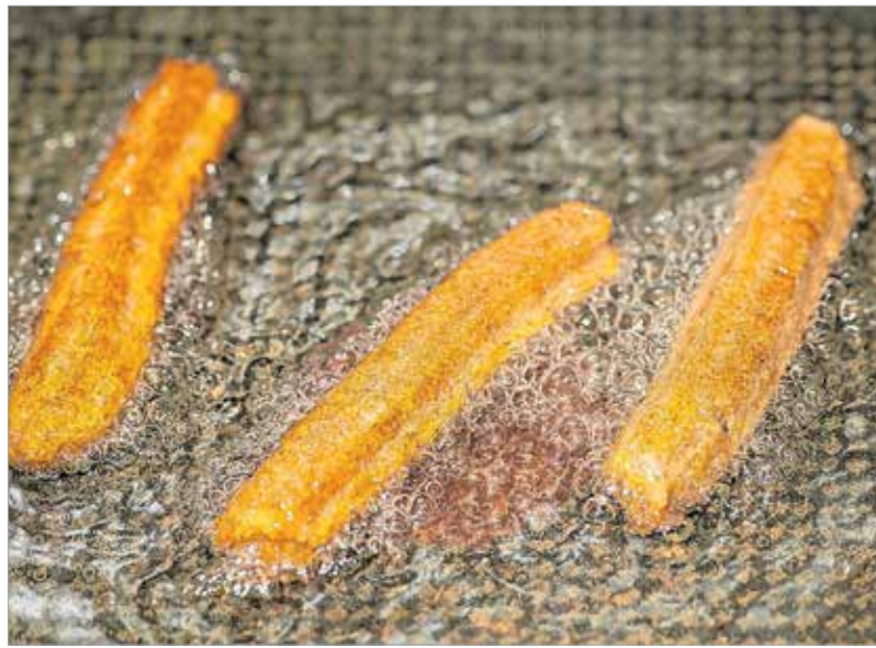
A churrost forró olívaolajban kell kisütni

Hogy az első churrost ki készítette, nem lehet tudni. A spanyolok szerint évszázadokkal ezelőtt a hegyekben legeltető pásztorok találták fel, akik a tűz fölött egyszerű kenyert akartak sütni. Hosszas próbálkozások és kudarcok során rájöttek, ha hosszúkas, csillagformájú tésztát készítenek, könnyebben átsül a belseje úgy, hogy a kérge ropogós marad. Mivel a kenyérke alakja hasonlított a birkák szarvára, ezért az általuk legeltetett churra fajtájú birkáról churrosnak nevezték el.