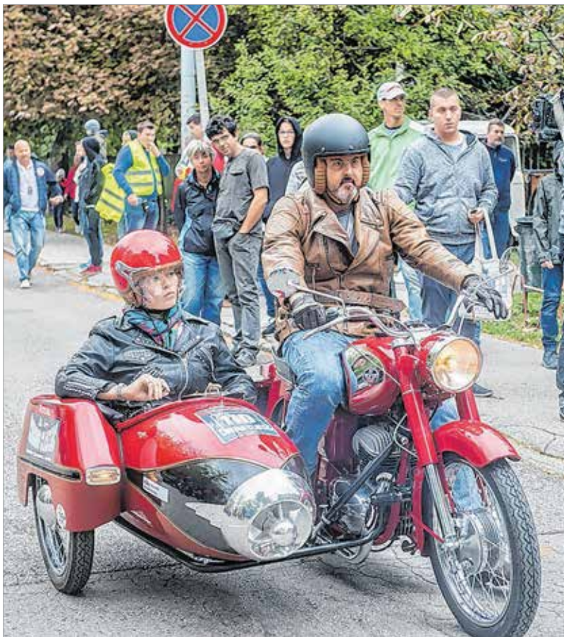
Egy ilyen oldalkocsis motor nemcsak szép, de romantikus is