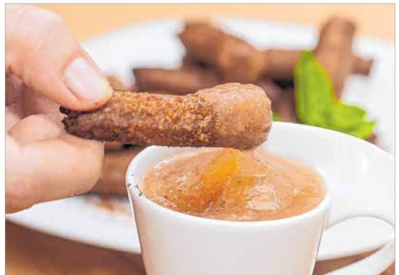
A churros és a baracklekvár remekül illik egymáshoz

Egy nyeles fazékban felforraltuk a vízben a vajat, a cukrot és a sót. Egy főzőkanállal sűrűn keverjük,