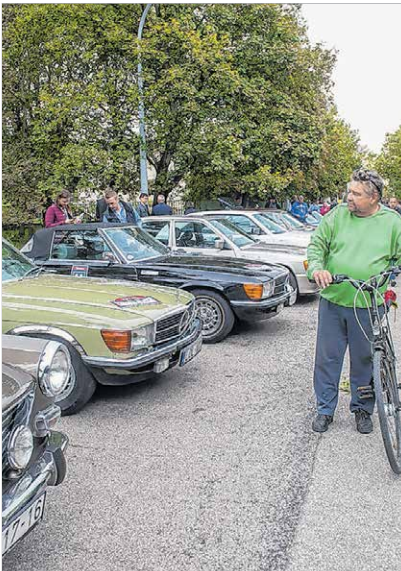
A mezőnyben feltűntek amerikai, olasz, angol, francia és német járműcsodák is

A Total Chrono Classic túraverseny az Oldtimer Szuperkupa, Magyarország legnagyobb veterán-autós túraverseny-sorozatának egyik utolsó futama, ahol a gyönyörűen restaurált és műszakilag kiváló állapotban lévő autók nemcsak kiállítászerűen láthatók, hanem működés közben is megcsodálhatók voltak. Idén is Székesfehérvárról rajtolt el a mezőny. A Csónakázó-tótól mintegy száz veteránautó és különleges youngtimer indult neki a klasszikus verseny Balatonlelleiig tartó távjának.