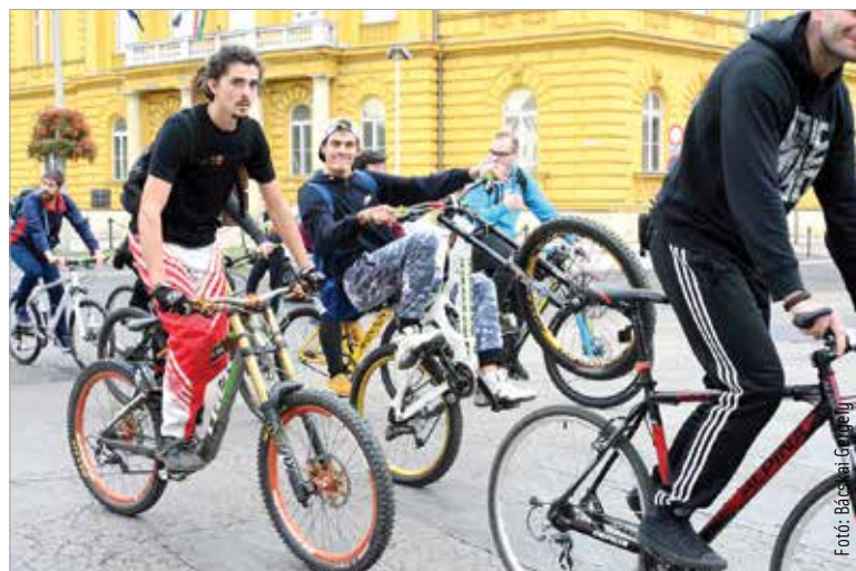
Az európai mobilitási hét keretében megrendezett Critical mass kerékpáros felvonulás a Haleszből indult szombaton délután. A legtöbben kerékpárral, de voltak, akik rollerrel, görkorcsolyával, tandemmel „demonstráltak”. A szervezők legfontosabb célja az autósok figyelmének felkeltése és a balesetek csökkentése volt.