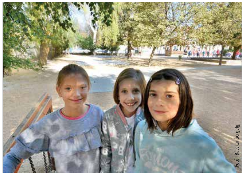
Fotó: Bácskai Gergely

Szeptemberben biztonságos, esztétikus udvar fogadta a gyerekeket a Munkácsyban. Széleskörű összefogással újították fel az általános iskola alsós udvarát. Kiépült az iskola hátsó udvarának csapadékvíz-elvezető rendszere, a fák alatt vastag, szintkiegyenlítő zúzottkő ágyazatot építettek és járdákkal összekötött, térköves játszószigeteket alakítottak ki, továbbá új kosárlabdapalánkokat szereltek fel. A felújítást több cég és magánszemély illetve a Székesfehérvári Tankerületi Központ is jelentős összeggel támogatta. Forrás: ÖKK