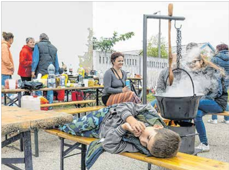
Ki mondta, hogy csak ebéd után lehet szundítani?

tartja, hogy a maroshegyiek egyre inkább magukénak érzik a szüreti mulatságot, s egy olyan közösségi esemény résztvevői lehetnek, amely valóban mindenkié: „Ez a fesztivál olyan tradícióval bír, ami évek óta megmozgatja a helyi közs-