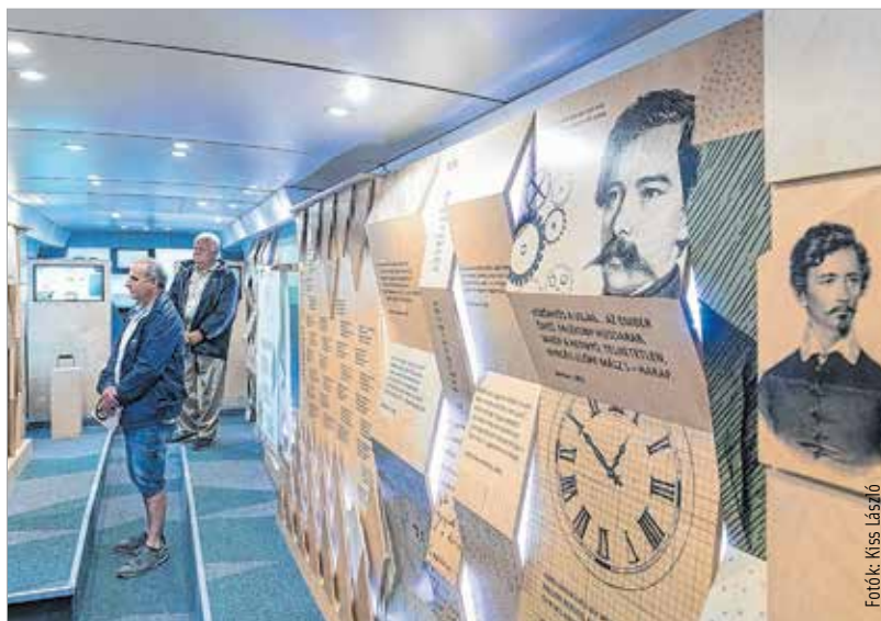
A Gárdonyi Géza Művelődési Házban kiállítás várta a látogatókat

Idén tizenegyedik alkalommal rendezték meg a Maroshegyi Böndörödőt. A Gárdonyi Géza Művelődési Ház munkatársainak szervezésében ez évben is színes, látványos programok várták a városrész polgárait és valamennyi fehérvárit. Brajer Éva, Maroshegy önkormányzati képviselője, Székesfehérvár alpolgármestere büszke arra, hogy őszi rendezvényük ma már egyre vonzóbb városi közösségi program: „Tizenegy éve böndörödünk Maroshegyen. Nem mondom, hogy ez az őszi nem várható volna még egyetlen napig, de ettől