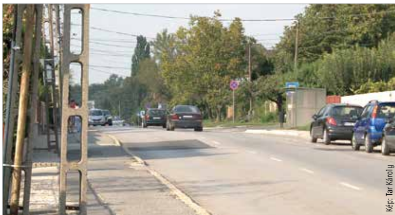
A Fiskális út teljes keresztmetszetét érintő rekonstrukció kezdődik október elsején