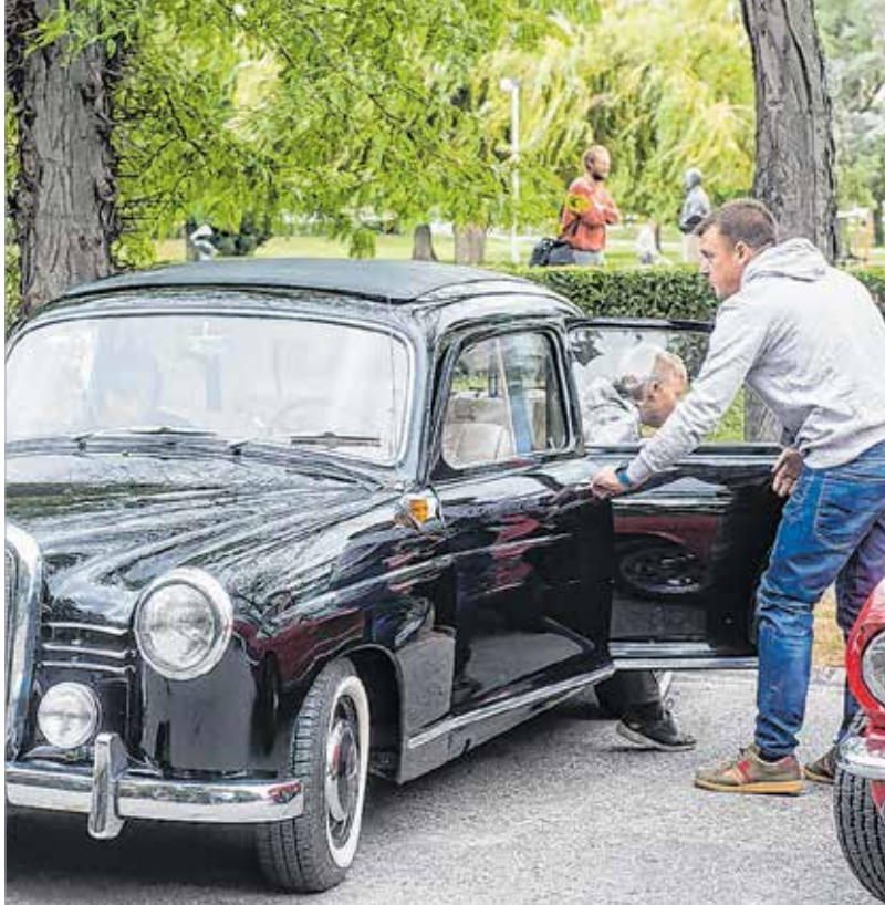
Kívül is, belül is meg lehetett nézni, milyen járgányokkal utaztak a múlt század első felében