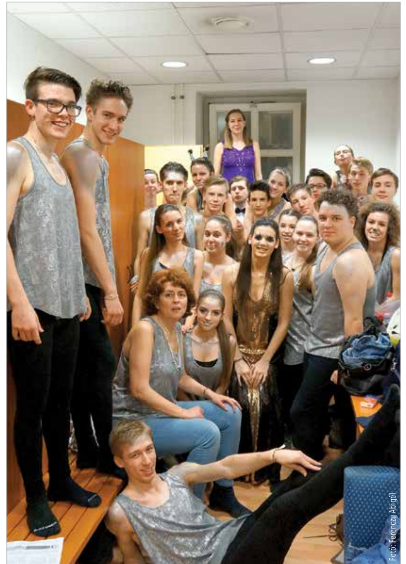
Ciszterecsek a kulisszák mögött

A többiek mindent beleadtak, hogy támogassák, a bikánkkal az élen, aki betanította a mozdulatokat. Másnap pedig a sápadt első Toldink jött szín-