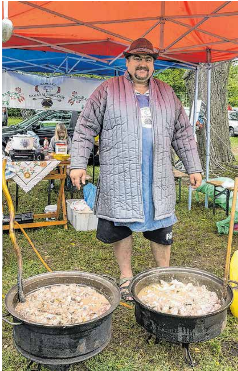
A Böndörödő egyik legnépszerűbb étele a karcagi birkapörkölt volt

seget. Úgy láttam, hogy máshonnan is érkeztek vendégek. Ez egy kiváló alkalom arra, hogy az emberek ismerkedjenek, barátságokat kössenek, jól érezzék magukat.