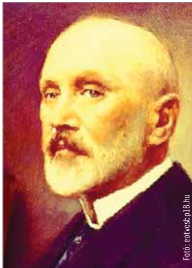
A negyvennyolcas forradalom évében született Eötvös Loránd Heidelbergben doktorált, tizenhat évig volt a Magyar Tudományos Akadémia elnöke, és Wekerle második kormányában vallás- és közoktatásügyi miniszteri posztot töltött be. Nevét ma is őrzi Magyarország egyik legnagyobb egyeteme.

nádor engedélyével. 1828-ban bekövetkező halála után az új birtokosok – Eötvös Ignác és Eötvös Dénes – kevésbé jól szervezett uradalma erősen a robotra épült, melynek a jobbágyfelszabadítás vetett véget. Lilien bárónak köszönhetően Erzsiből terjedt el Fejér megyében az okszerű, modern gazdálkodás. A halála után a szétzilálódtott ercsi birtokot 1845-ben báró Sina György Simon vásárolta meg és virágoztatta fel ismét. Fia 1859-ben Erzsiben szervezte meg az ország első ekeversenyét, mely valóságos nemzeti ünnepellé vált. Sina így adózott elődjé emlékének. Eötvös József politikus, jeles író és költő életének fő műve fia, Eötvös Loránd Ágoston. 1848-ban, a forradalom évének nyarán született meg a budai Svábhegyen. Az újszülött az Ágoston utónevét keresztapja, Trefort Ágoston után kapta. Apját Ercsihez ekkorra már csak az emlékek kötötték. A kivételes tehetségű Lilien báró kivételes tehetségű dédunokája a természettudományok bűvkörébe került, ezért a megkezdett jogi tanulmányok alól apja felmentette. A heidelbergi egyetemen akkoriban három világhírű tudós tanított. Két hallgató diplomázott egyidőben summa cum laude eredménnyel, mindkettő magyar: Eötvös Lóránd fizikus és König Gyula győri illetőségű matematikus. Eötvös itthon beiratkozott a bölcsészkarra, hogy az egyetemi katedrára magántanári képesítést szerezzen. Jedlik Ányos nyugalomba vonulása után készen állt a kísérleti fizikai tanszék vezetésére.