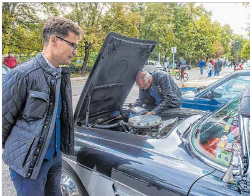
Egy ilyen autónak a motorja külön esztétikai élmény