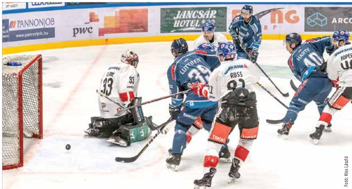
A Klagenfurt és az Innsbruck ellen is győzött a Fehérvár, hasonlóan sikeres hétvégében bíznak Sofronék

ránk, messze is utazunk. Az egyik gárda nagyon jó formában van, a másik pedig bizonyítani akar. Ezzel együtt azt gondolom, hogy ha azt játszunk, amit eddig, akkor nem lesz gond!”