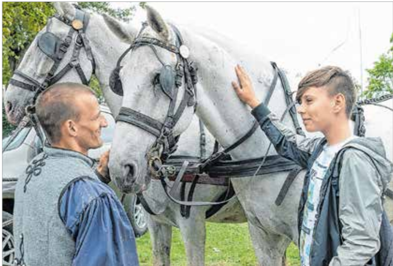
Ezen a napon lehetőség nyílt a barátkozásra is

A szép hagyomány folytatói, a városrész és a város apraja-nagyja a kora őszi időben élvezhette az együttlét örömeit, és nem hagyták otthon a jókedvet sem. A böndörödni vágyóknak a számtalan program mellett attól sem kellett tartaniuk, hogy éhen maradnak.