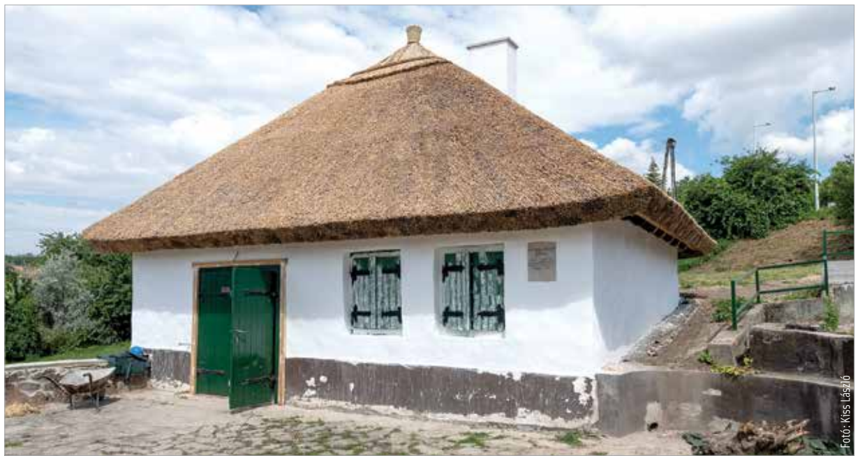
A Bence-hegyen lévő családi pincét Vörösmarty apjának halála után nem sokkal elárverezték

belőle. A szabadságharc leverése után Baracskán nyújtanak felé segítő kezet, nem hagyják, hogy szükségét szenvedjen. Az Üllői úti Bártfay-szalonn rendszeres látogatói a reformkori írók, költők, politikusok: Vörösmarty, Kisfaludy Károly, Bajza, Deák. Bajzával szerkesztette az Athenaeumot, kilenc társával alapította meg a Kisfaludy Társaságot, haldoklása idején is Kisfaludy lába nyomát kereste. Annak a pesti háznak az emeletére költözött, ahol Kisfaludy Károly fejezte be életét. Halála után pedig Deák Ferenc lett Vörösmarty gyermeke-