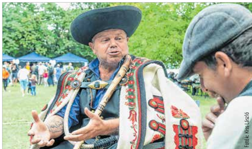
A juhászok is remekül érezték magukat