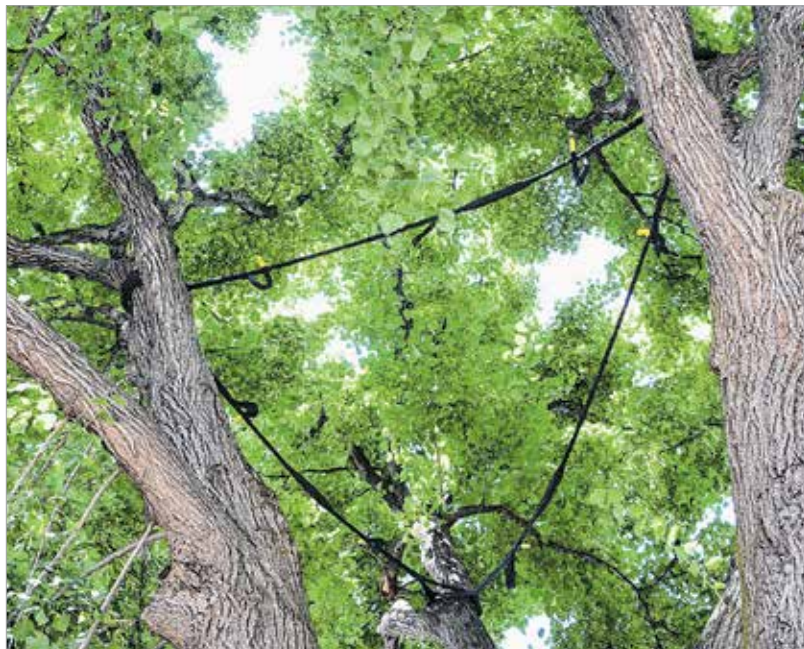
A Késmárki utcában az új játszótér mellett különleges megoldással tették újra biztonságossá a hatalmas hársfát: hevederekkel kötötték össze a fa három nagy ágát

A közterületi fakivágás engedélyköteles, jegyzői engedély kell hozzá, amit nekünk is meg kell kérnünk minden esetben, és a hatóság bírálja el, hogy indokoltnak tartják vagy sem. Mi abban az esetben szoktunk fát kivágni, ha kiszáradt és elpusztult illetve ha balesetveszély áll fenn: a fa hasadt, korhadt. Amikor társasházaknál kivágást kérnek – most már gallyazásnál is alkalmazzuk – minden esetben a közös képviselőnek kell a lakók többségének beleegyezését kérni, hogy a feladatot elvégezzük. Elég sok kellemetlenség volt belőle, hogy mondjuk az első emeleti lakó kérte a gallyazást, mert neki nagyon árnyékos így a szobája, a fölötté lakó pedig pont azt szeretne volna, hogy maradjon úgy a fa, és amikor a munkának nekiálltunk, akkor derült ki, hogy az utóbbi nem ért egyet vele. Emiatt találtuk ki, hogy minden esetben kérünk aláírási listát a lakóktól, így el tudjuk dönteni, hogy a kért beavatkozás a többség igénye-e. Természetesen ez balesetveszélyes helyzetnél nem így van, hiszen az emberélet a legfontosabb!