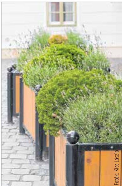
Néhány bokor levendula is feldobja a kövek szürkeségét

Az égető napsütéstől nemcsak a virágok kókadoztak. Üldögélő emberrel csak a parkokban vagy a Fő