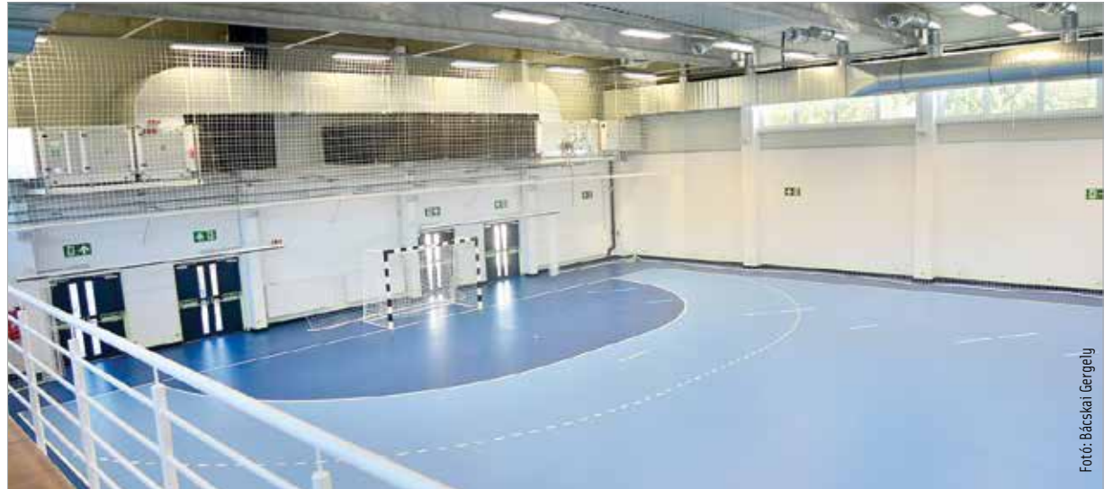
Az ezer négyzetméteres tornateremben helyet kapott egy szabvány méretű kézilabdapálya és egy több mint kétszáz fő befogadására alkalmas lelátó is