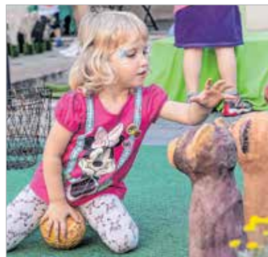
Na, megvan az összes?