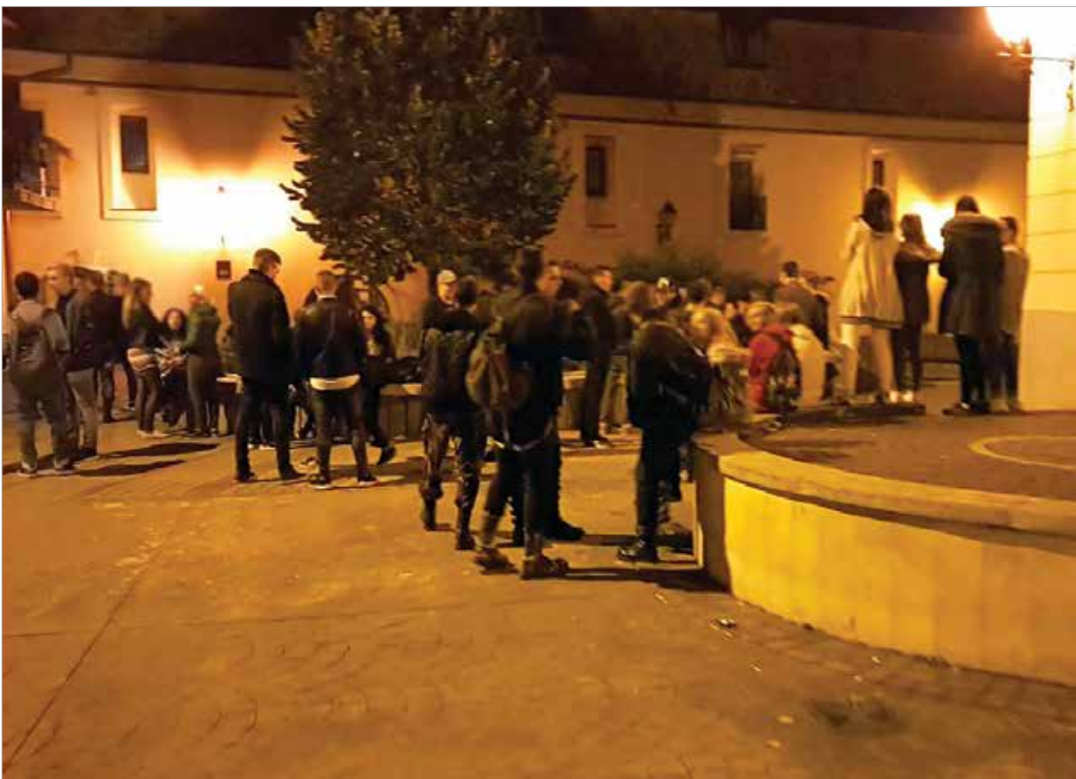
Pillanatképek a Kossuth-udvar éjszakáiból

próbaalvásra!” – tette hozzá a Kossuth-udvarban lakó egyik asszony. A Kossuth-udvarban lévő lépcsősor is megér egy misét. Egy itt lakó hölgy szerint nappal a tizenévesek hangoskodnak, amit még el lehet viselni, de az éjszakai dorbézolást már kevésbé. Mivel a lépcső végén lévő körkiülő eldugottabb, ezért azok, akinek erre néz az ablaka, gyakran túlzottan intim pillanatoknak lehetnek fül- és szemtanúi. Az életre kelt városnak tehát az árnyoldala is megmutatkozik: az éjszakában a terek, padok más funkciót kapnak.