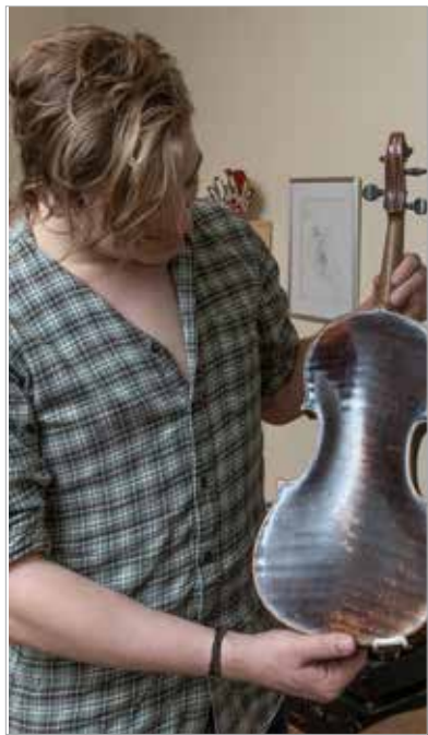
A dédnagyapja hegedűje

Nem éltem Fehérváron, de rengeteget voltam ott édesapámnál. Nagyon szívesen vittem oda mindenkit, barátnőmet, barátokat, mert mindig annyit tudott mesélni, hogy az egy egész könyvtárral felért. Annyi története volt és olyan egyedi világlátása, hogy a személyiségéből mindenki csak töltekezhetett.