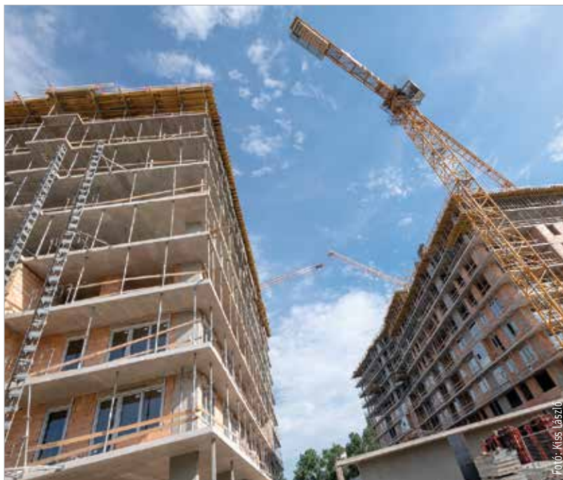
Fehérváron rengeteg új lakás épül, ezeknek átlagos négyzetméterára jelenleg négyszáztizennégyezer forint körül mozog, ami alig több, mint a budapesti árak fele

Kis túlzással Fehérvár az élre tört. De legalábbis felmászott a dobogó második fokára, már ami a vidéki új építésű lakások négyzetméterárát illeti. Az Otthon Centrum legutóbbi elemzése szerint ugyanis Sopron, Székesfehérvár és Kecskemét áll az első három helyen az átlagárakat tekintve. A megyeszékhelyek és megyei jogú városok újlakás-kínálatának átlagos négyzetméterára jelenleg 414 ezer forint körül mozog, ami alig több, mint a budapesti árak fele. Székesfehérvár a 450 ezer forintos négyzetméterárral valamivel az átlag fölött áll, ám a legdrágább jelenleg Sopron, ahol lassan, de biztosan kúszik a négyzetméterár 500 ezer forint felé. Székesfehérváron csak 2017 októberé óta nagyjából 3-3,5 százalékkal nőtt az új építésű lakások négyzetméterára, amivel viszont a középmezőnyben helyezkedik el városunk, hiszen például Kaposváron ugyanezen időszakban átlagosan 18 százalékot ugrottak