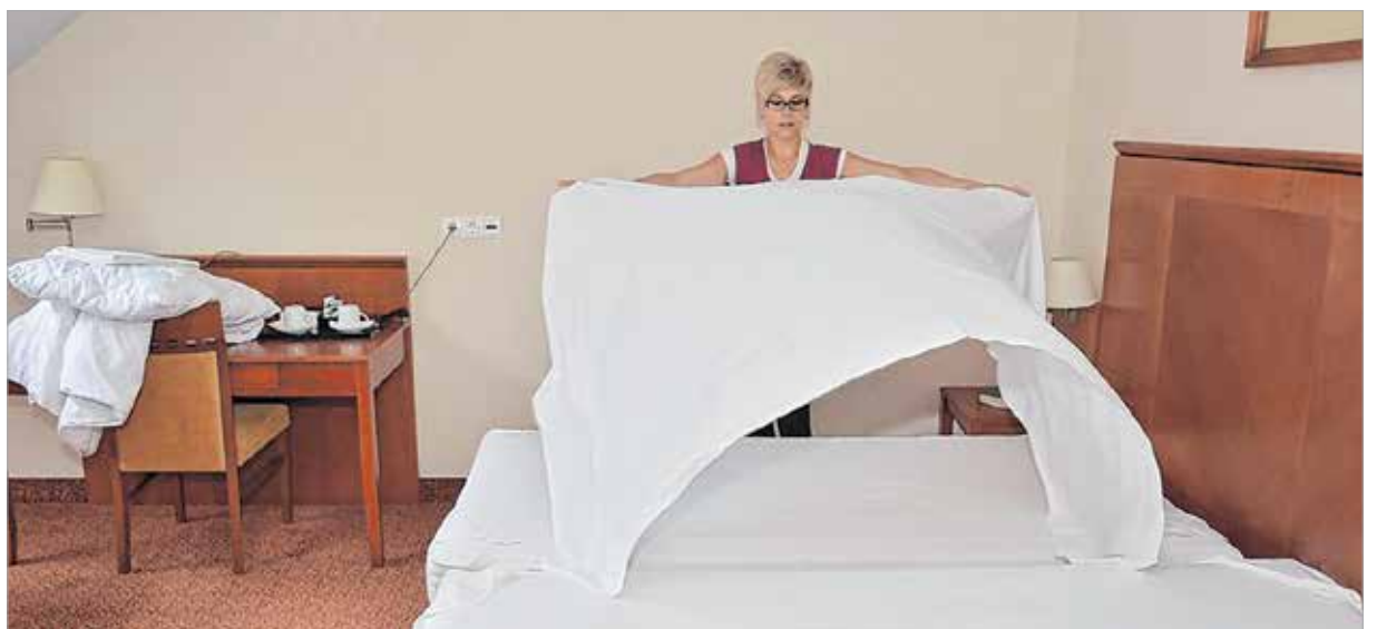
Minden mozdulatnak megvan a koreográfiája