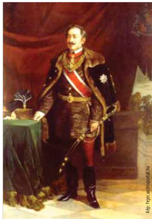
Pállik Béla: Szogyény-Marich László (1880)

A püspök azonban furcsállotta, hogy őt nem értesítették erről az ügyről. Azt sem értette, hogy művei miért csak most jutottak erre a sorsra, hiszen „A modern katolicizmus” című könyve már 1907-ben jelent meg, még pedig az esztergomi egyházmegye approbálásával. „Az intellektualizmus tulhajtásai” merőben filozófiai disszertáció, akadémiai székfoglaló. A dolgok és fogalmak bölcséleti meghatározása, anélkül, hogy bármilyen hitet érintene. A „Több békességet!”, pedig karácsonyi cikke volt az Egyházi Közlönynek.