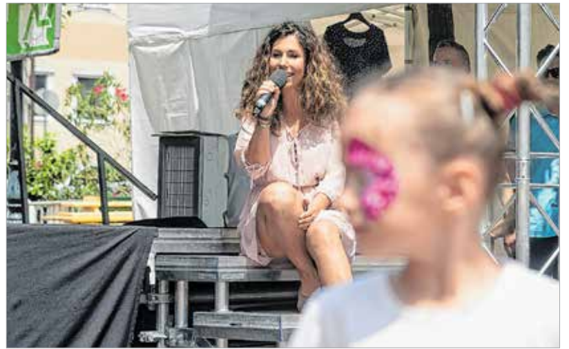
A Vörösmarty Színház művészei énekeltek és mesét mondtak a vendégeknek