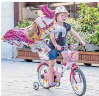
Még a csillámpóni is jól érezte magát!