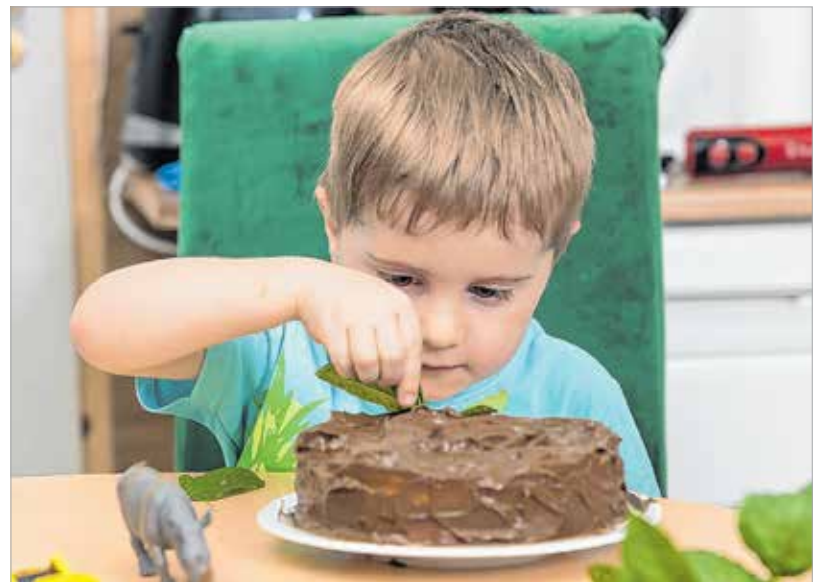
A dzsungelt a mentalevelek és a műanyag állatok imitálják

Amíg a tészta sül, a kimagozott meggyet leturmixoljuk a levével együtt. A meggy savanyúságától függően beletesszünk egy kis cukrot, majd félretesszük az egészet addig, amíg a tészta ki nem hűl. A kihűlt tésztát kettévágjuk. Ekkor elővesszük a meggykrémet, és csomó-