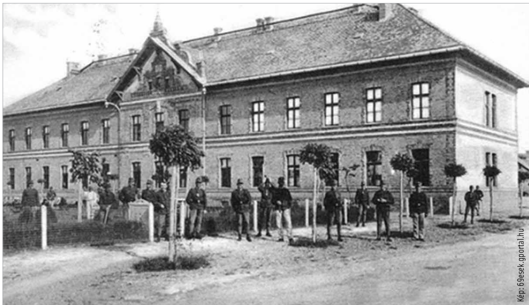
A 69. gyalogezred laktanyája