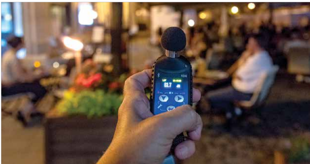
Hol kezdődik a hangos?

ten nem lehet alkoholt fogyasztani. Ha betartanánk a törvényeket, nem lenne itt semmi gond!” – mondja a Petőfi utcai asszony.