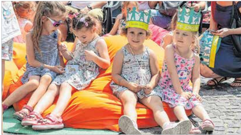
Az egy négyzetméterre jutó királynők száma meglehetősen magas