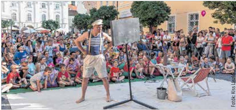
A Vaskakas Bábszínház, a Tintaló Társulás, a Bóbita Bábszínház és a Mesebolt Bábszínház előadásaira rengetegen voltak kíváncsiak

Ládasút, felhóvadászat, lovagi torna és mackókereső kalandok várták a gyerekeket a belvárosban május utolsó hétvégéjén a Hetedhét Játékfesztiválon. A bátrabbak igazi kincseket találhattak a régészhomokozóban, vagy ha éppen ahhoz volt kedvük, táncra is perdülhettek a színpad előtt.