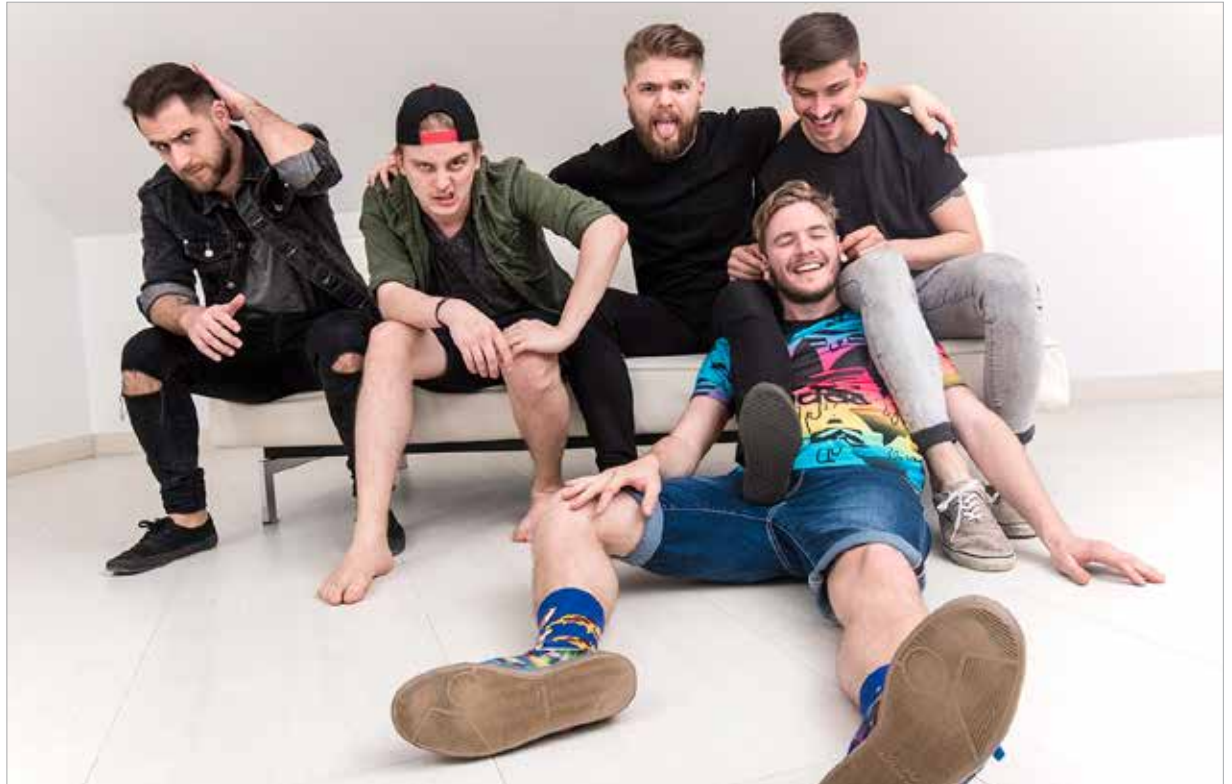
Az AWS zenekar

Most írjuk a következő nagylemeziünket, a srácok éppen a Balatonnál alkotják a dalokat. A cél, hogy szeptemberre kijöjjön az új lemez, ami a tervek szerint sokkal komplikáltabb és keményebb lesz. Nekem van még mellette egy pro-