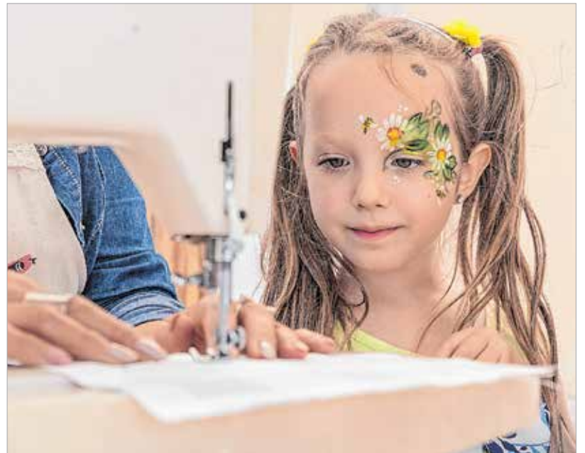
A kézműves foglalkozások elvarázsolták a kicsiket