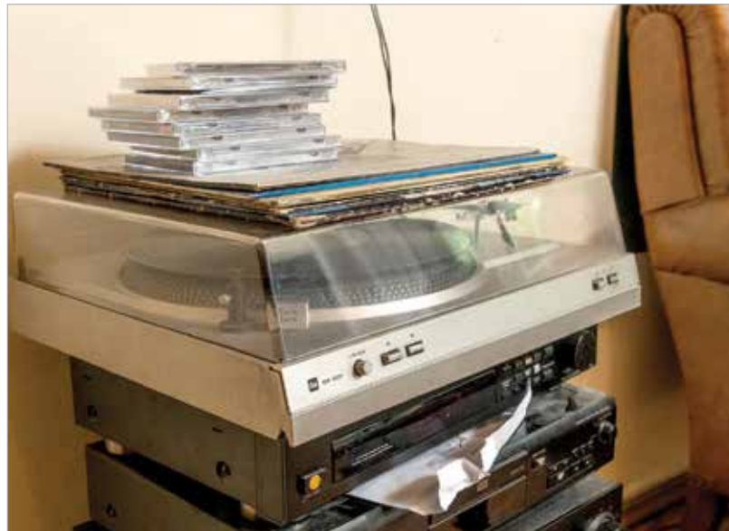
Zene minden formában

Nem gondoltuk, hogy minket ott ennyire szeretni fognak! Valószínűleg azért kedveltek ennyien, mert nem játszottuk meg magunkat, nem erőltettünk egy szerepet magunkra a színpadon. Soha életemben nem néztem korábban Eurovíziót, de pozitív családás volt, mennyire összehozza az embereket. A közönség, a fellépők, a szervezők mind nyitottak és kedvesek voltak. Jó érzéssel töltött el, hogy mindegy volt, ki milyen országból érkezett,