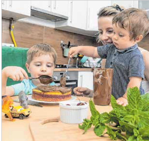
A gyerekeknek egy mezei tortasütés legalább akkora élmény, mint egy játszóház

Igaz, közben a konyha a feje tetejére áll: annyi liszt kerül a padlóra, hogy egy mini homokvárat lehetne belőle építeni, a mosatlan halmokban áll a pulton, és a végén (legalábbis nálunk) valahogy mindig előkerülnek a kisautók, amelyek ki akarják próbálni, milyen a sütőből éppen csak kivett tésztában driftni.